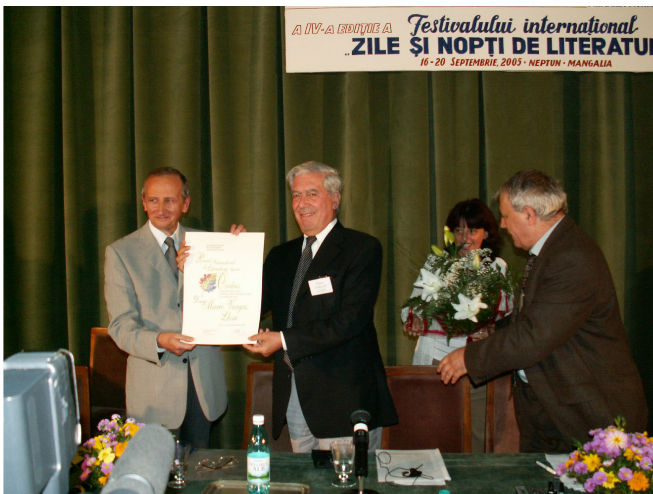
KONICA MINOLTA DIGITAL CAMERA

suntem obișnuiți cu așa ceva. Deși, pe la reuniunile alea din turism, cu potol moca s-au pozat cu ei, cu drag și spor. Ei, uite că evreii nu au mai venit, iar turcii ne-au trimis doar poze cu liderii noștri, din Mangalia, la paranghelii pe ritmuri de Tarkan. Să le fie de bine și la mai mare, dar noi tot cu buza umflată suntem. Din 40 și ceva de mii câți eram în Mangalia, am ajuns mai puțin de 35 de mii. Aia deștepți au plecat, deja.. Noi, aștia, mai creduli, care nadajduim într-un viitor mai bun, rămânem până la capăt.