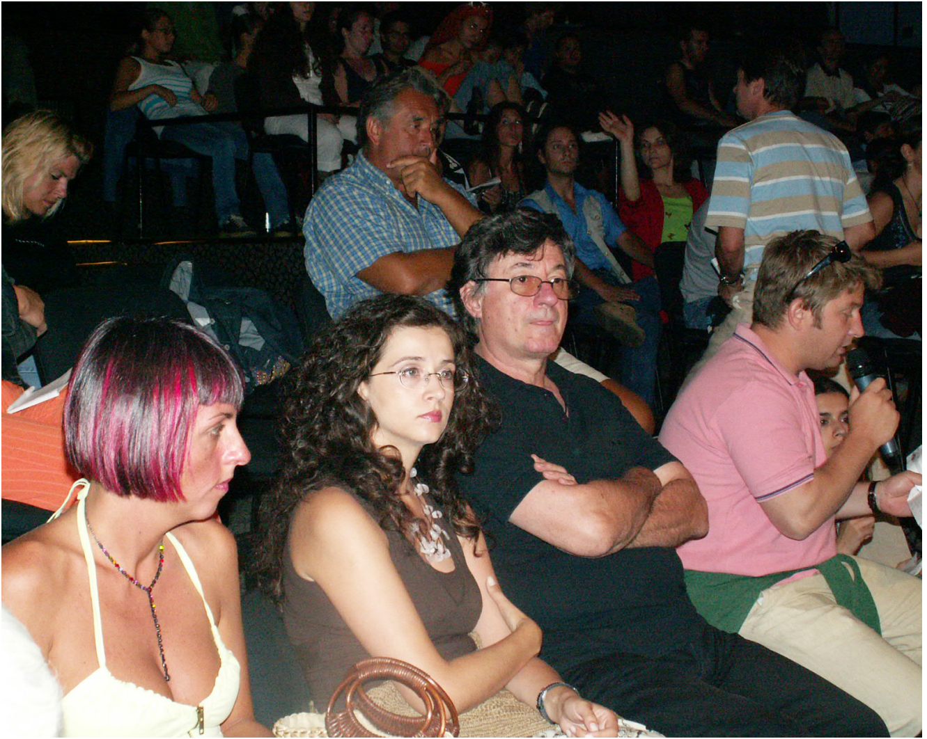
KONICA MINOLTA DIGITAL CAMERA