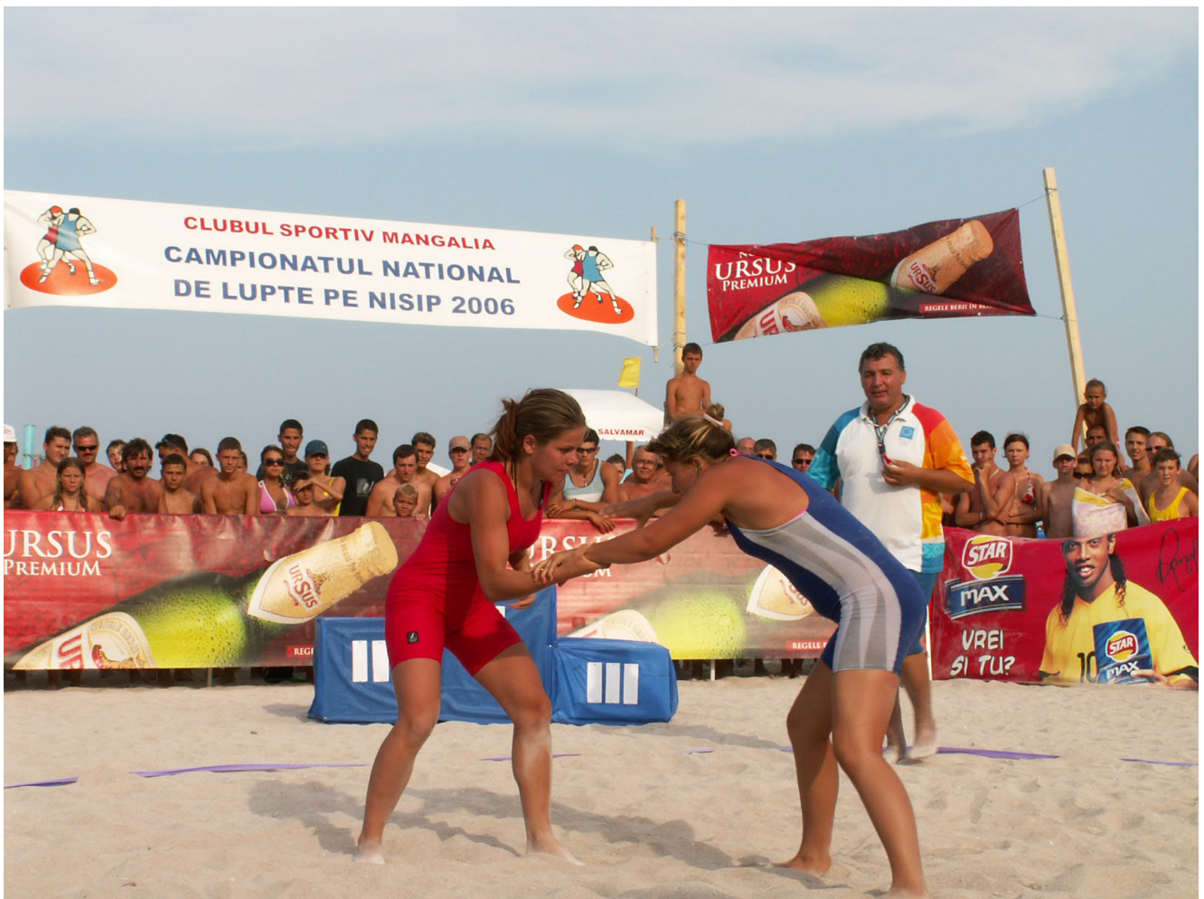
KONICA MINOLTA DIGITAL CAMERA