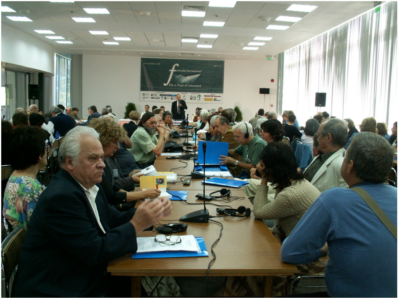
KONICA MINOLTA DIGITAL CAMERA