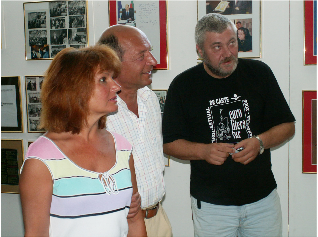
KONICA MINOLTA DIGITAL CAMERA