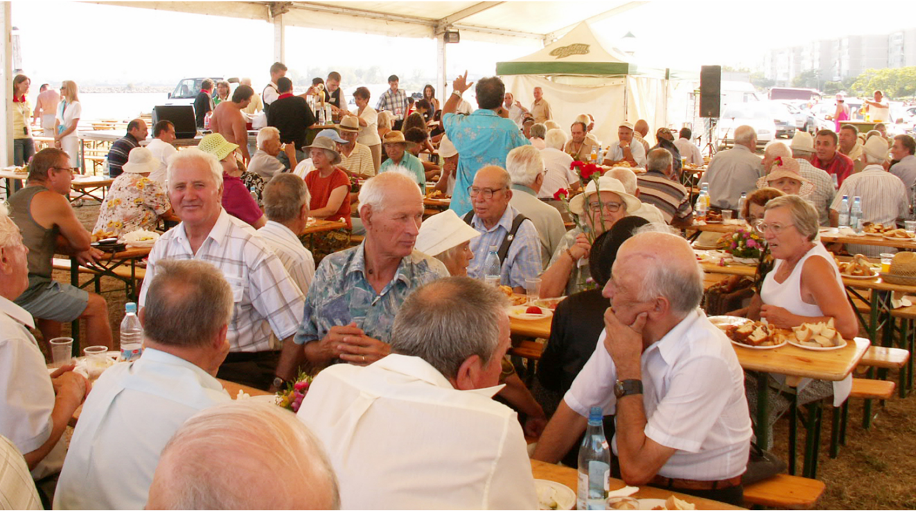
KONICA MINOLTA DIGITAL CAMERA