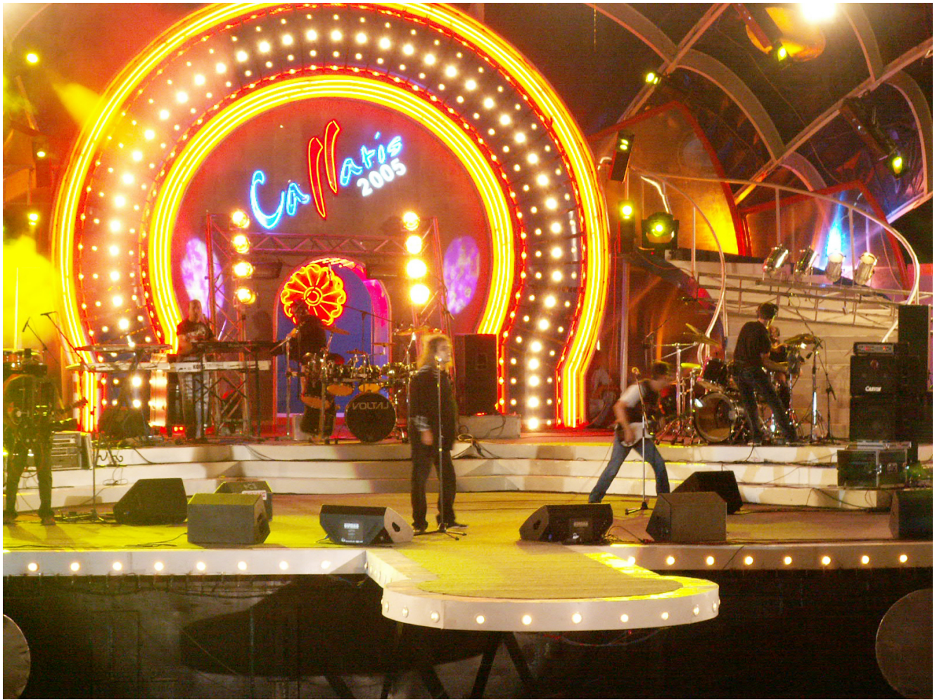
KONICA MINOLTA DIGITAL CAMERA