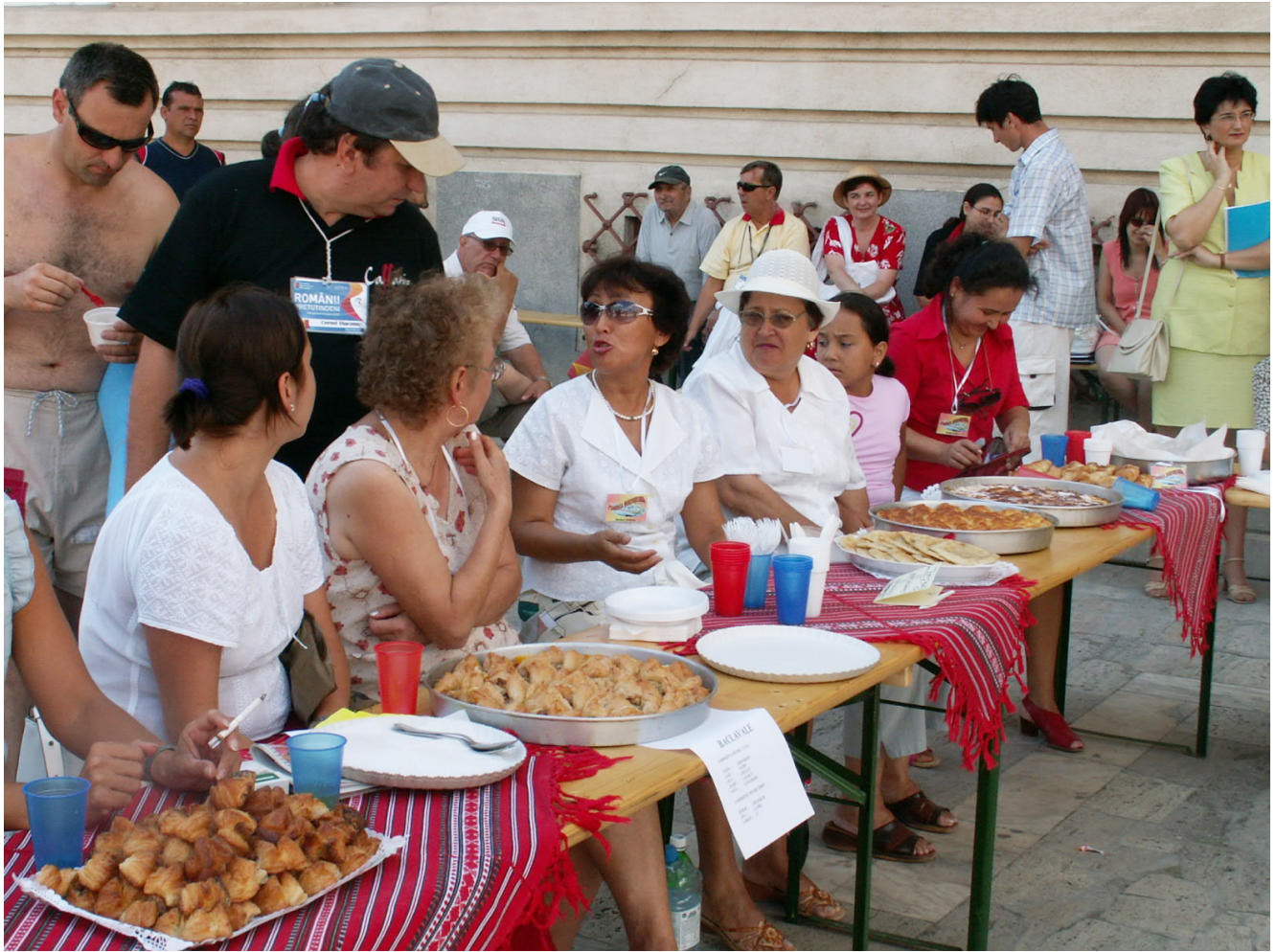
KONICA MINOLTA DIGITAL CAMERA