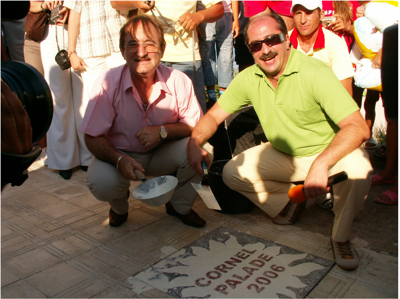
KONICA MINOLTA DIGITAL CAMERA