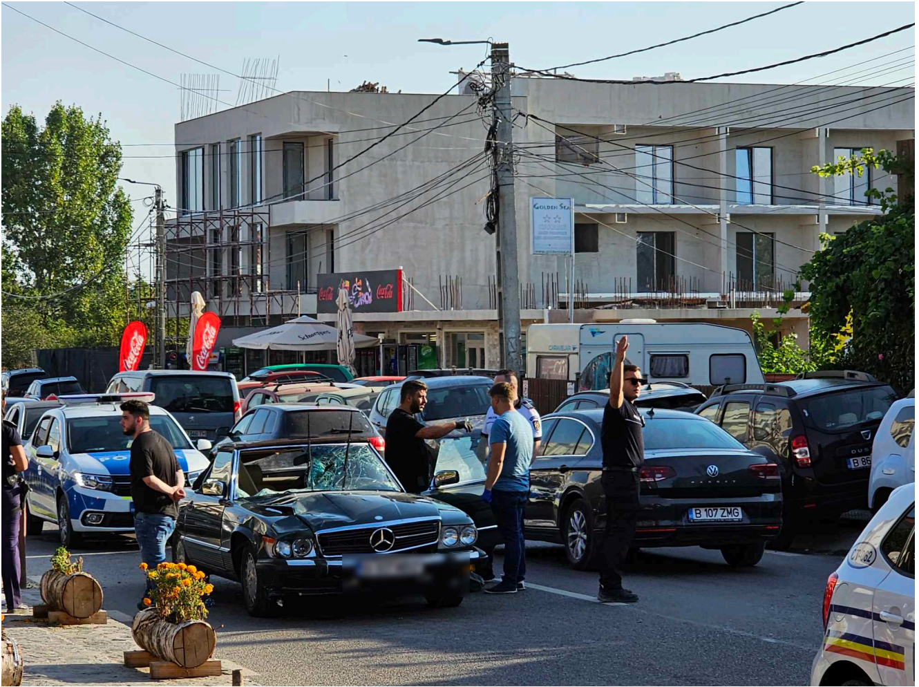
Accident 2 Mai Accident 2 Mai