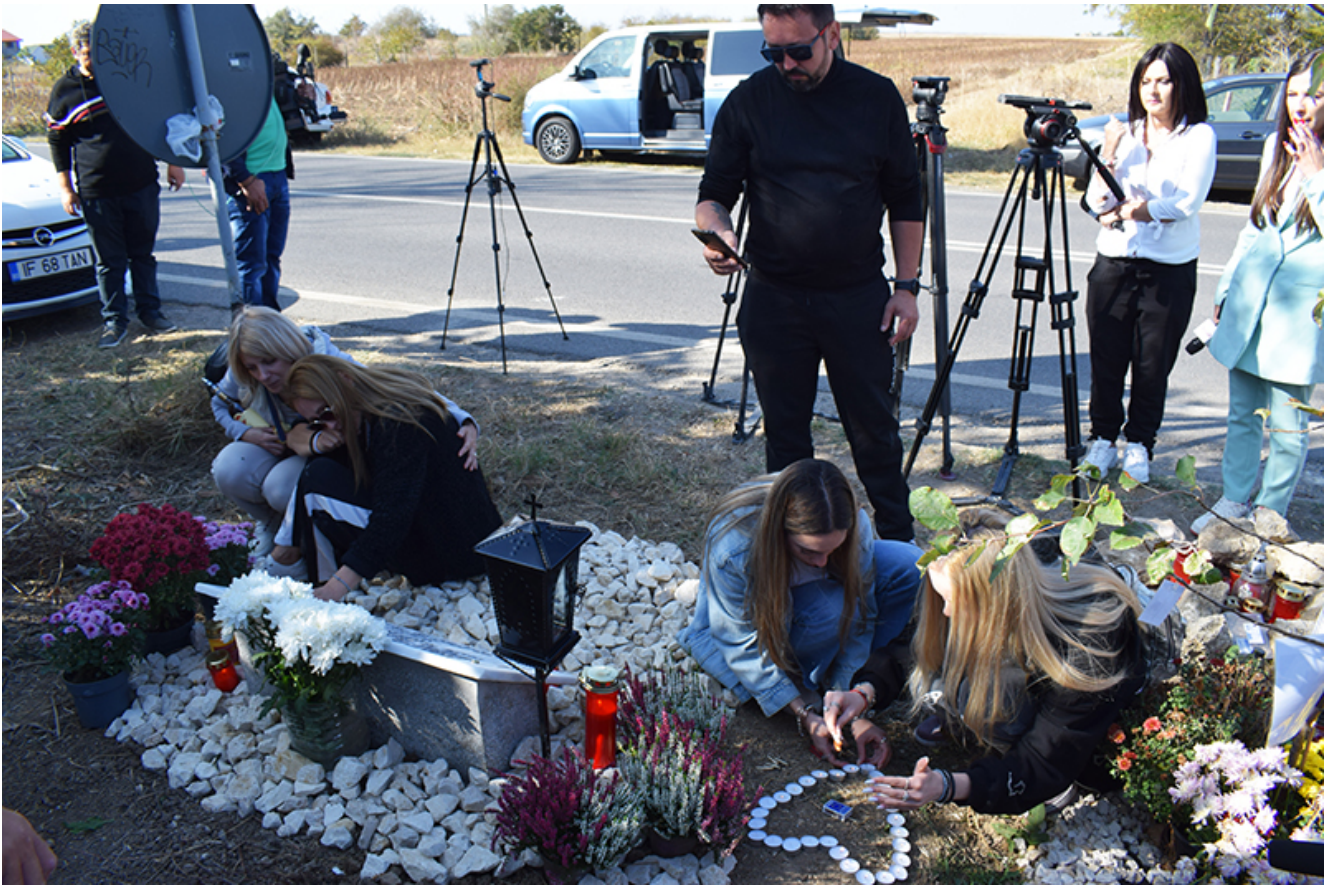
Placă comemorativă Sebi – 2 Mai