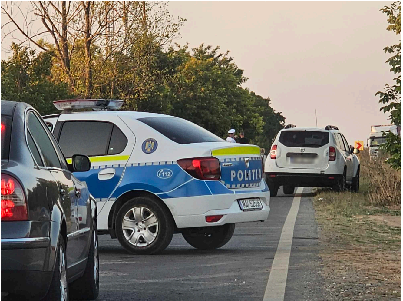
Accident 2 Mai