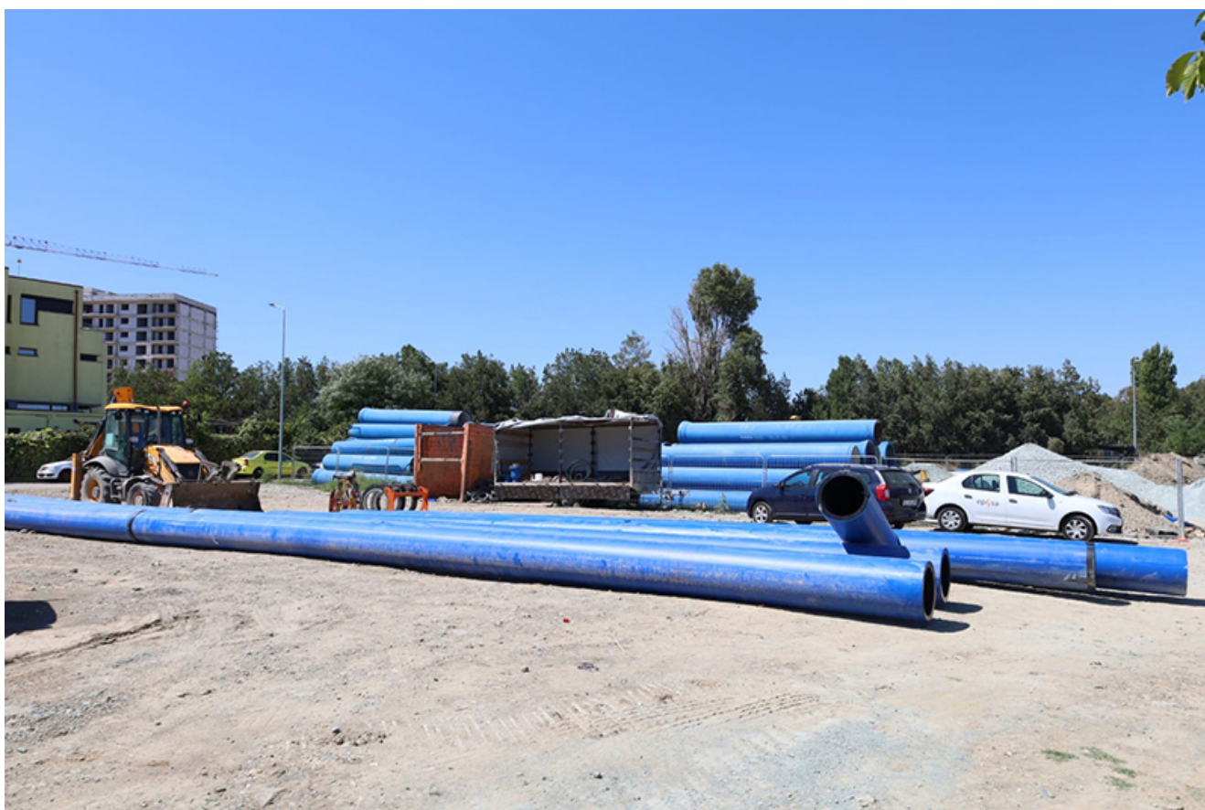
RAJA Baba Novac

Proiectul urmărește să asigure o alimentare cu apă suplimentară și alternativă pentru orașul Constanța, prin conectarea celor două Stații de pompare Palas și Călărași.