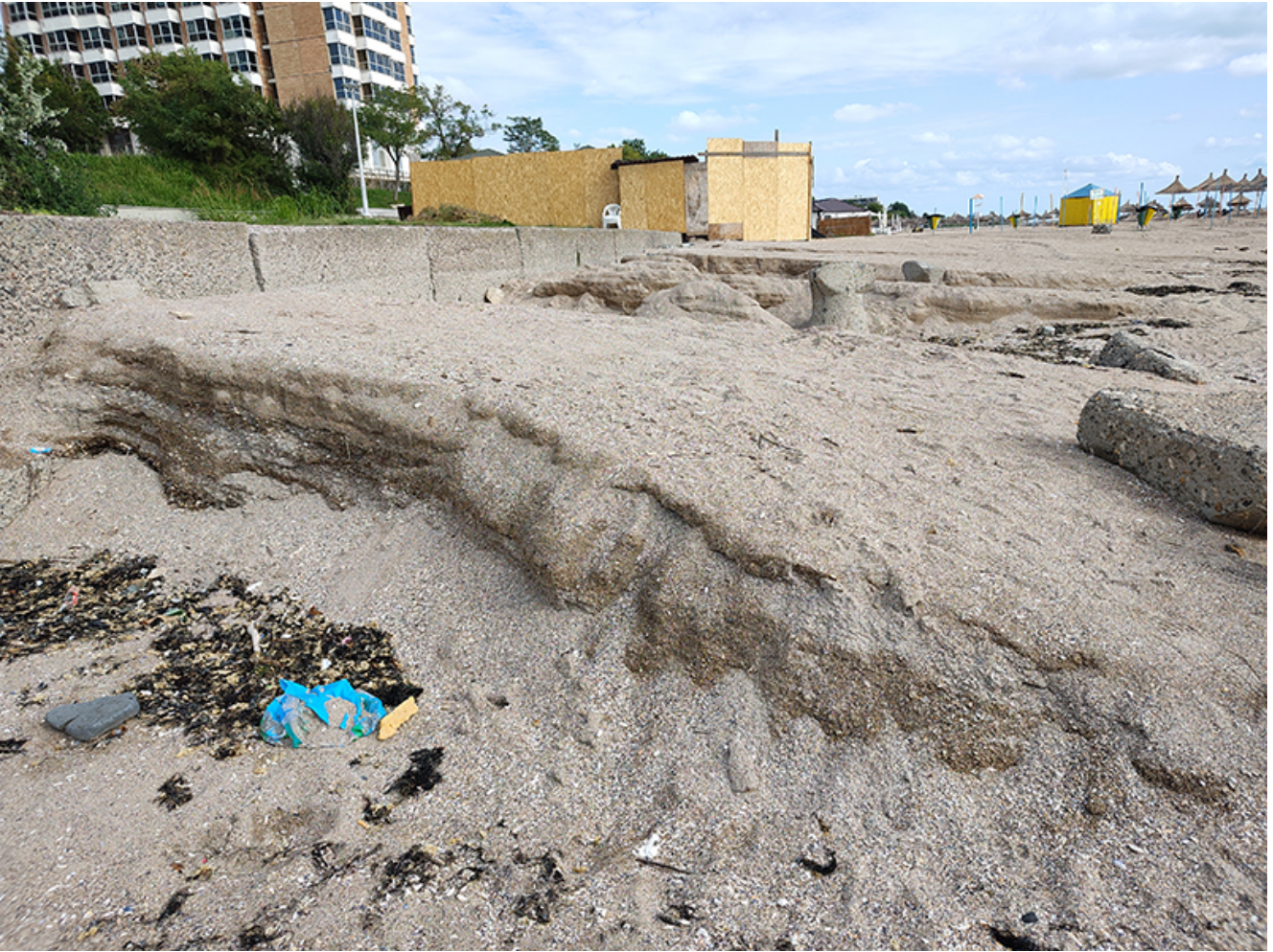
Plaje afectate de inundații