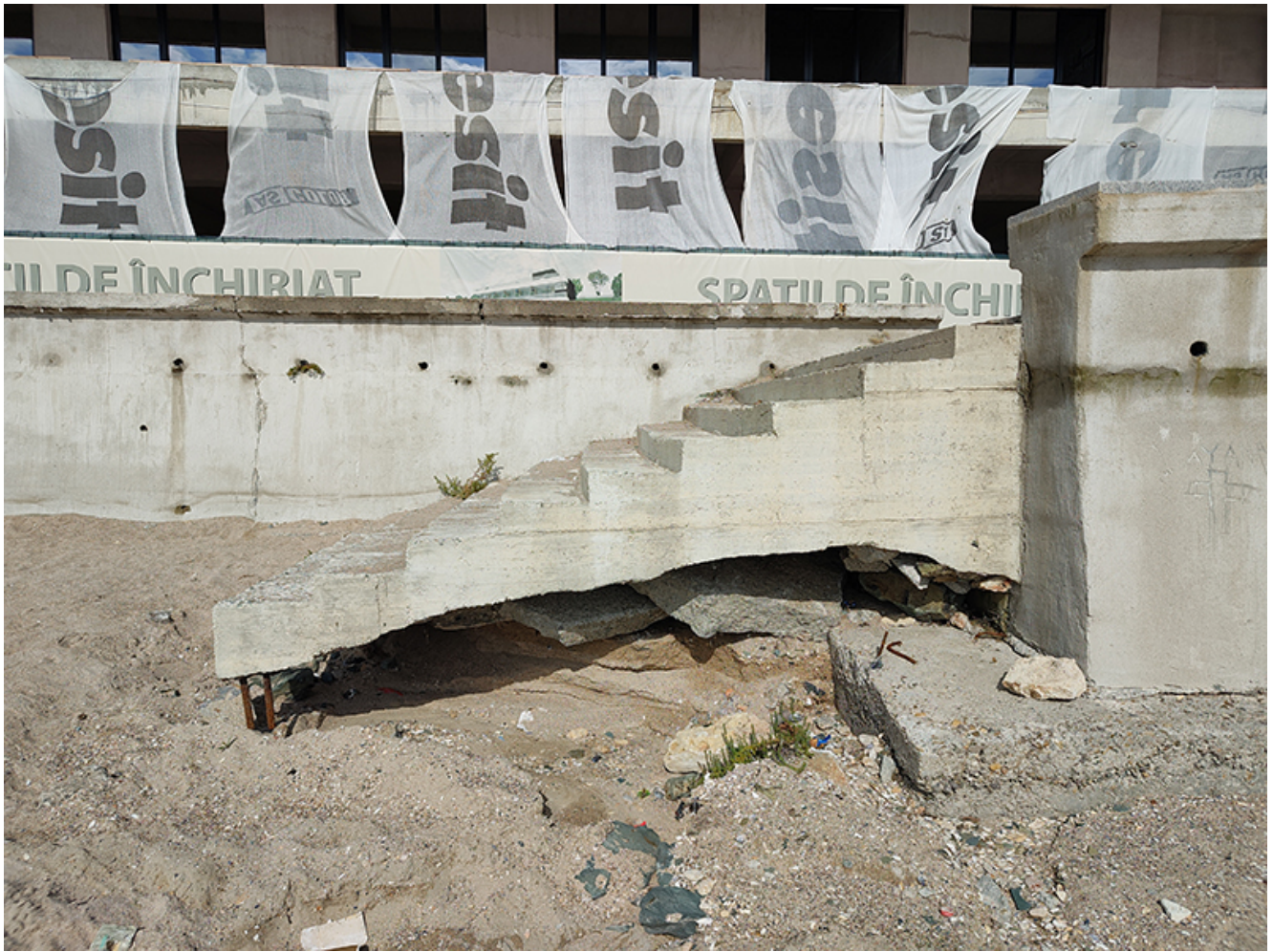
Plaje afectate de inundații