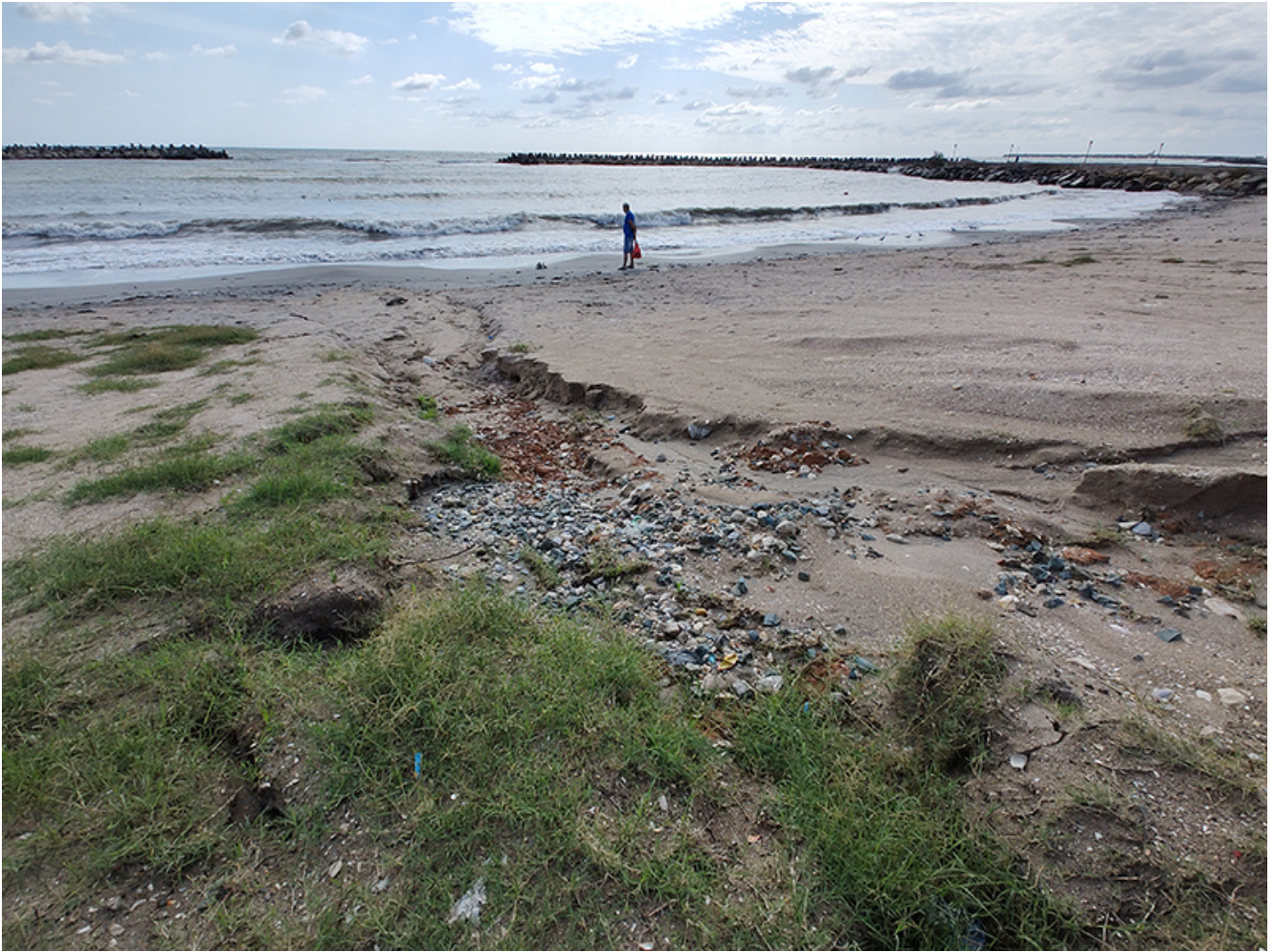
Plaje afectate de inundații