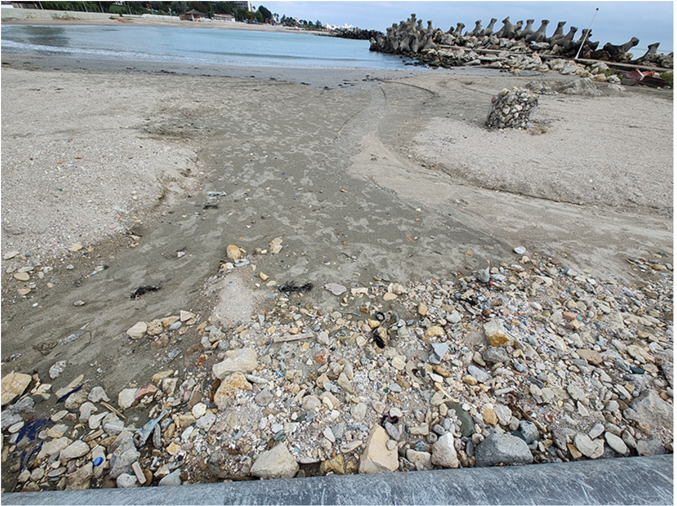
Plaje afectate de inundații