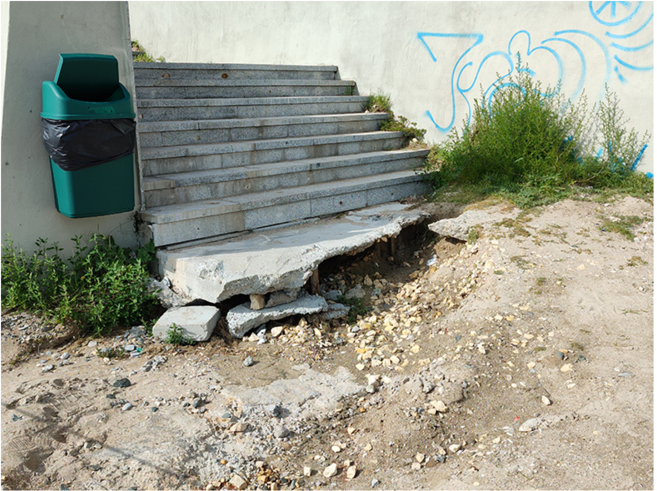
Plaje afectate de inundații