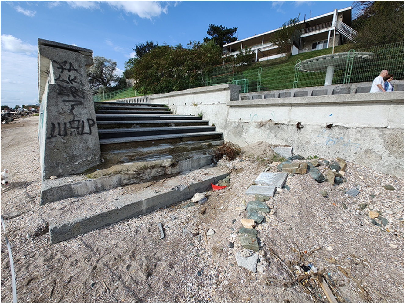
Plaje afectate de inundații