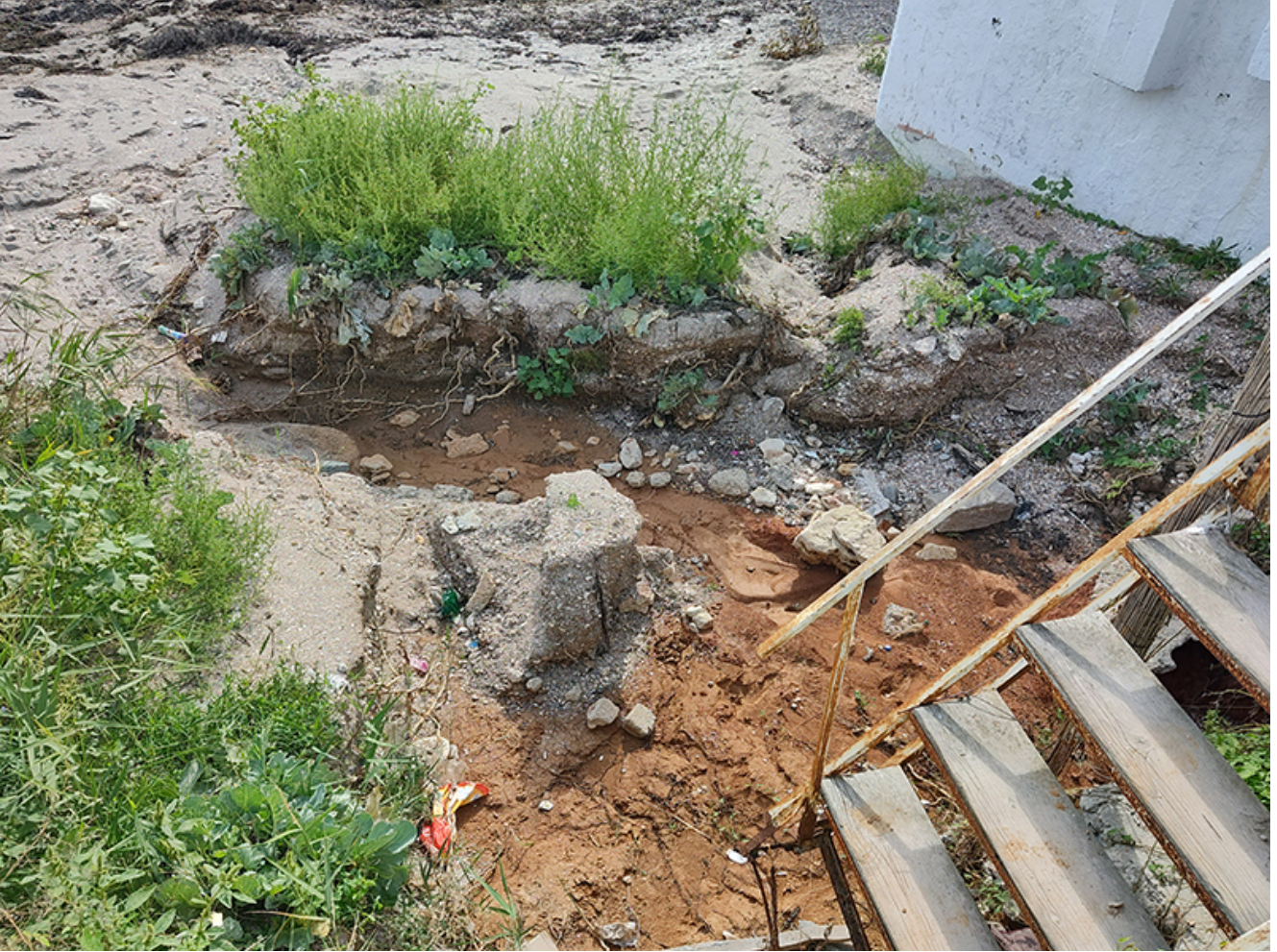
Plaje afectate de inundații