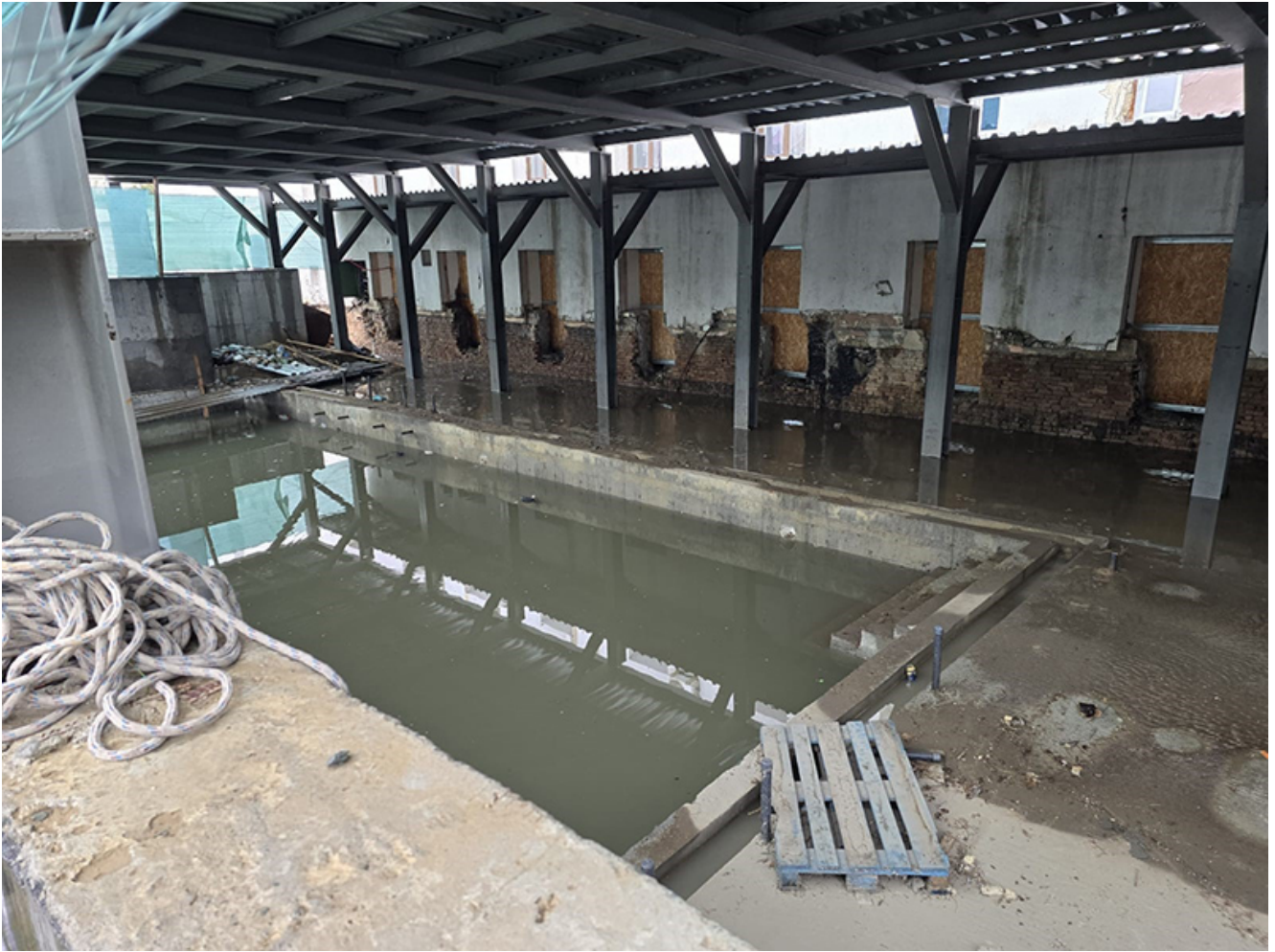
Pompierii de la Stația Tuzla