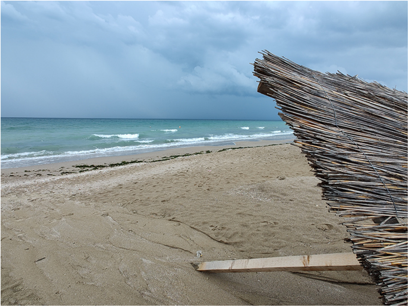
Furtună la Vama Veche