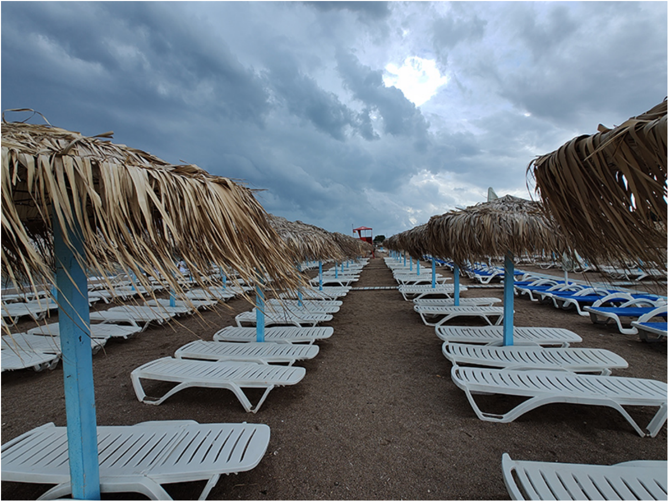
Furtună la Vama Veche