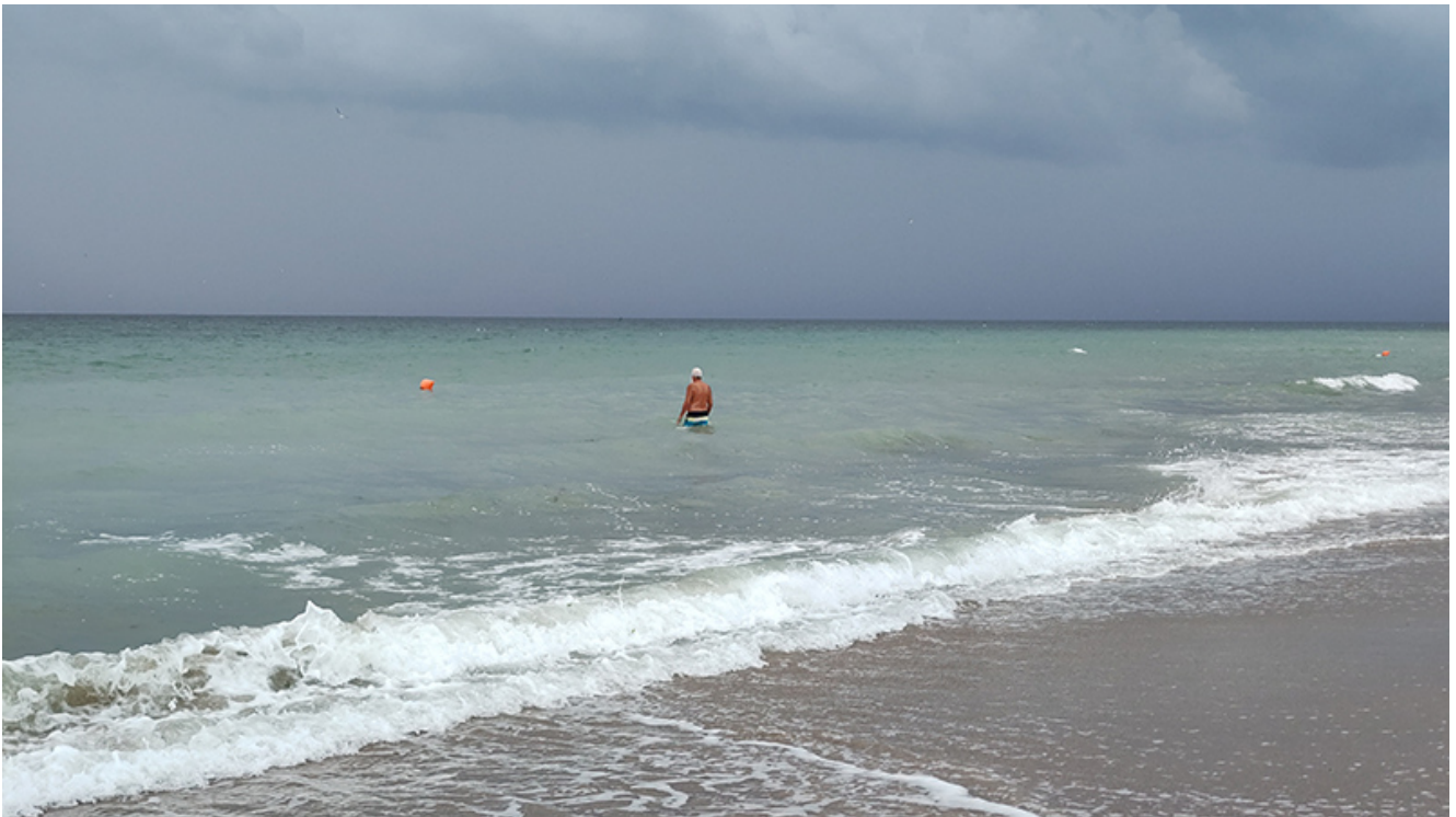
Furtună la Vama Veche