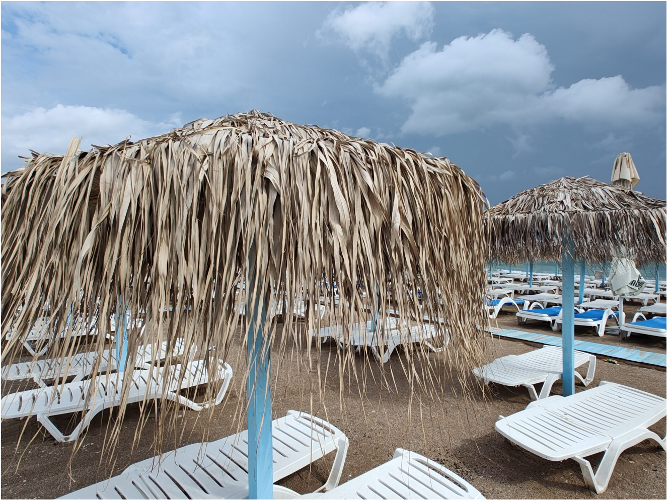
Furtună la Vama Veche