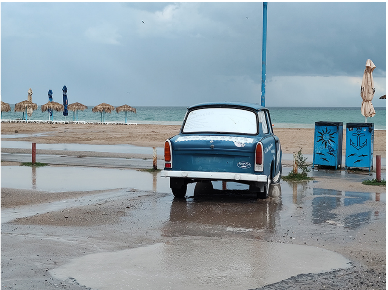
Furtună la Vama Veche