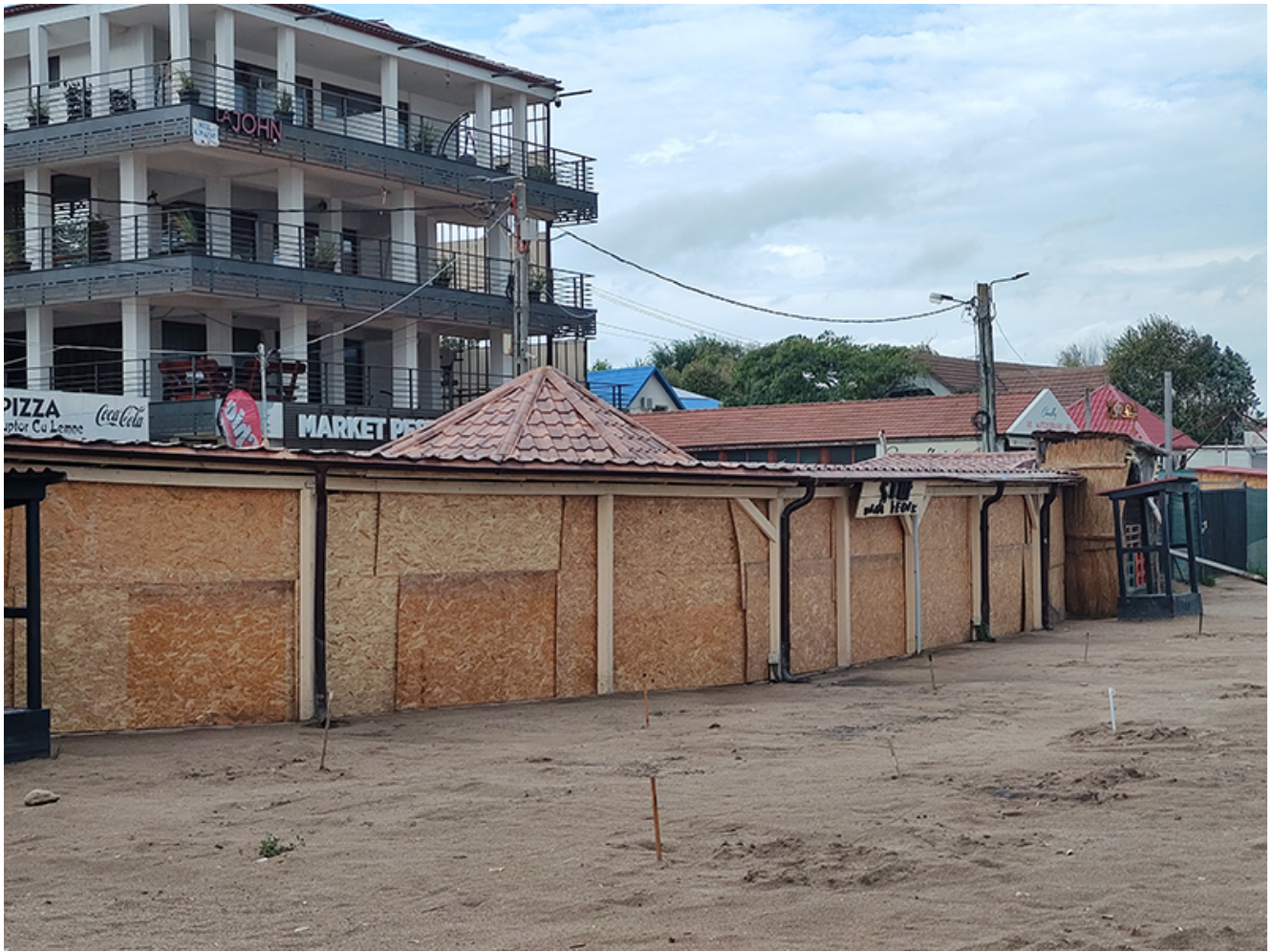
Furtună la Vama Veche