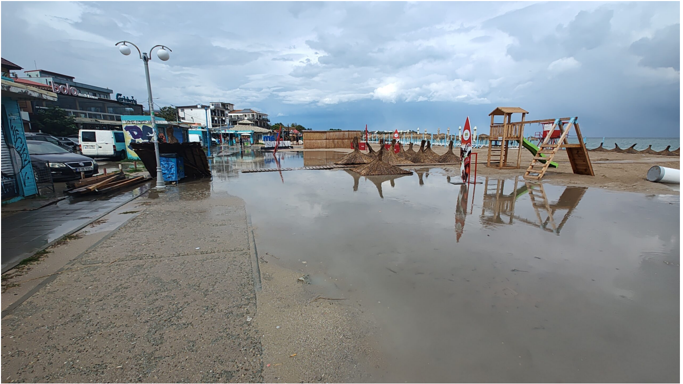
Furtună la Vama Veche