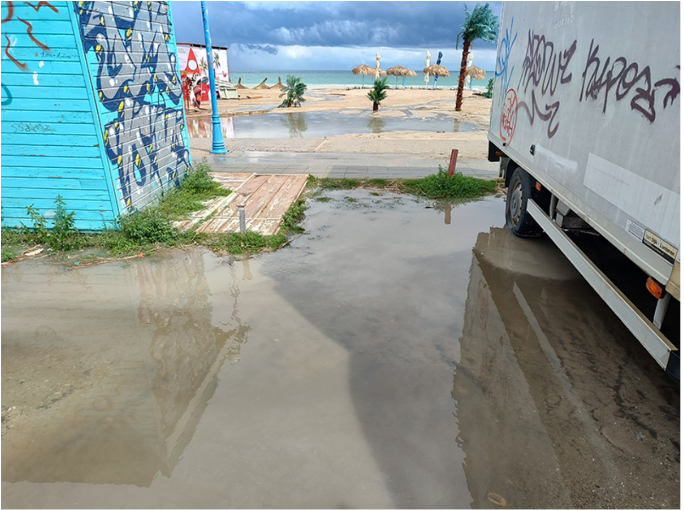
Furtună la Vama Veche