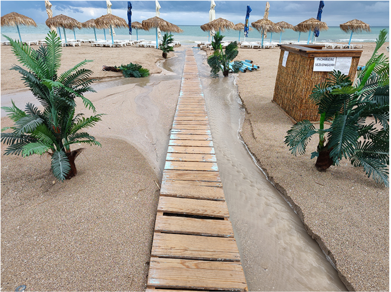
Furtună la Vama Veche