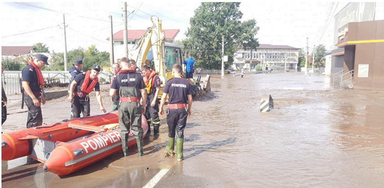
Inundații Galați 2024

Pentru gestionarea acestor efecte produse din cauza precipitațiilor abundente, la nivel național au fost implicați pompieri, polițiști, jandarmi, dar și autoritățile locale din zonele afectate.