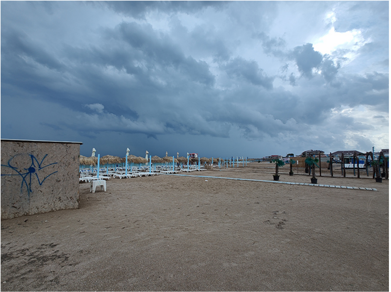
Furtună la Vama Veche