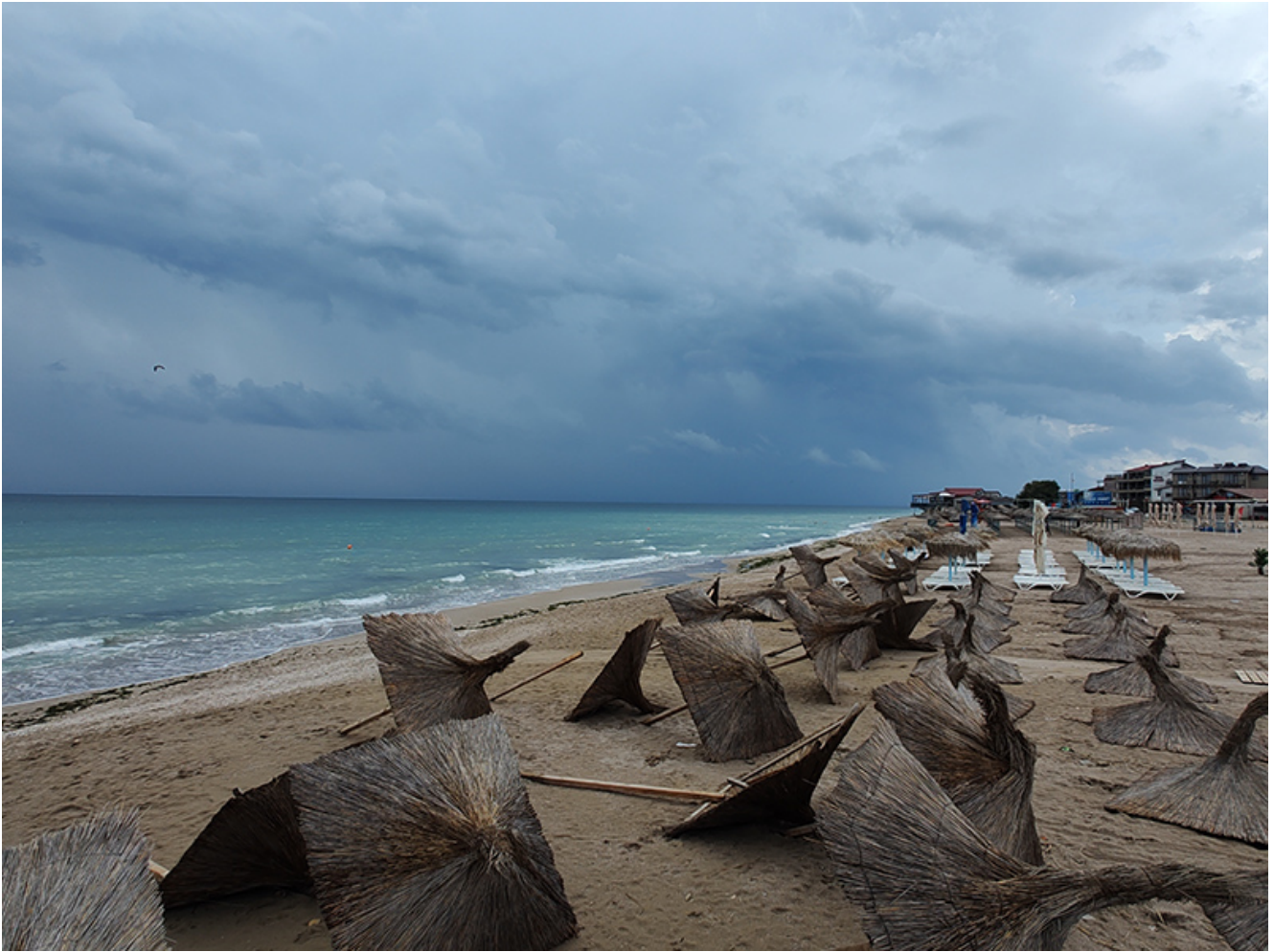
Furtună la Vama Veche