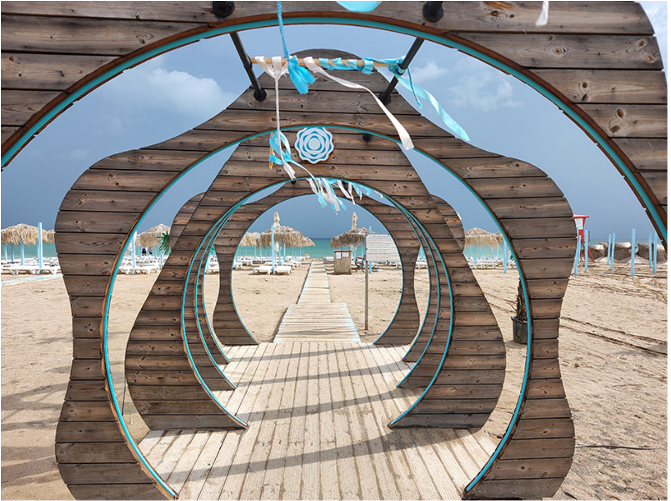
Furtună la Vama Veche