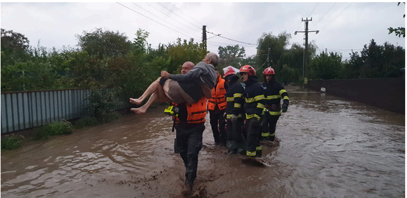
Inundații Galați 2024