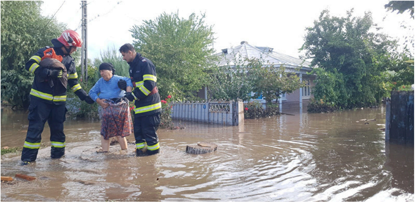
Inundații Galați 2024