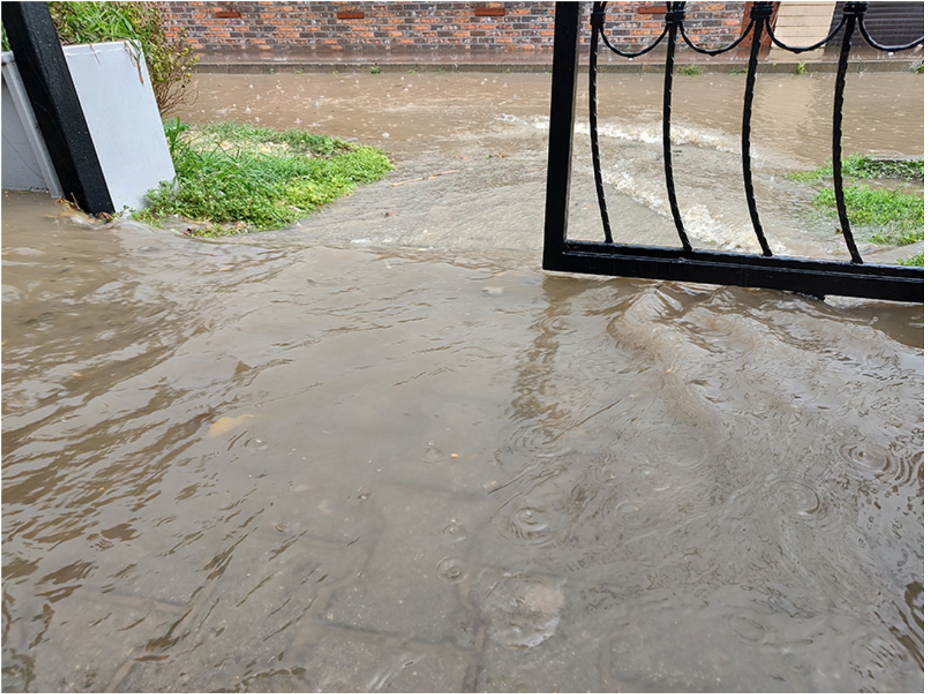
Furtună la Vama Veche