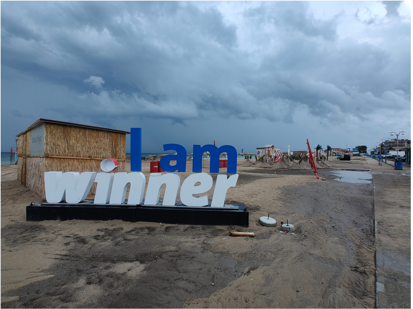
Furtună la Vama Veche