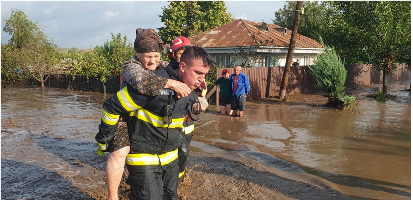
Inundații Galați 2024

De asemenea, în 5 localități (Docăneasa, Trestiana, Murgeni, Grivița și Zorleni) din județul Vaslui 46 de persoane fiind salvate de forțele de intervenție, iar 161 de gospodării au fost afectate de inundații.