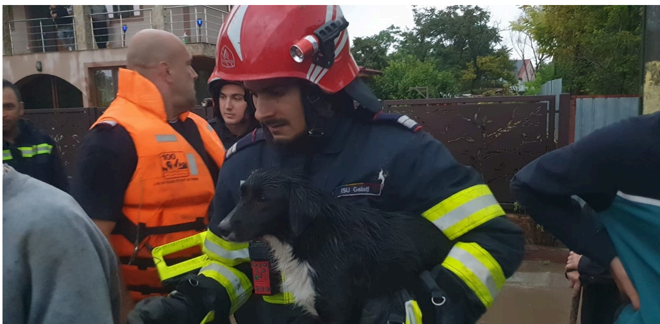
Inundații Galați 2024

În funcție de necesitățile operative, în zonele afectate din județul Galați au fost suplimentate efectivele cu 239 de pompieri de la inspectorate din țară, precum și cu mijloace