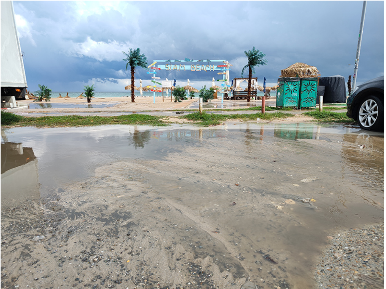
Furtună la Vama Veche