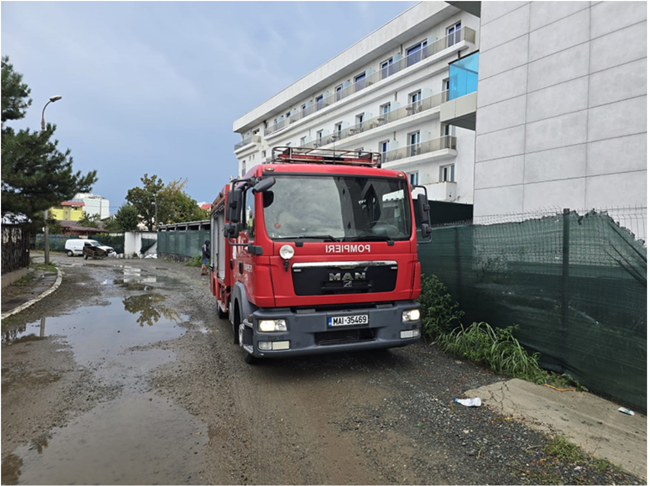
Pompierii de la Stația Tuzla