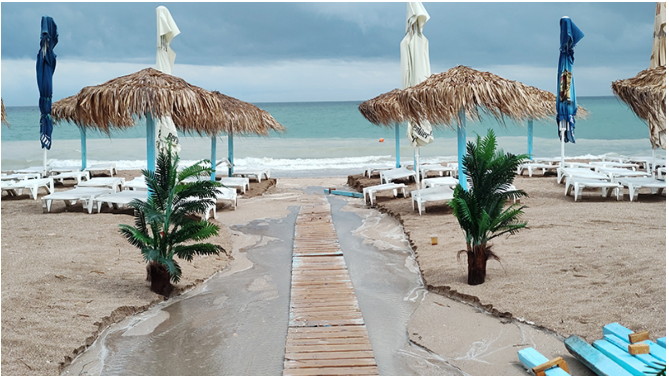
Furtună la Vama Veche