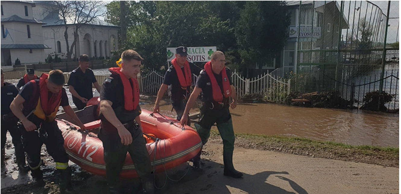
Inundații Galați 2024