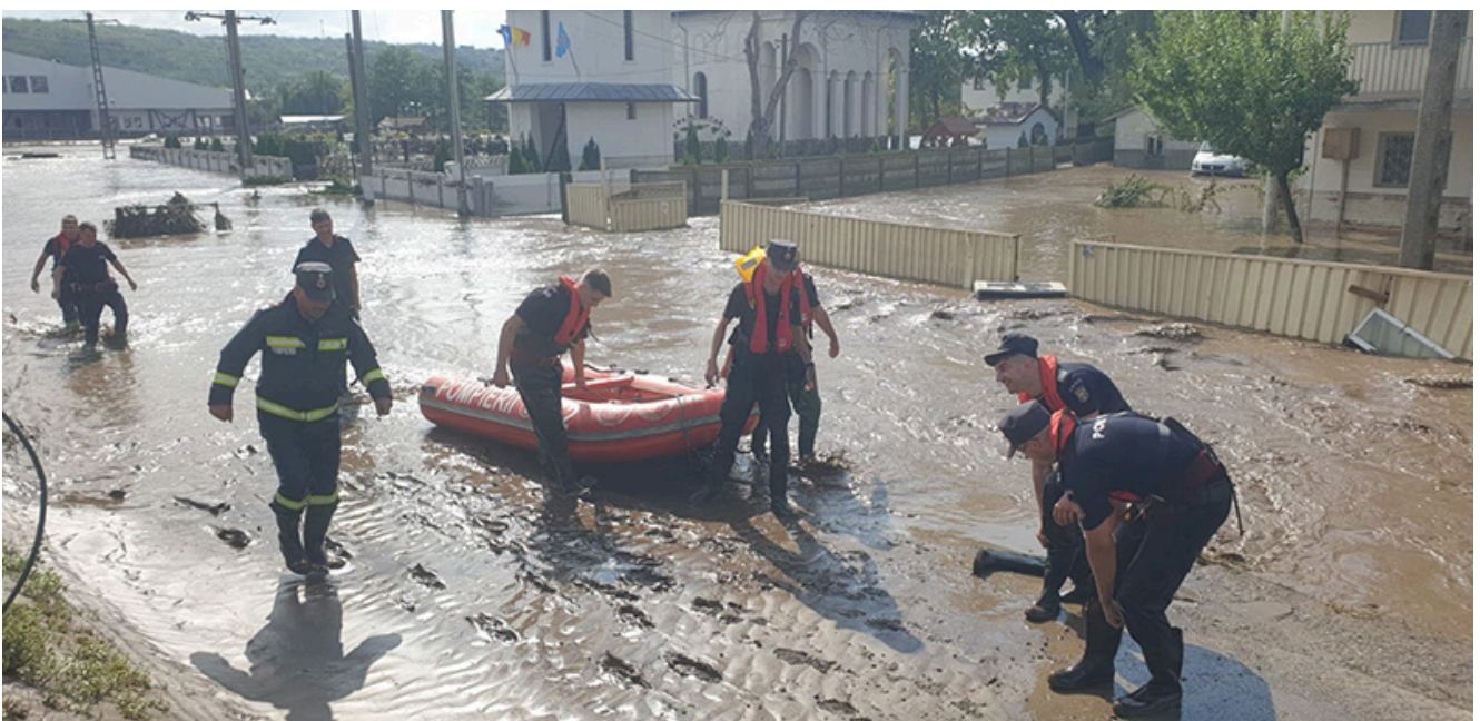
Inundații Galați 2024