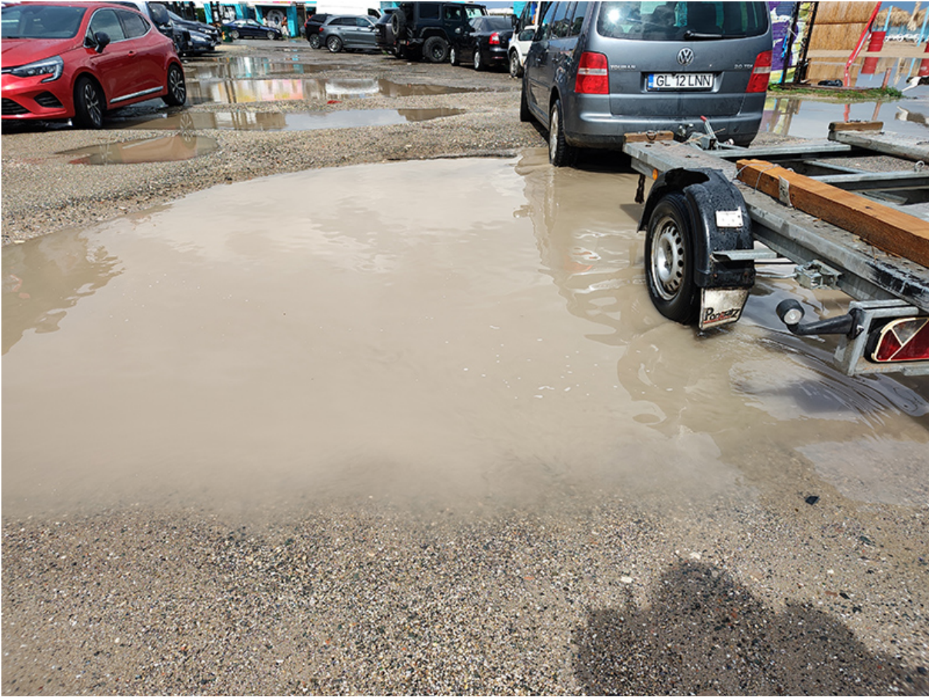
Furtună la Vama Veche