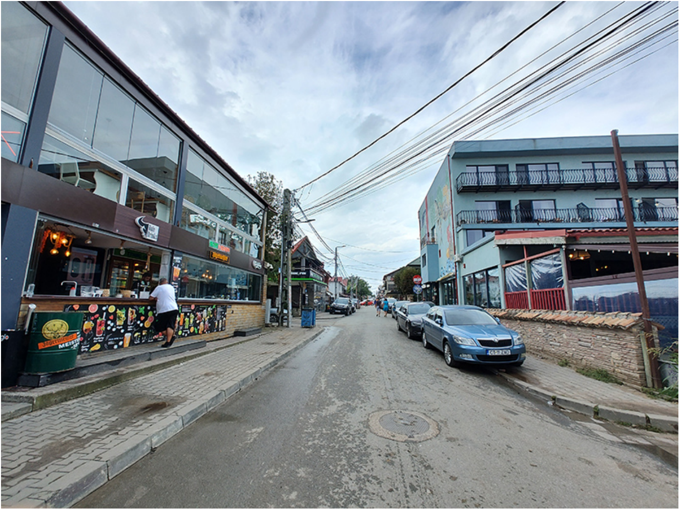
Furtună la Vama Veche