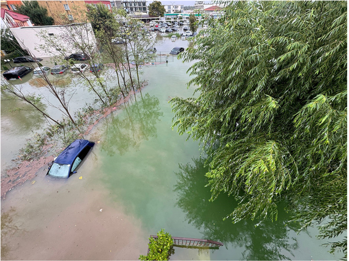
Inundatii Chirhanaua Venus

Un șofer din Eforie a fost REȚINUT pentru conducere fără permis. Azi va afla dacă rămâne după gratii