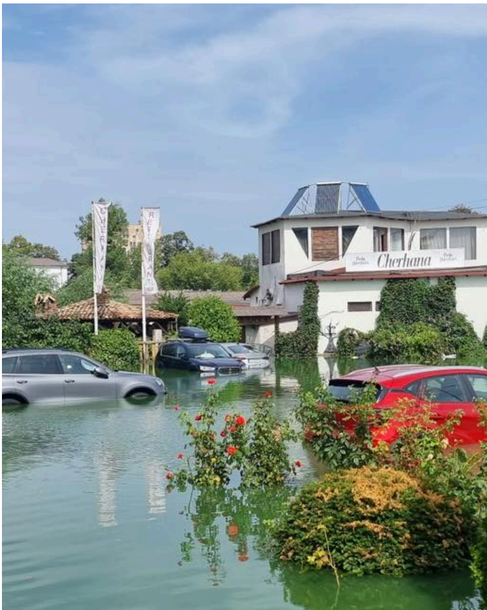
Inundatii Cherhanaua Venus

Renaștem ca pasărea Phoenix din... apă și vom reveni în sezonul următor cu o nouă înfățișare. Dacă ne vedeți mai rar pe aici, să știți ca ne-am apucat de renovat/refăcut și muncim intens până la sezonul ce vine,,.