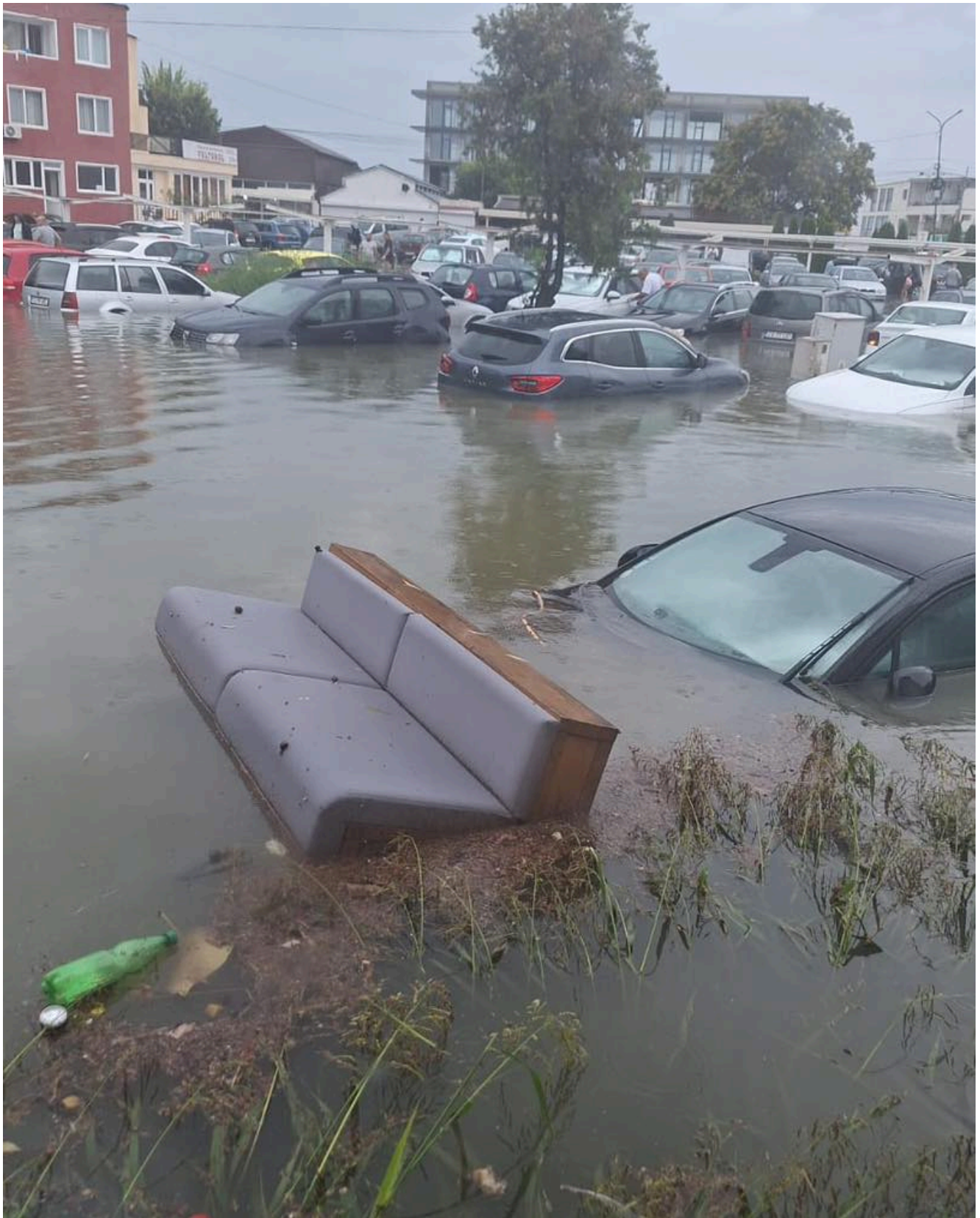
Inundatii Chirhanau Venus