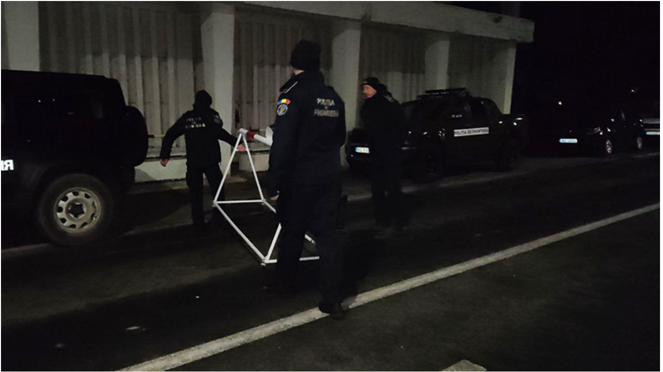
PTF Vama Veche, intrarea în Schengen