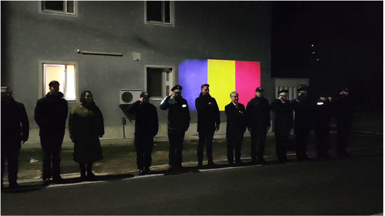
PTF Vama Veche, intrarea în Schengen