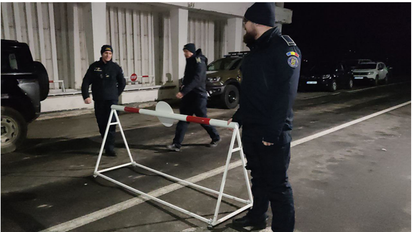
PTF Vama Veche, intrarea în Schengen