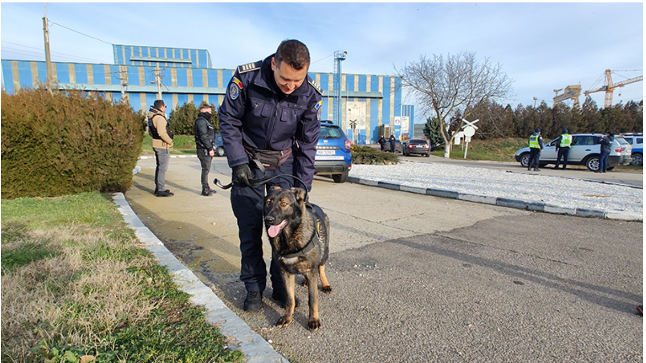
Razie 2 Mai