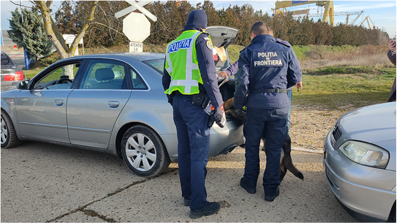
Razie 2 Mai