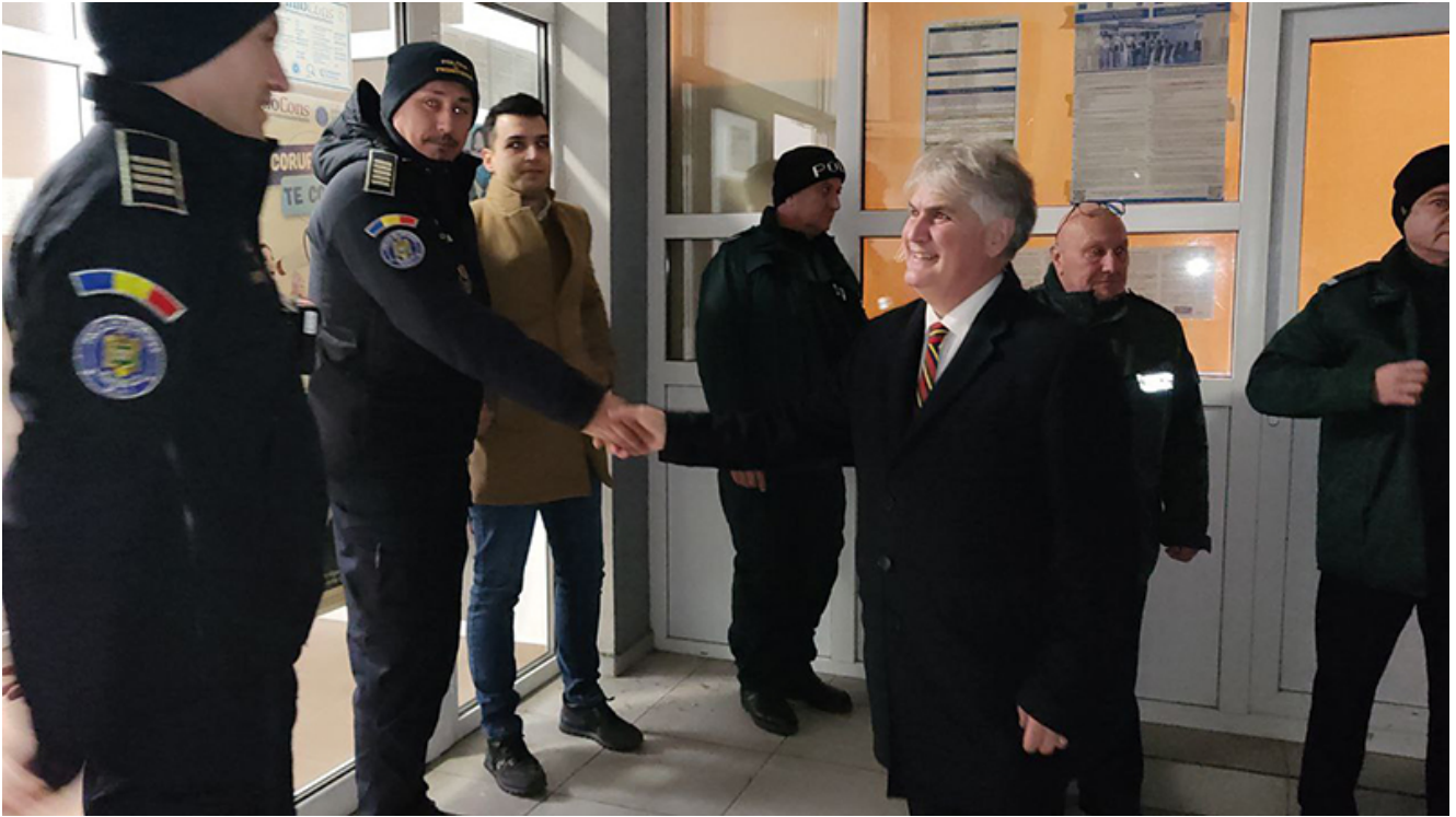
PTF Vama Veche, intrarea în Schengen