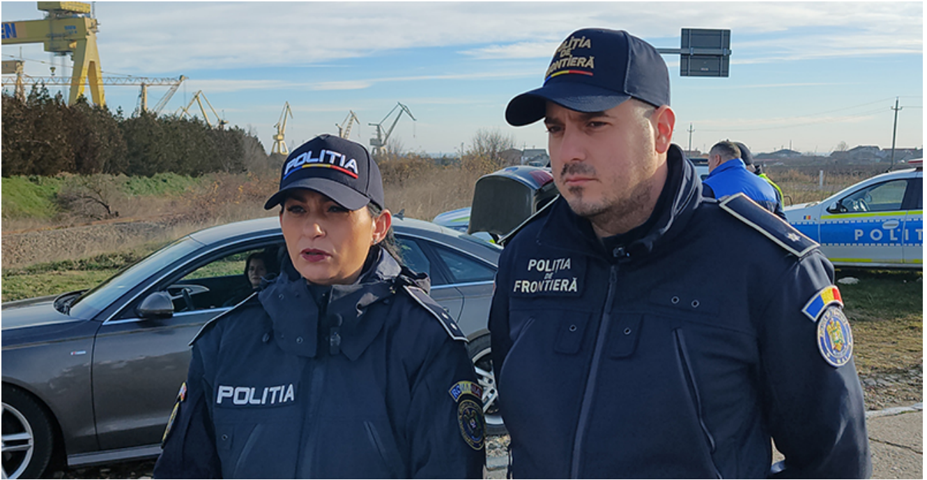
Razie 2 Mai