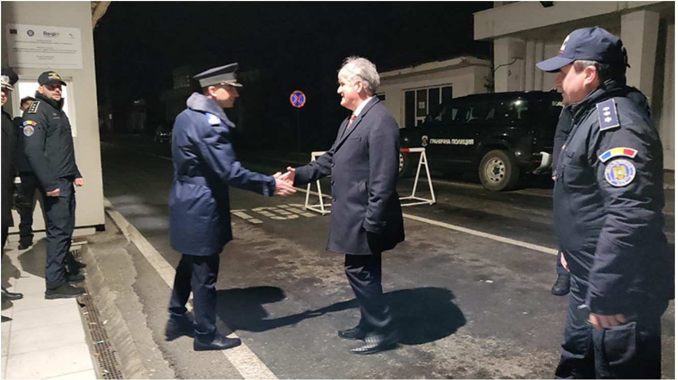
PTF Vama Veche, intrarea în Schengen