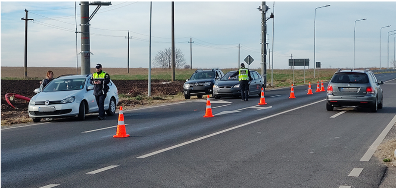
Razie 2 Mai