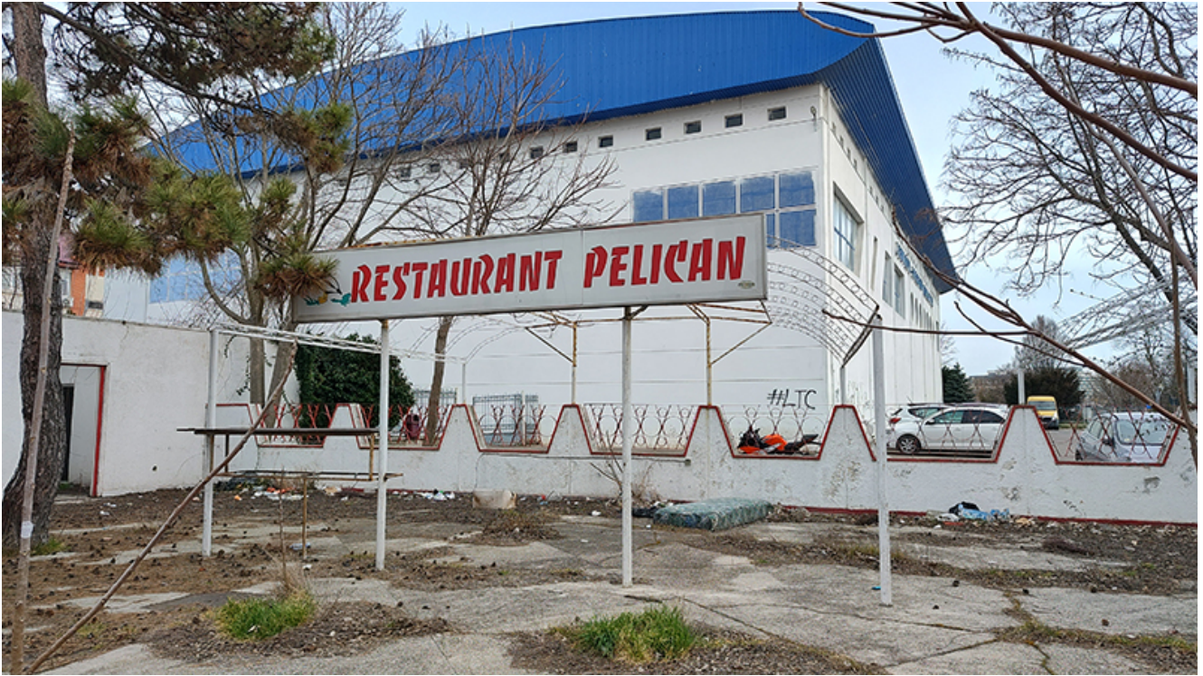
Restaurant Pelican Saturn