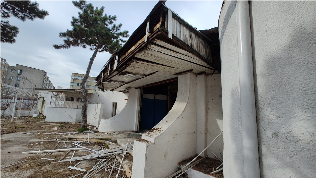
Restaurant Pelican Saturn