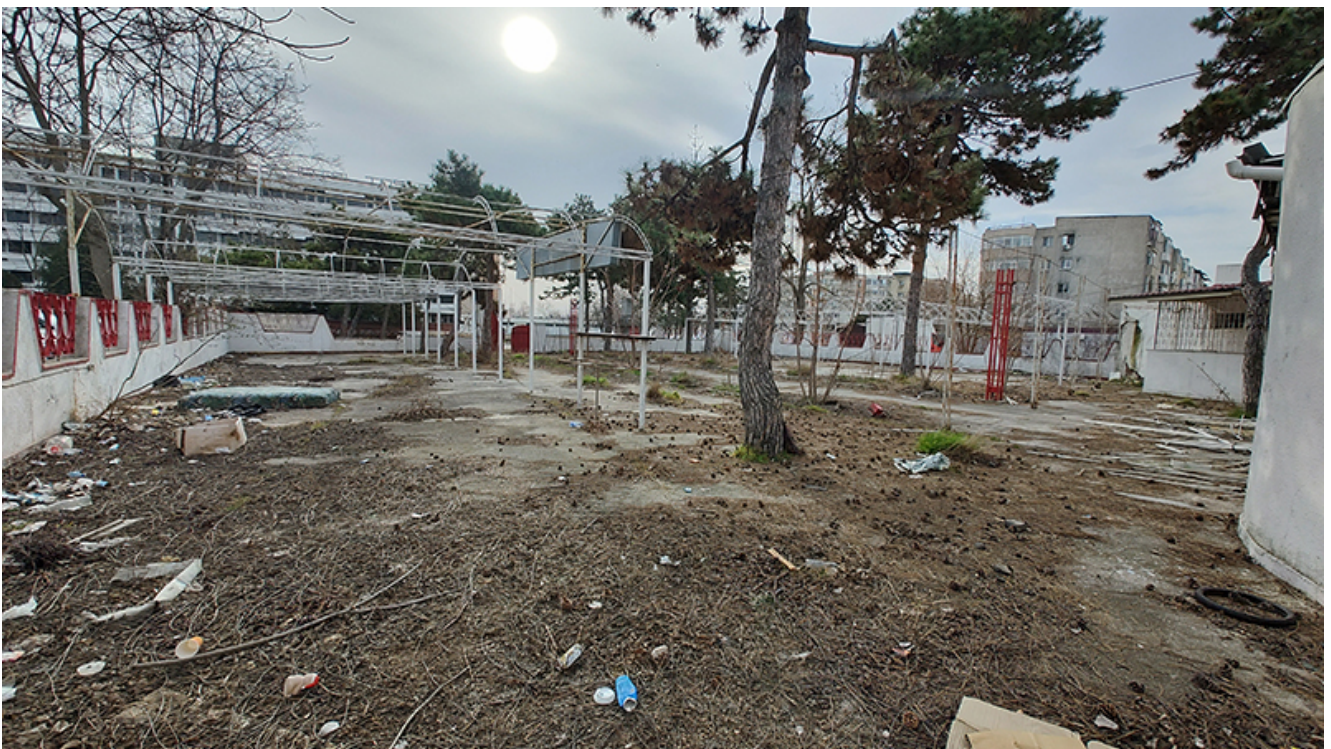
Restaurant Pelican Saturn