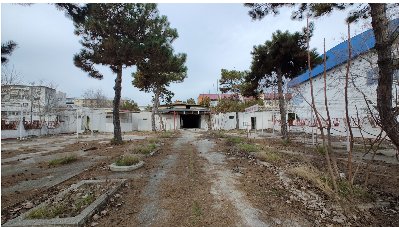
Restaurant Pelican Saturn

Restaurantul Pelican aparține SC Hoteluri Restaurante Sud SA (societate care a preluat o parte a activelor THR Marea Neagră).