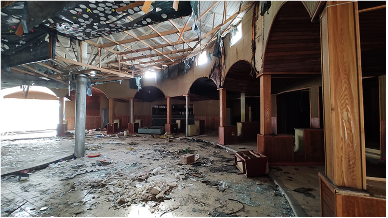
Restaurant Pelican Saturn