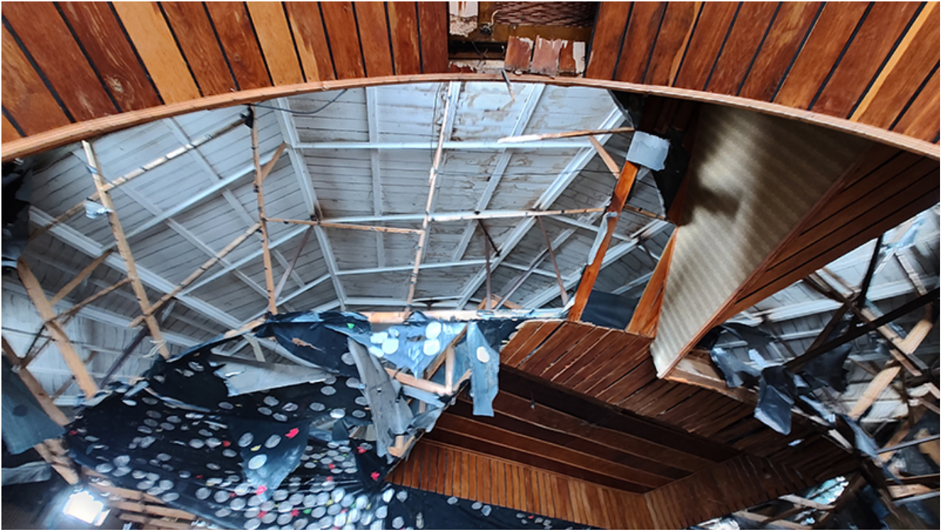
Restaurant Pelican Saturn