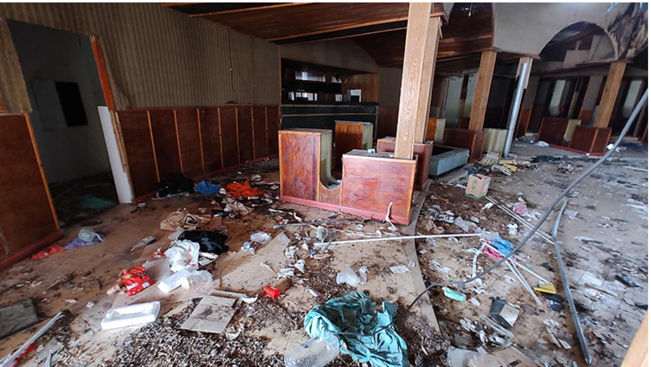
Restaurant Pelican Saturn