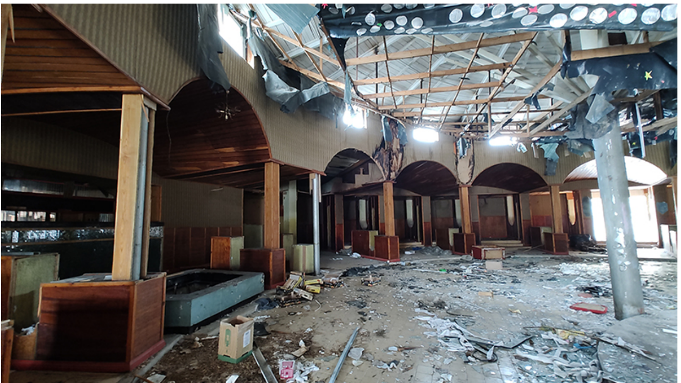
Restaurant Pelican Saturn