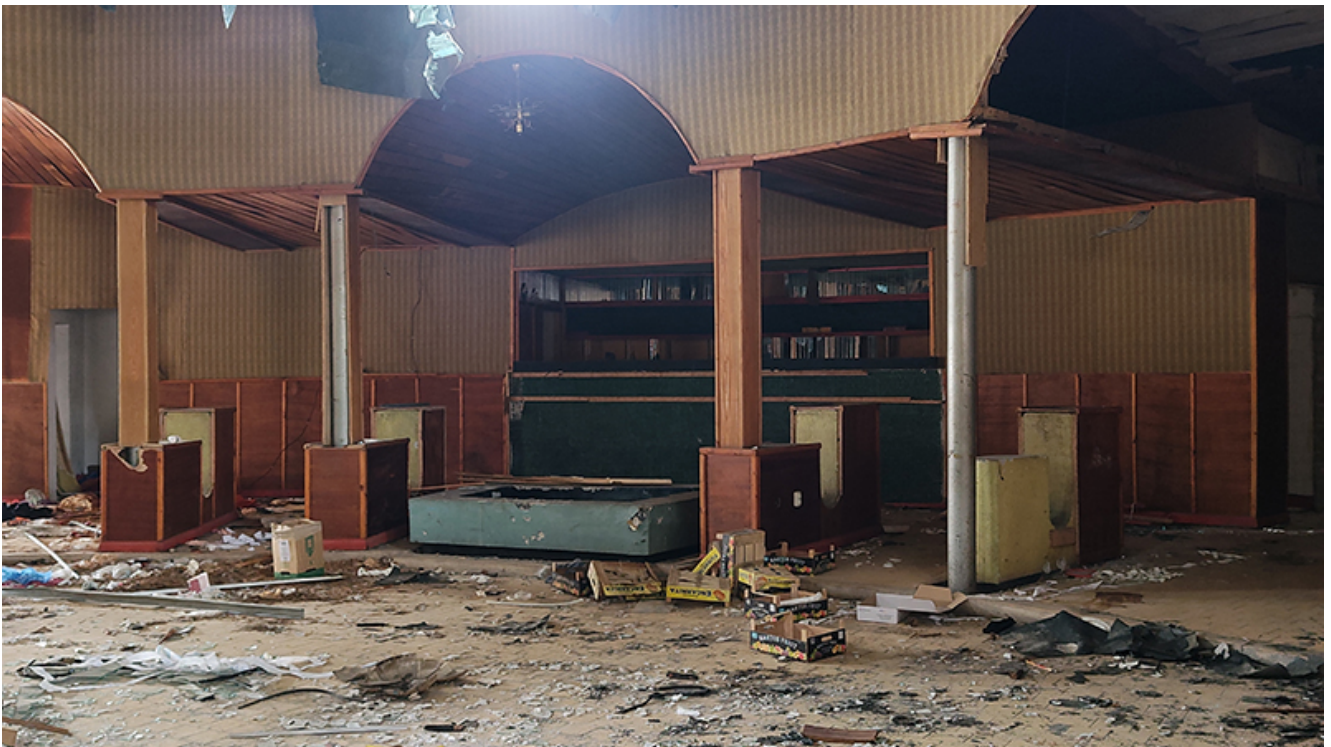
Restaurant Pelican Saturn