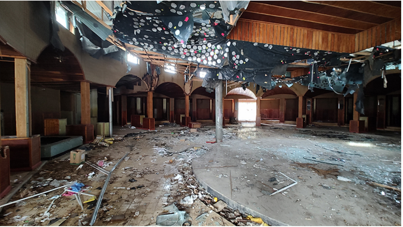
Restaurant Pelican Saturn