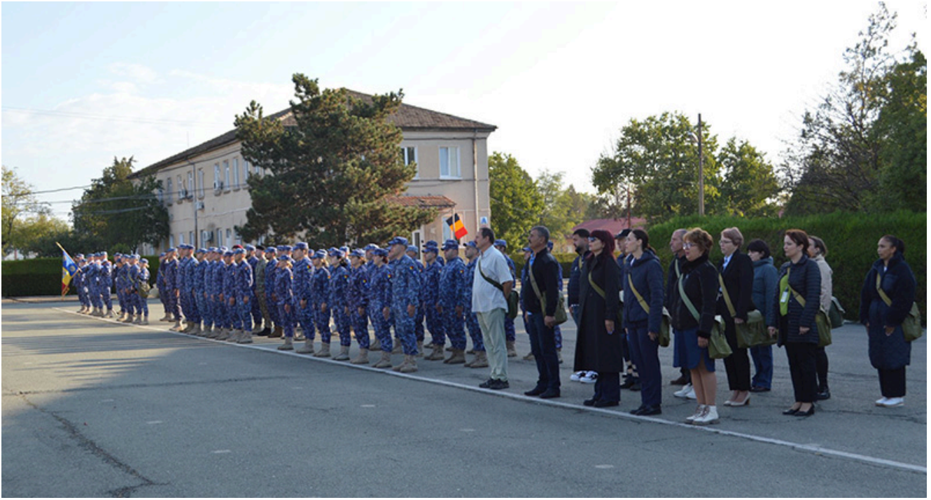
Deschiderea anului de instruire 2025-2026 la Școala de Instruire Interarme a Forțelor Navale din Mangalia