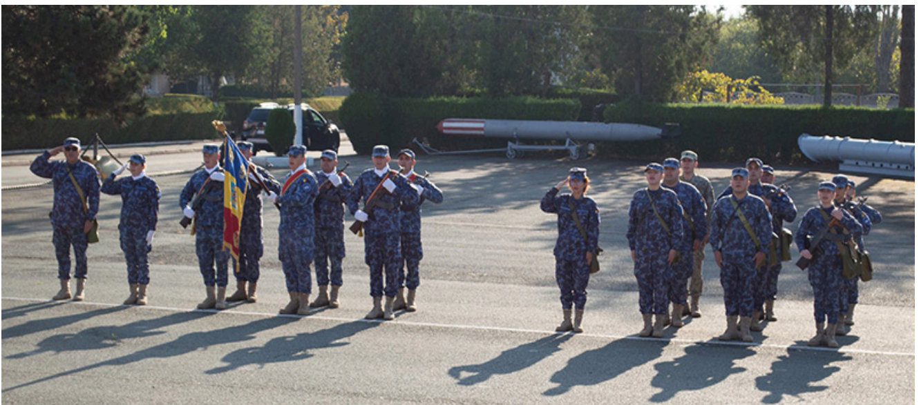
Deschiderea anului de instruire 2025-2026 la Școala de Instruire Interarme a Forțelor Navale din Mangalia