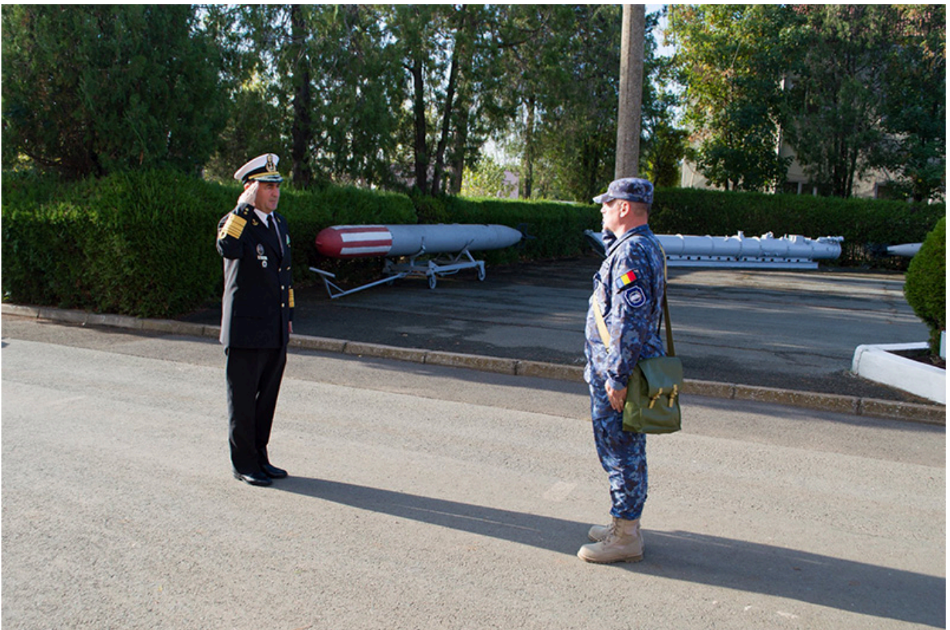
Deschiderea anului de instruire 2025-2026 la Școala de Instruire Interarme a Forțelor Navale din Mangalia