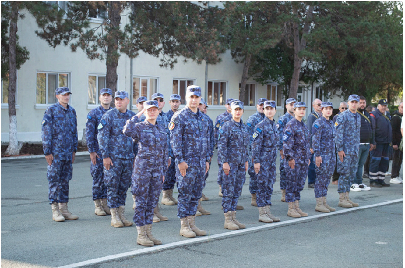
Deschiderea anului de instruire 2025-2026 la Școala de Instruire Interarme a Forțelor Navale din Mangalia