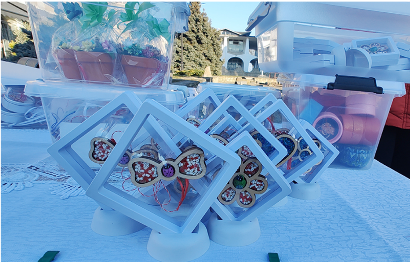
Târg de mărtișoare la Mangalia