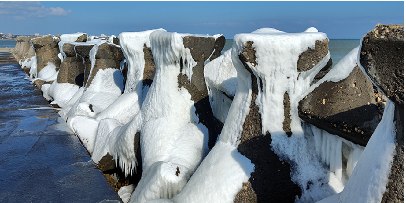
Peisaj glaciari la Mangalia