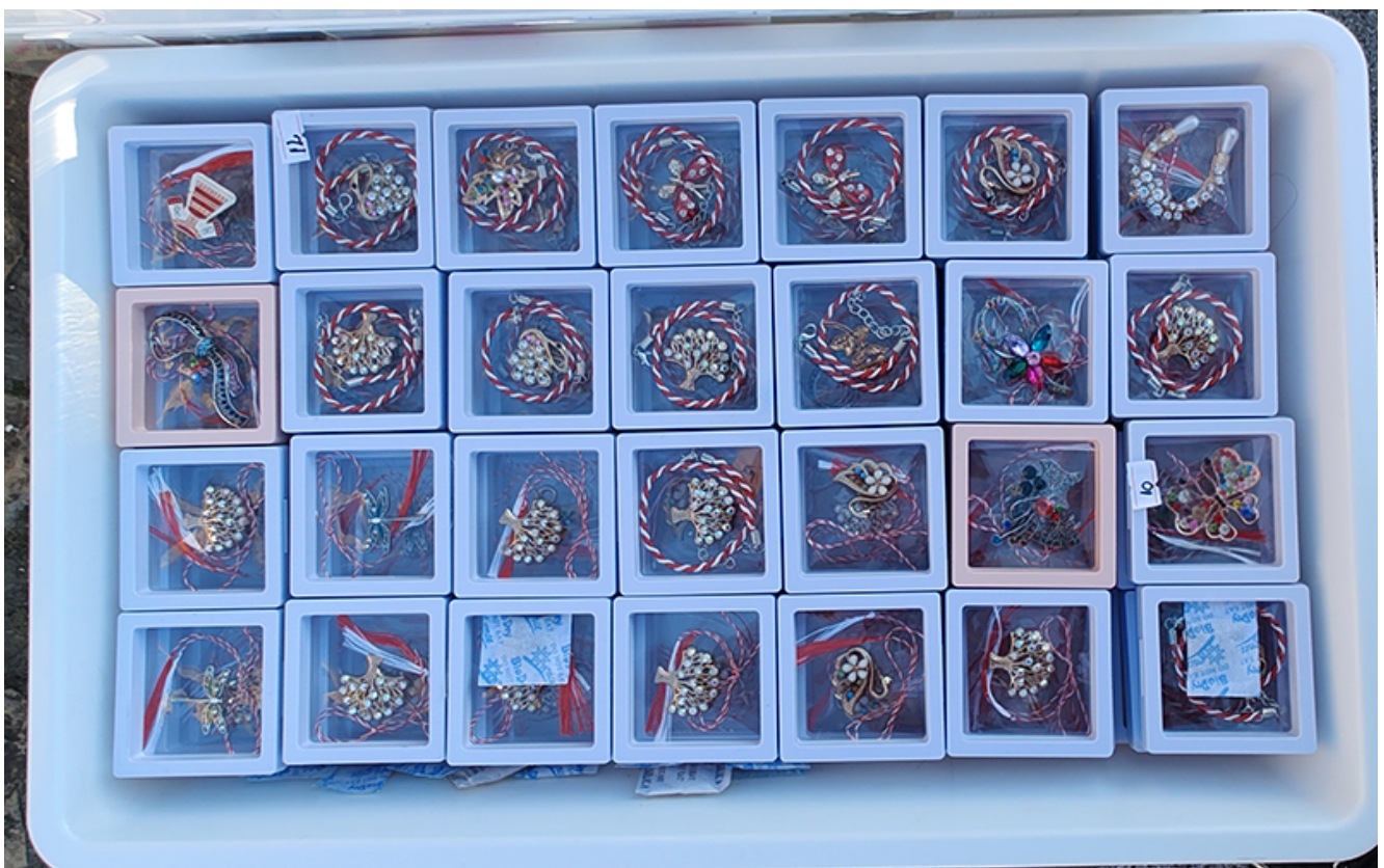
Târg de măștișoare la Mangalia