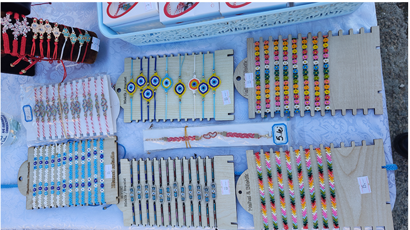
Târg de măștișoare la Mangalia