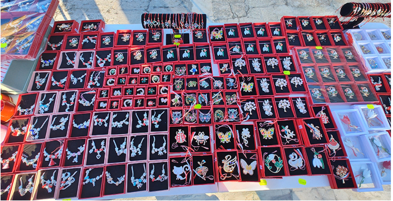
Târg de mărtișoare la Mangalia