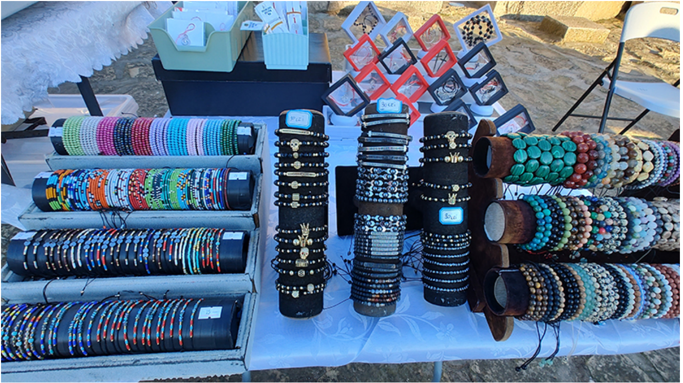
Târg de măștișoare la Mangalia