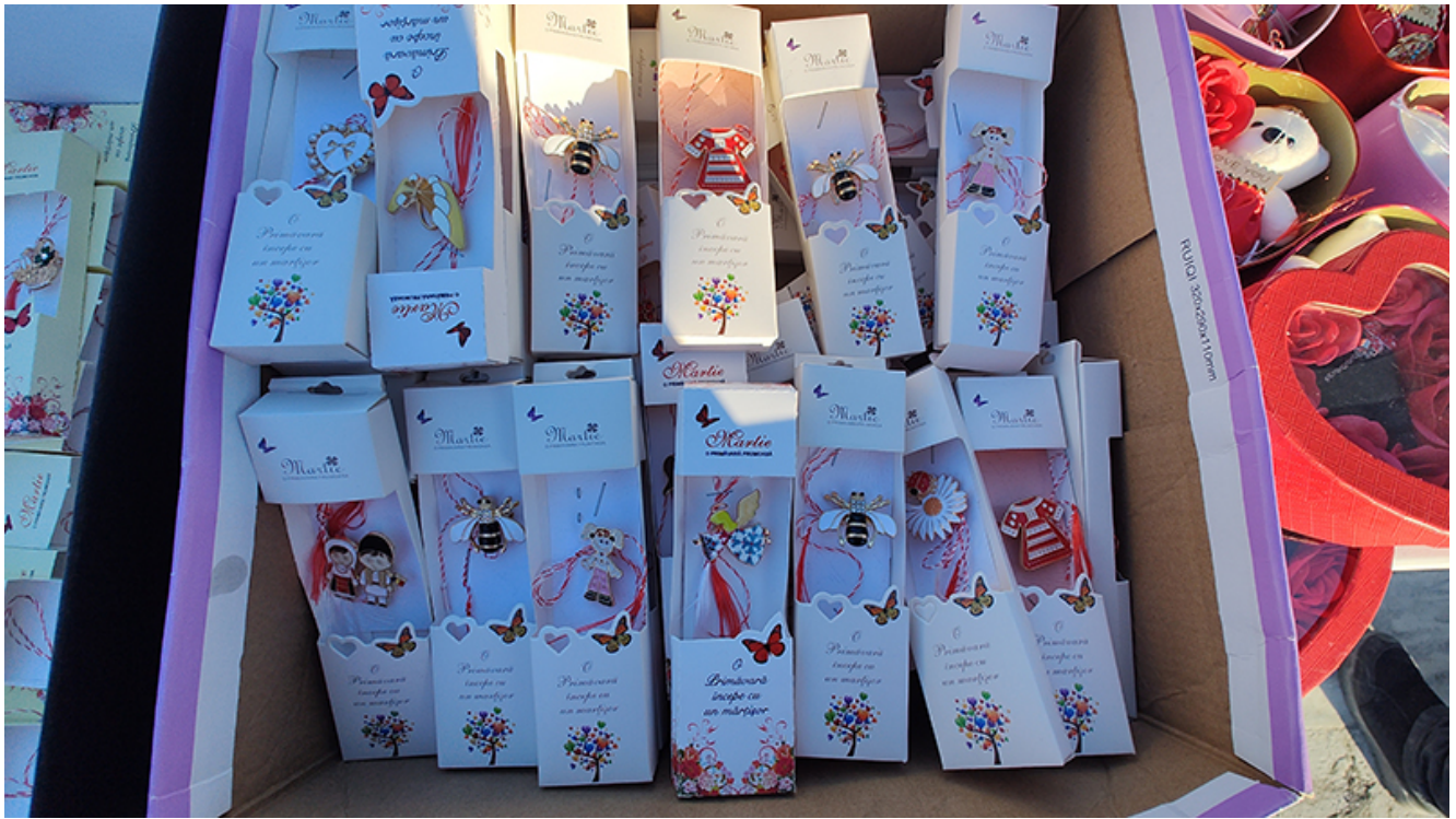
Târg de măștișoare la Mangalia