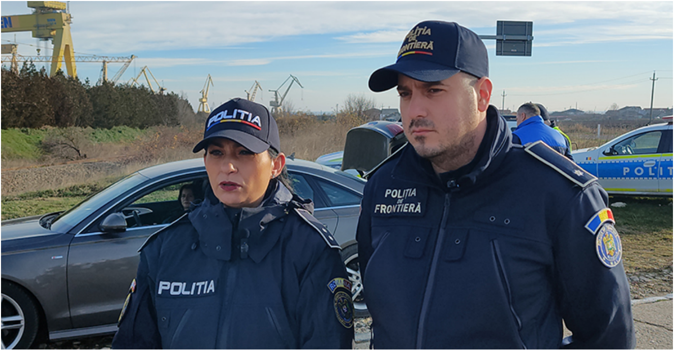
Razie 2 Mai