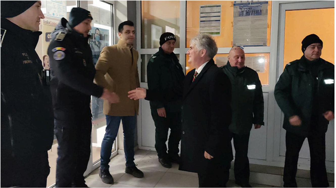
PTF Vama Veche, intrarea în Schengen