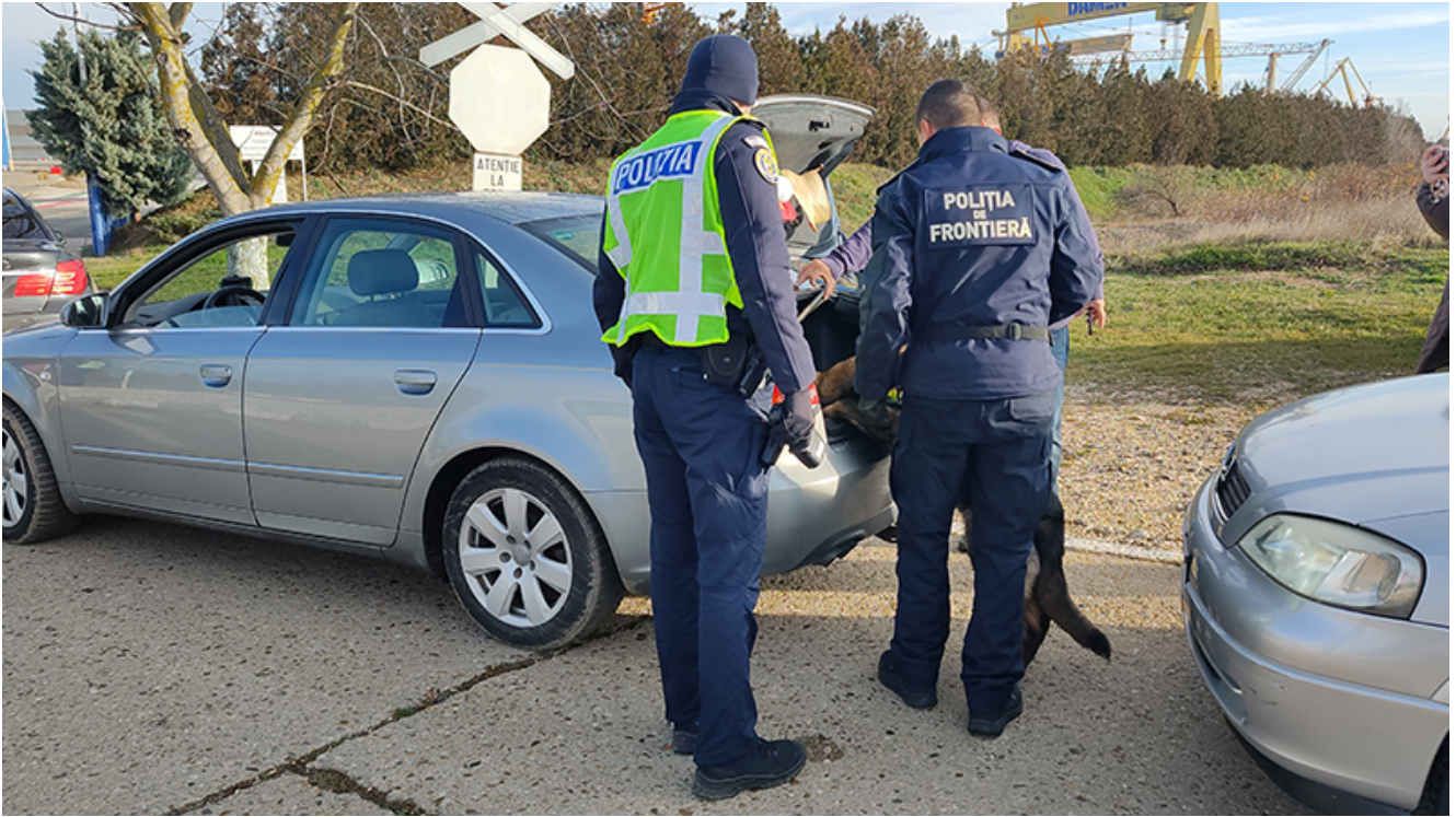
Razie 2 Mai