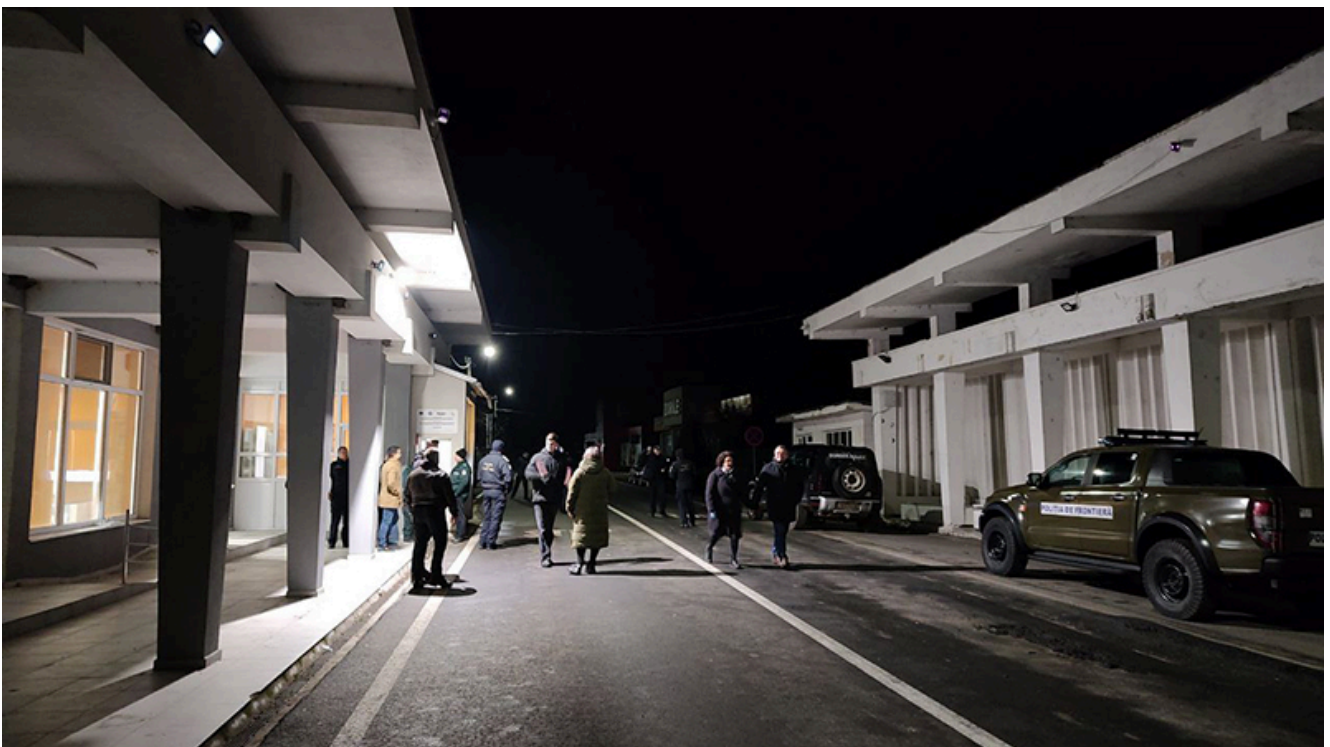
PTF Vama Veche, intrarea în Schengen