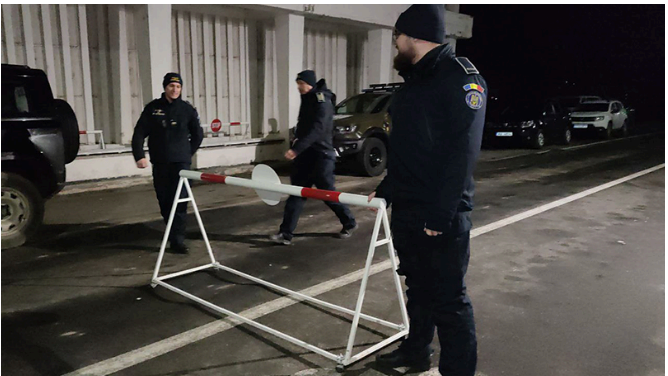
PTF Vama Veche, intrarea în Schengen