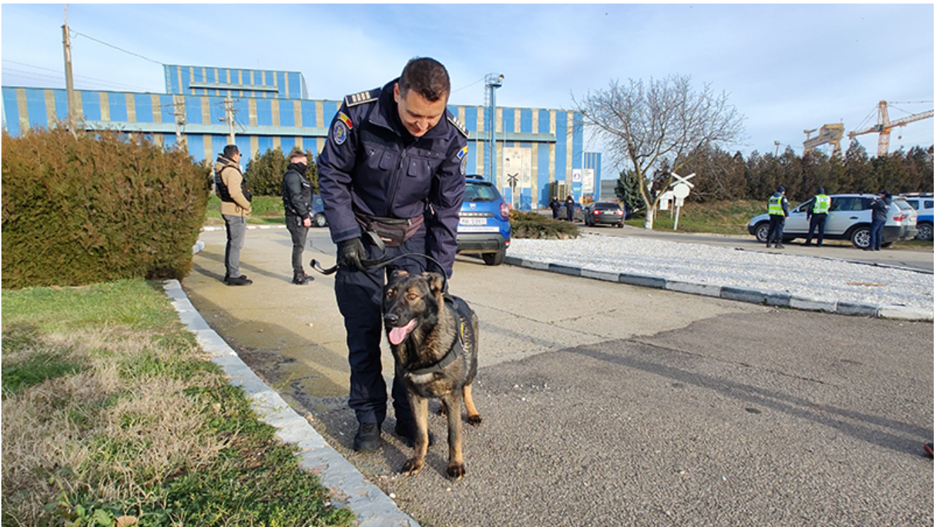
Razie 2 Mai