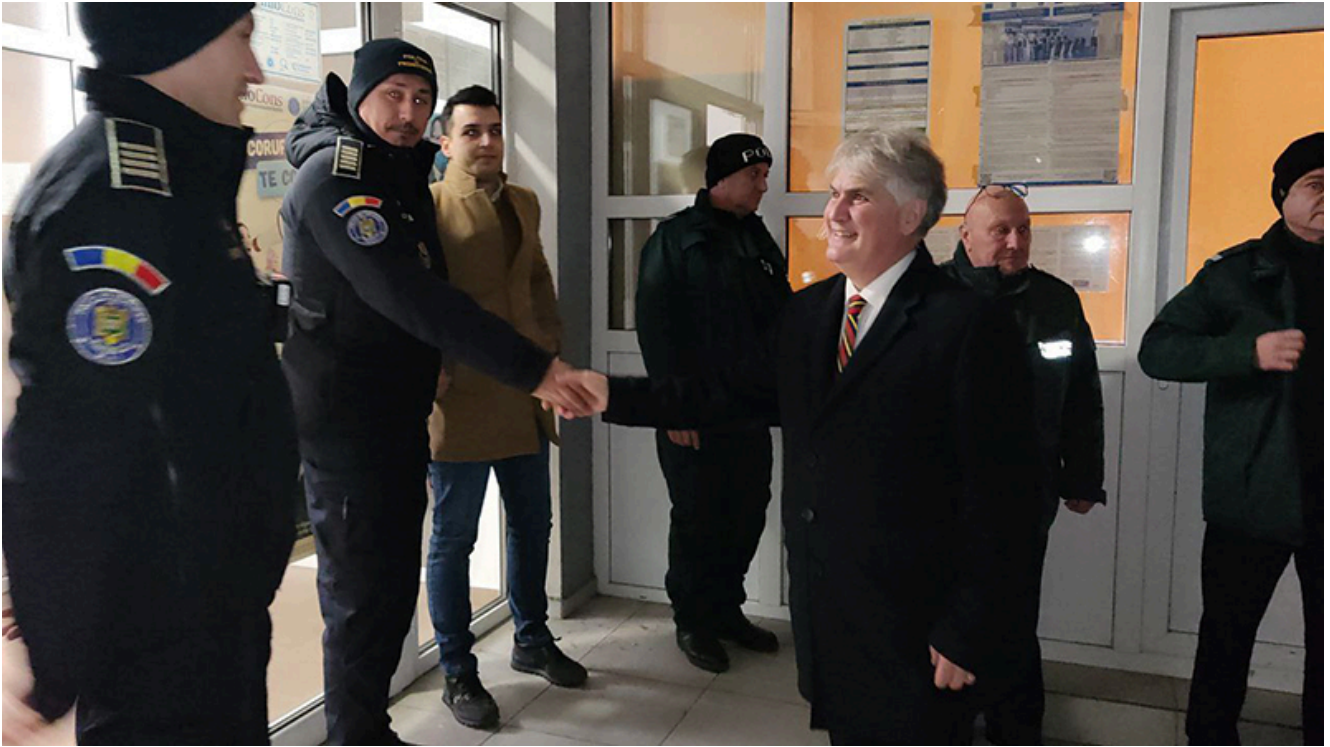
PTF Vama Veche, intrarea în Schengen