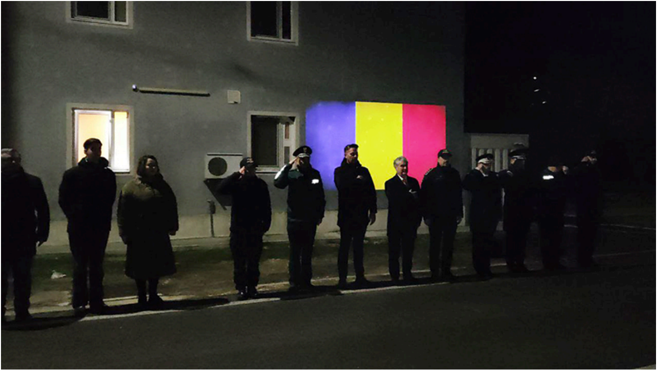
PTF Vama Veche, intrarea în Schengen