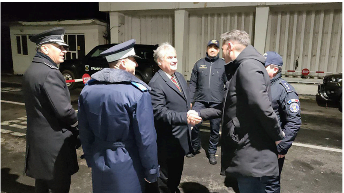
PTF Vama Veche, intrarea în Schengen