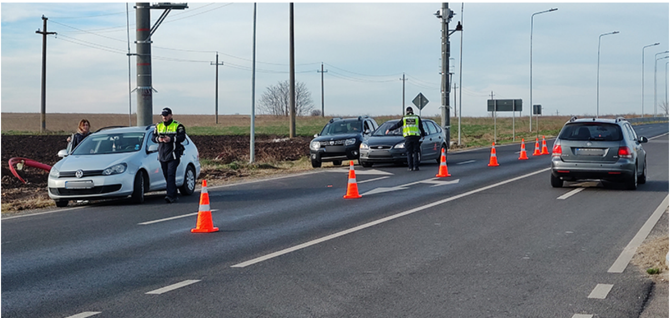
Razie 2 Mai