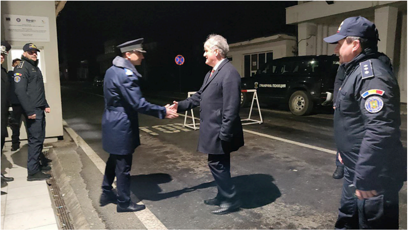
PTF Vama Veche, intrarea în Schengen