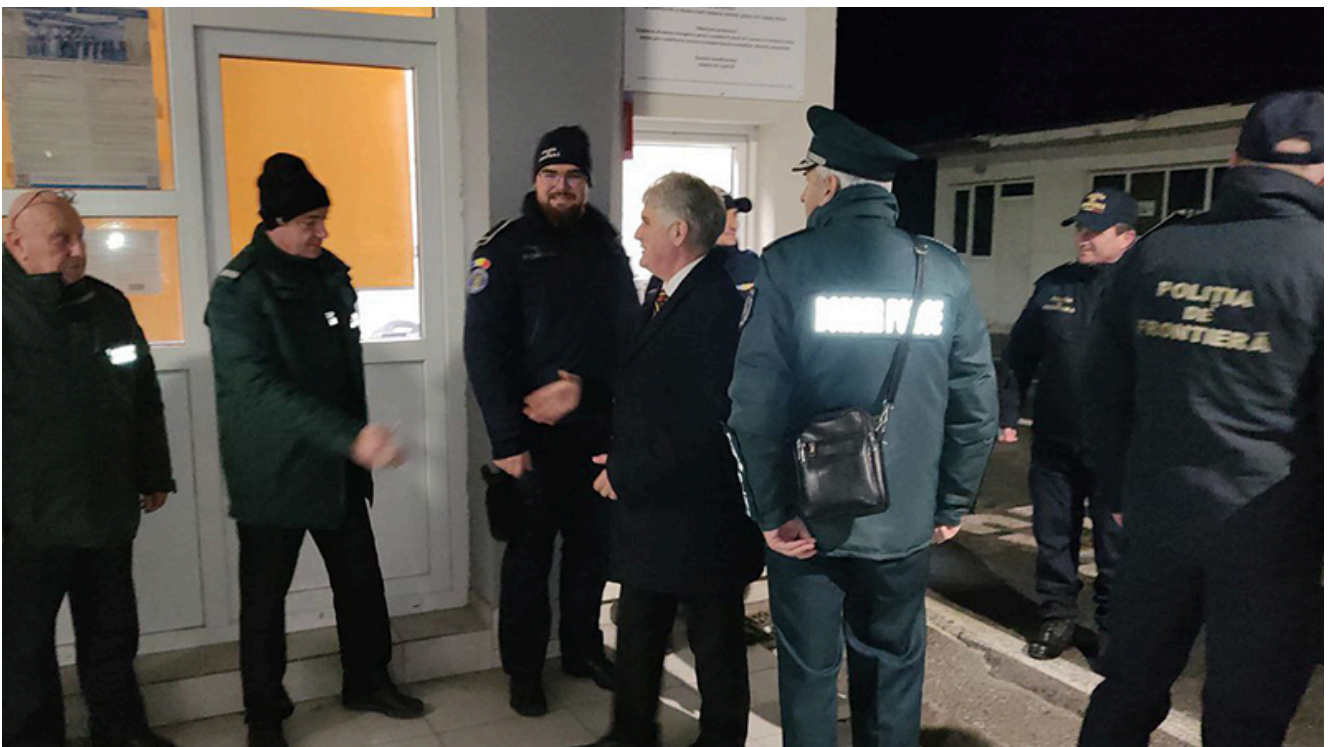
PTF Vama Veche, intrarea în Schengen