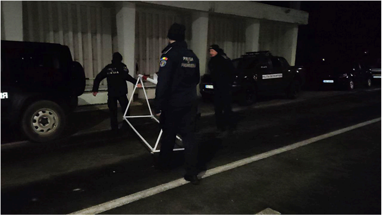
PTF Vama Veche, intrarea în Schengen