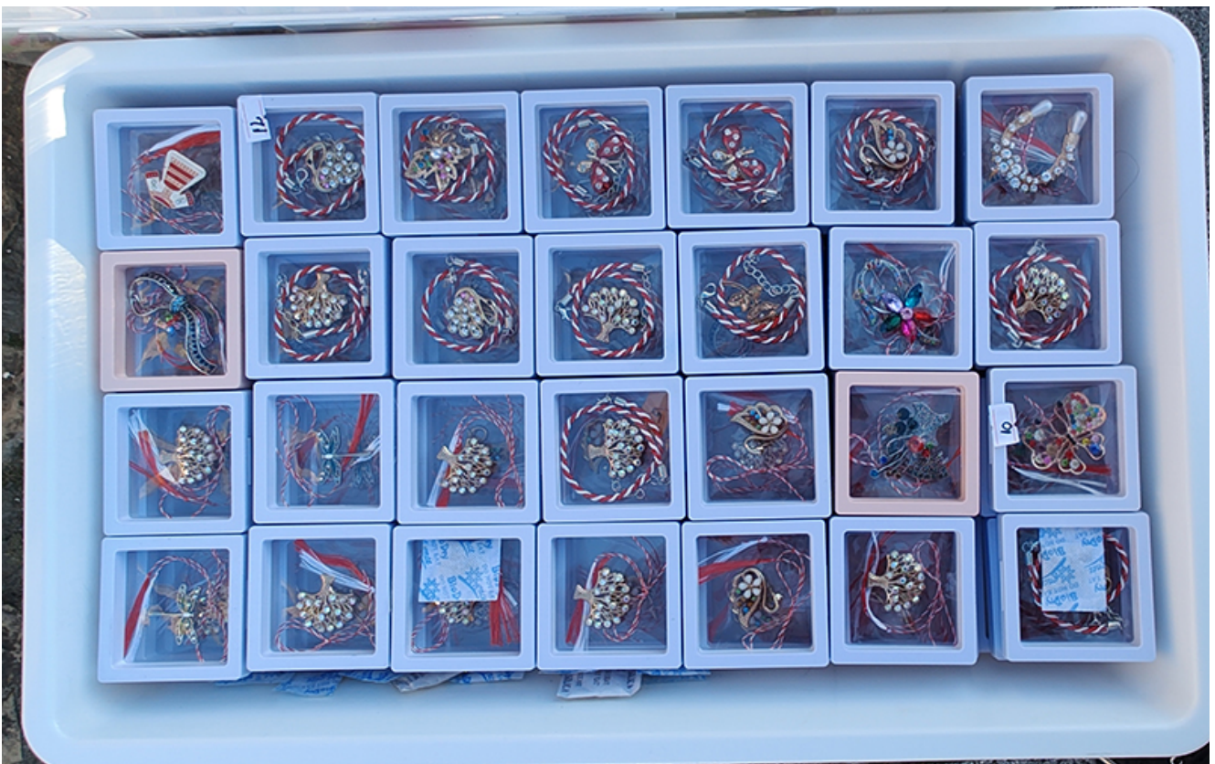
Târg de măștișoare la Mangalia