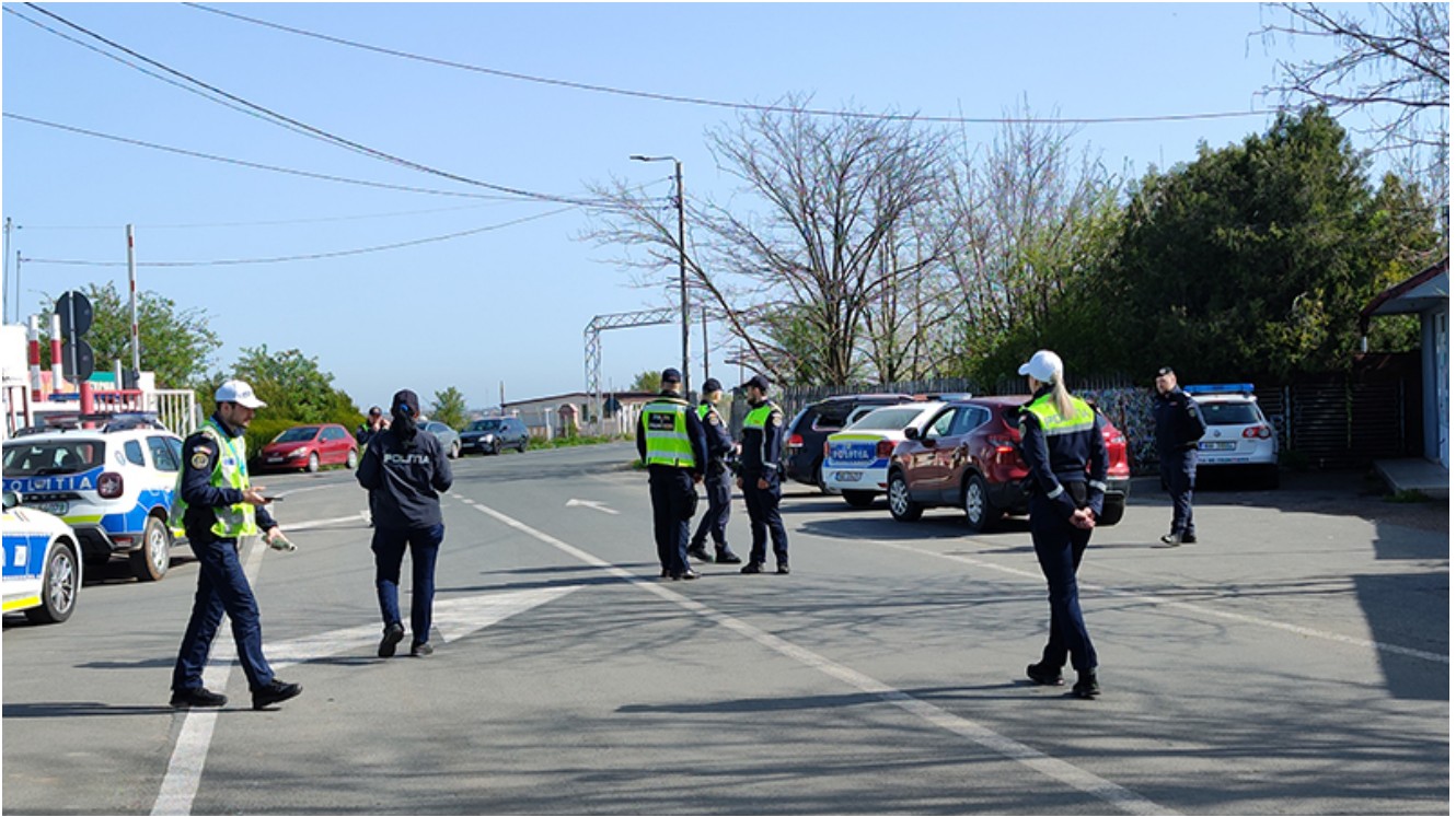
Razii la Vama veche

Astfel, polițiștii rutieri au oprit în trafic autoturismele care au intrat în țară prin localitățile de frontieră Vama Veche și Negru Vodă, șoferii au fost legitimați, iar vehiculele au fost verificate.