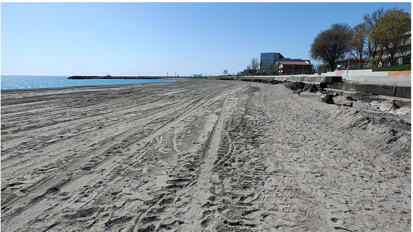
A început procesul de înnisipare în zona Plajei Diana