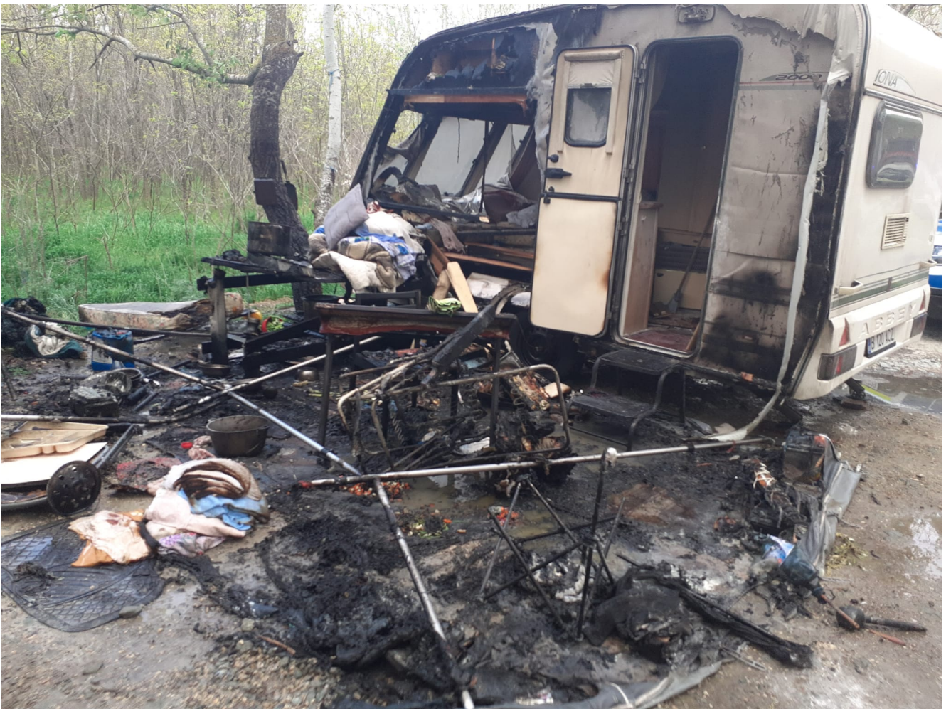
Rulotă incendiată Hârșova

Rulota a ars în proporție de 40%, iar incendiul ar fi pornit de la pavilionul autovehiculului.