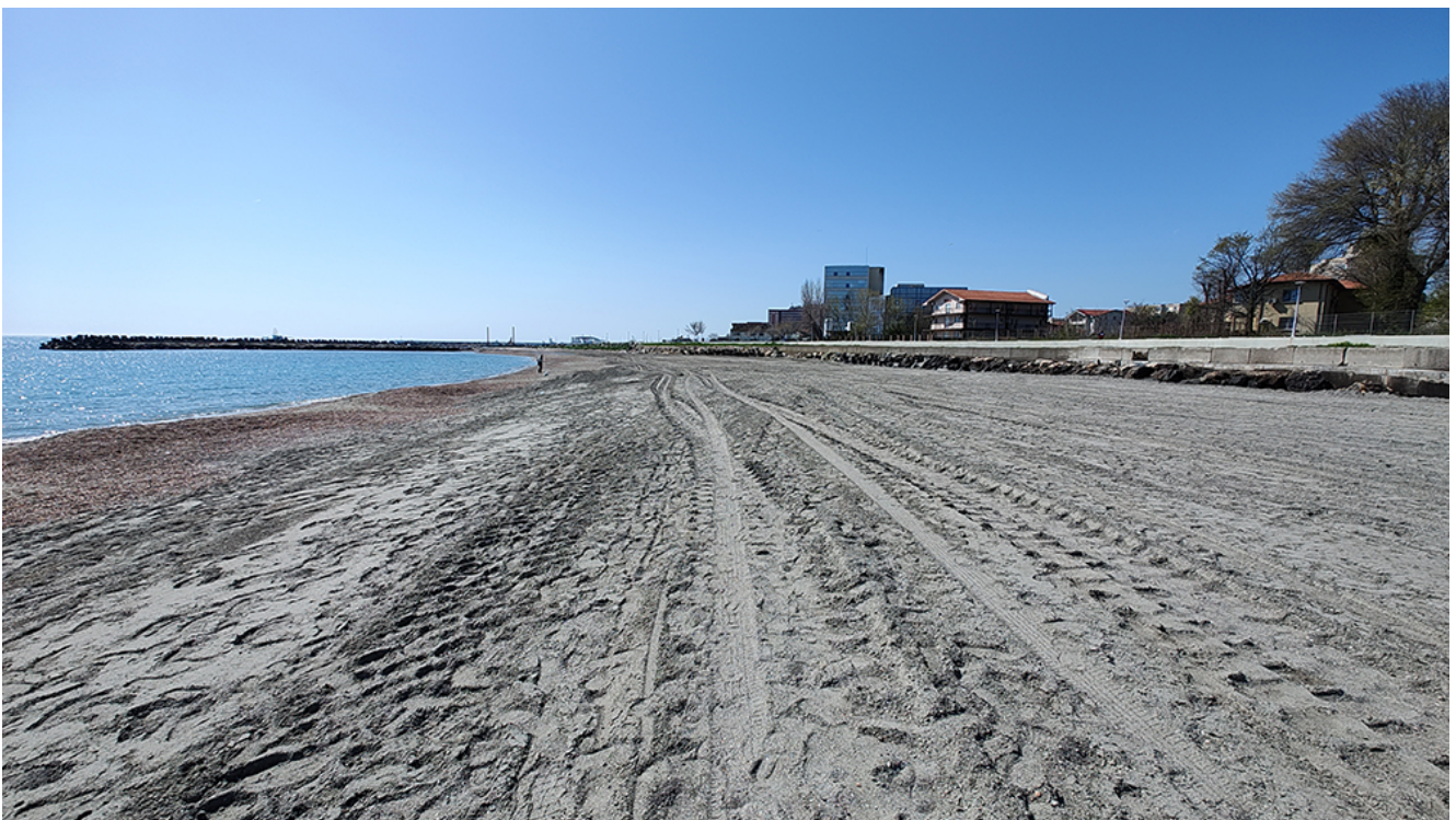
A început procesul de înnisipare în zona Plajei Diana