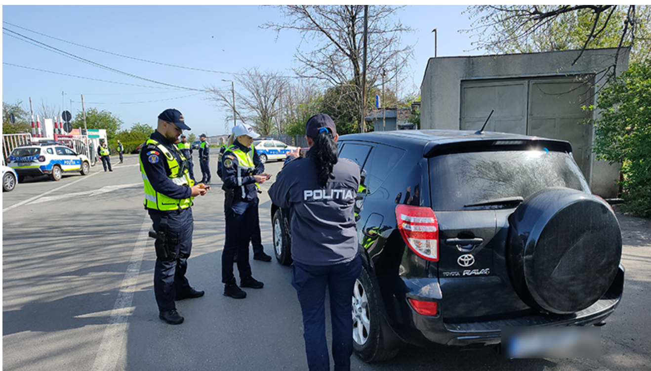
Razii la Vama veche

În contextul aderării pe deplin a României la Spațiul Schengen și al eliminării controalelor la frontierele terestre, anticipăm că în perioada Sărbătorilor Pascale va crește traficul pe principalele artere de circulație dintre cele două state.