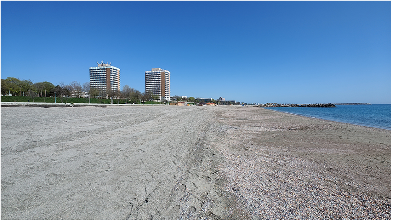
A început procesul de înnisipare în zona Plajei Diana