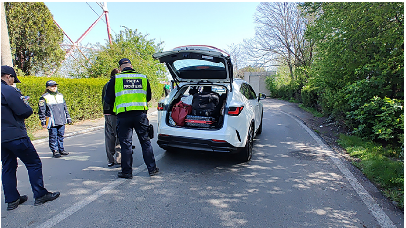
Razii la Vama veche

Astfel, polițiștii rutieri au oprit în trafic autoturismele care au intrat în țară prin localitățile de frontieră Vama Veche și Negru Vodă, șoferii au fost legitimați, iar vehiculele au fost verificate.