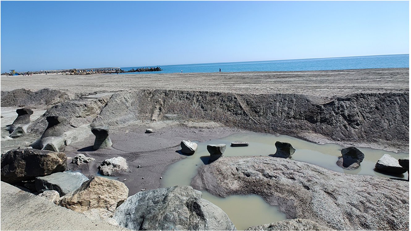
A început procesul de înnisipare în zona Plajei Diana