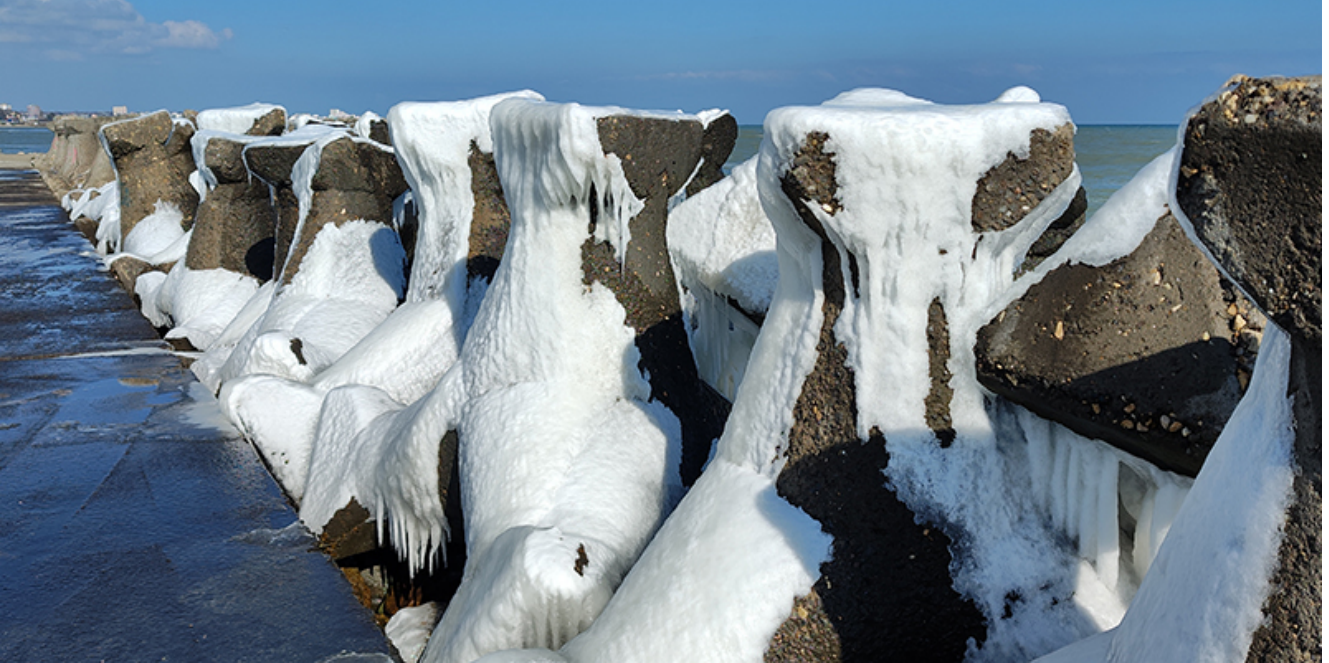
Peisaj glaciari la Mangalia