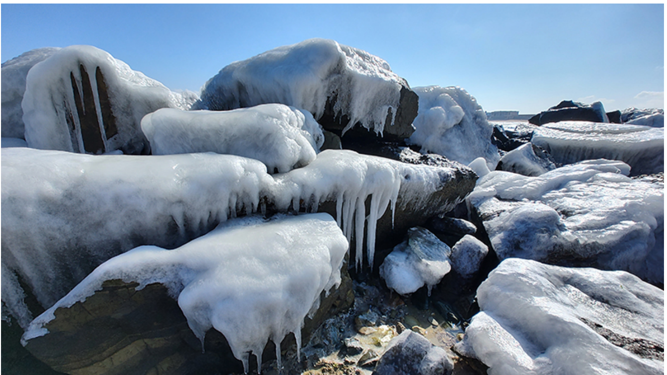
Peisaj glaciari la Mangalia