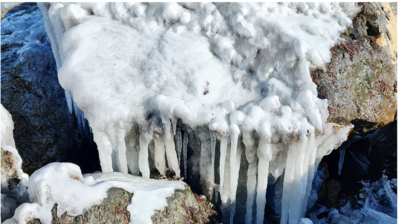
Peisaj glaciari la Mangalia