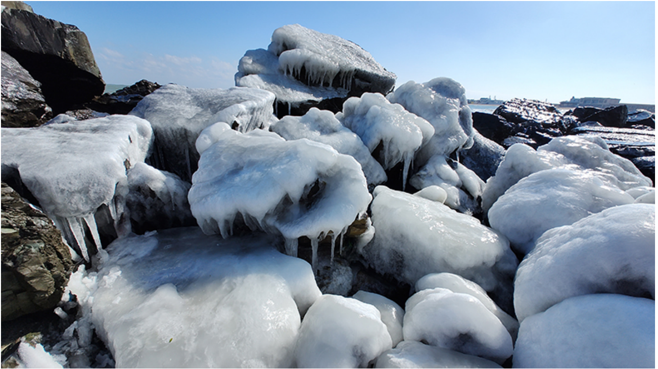
Peisaj glaciari la Mangalia