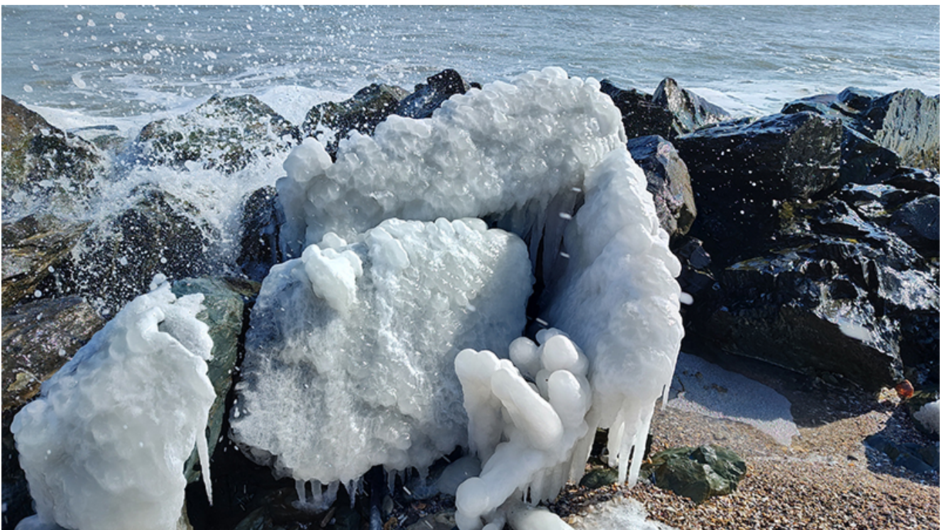
Peisaj glaciari la Mangalia