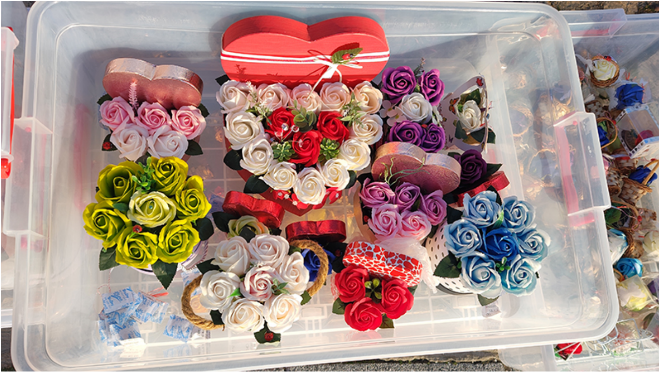
Târg de mărtișoare la Mangalia