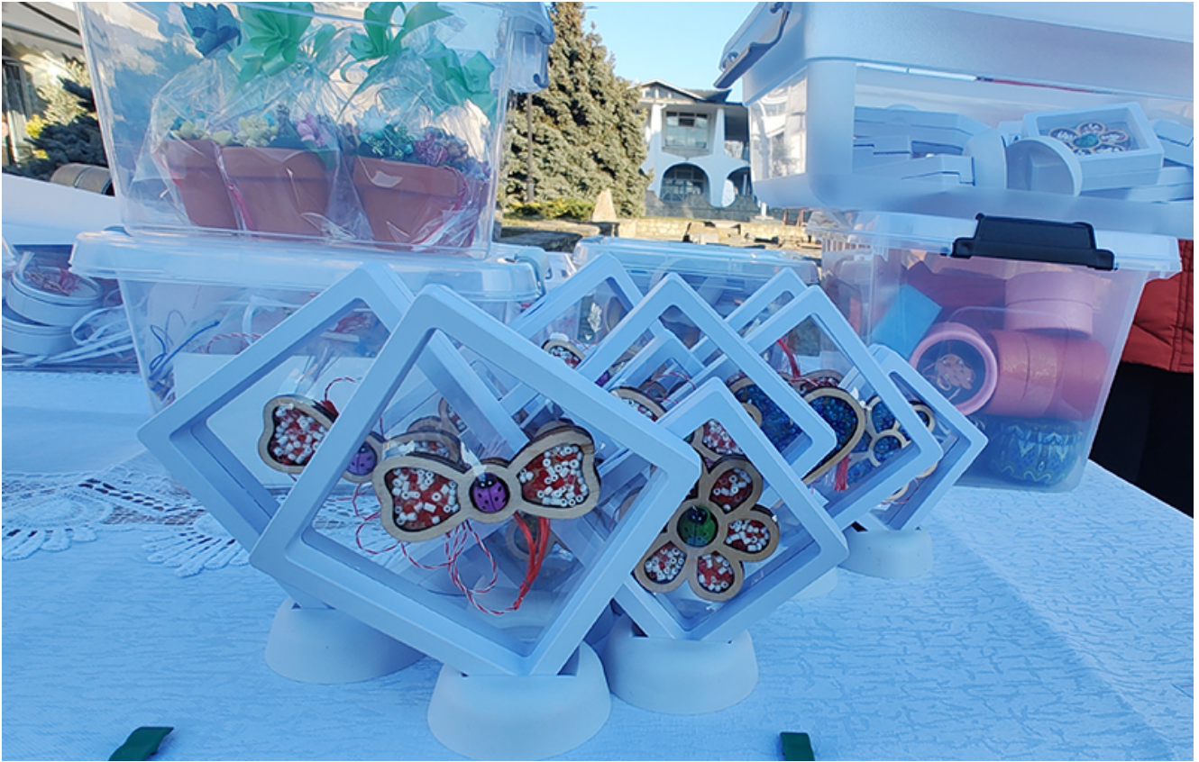
Târg de mărtișoare la Mangalia