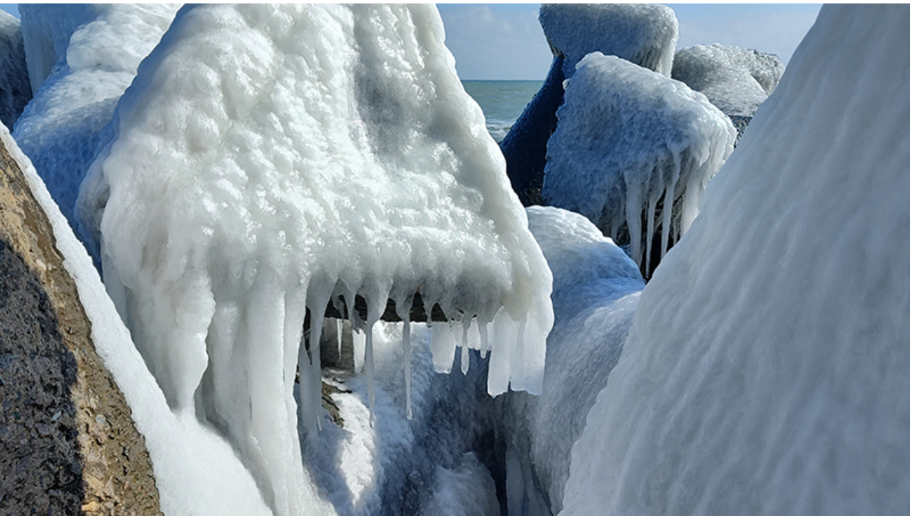
Peisaj glaciari la Mangalia