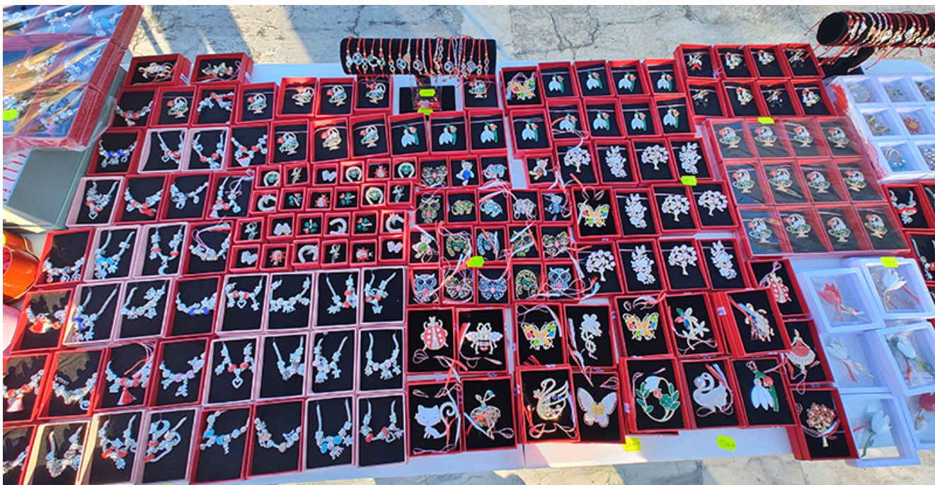
Târg de mărțișoare la Mangalia

Simbol românesc și păstrător al unor mari speranțe pentru noul an, mărțișorul este oferit de comercianții din Mangalia sub forma bijuteriilor din argint, al brățărilor cu șnur alb/roșu al florilor hand made sau