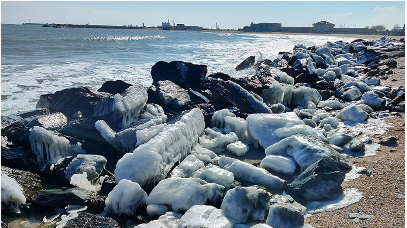
Peisaj glaciari la Mangalia