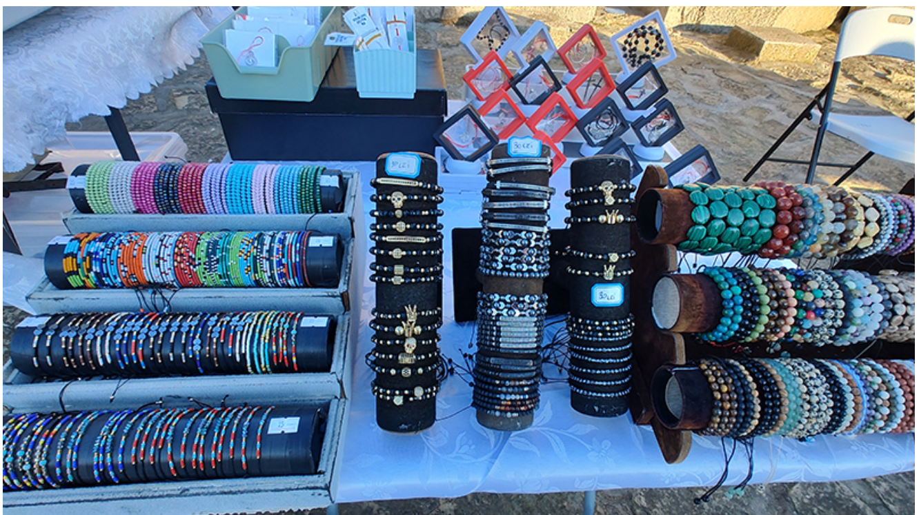
Târg de mărtișoare la Mangalia