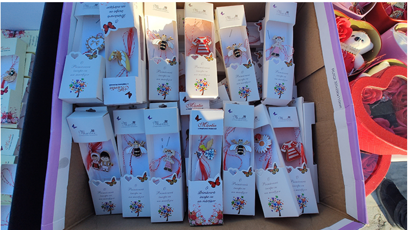
Târg de mărtișoare la Mangalia