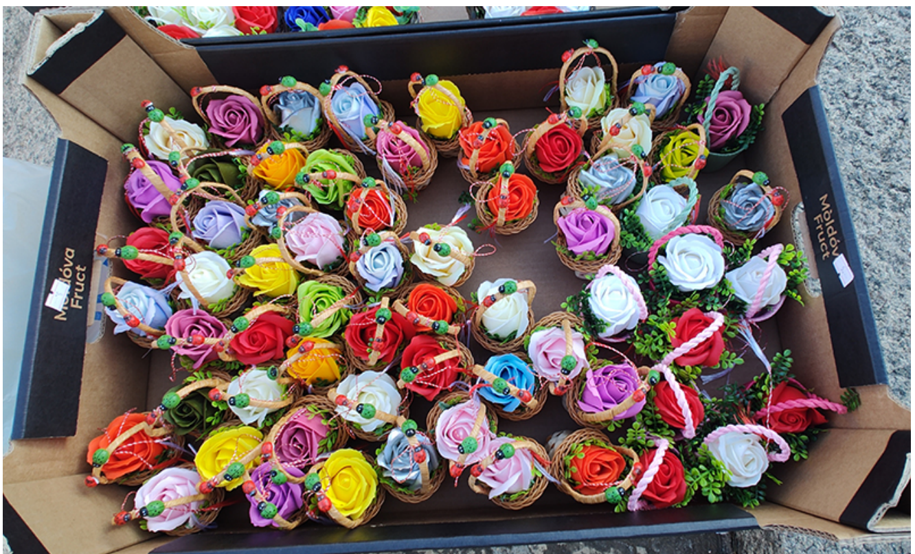
Târg de mărtișoare la Mangalia