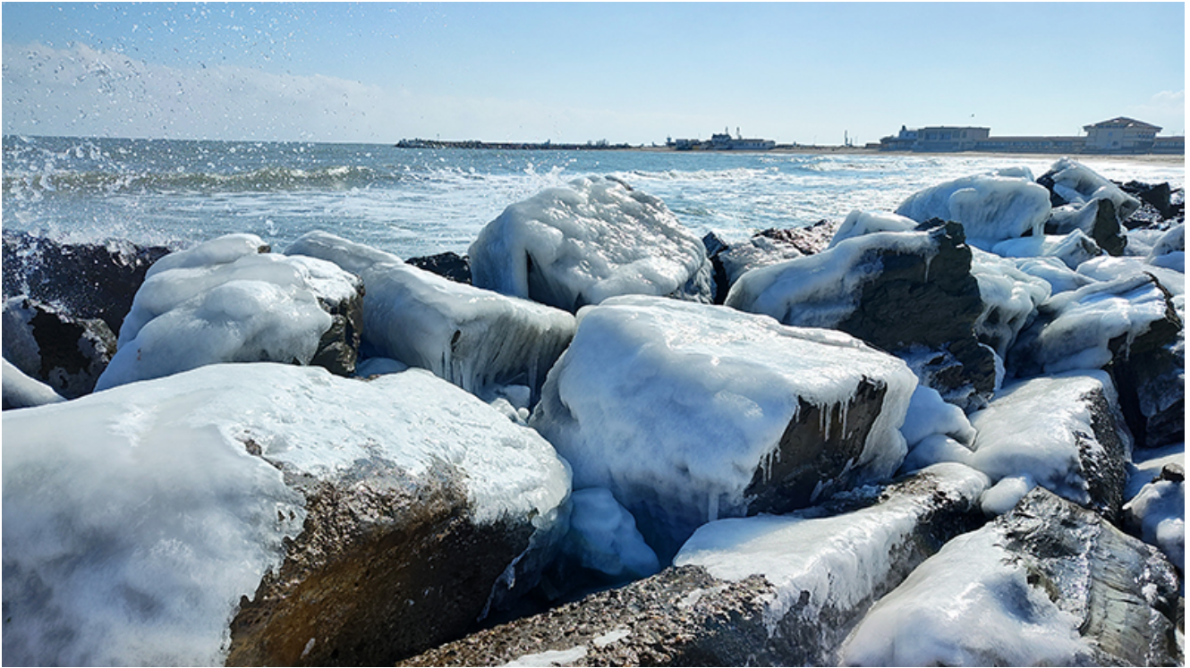
Peisaj glaciari la Mangalia