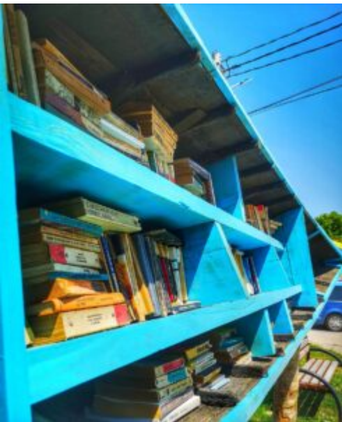
Bărcuța cu cărți