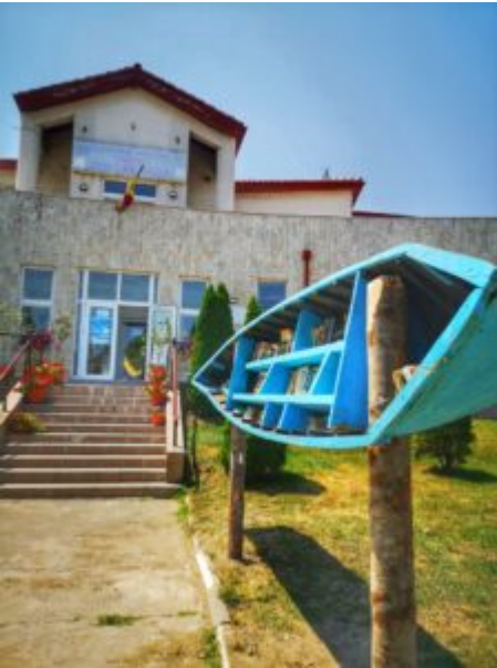
Bărcuța cu cărți