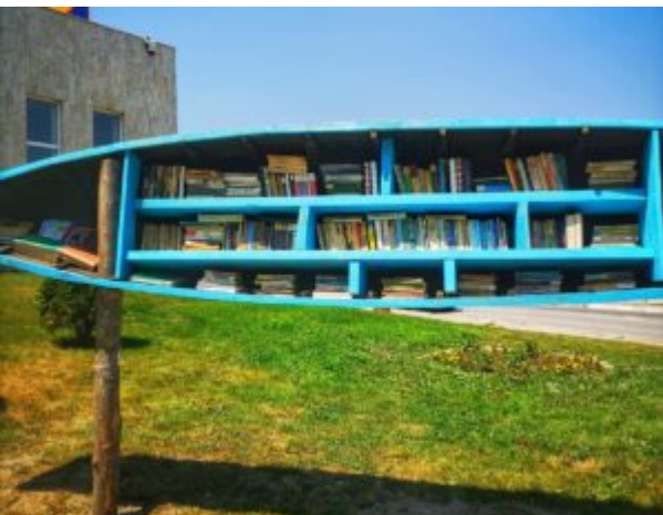
Bărcuța cu cărți