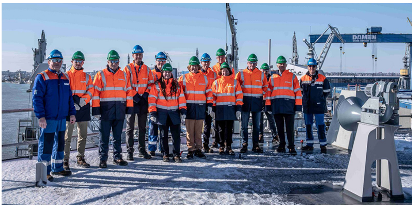
Inaugurare Damen Galați

La șantierul său din Galați, Grupul a investit peste 140 mil EUR de la preluarea acestuia în 1999 și până în prezent. Nivel ridicat de competitivitate a șantierului în această piață globalizată este dovada clară că tradiția celor 130 de ani de excelență în construcții navale rămâne o constantă la mila 80 a Dunării.