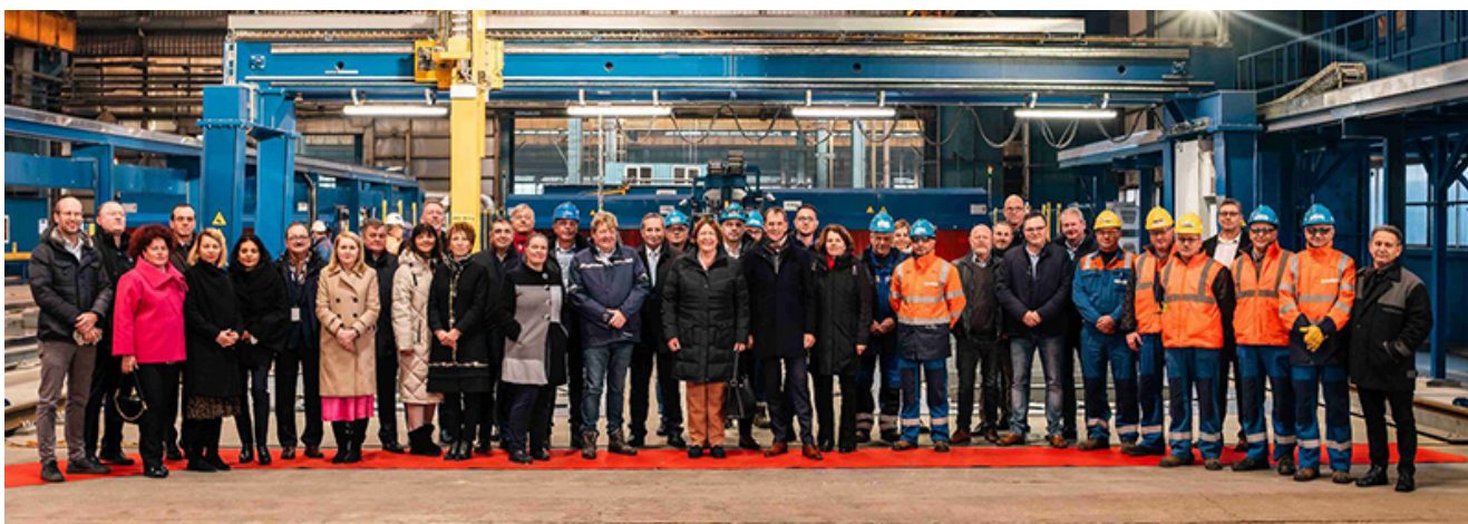
Inaugurare Damen Galați

Înaltul oficial a subliniat faptul că Șantierul Damen de la Galați are un rol important în dezvoltarea mediului de afaceri local și național din industria navală și reprezintă un model de business de performanță, care pune accent atât pe progresul tehnologic, cât și pe valorificarea resursei umane.