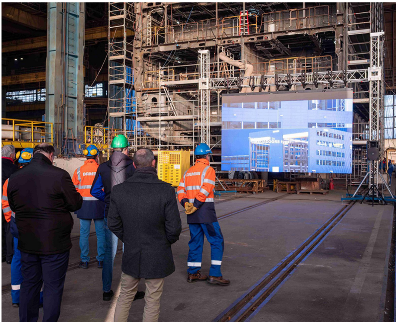
Inaugurare Damen Galați

Investiția în noul sistem a fost finanțată de Exim Banca Românească.