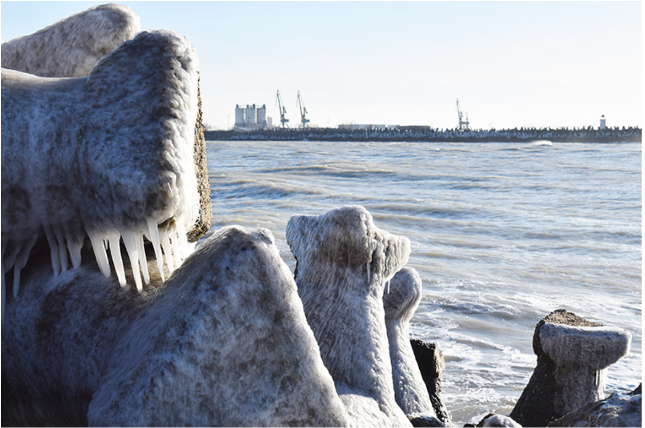
Țurțuri, iarna la Mangalia