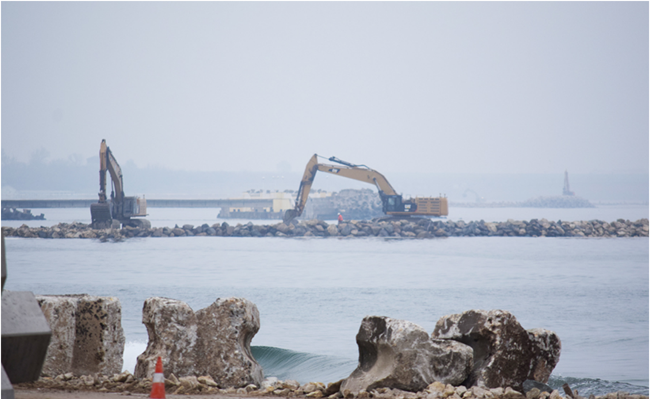
Lucrările de lărgire a plajelor din sudul litoralului