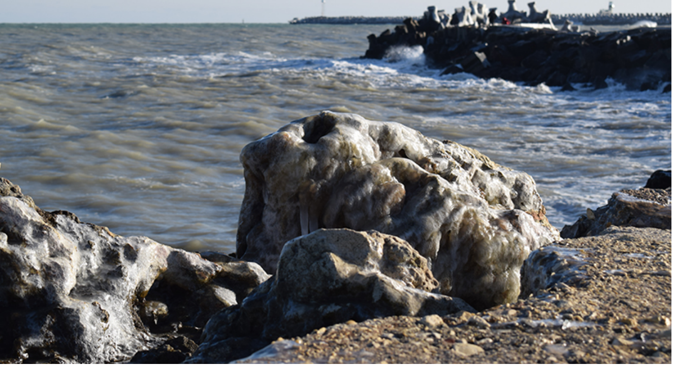
Țurțuri, iarna la Mangalia