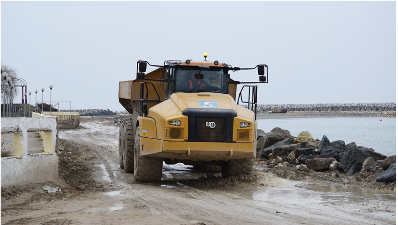
Lucrările de lărgire a plajelor din sudul litoralului