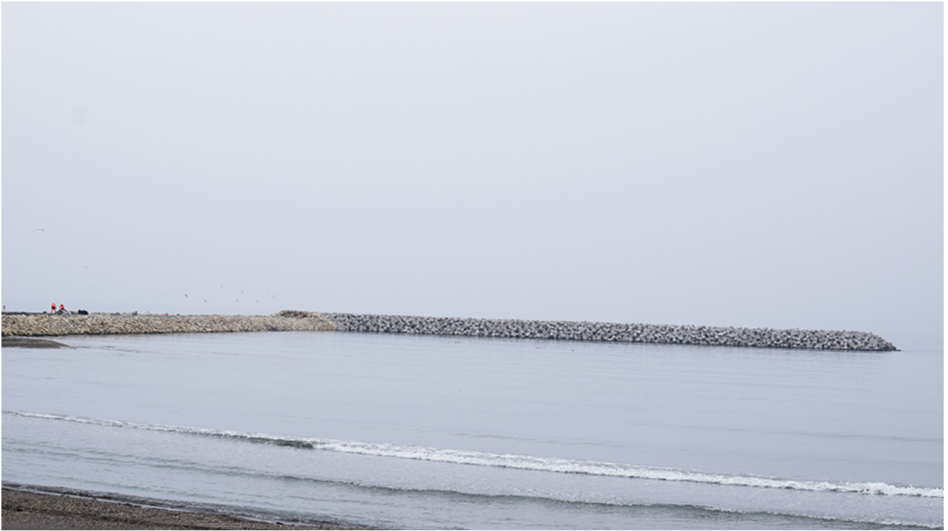
Lucrările de lărgire a plajelor din sudul litoralului