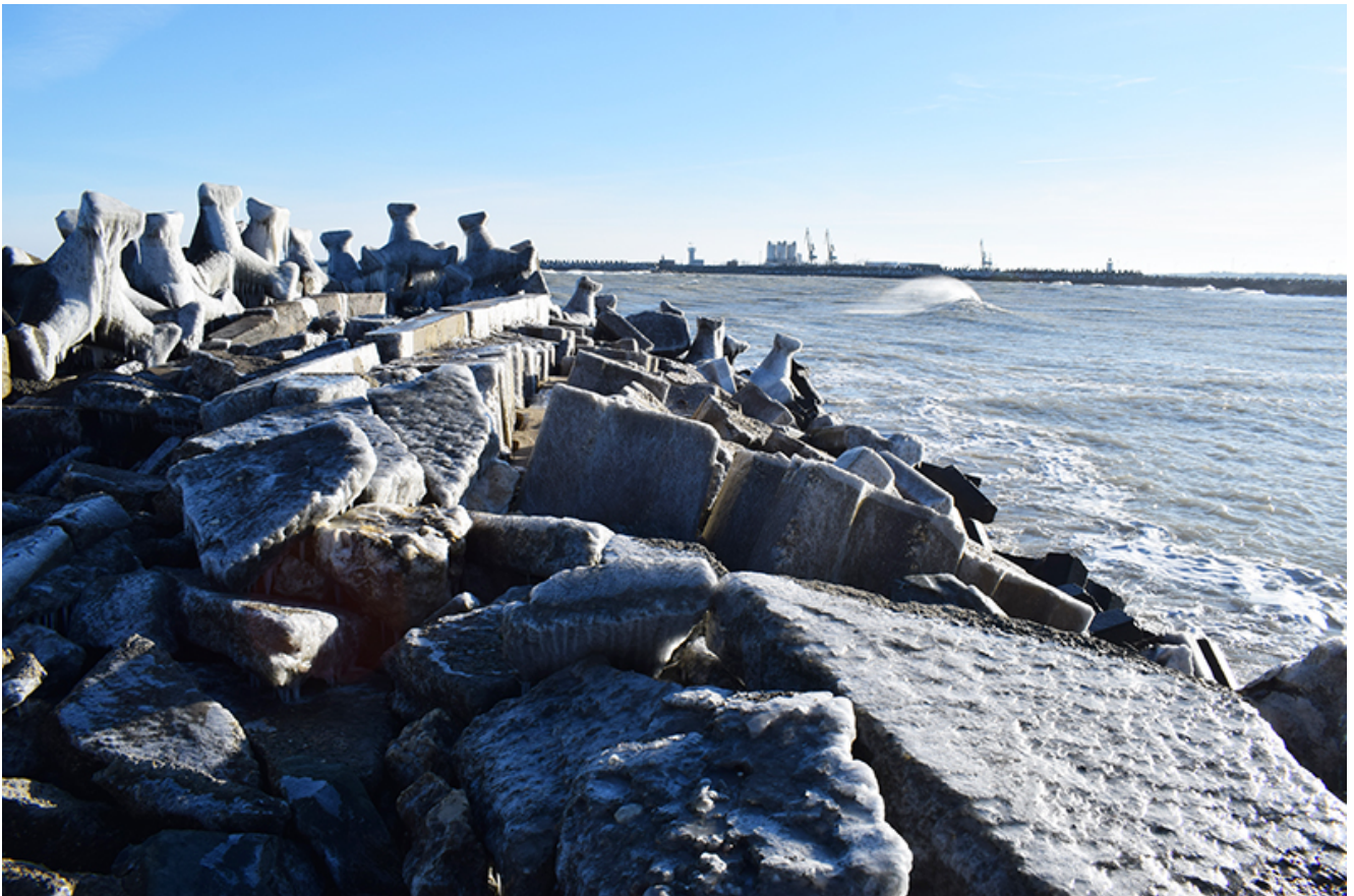
Țurțuri, iarna la Mangalia