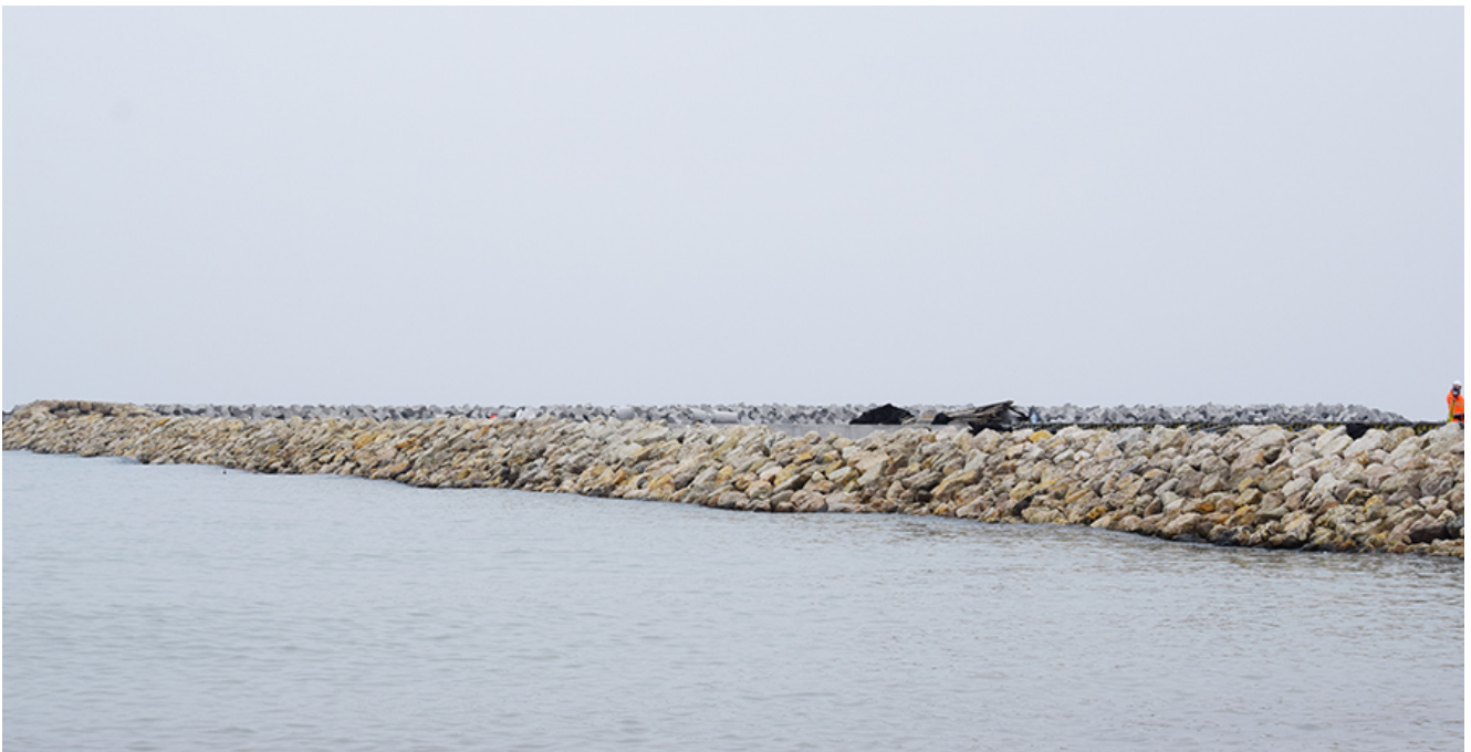
Lucrările de lărgire a plajelor din sudul litoralului