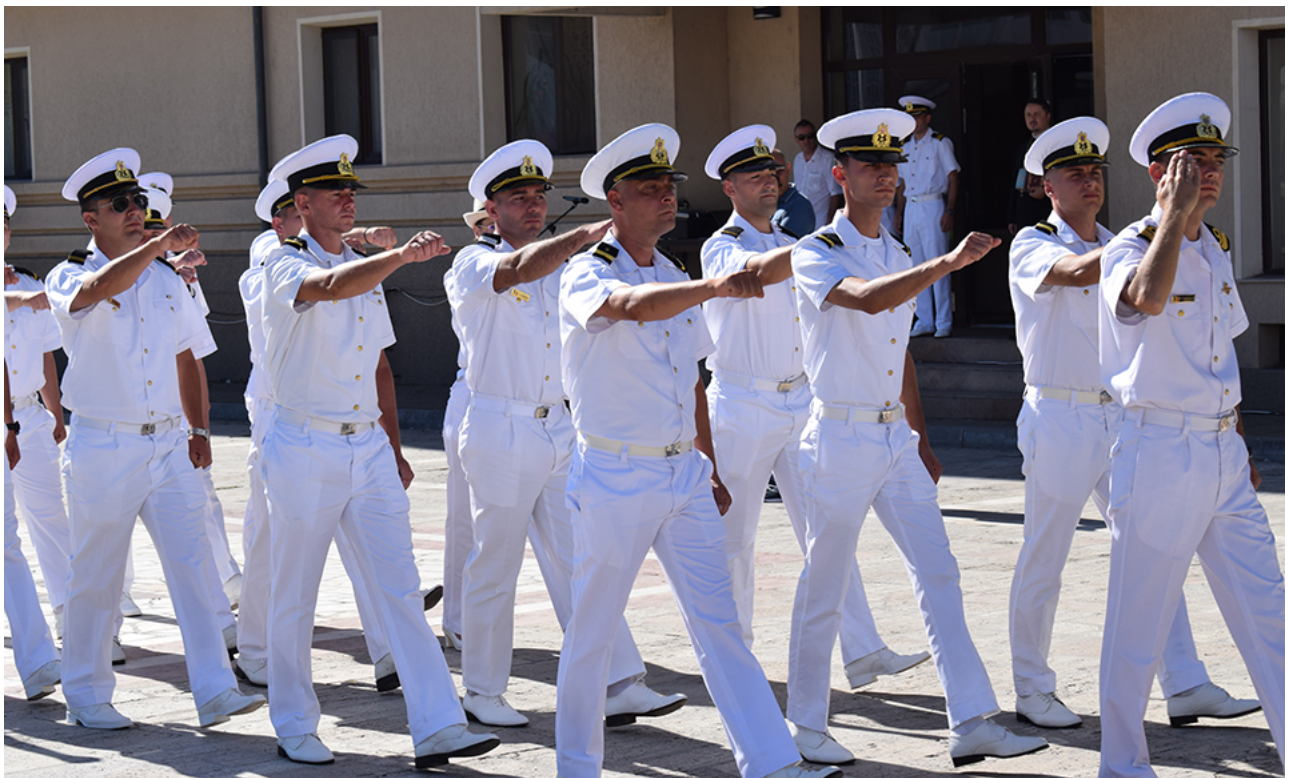
Ziua imnului la Mangalia