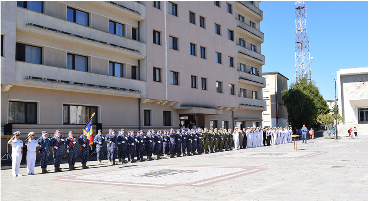
Ziua imnului la Mangalia