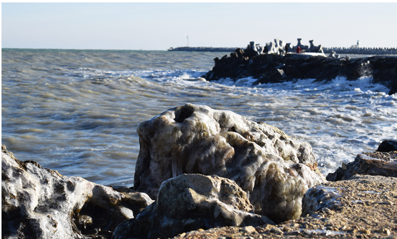
Țurțuri, iarna la Mangalia