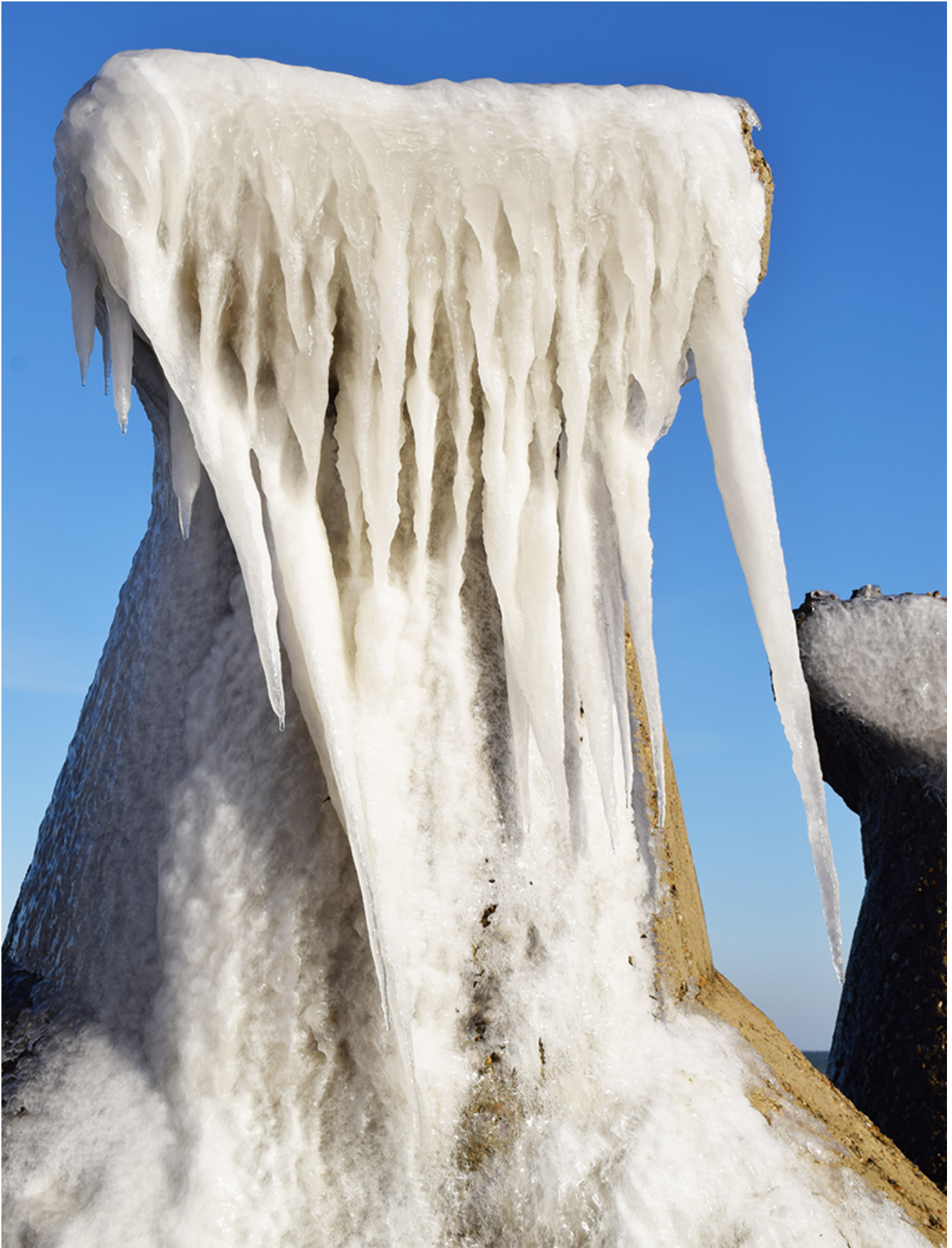
Țurțuri, iarna la Mangalia