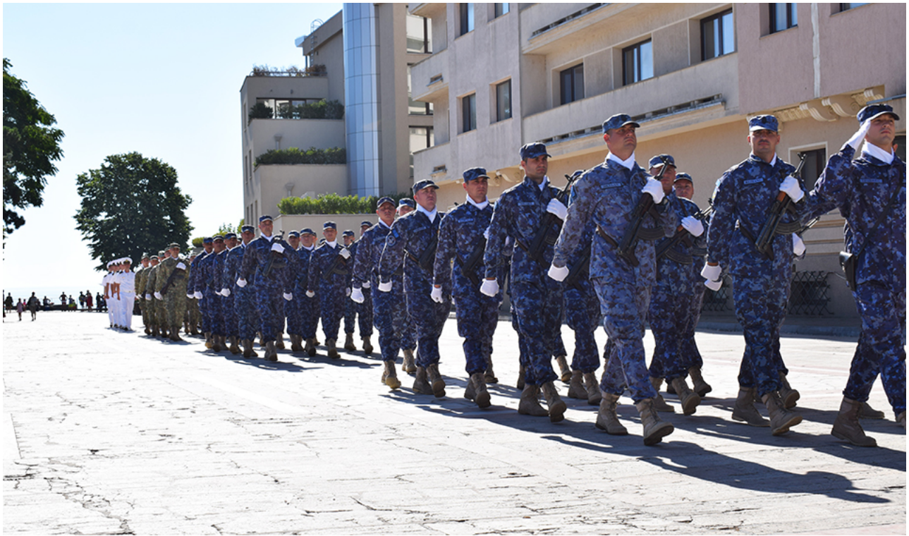
Ziua imnului la Mangalia