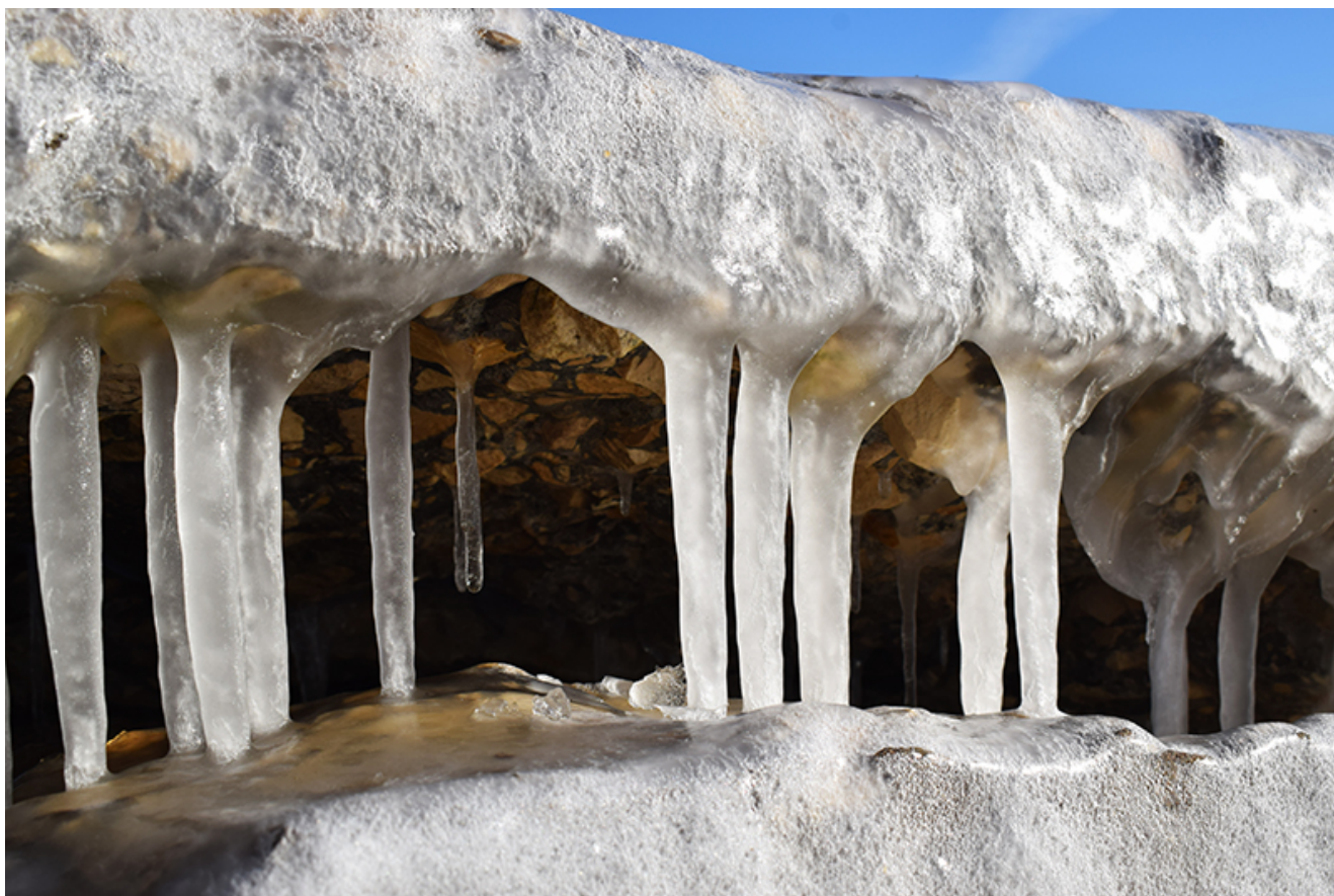
Țurțuri, iarna la Mangalia