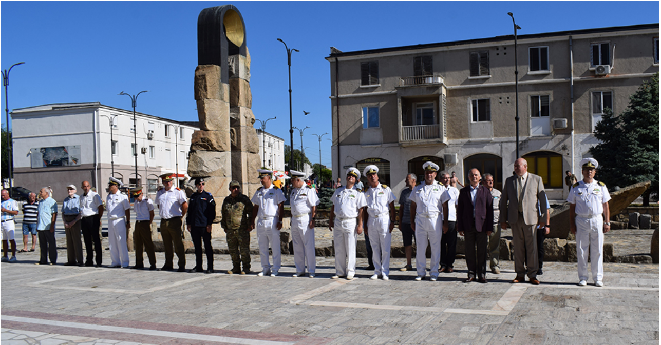
Ziua imnului la Mangalia