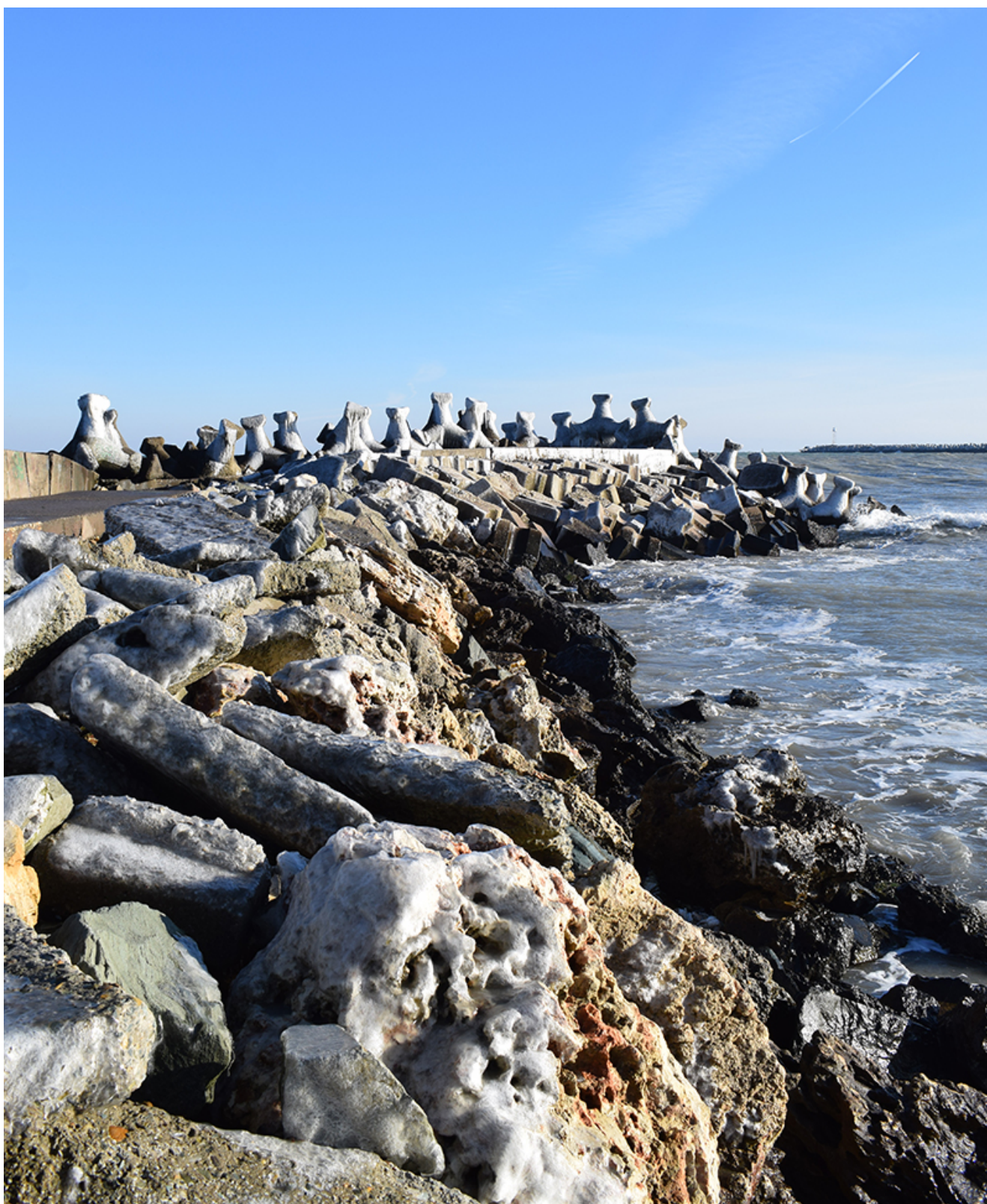
Țurțuri, iarna la Mangalia