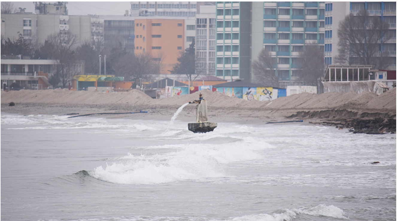
Lucrările de lărgire a plajelor din sudul litoralului