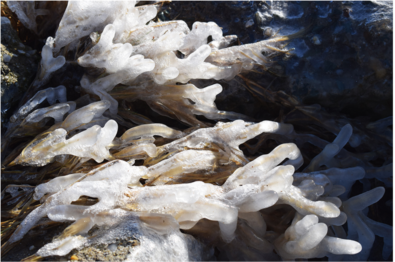
Țurțuri, iarna la Mangalia