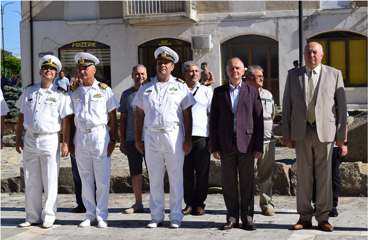
Ziua imnului la Mangalia