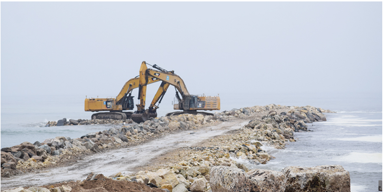
Lucrările de lărgire a plajelor din sudul litoralului