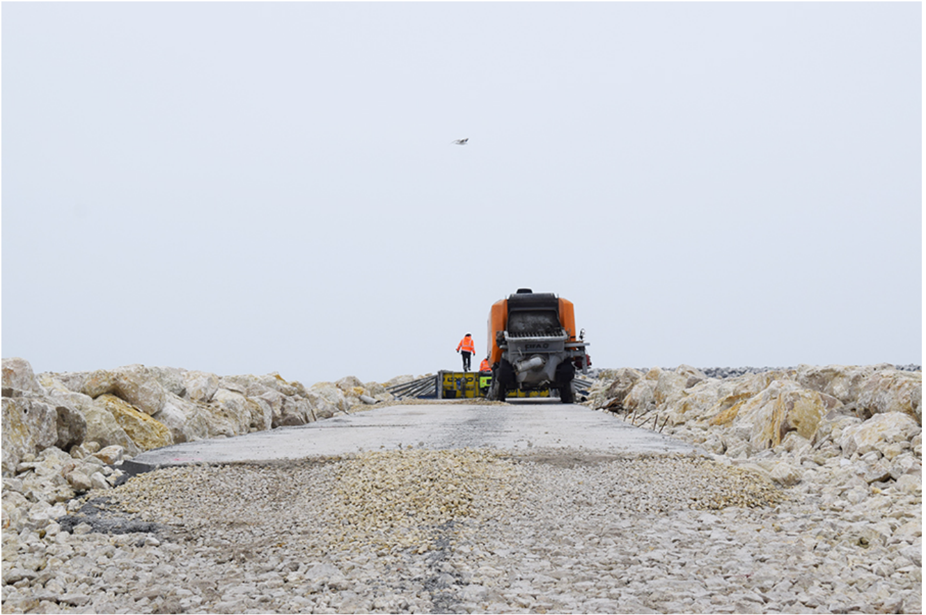
Lucrările de lărgire a plajelor din sudul litoralului