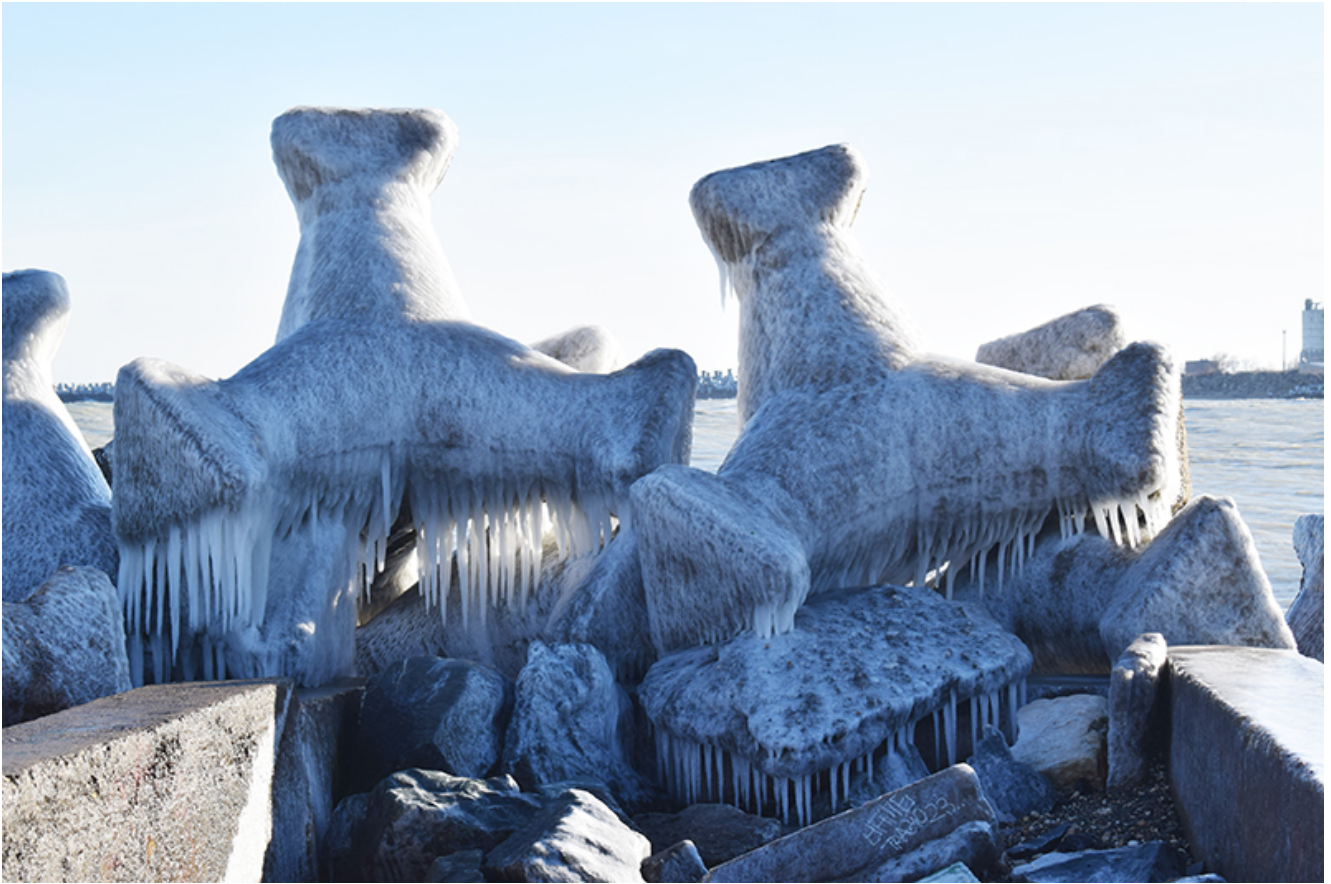
Țurțuri, iarna la Mangalia