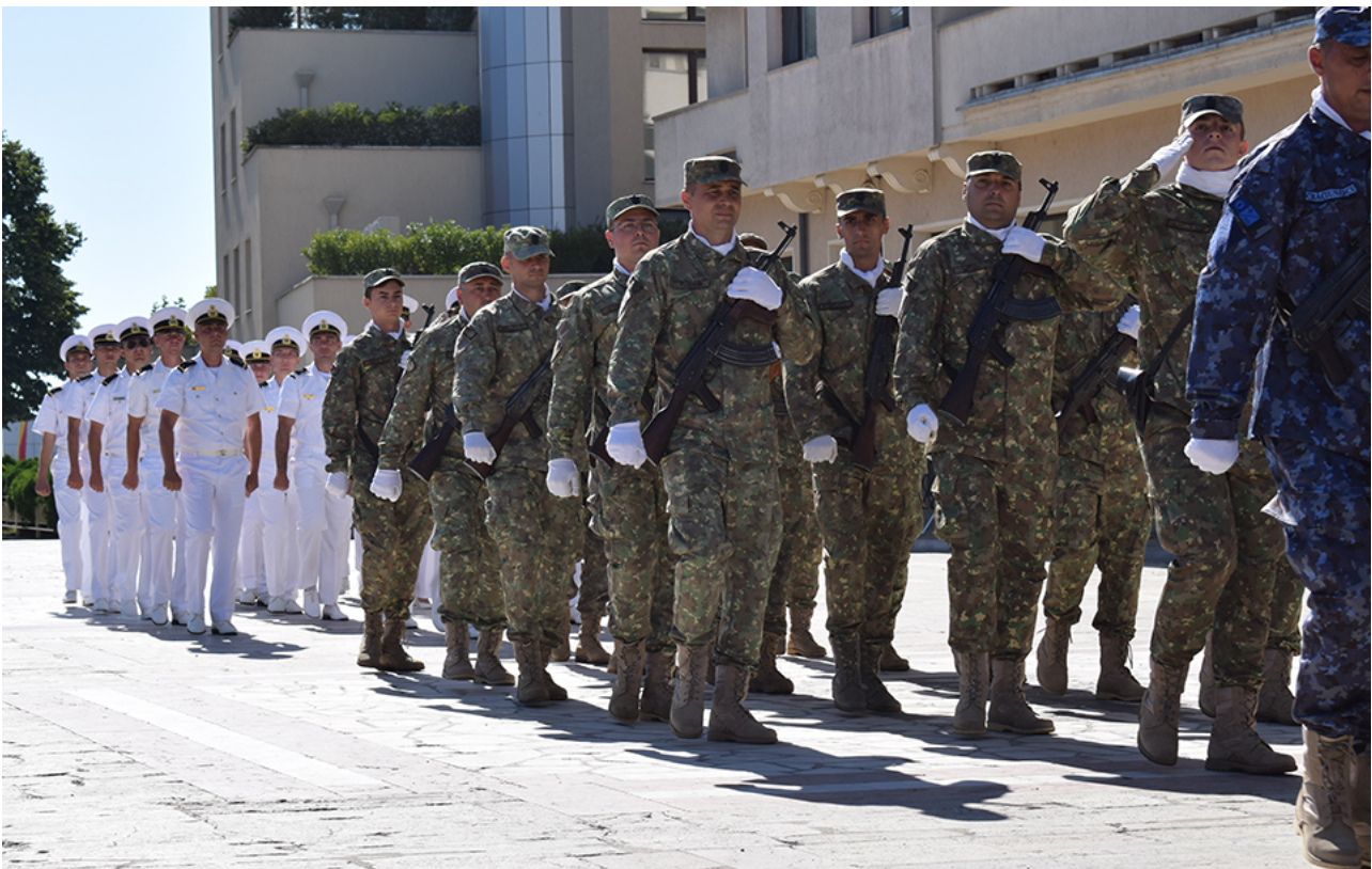
Ziua imnului la Mangalia