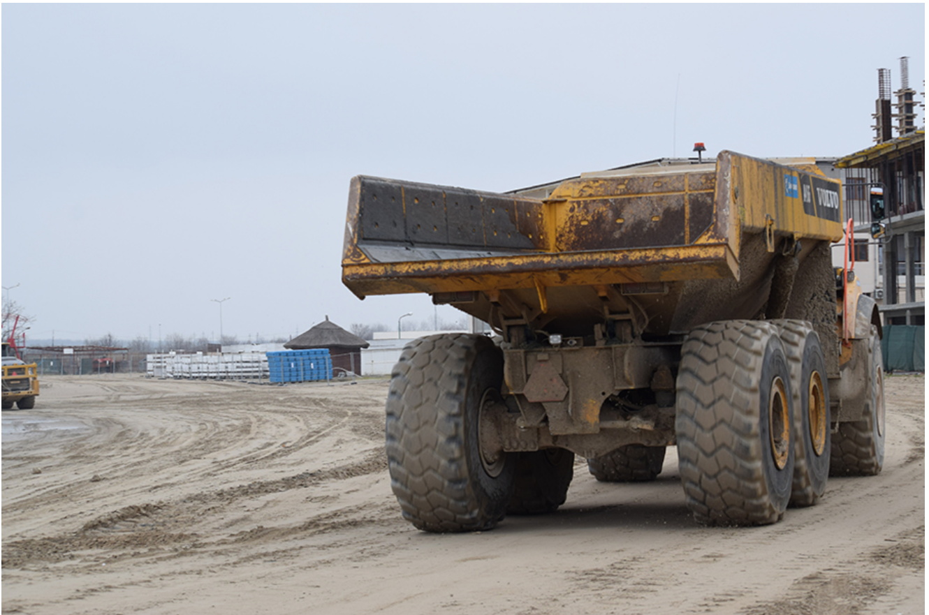
Lucrările de lărgire a plajelor din sudul litoralului