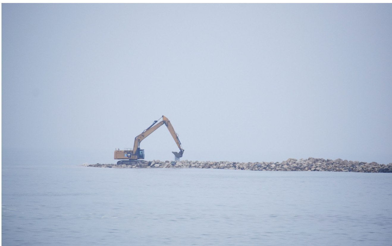
Lucrările de lărgire a plajelor din sudul litoralului

Valoare totală a proiectului este de 3.805.641.721,67 lei, din care 85% reprezintă cofinanțarea acordată de Uniunea Europeană.