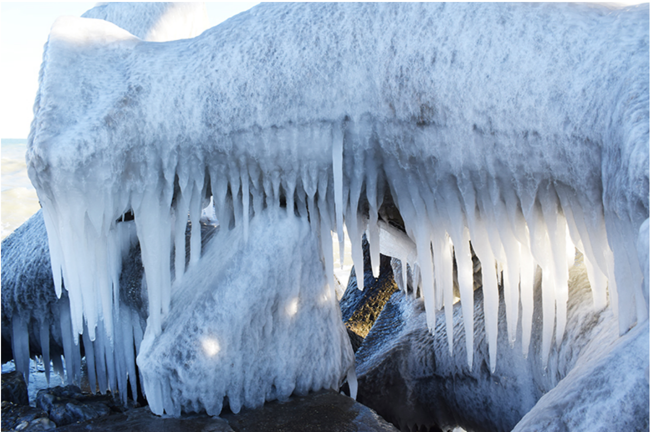
Țurțuri, iarna la Mangalia