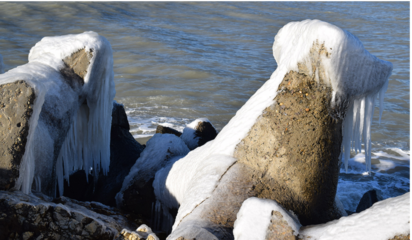
Țurțuri, iarna la Mangalia