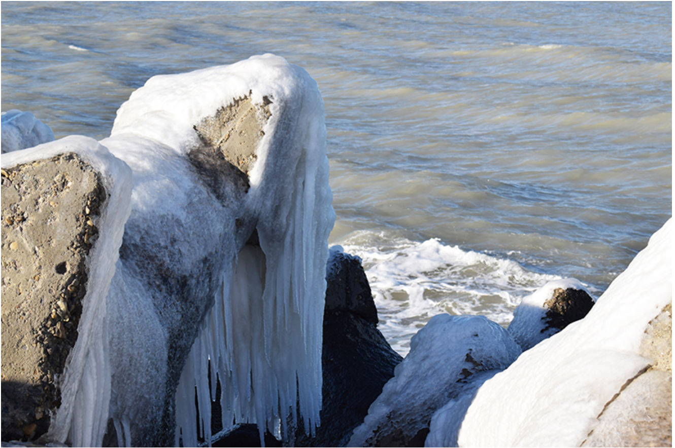
Țurțuri, iarna la Mangalia