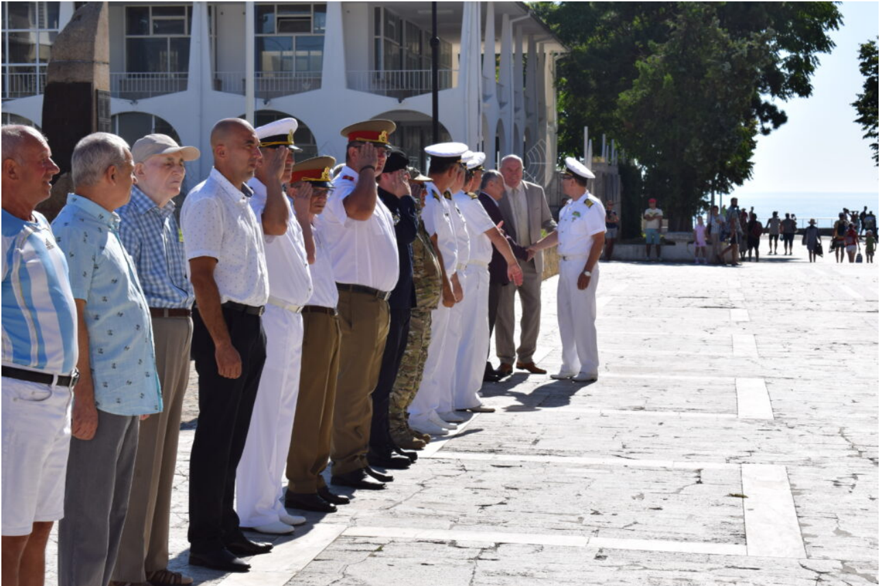
Ziua imnului la Mangalia

(Galerie FOTO) Trei pescadorean au fost depistate la pescuit ilegal în zona economică exclusivă a României în Marea Neagră