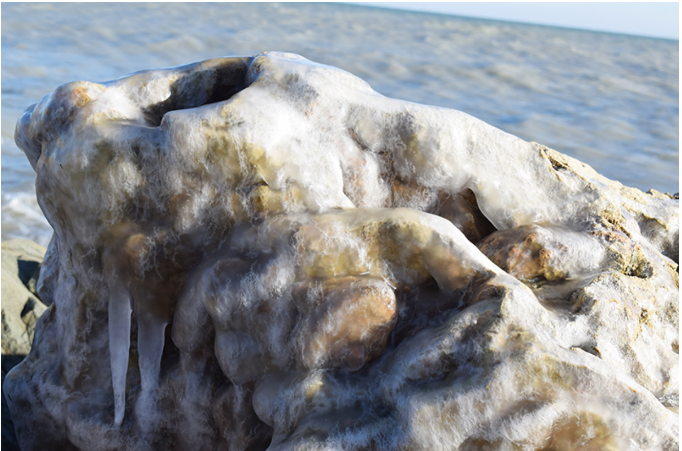
Țurțuri, iarna la Mangalia