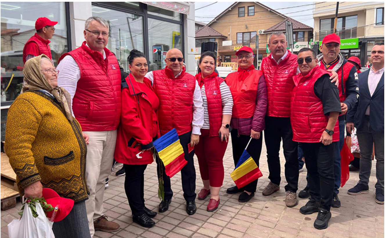
PSD la Tuzla