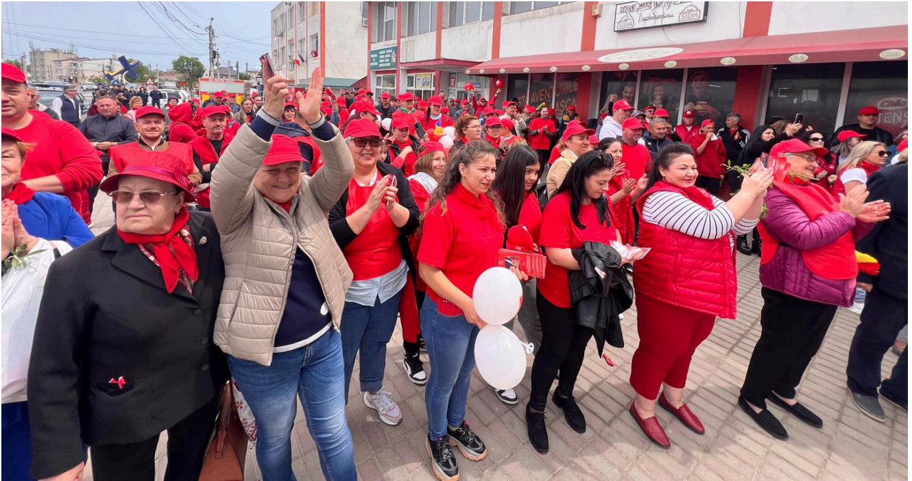
PSD la Tuzla