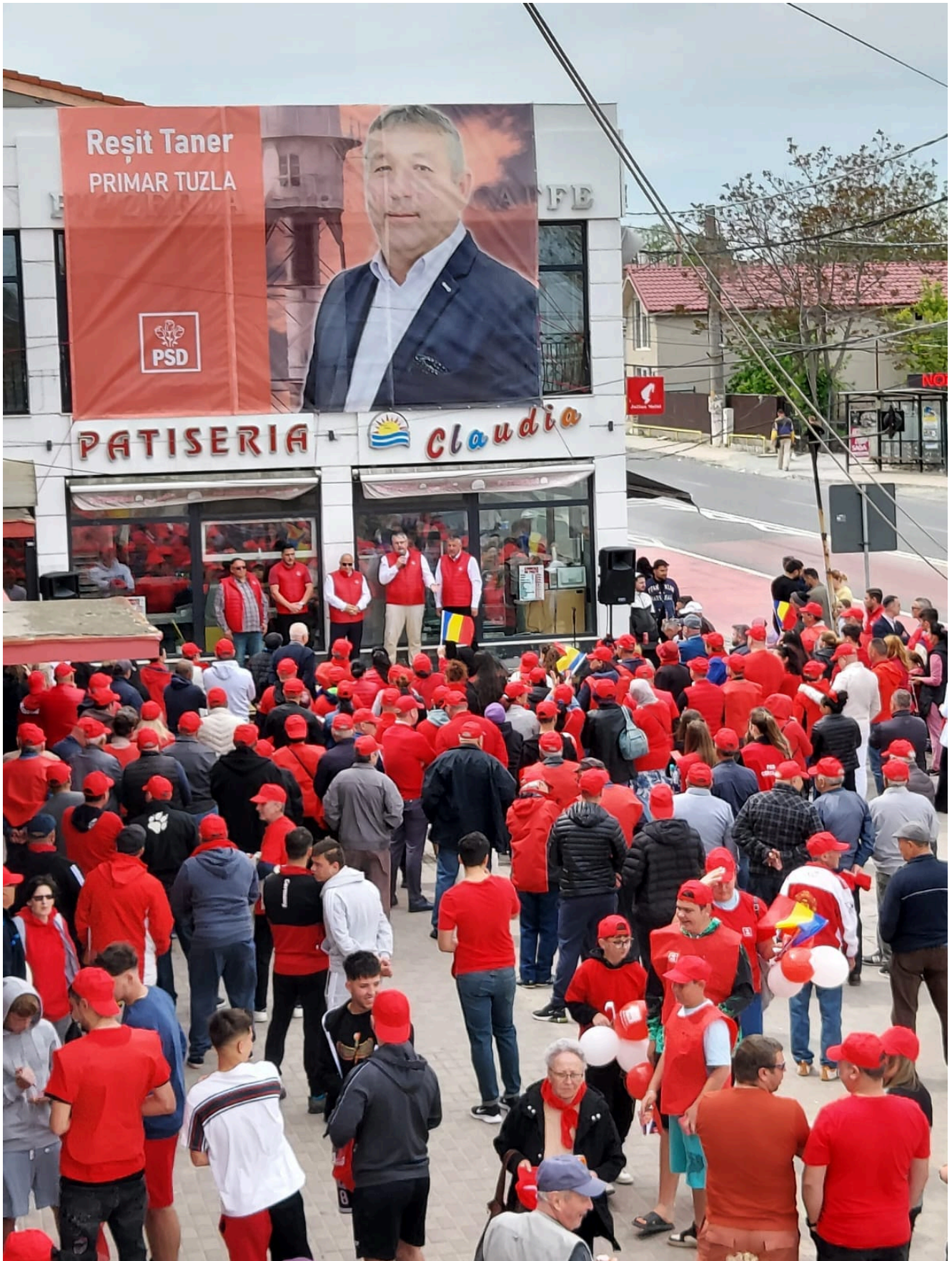
PSD la Tuzla