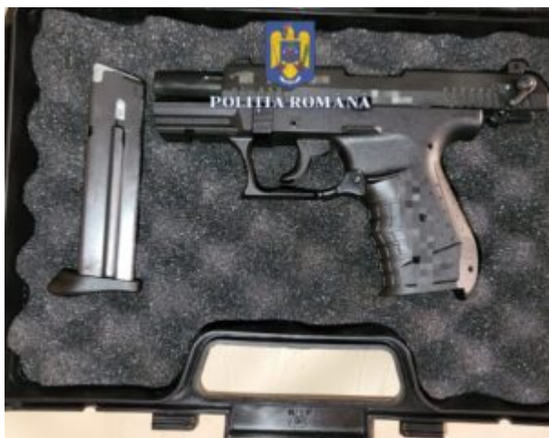
Caz proxeneți Constanța

Acțiunea a beneficiat de sprijinul lupătorilor din cadrul Serviciului pentru Acțiuni Speciale din cadrul Inspectoratului de Poliție Județean Constanța și jandarmilor din cadrul Grupării de Jandarmi Mobile „Tomis” Constanța.