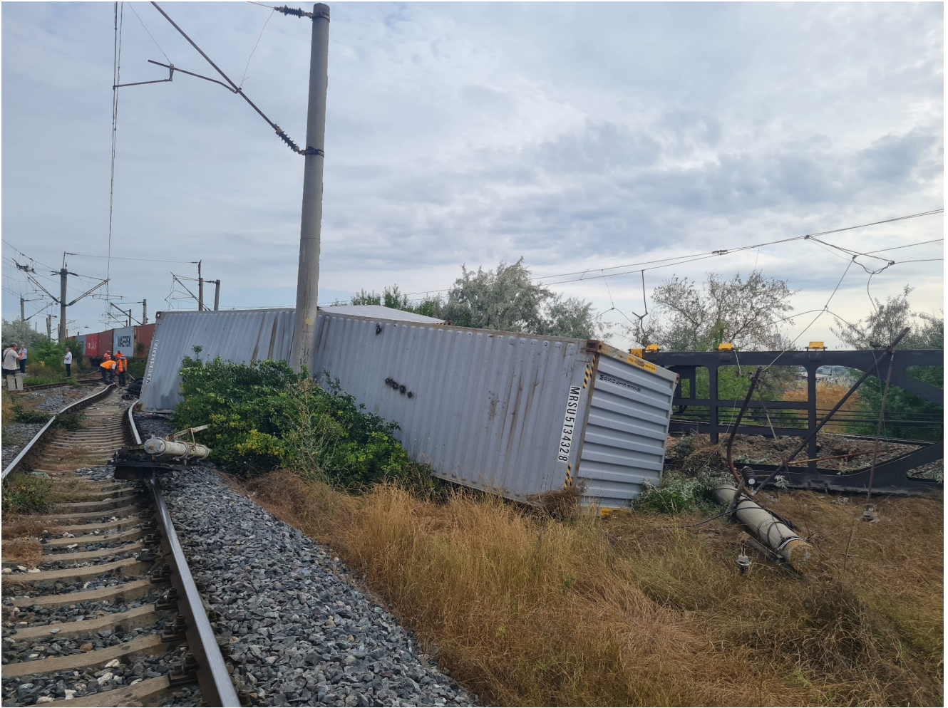
Mai multe vagoane ale unui tren s-au RĂSTURNAT