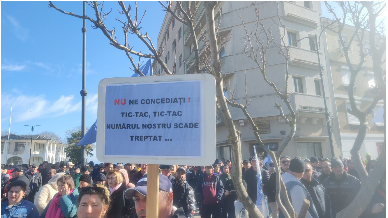
Protest Damen Mangalia