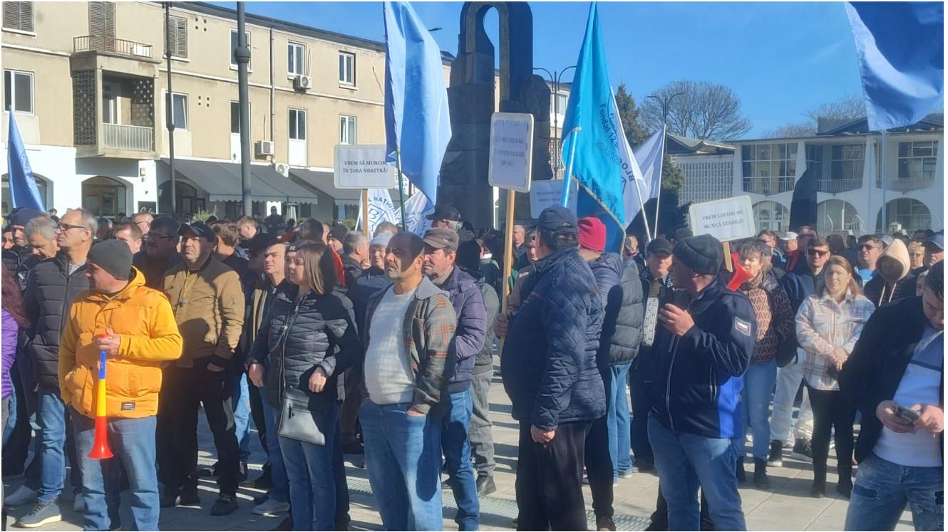
Protest Damen Mangalia