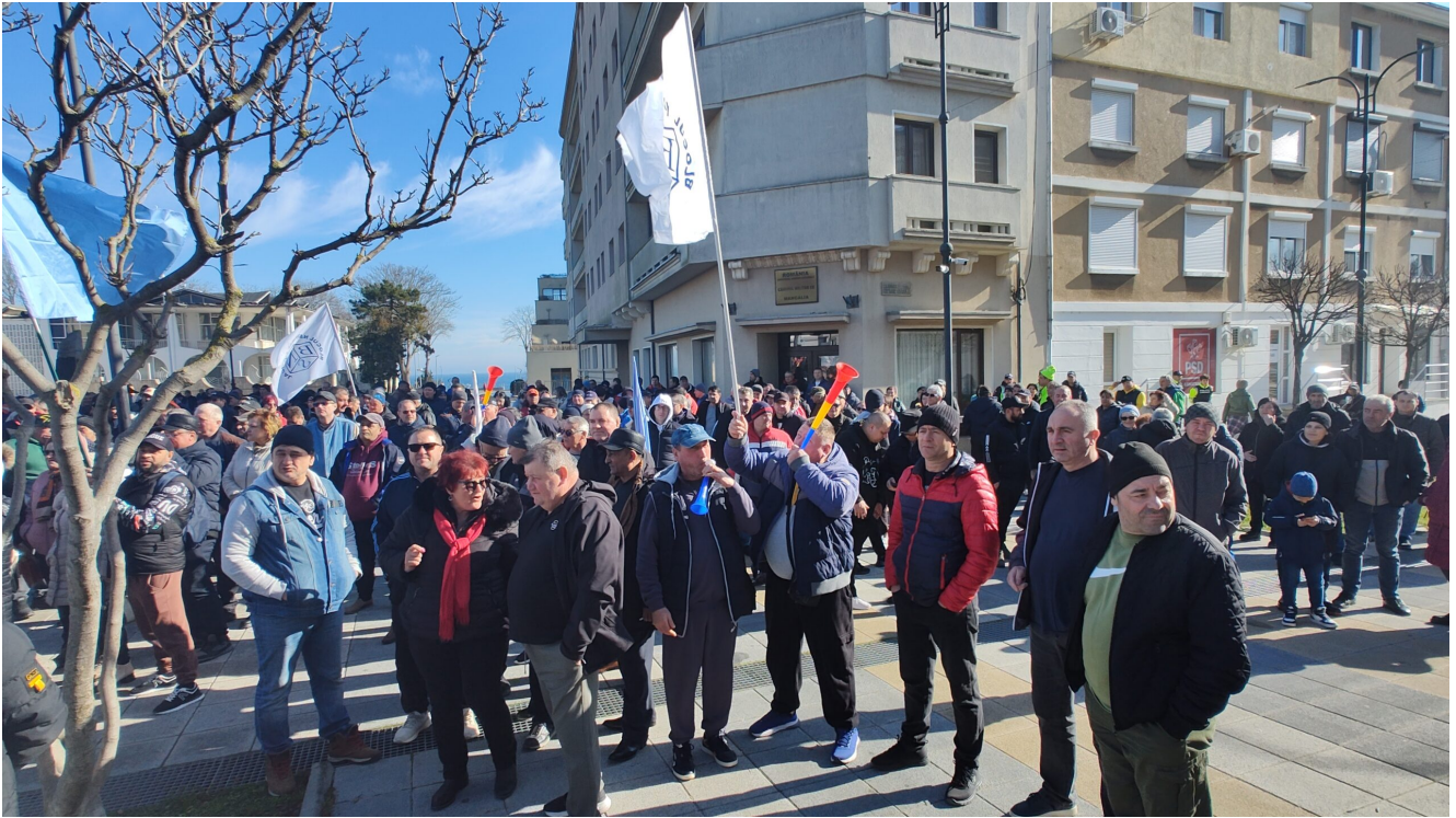
Protest Damen Mangalia