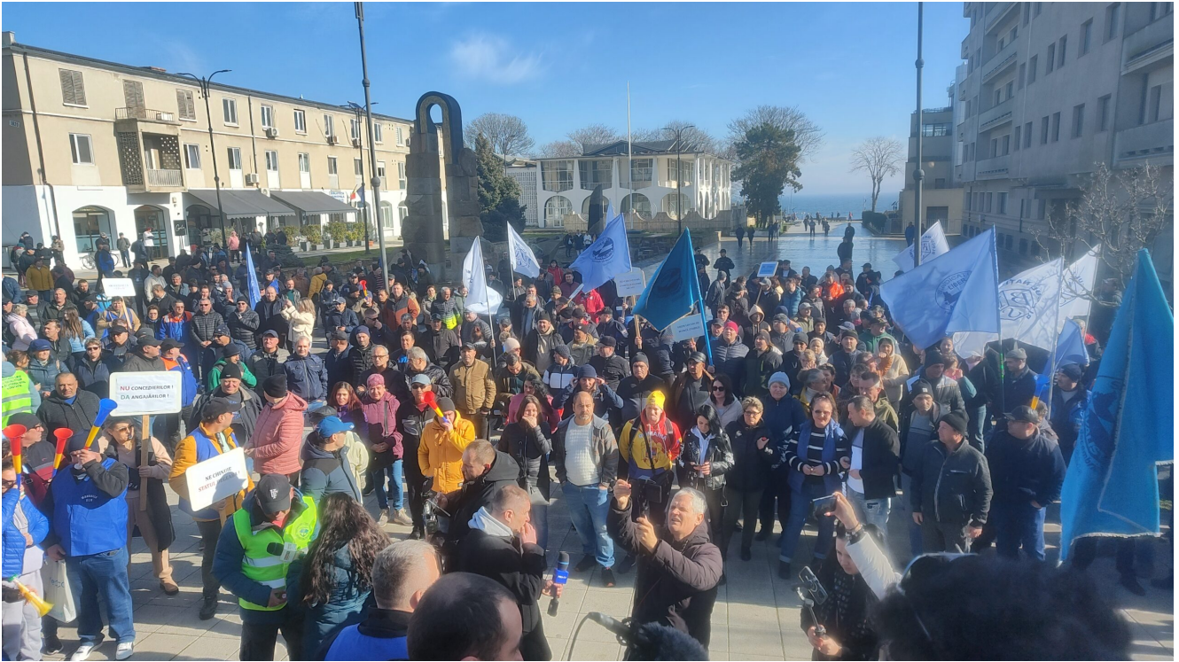
Protest Damen Mangalia