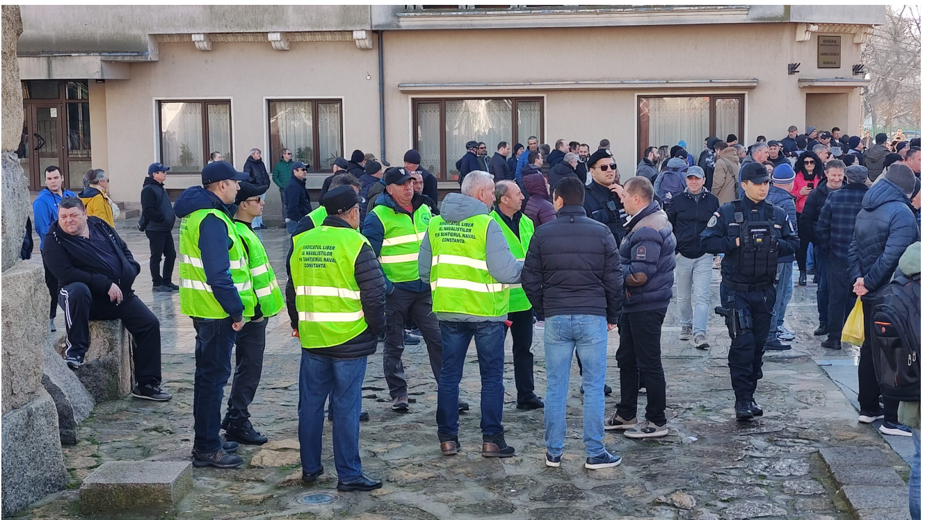
Protest Damen Mangalia