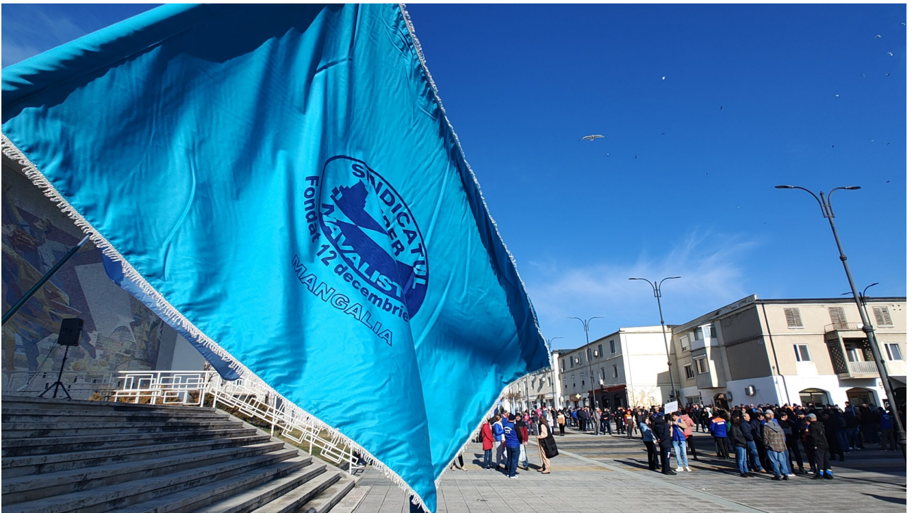
Protest Damen Mangalia