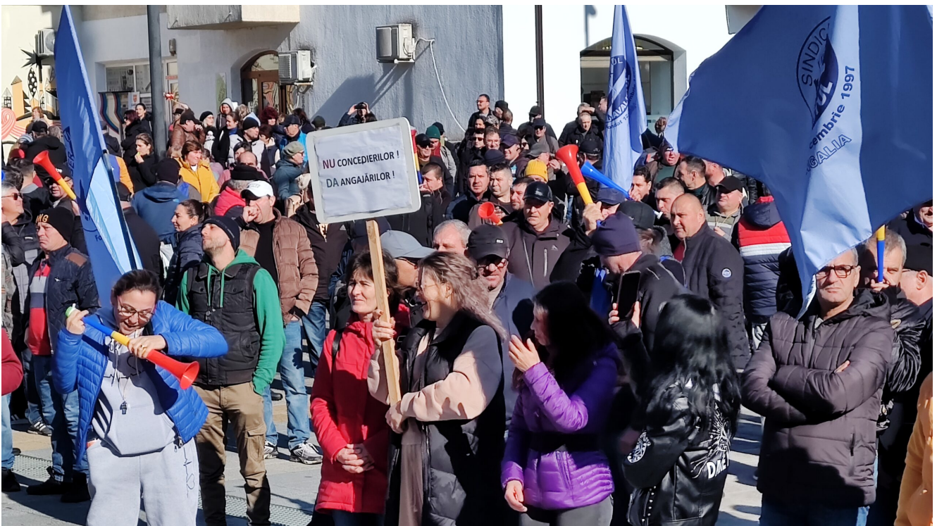
Protest Damen Mangalia