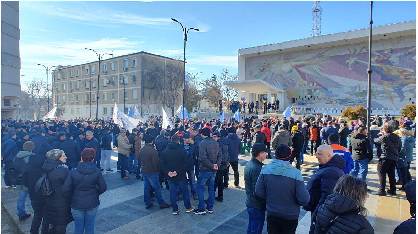
Protest Damen Mangalia