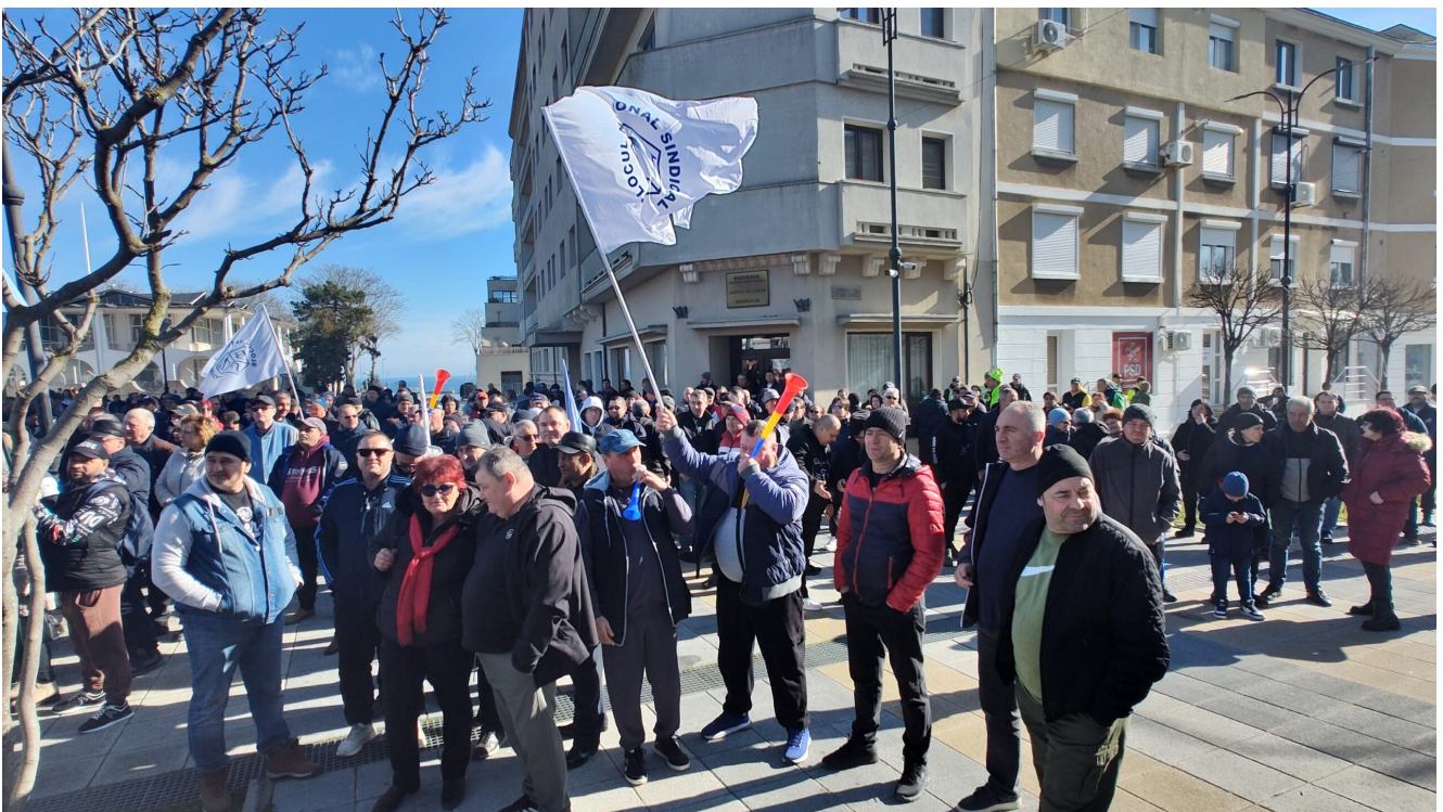
Protest Damen Mangalia