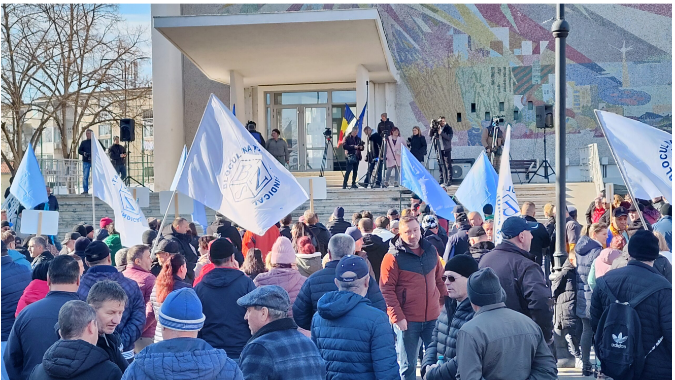
Protest Damen Mangalia