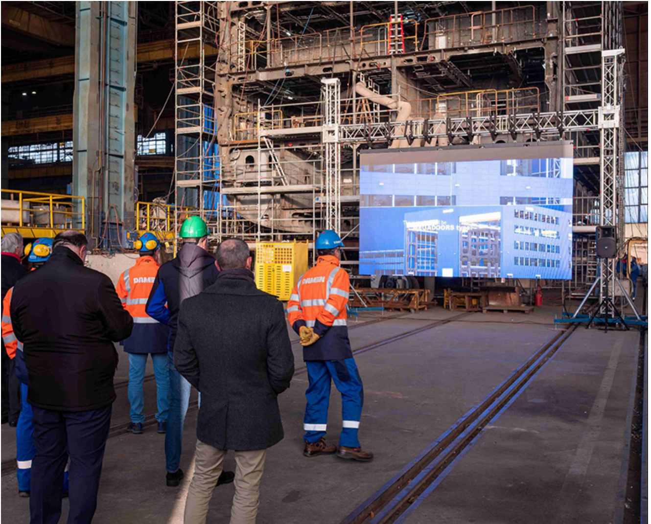
Inaugurare Damen Galați