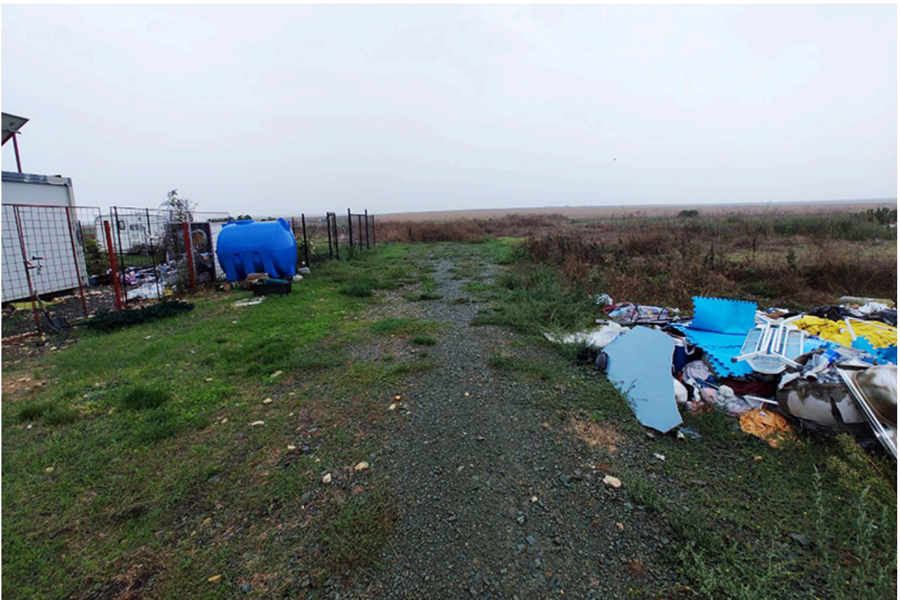
Baraca Dana Marijuana