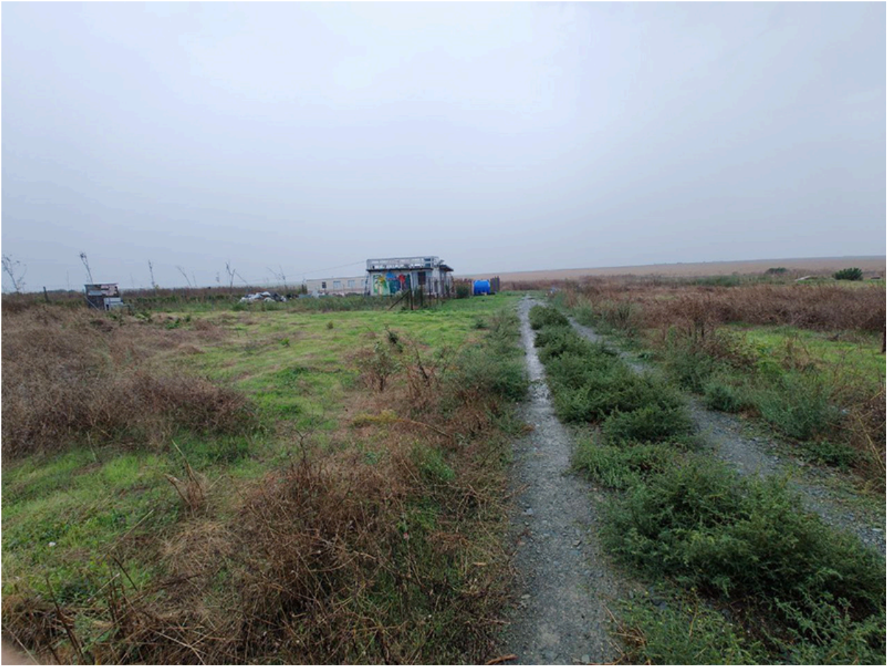
Baraca Dana Marijuana