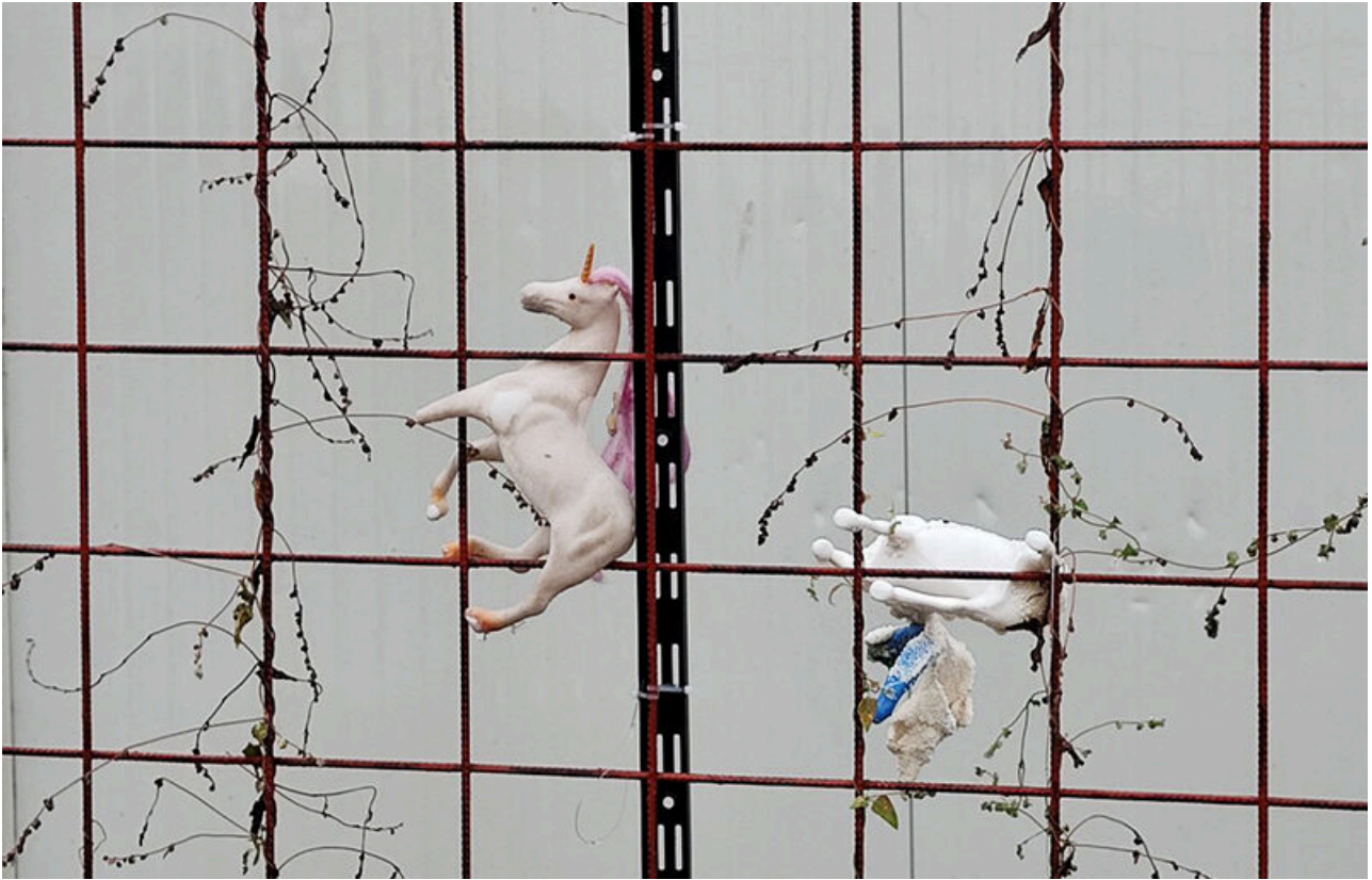
Baraca Dana Marijuana