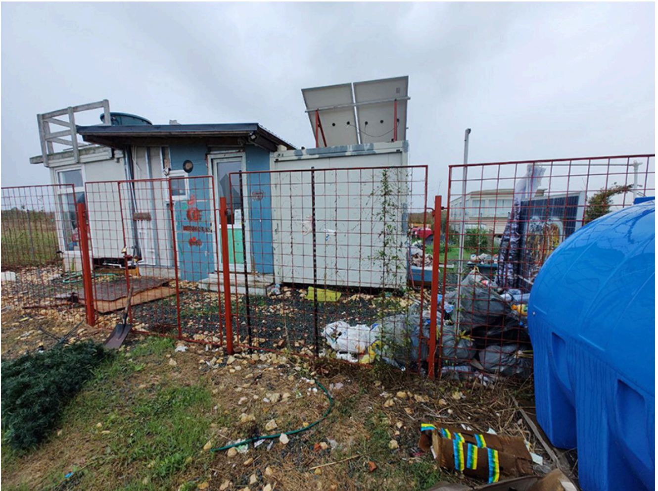
Baraca Dana Marijuana

https://editiadesud.ro/wp-content/uploads/2024/09/vama1.mp4