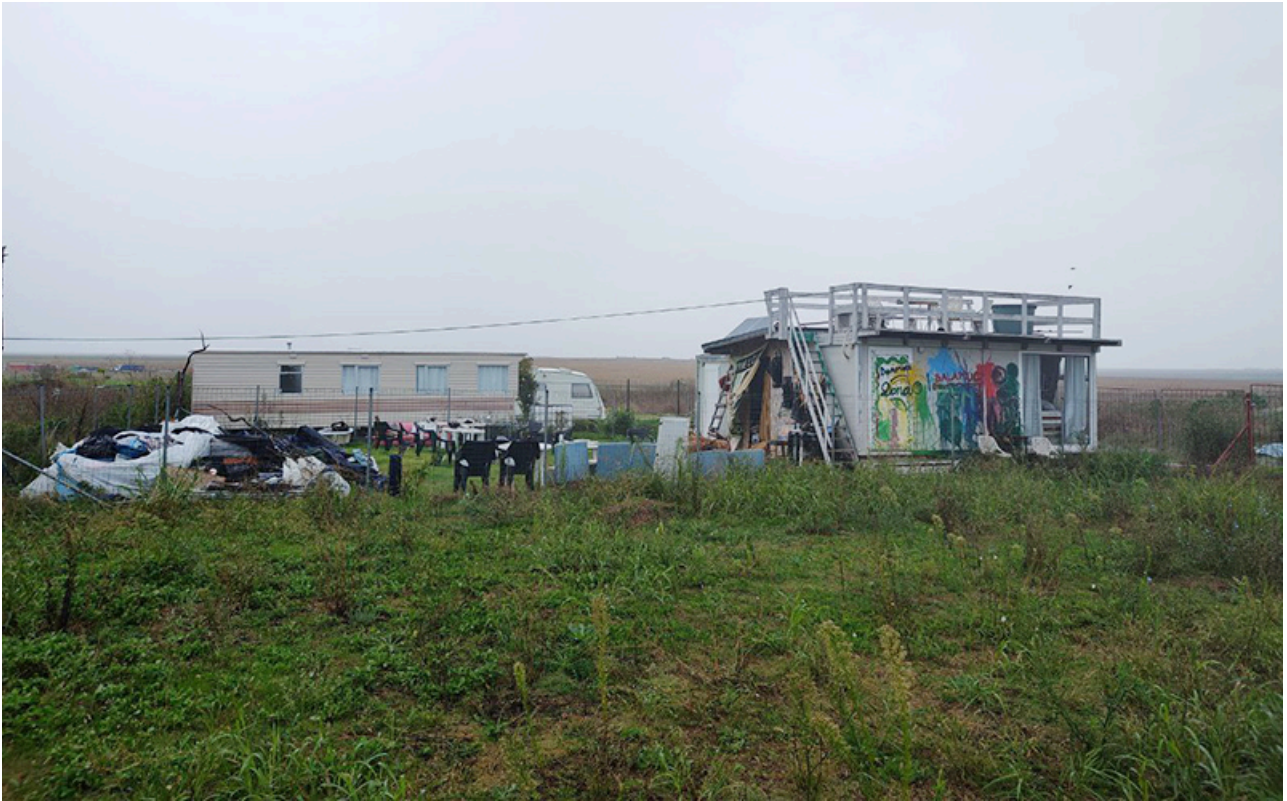
Baraca Dana Marijuana