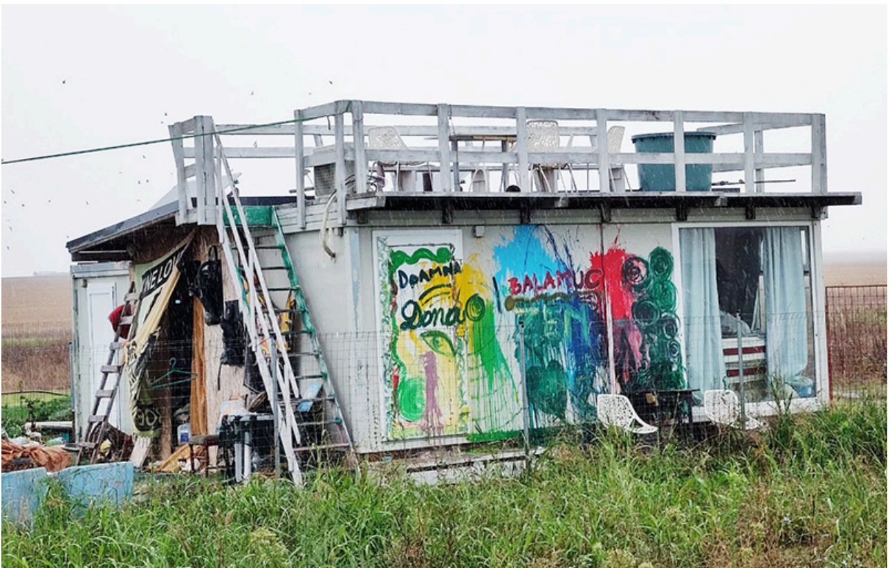
Baraca Dana Marijuana