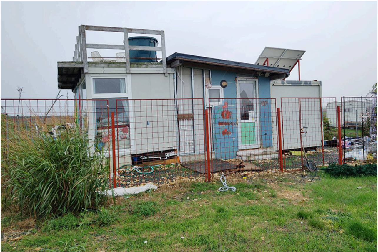
Baraca Dana Marijuana

procesuale prevăzute de Codul de procedură penală, precum și de prezumția de nevinovăție.