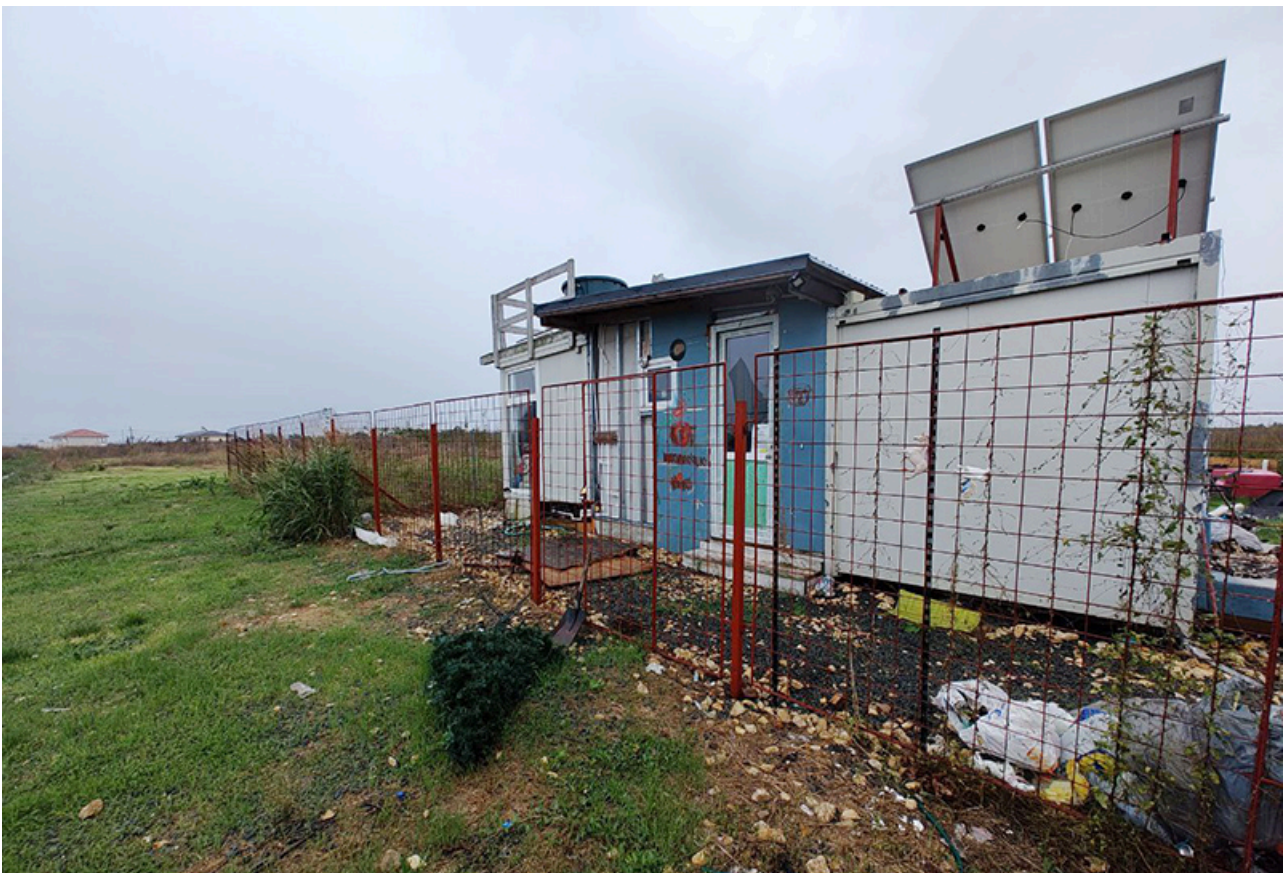
Baraca Dana Marijuana