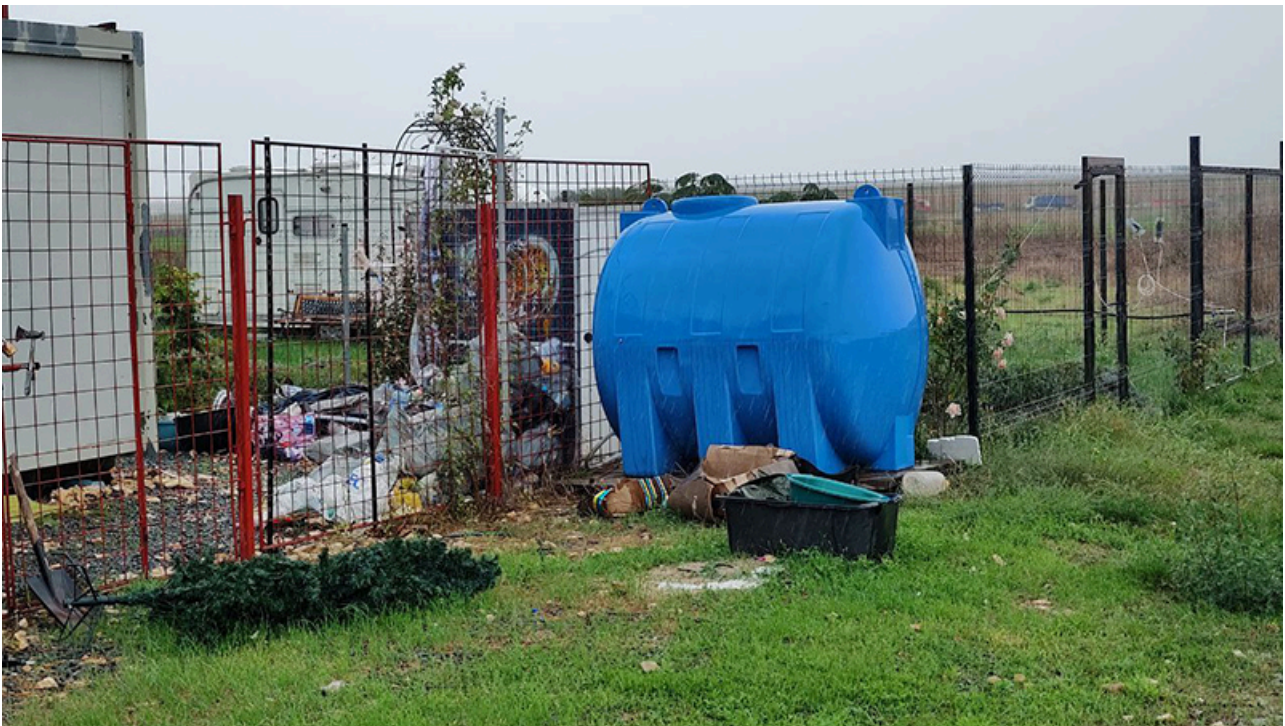
Baraca Dana Marijuana