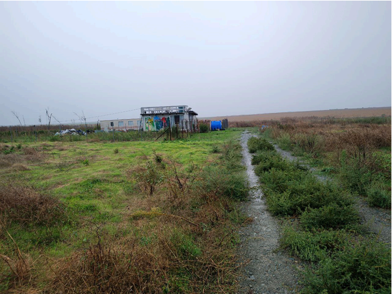
Baraca Dana Marijuana