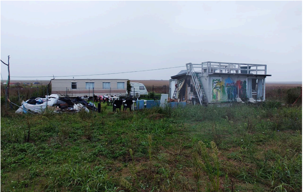
Baraca Dana Marijuana