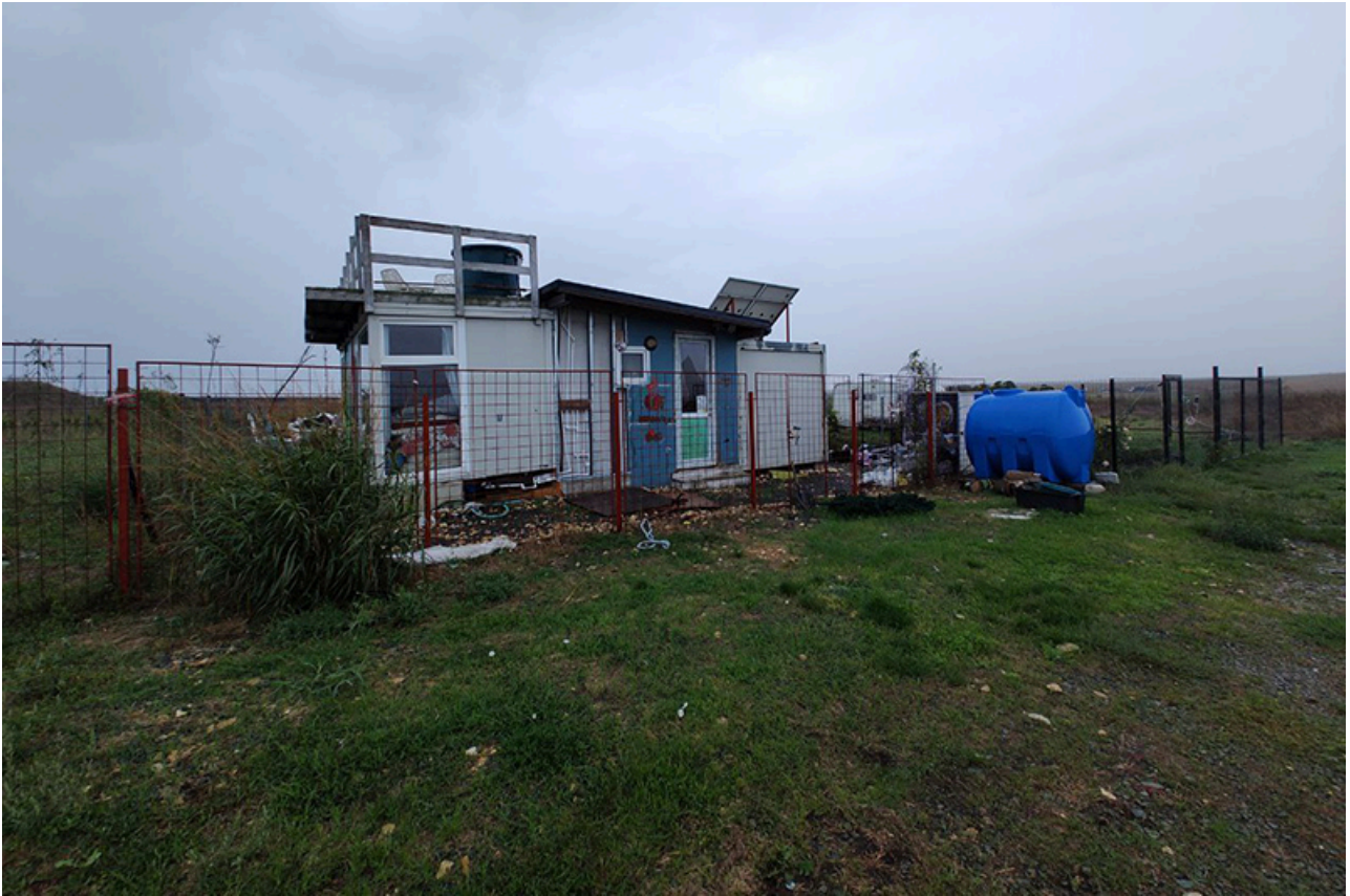
Baraca Dana Marijuana