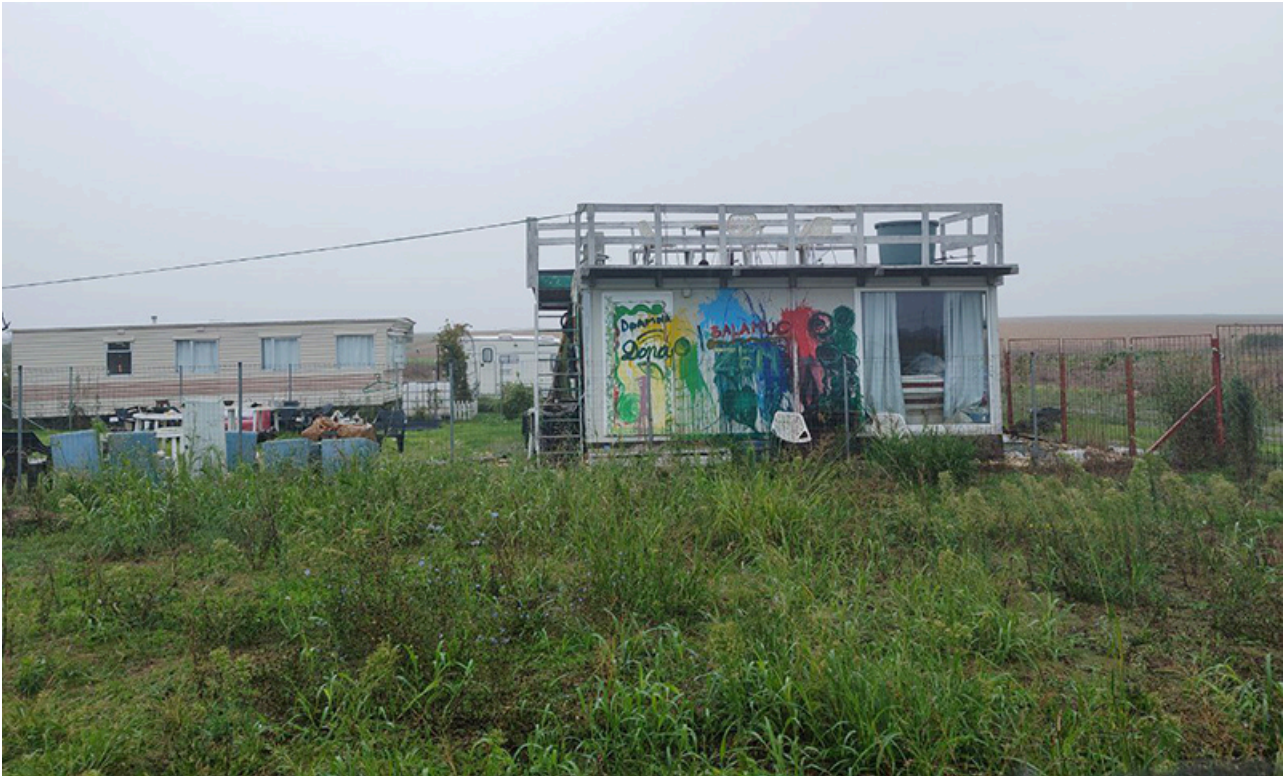
Baraca Dana Marijuana