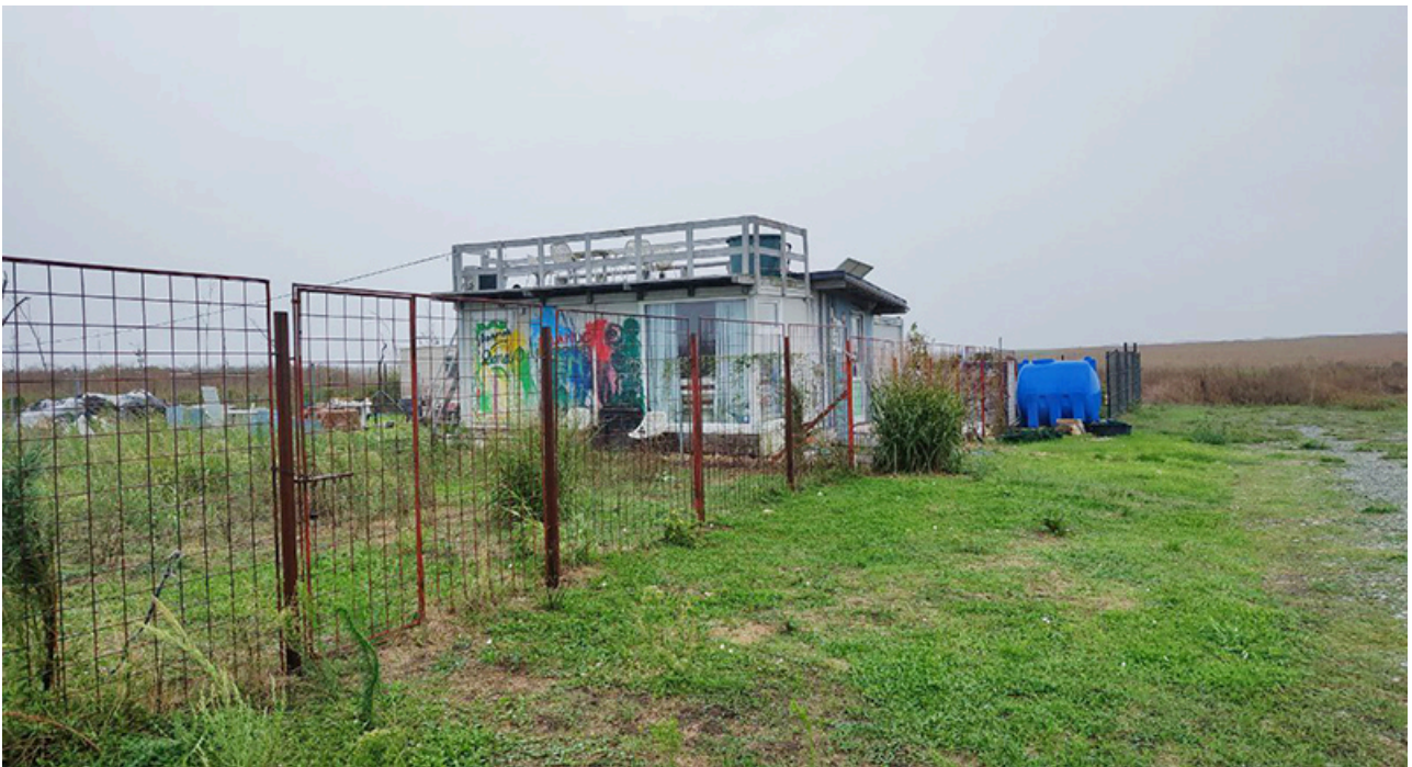
Baraca Dana Marijuana