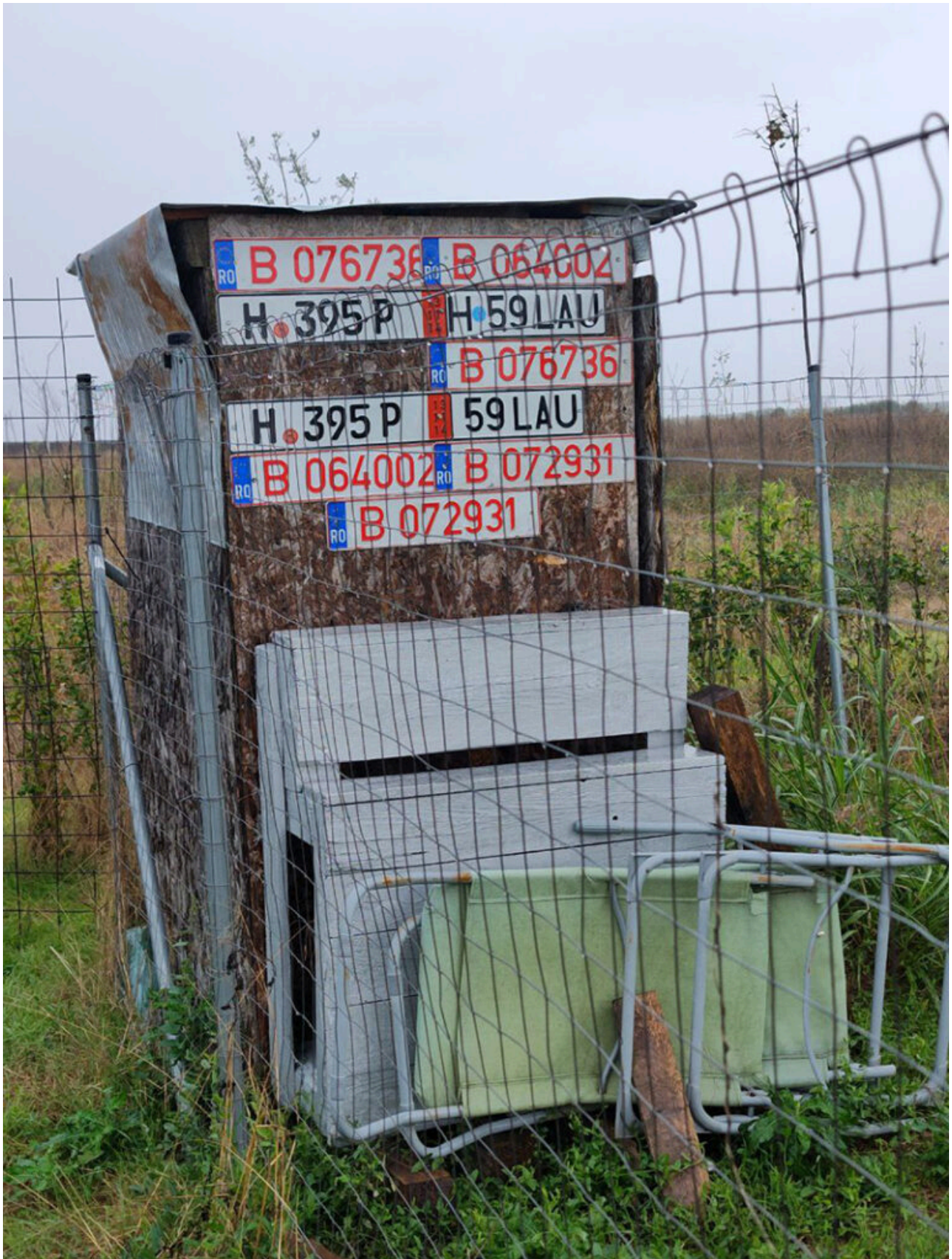
Baraca Dana Marijuana