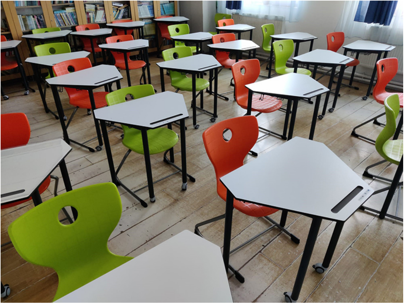
Mobilier modern la Pecineaga