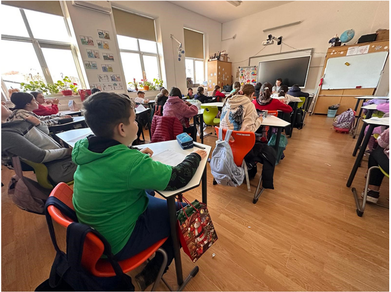
Mobilier modern la Pecineaga