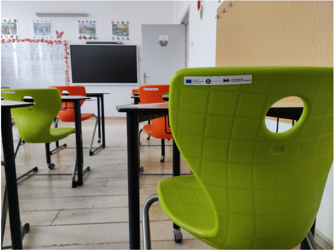
Mobilier modern la Pecineaga