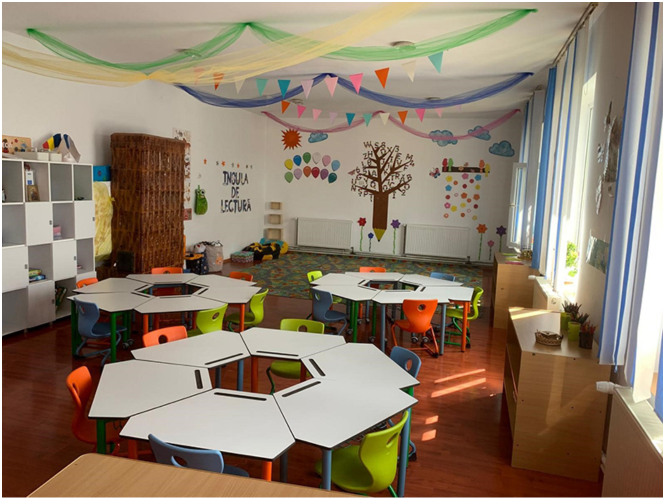
Mobilier modern la Pecineaga