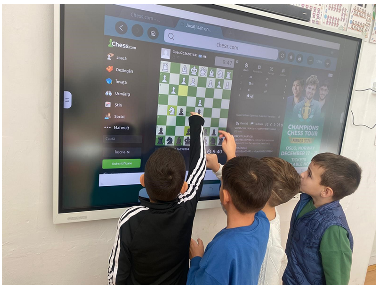
Mobilier modern la Pecineaga

De „Proiectul PNRR al UAT Pecineaga – Dotarea cu mobilier, materiale didactice și echipamente digitale a unităților de învățământ din Pecineaga” vor beneficia 370 de copii, de la cele trei școli și de la grădinița din comună.