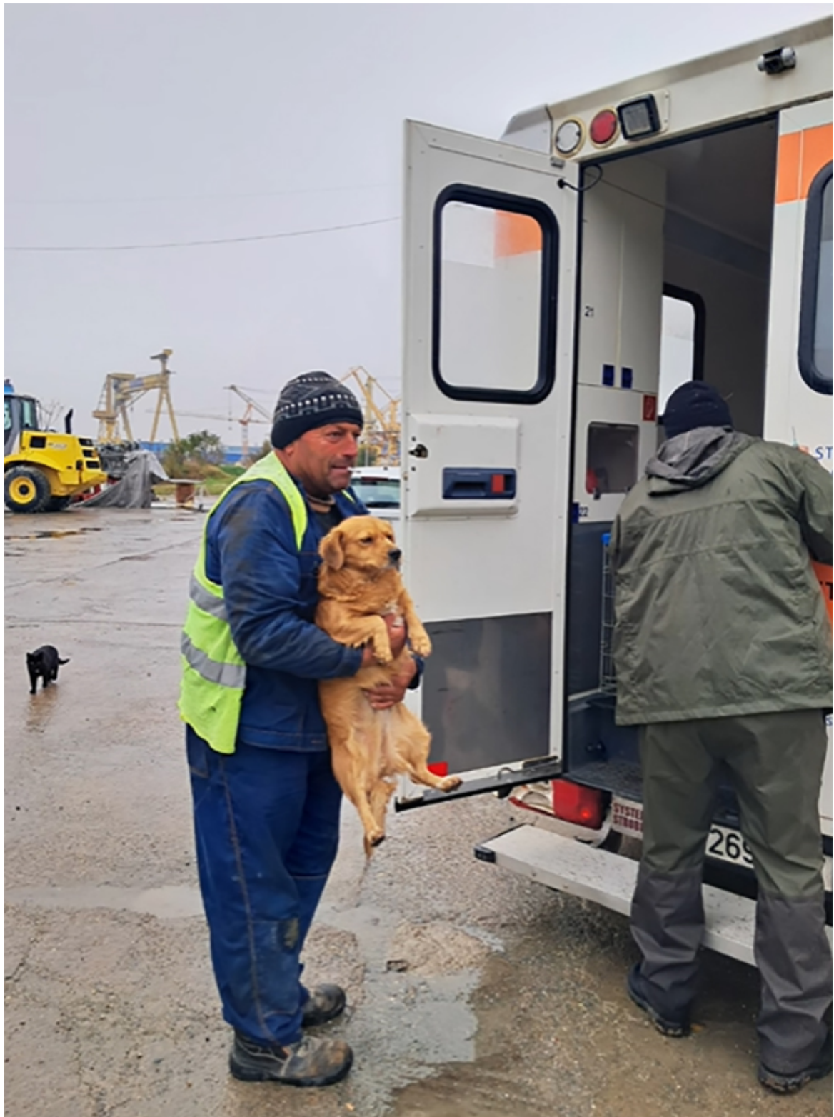
Campanie sterilizare Mangalia