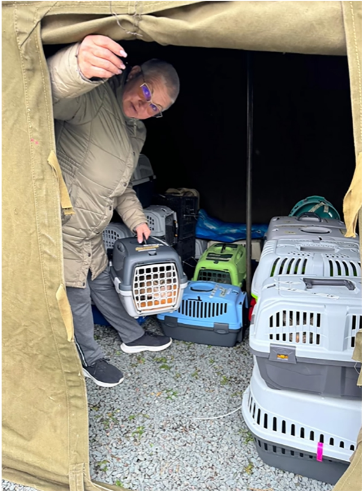
Campanie sterilizare Mangalia