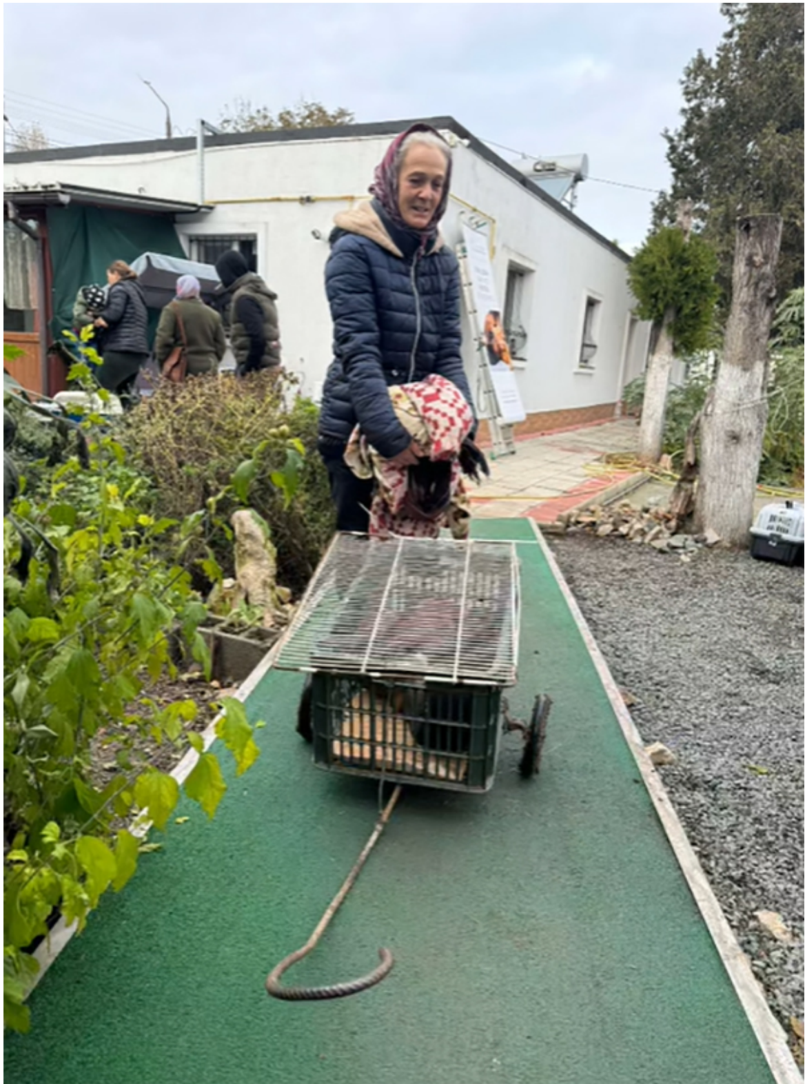
Campanie sterilizare Mangalia