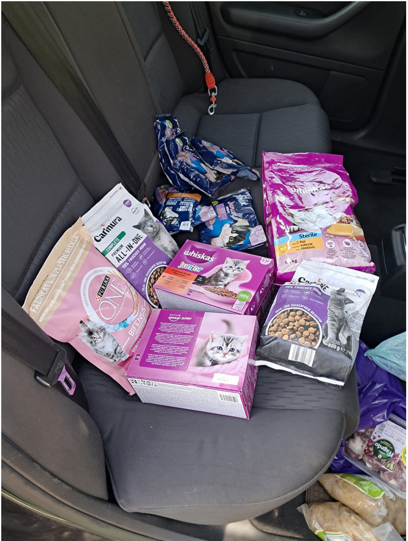
Campanie sterilizare Mangalia