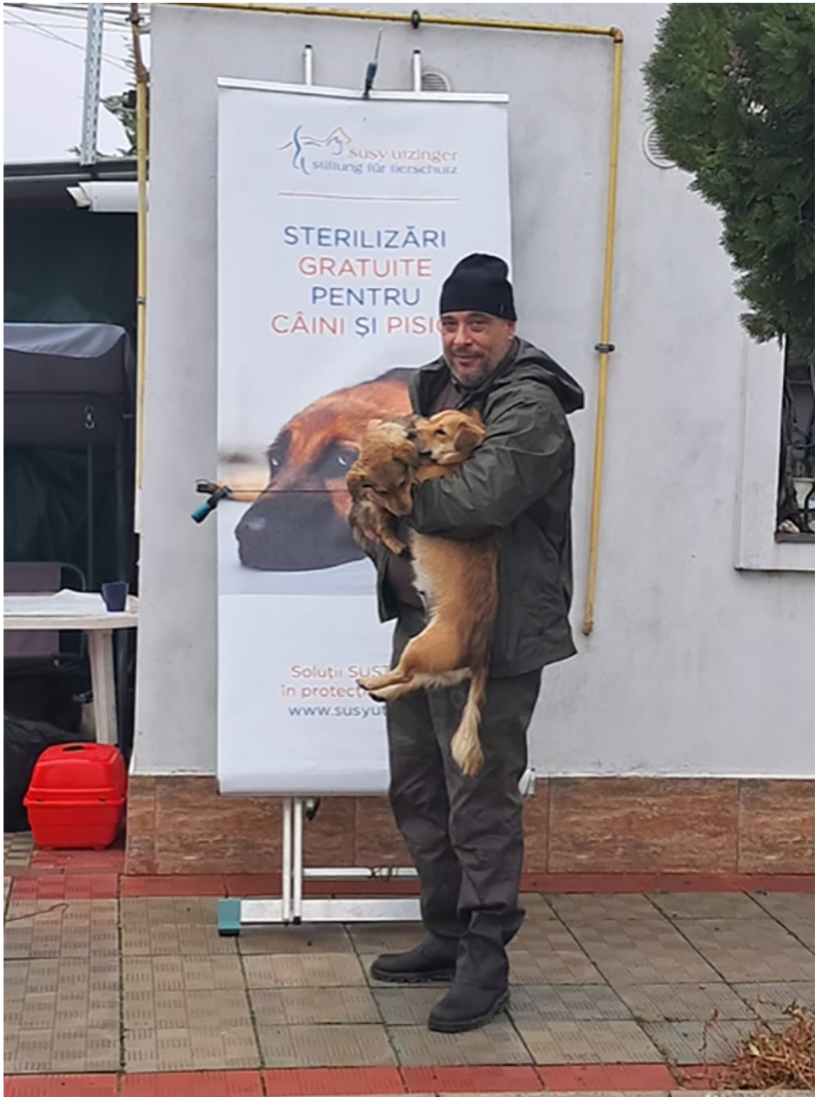
Campanie sterilizare Mangalia