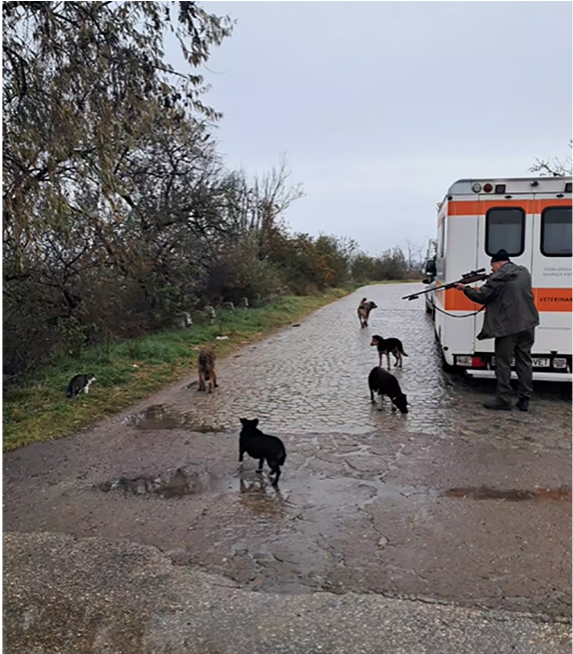
Campanie sterilizare Mangalia