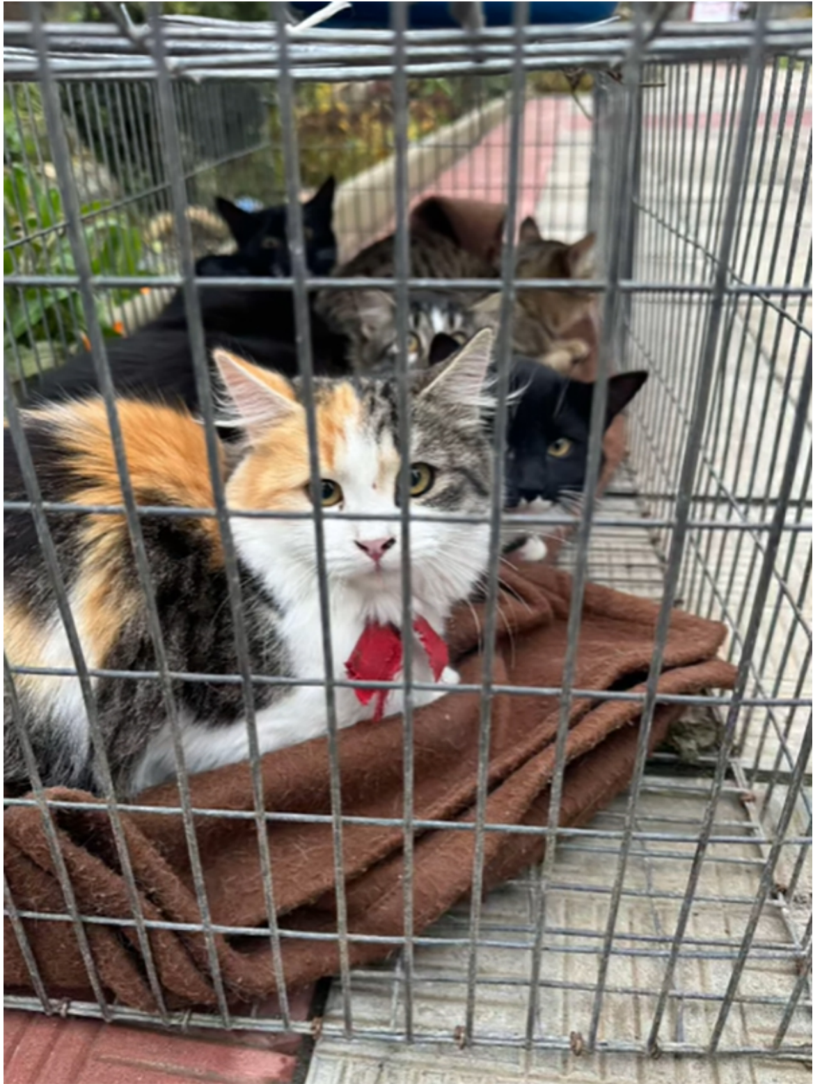
Campanie sterilizare Mangalia