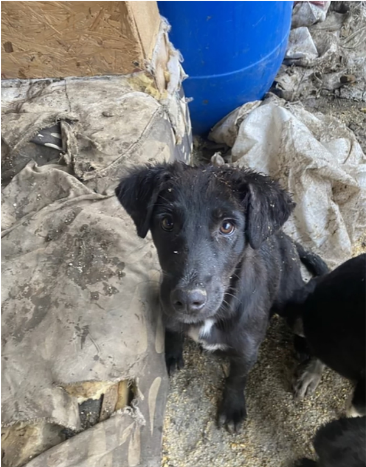
Campanie sterilizare Mangalia