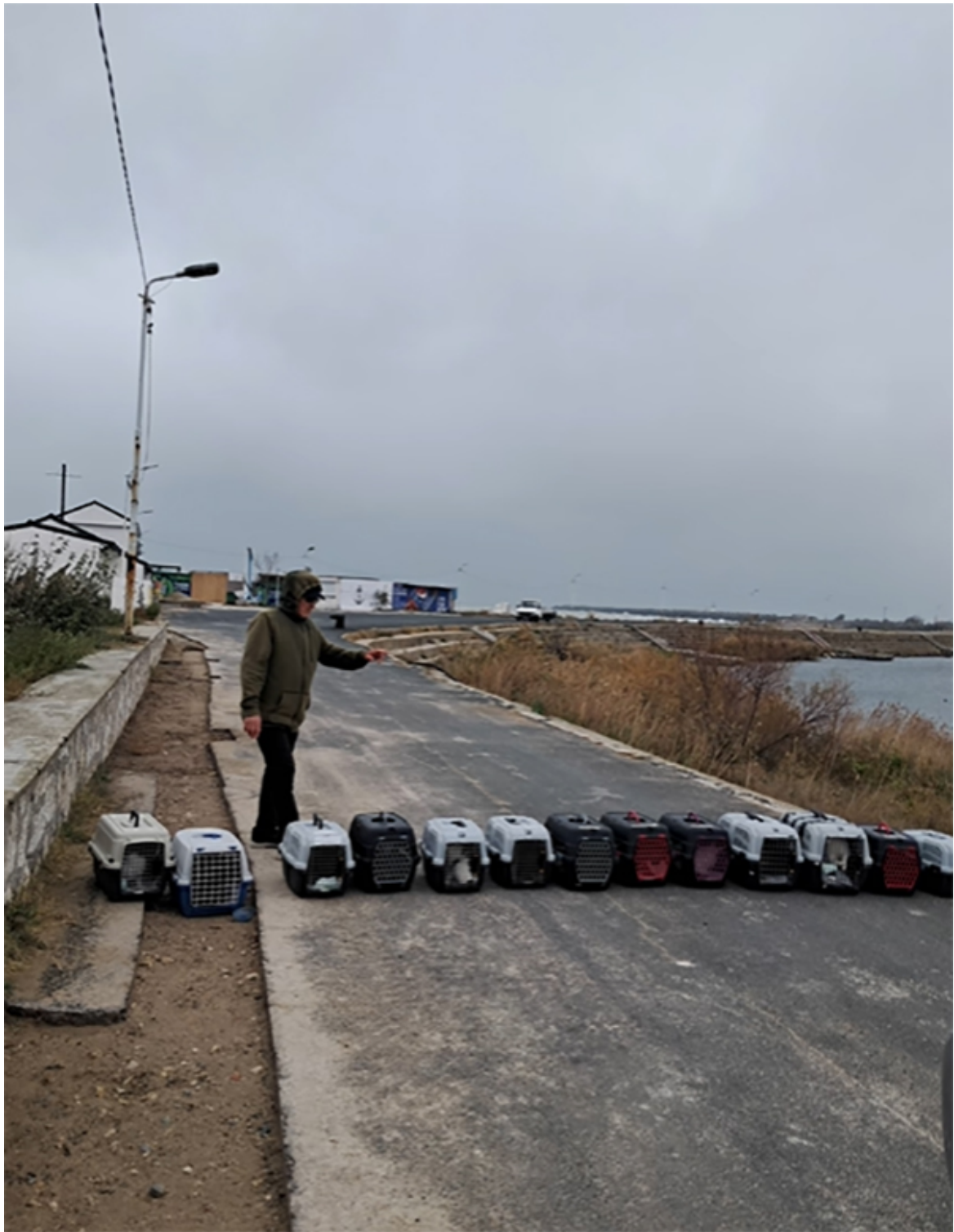
Campanie sterilizare Mangalia