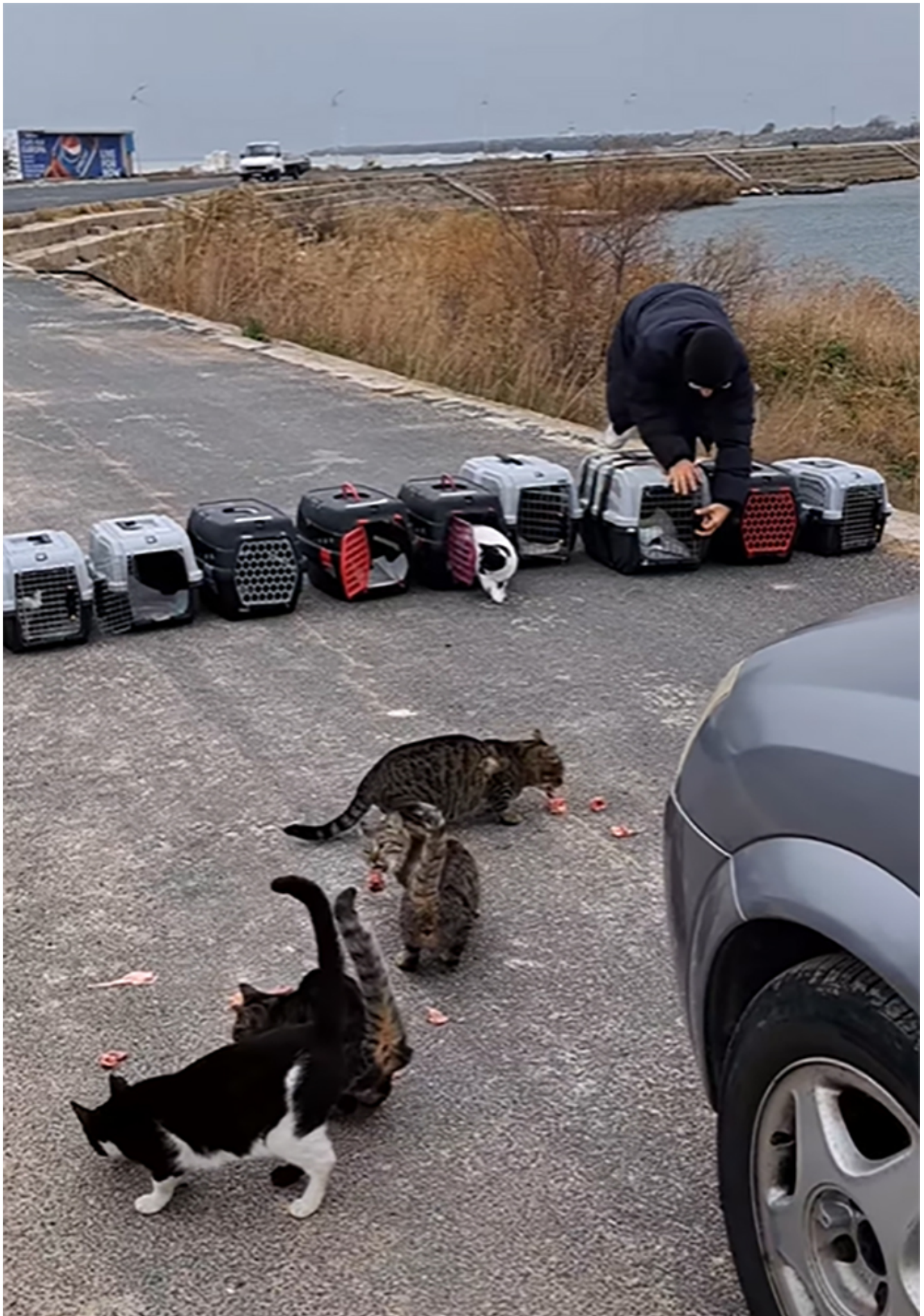
Campanie sterilizare Mangalia