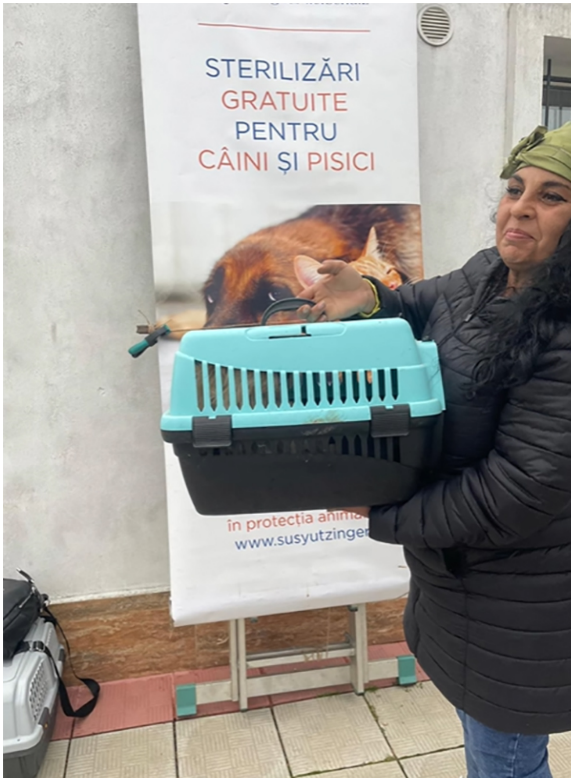
Campanie sterilizare Mangalia