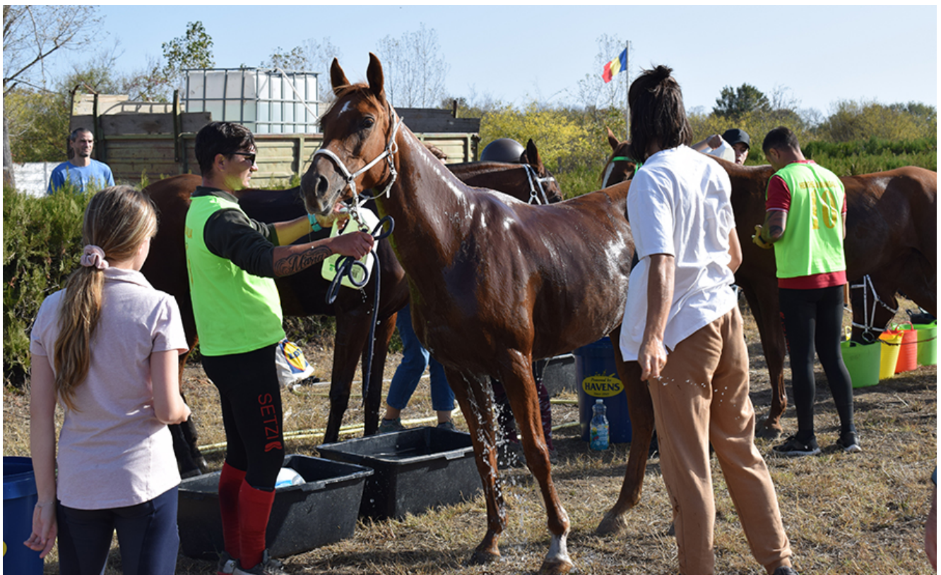
Curse de anduranță la Herghelia Mangalia