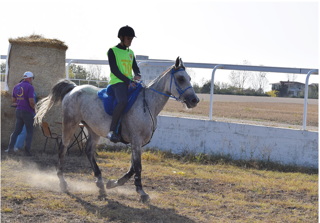
Curse de anduranță la Herghelia Mangalia