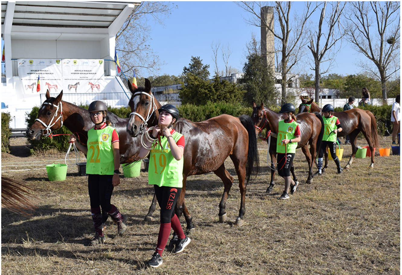
Curse de anduranță la Herghelia Mangalia