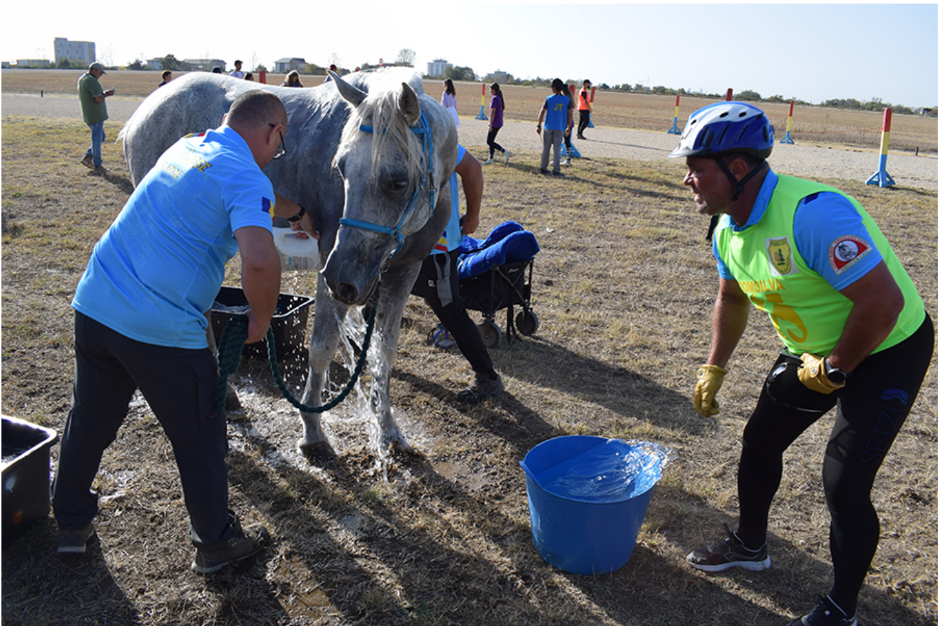
Curse de anduranță la Herghelia Mangalia