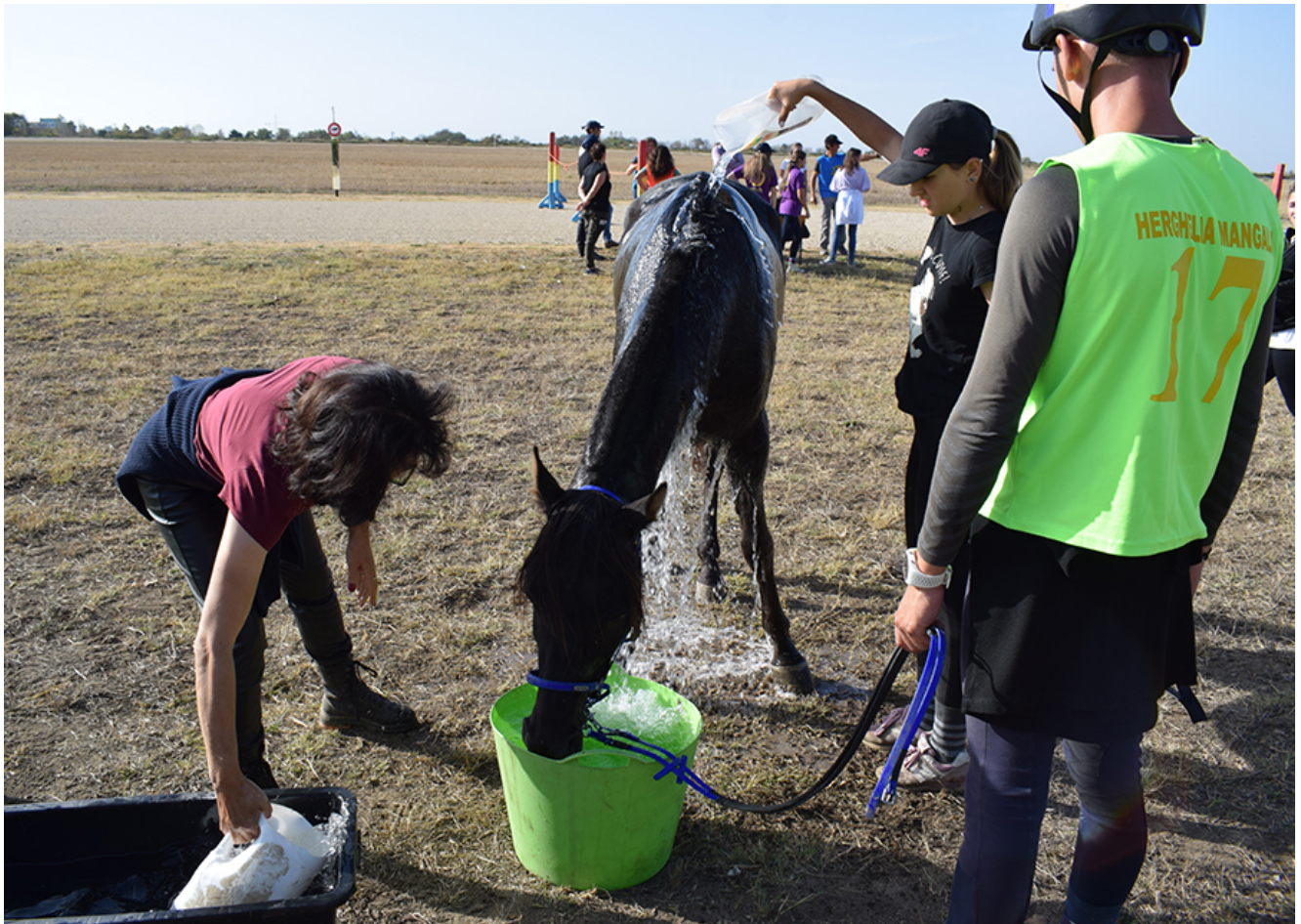
Curse de anduranță la Herghelia Mangalia