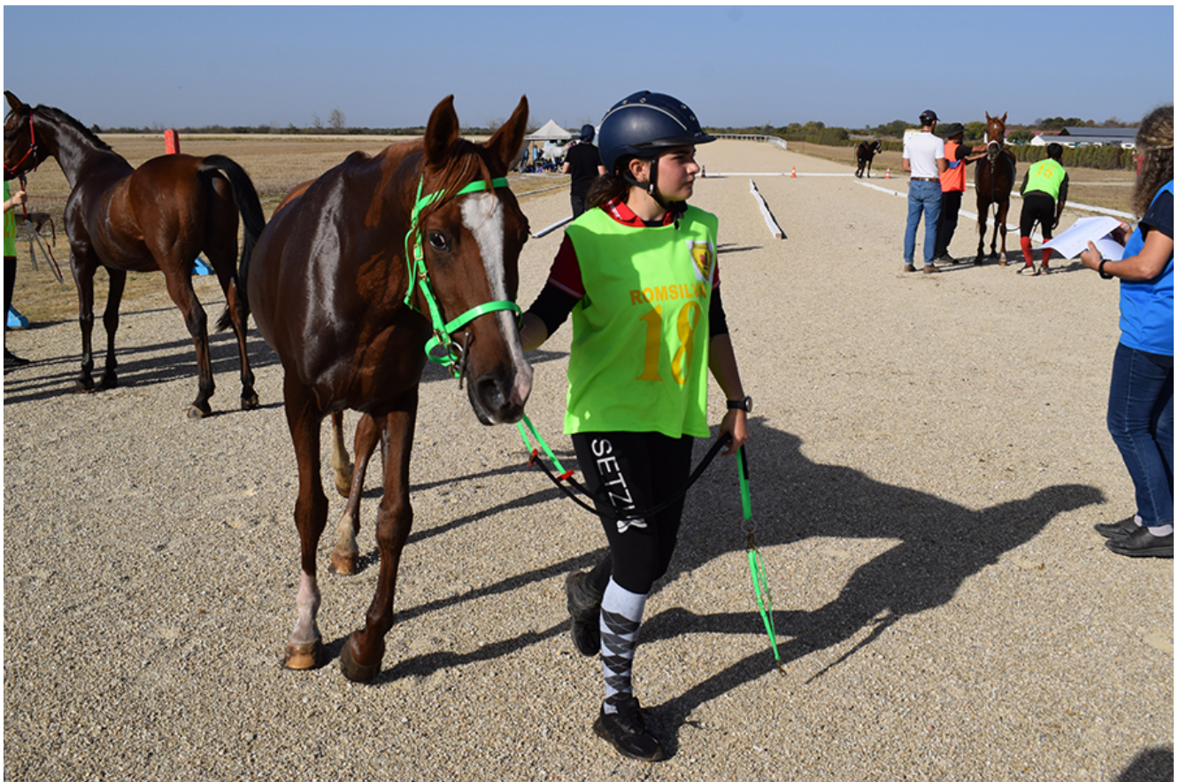
Curse de anduranță la Herghelia Mangalia