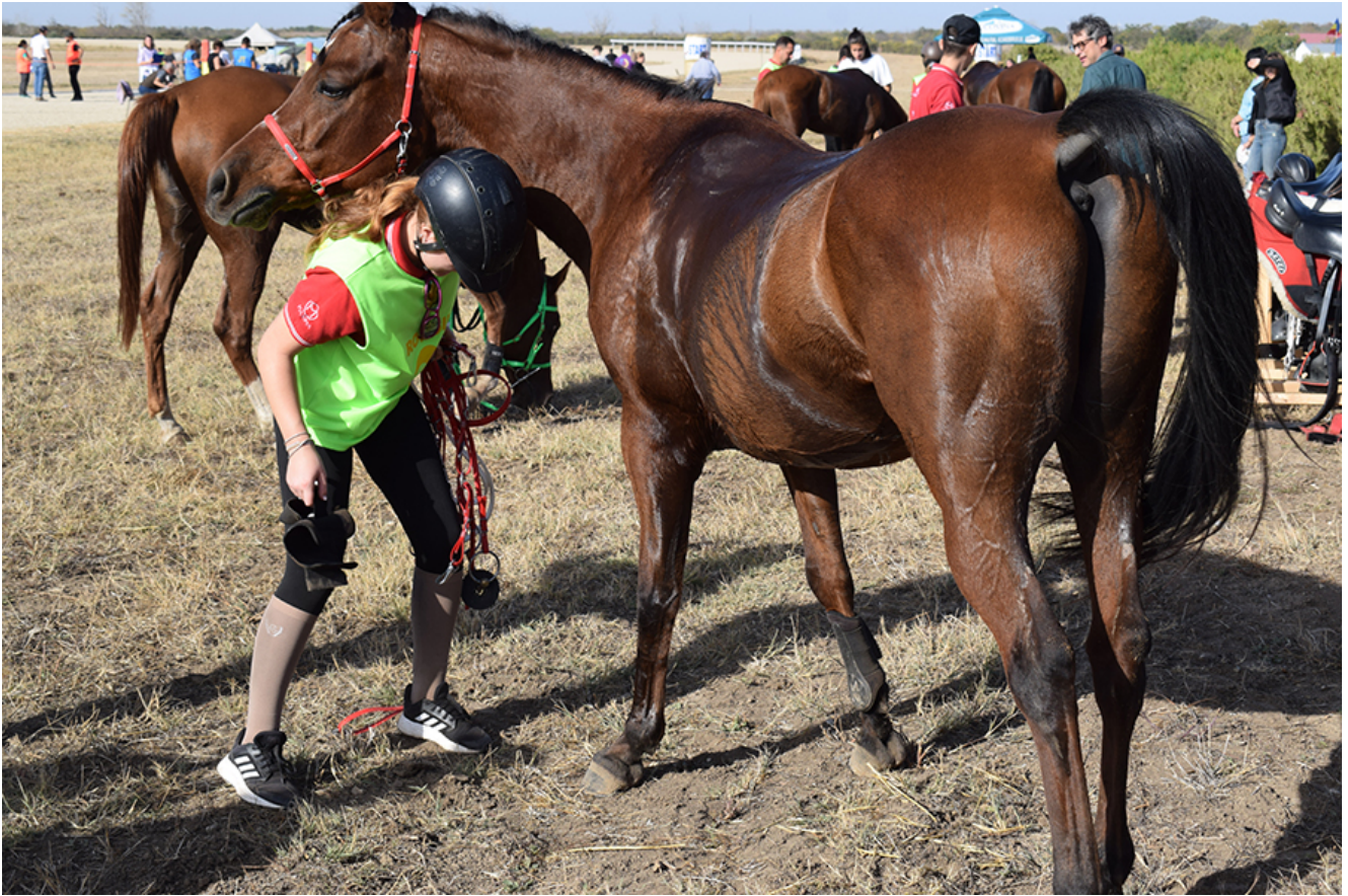
Curse de anduranță la Herghelia Mangalia