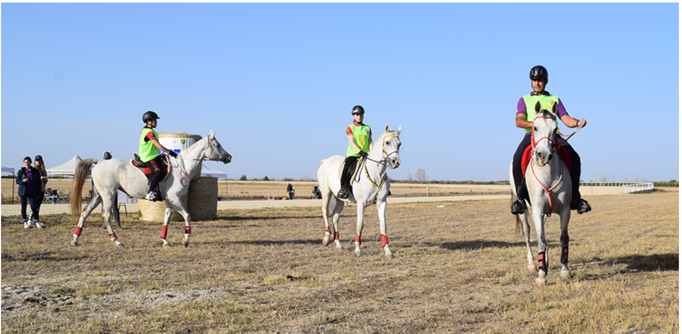
Curse de anduranță la Herghelia Mangalia