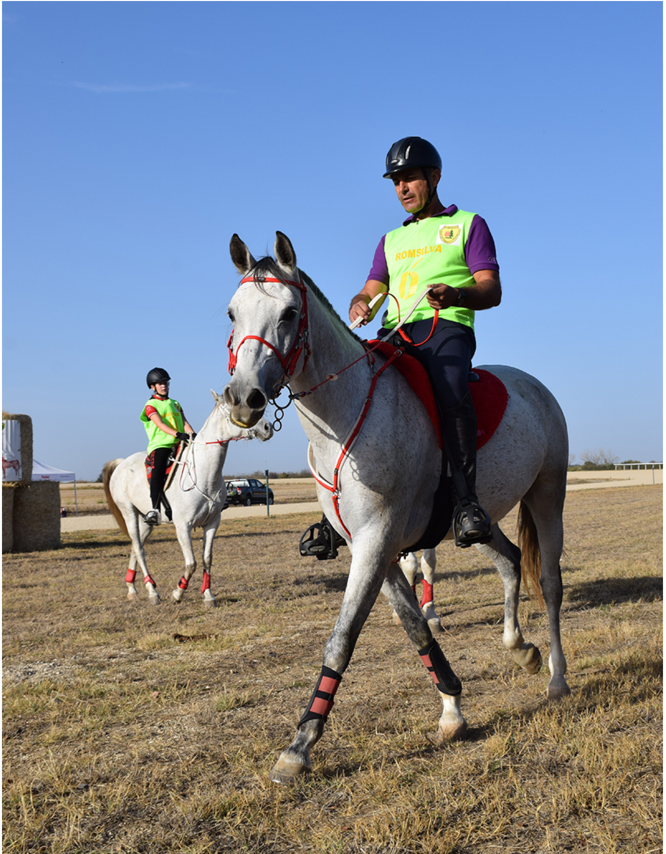
Curse de anduranță la Herghelia Mangalia