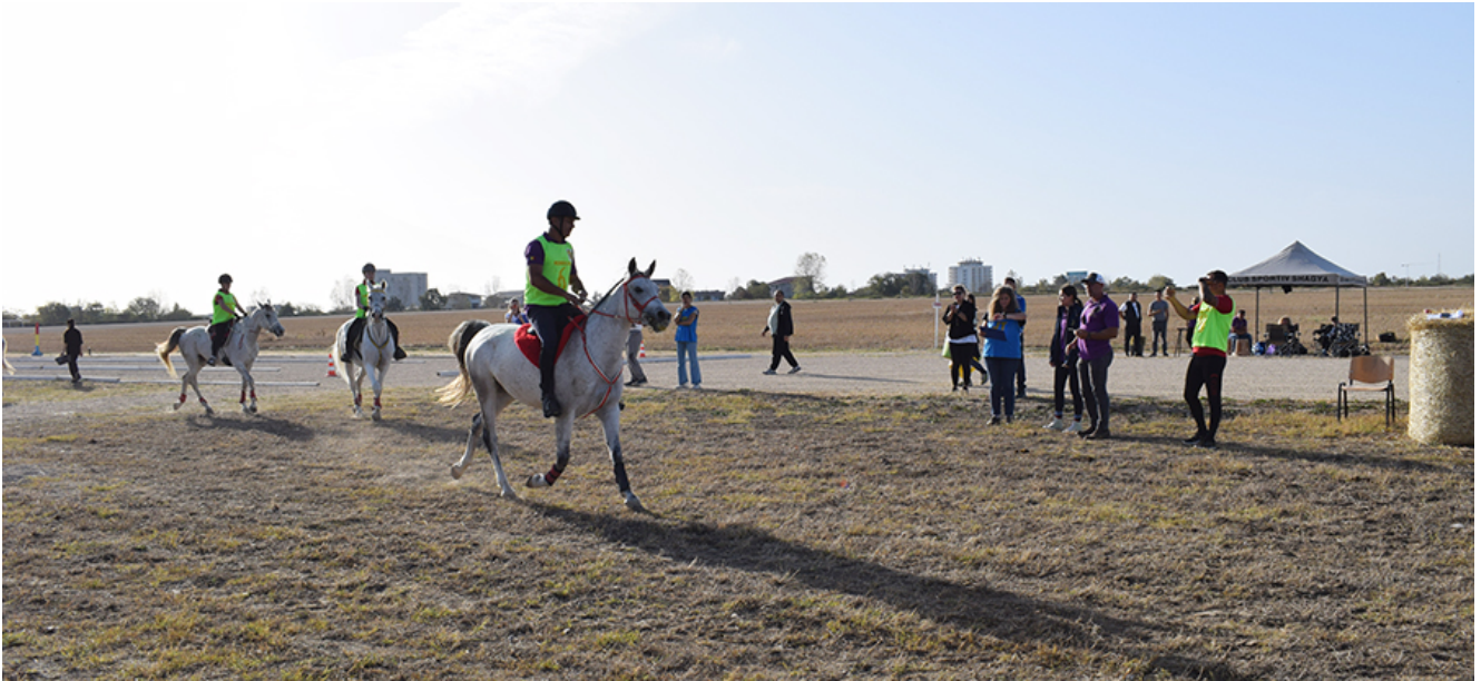
Curse de anduranță la Herghelia Mangalia