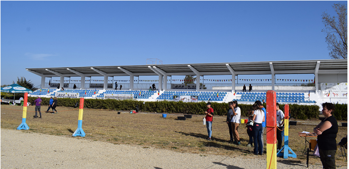
Curse de anduranță la Herghelia Mangalia