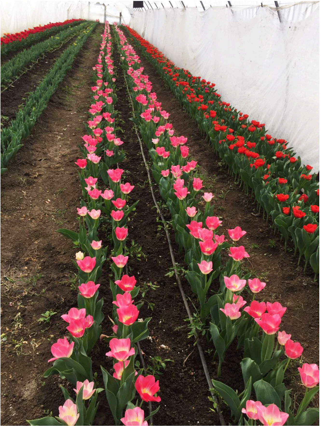
Florile de la Dulcești