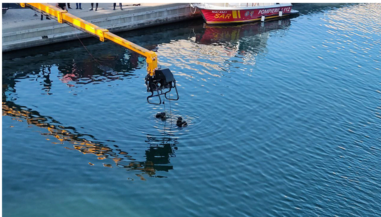
Căutările în apă ale lui Cătălin F