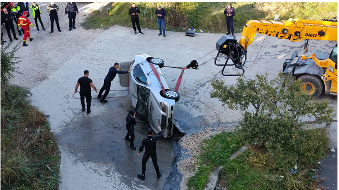
Căutările în apă ale lui Cătălin F