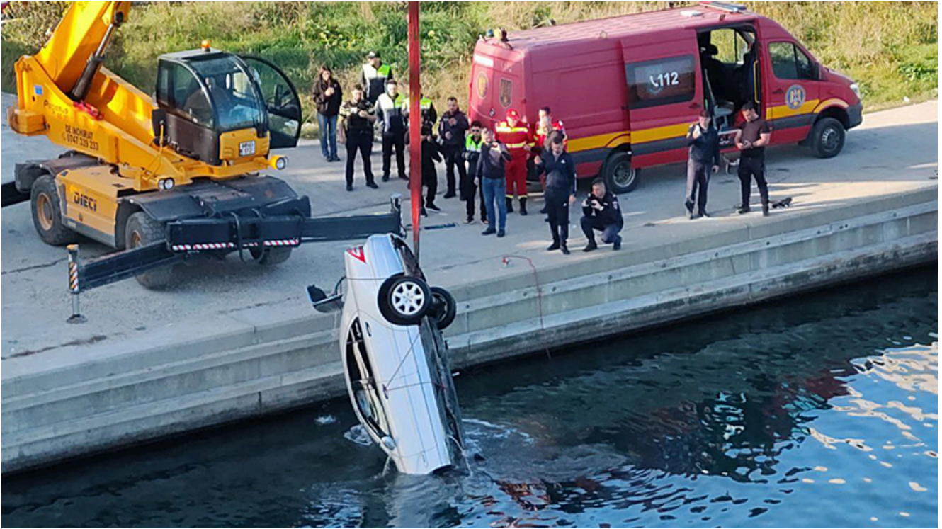
Căutările în apă ale lui Cătălin F