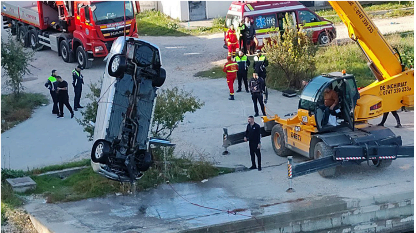
Căutările în apă ale lui Cătălin F