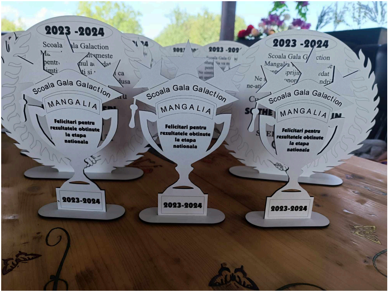
Premii Gala Galaction