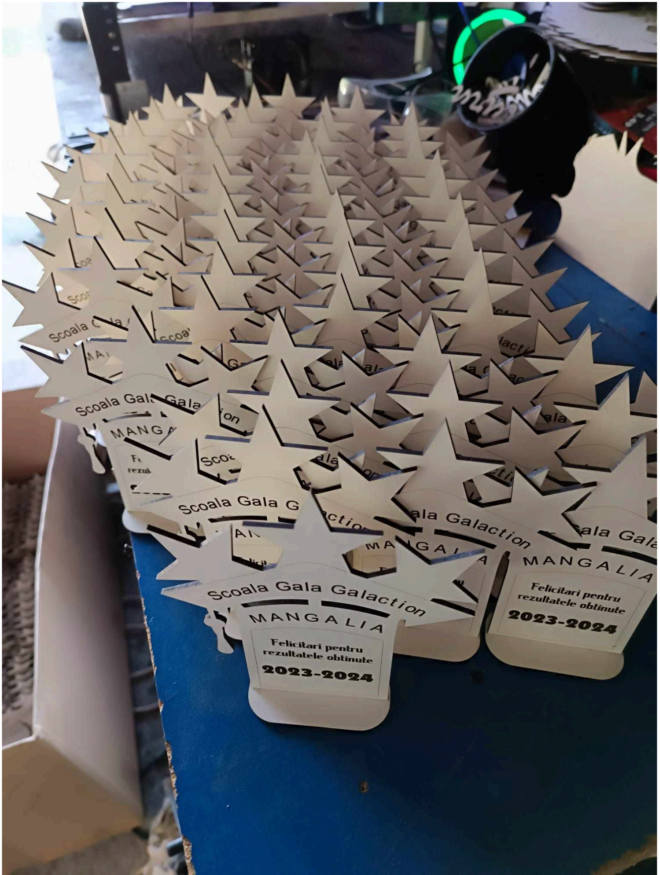
Premii Gala Galaction

https://editiadesud.ro/wp-content/uploads/2024/06/73bc9f5c-