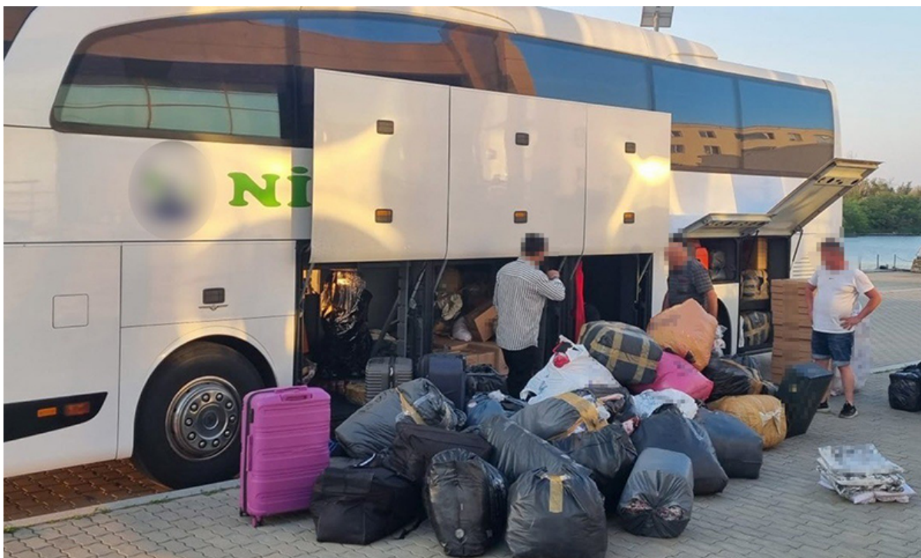
Haine contrafăcute Vama Veche

Produsele, în valoare totală de aproximativ 1.000.000 lei dacă ar fi fost comercializate ca bunuri de marcă, au fost ridicate în vederea continuării cercetărilor, iar în cauză, polițiștii de frontieră efectuează cercetări sub aspectul săvârșirii infracțiunii de punere în circulație a unui produs purtând o marcă identică sau similară cu o marcă înregistrată.