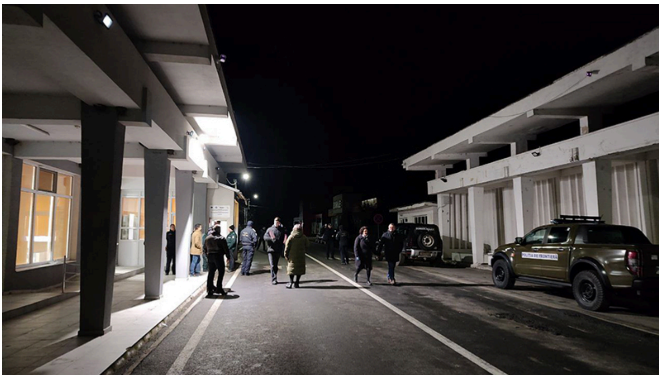
PTF Vama Veche, intrarea în Schengen