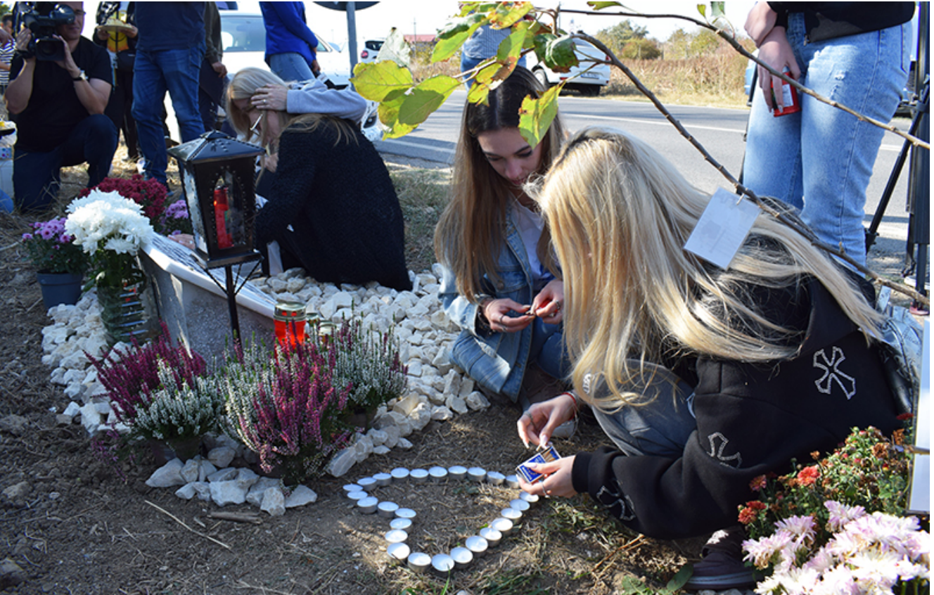
Placă comemorativă Sebi – 2 Mai