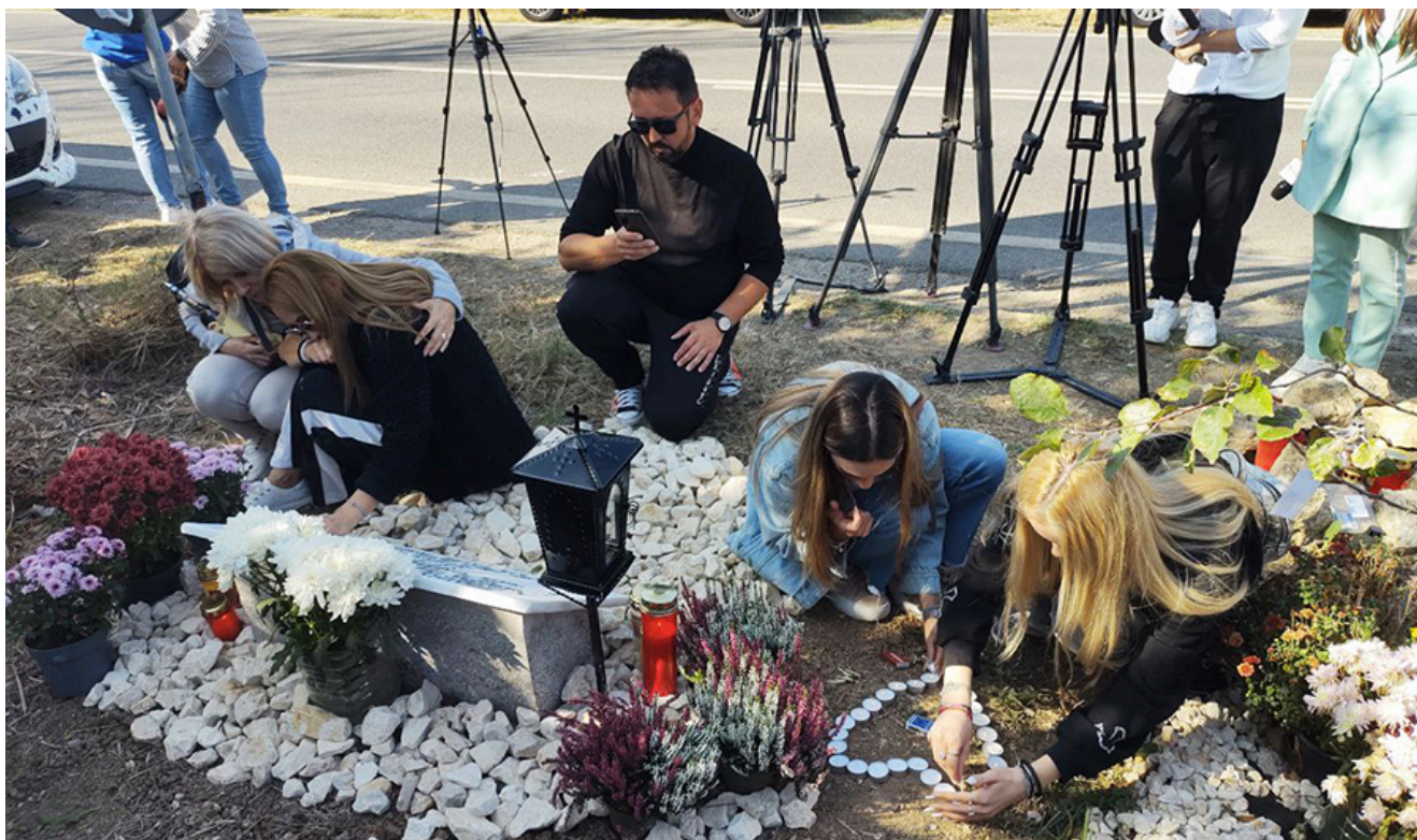
Placă comemorativă Sebi – 2 Mai