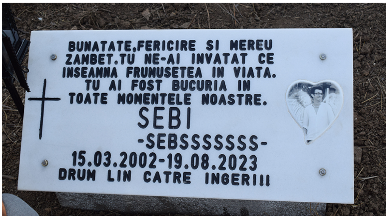
Placă comemorativă Sebi – 2 Mai