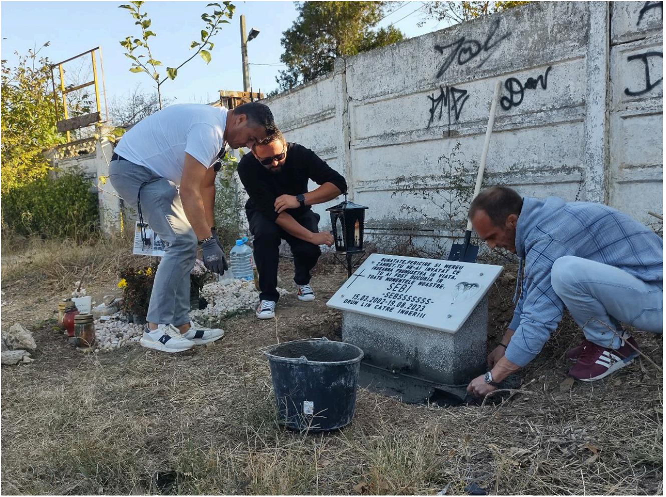
Placă comemorativă Sebi – 2 Mai