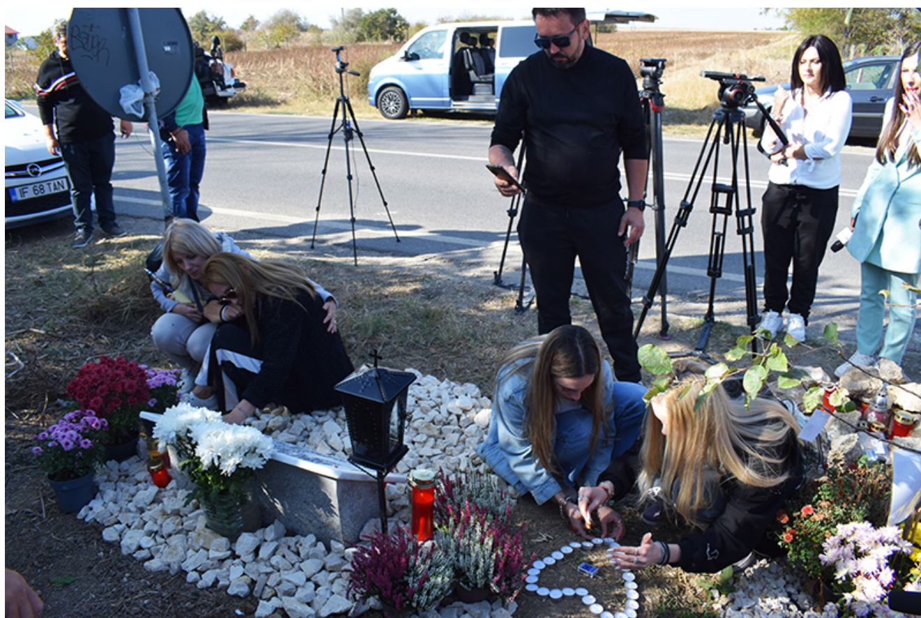
Placă comemorativă Sebi – 2 Mai