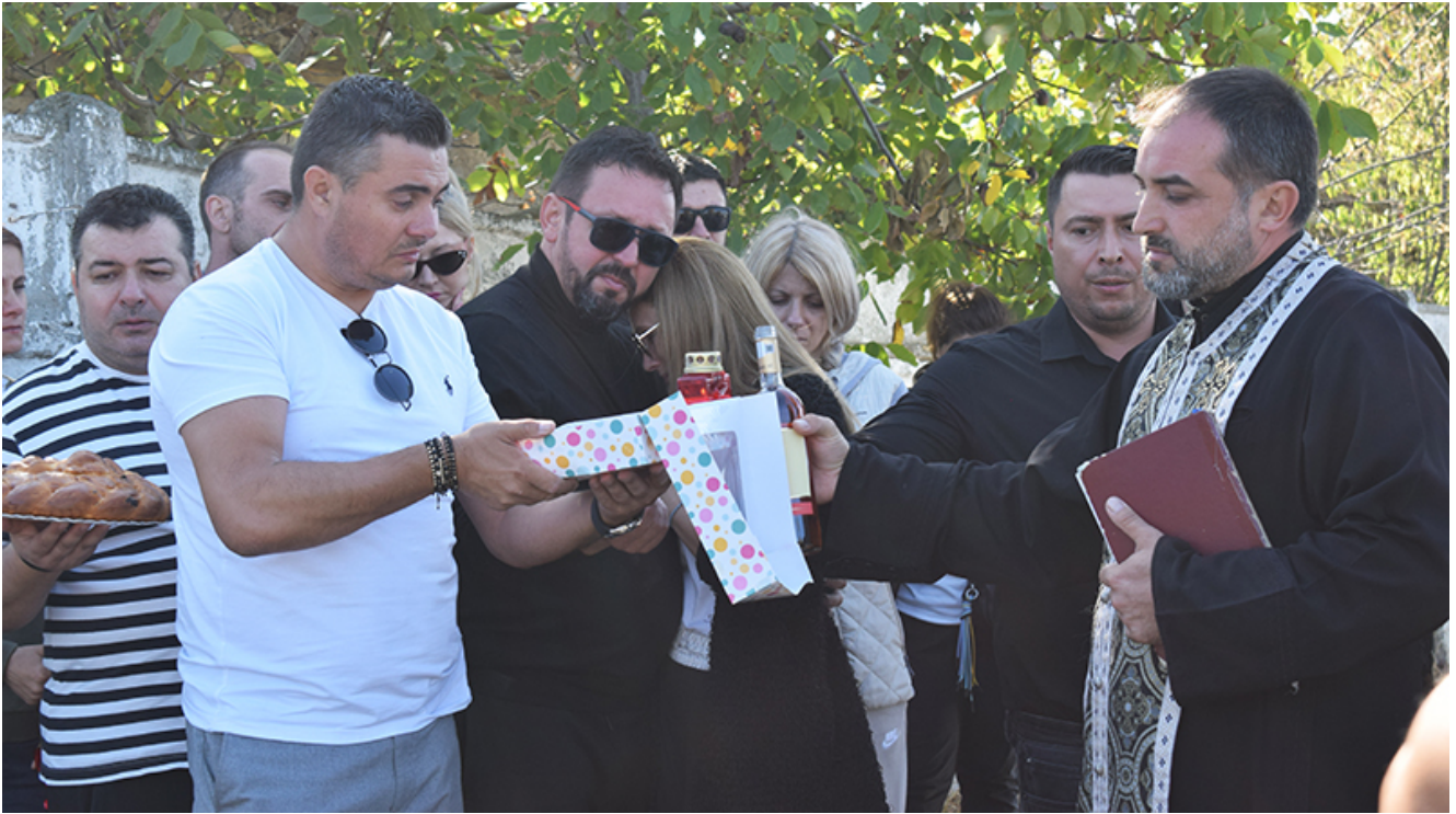
Placă comemorativă Sebi – 2 Mai