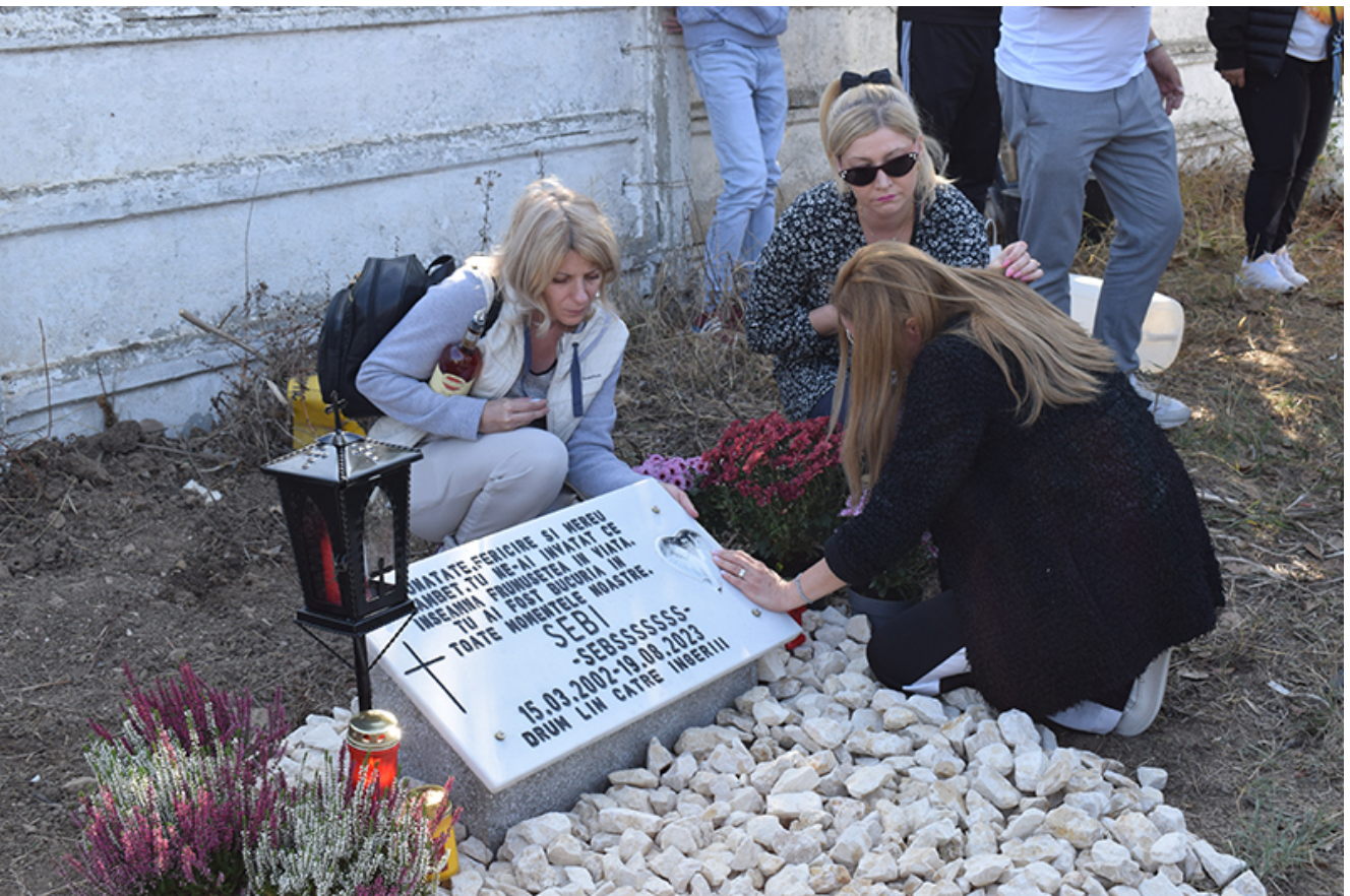
Placă comemorativă Sebi – 2 Mai