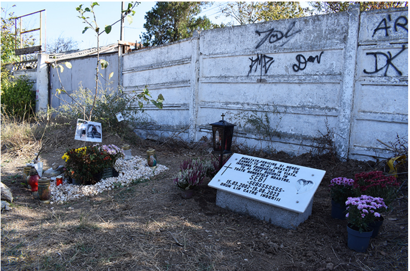
Placă comemorativă Sebi – 2 Mai