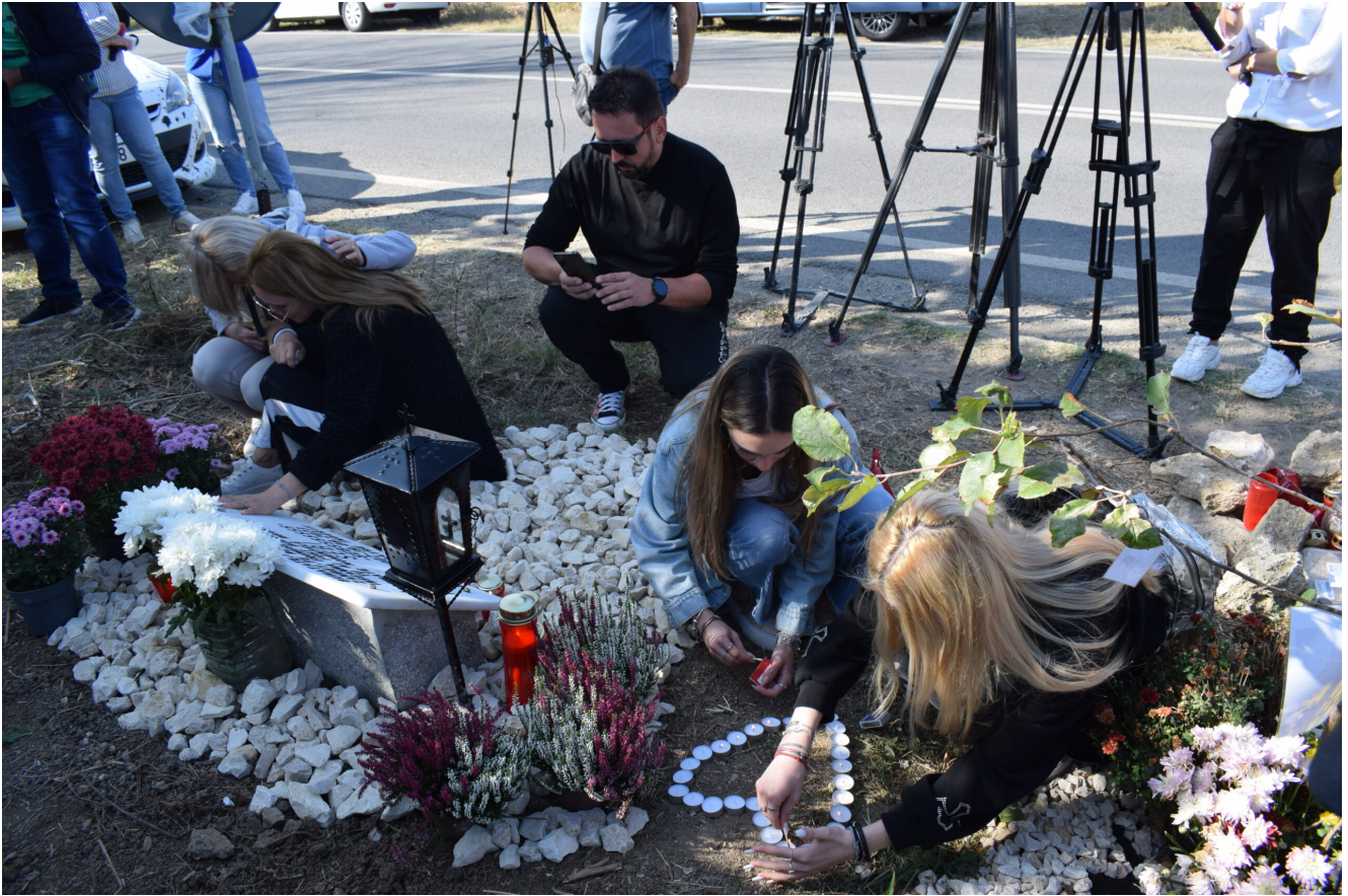
Placă comemorativă Sebi – 2 Mai