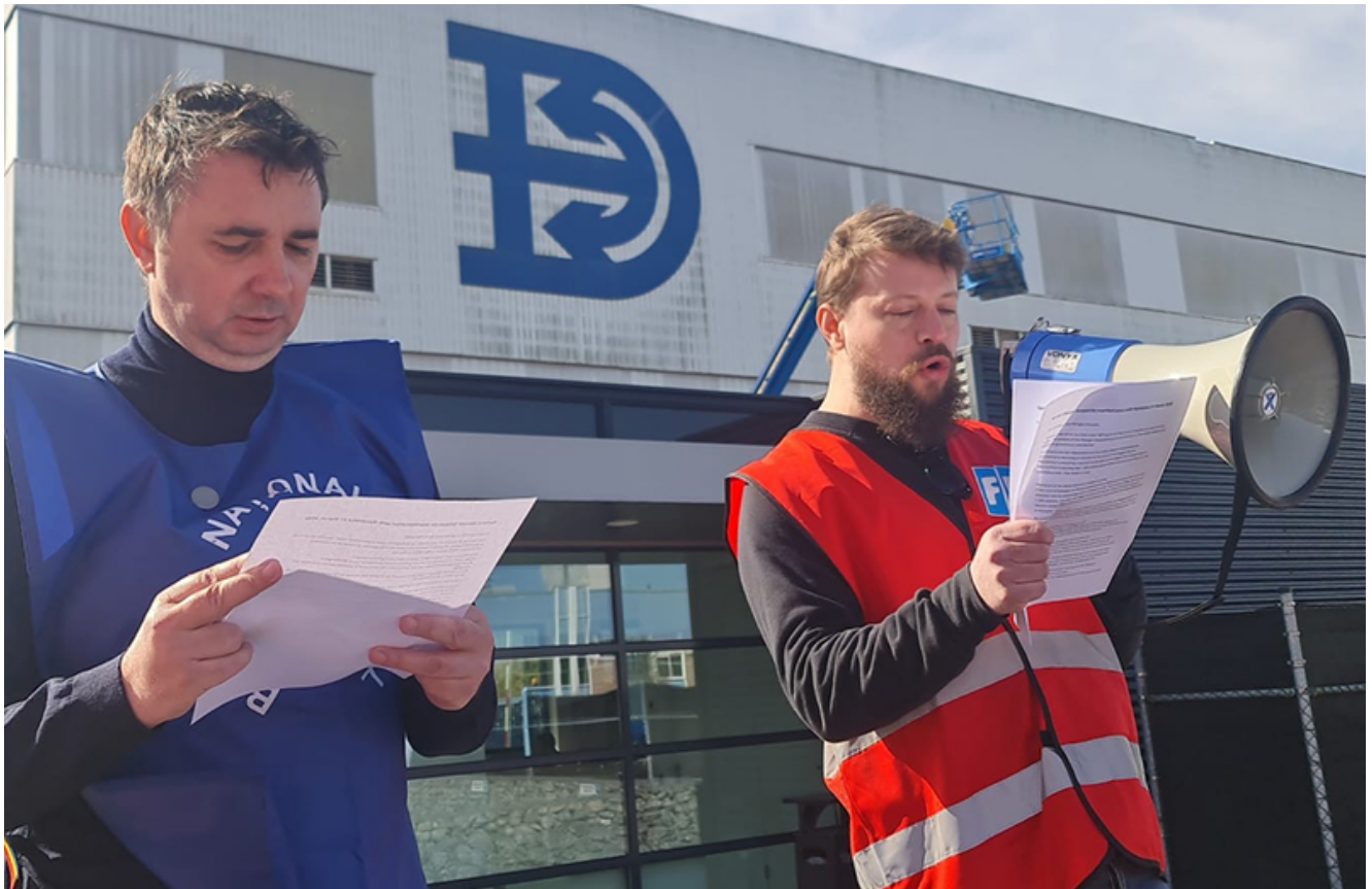
Reprezentanți ai Sindicatului Liber Navalistul au protestat astăzi în fața sediului central al holdingului Damen