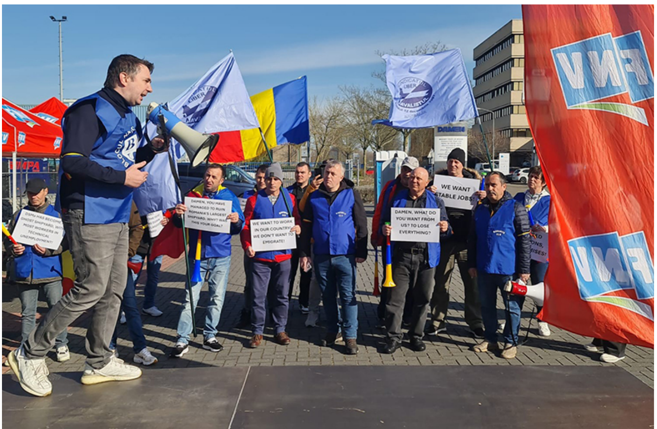
Reprezentanți ai Sindicatului Liber Navalistul au protestat