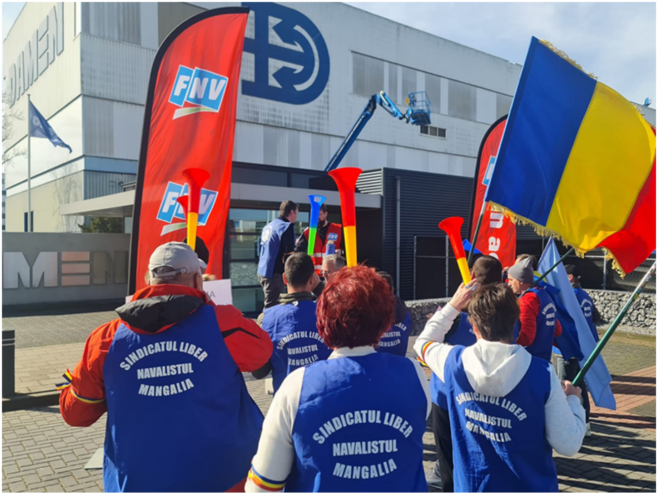
Reprezentanți ai Sindicatului Liber Navalistul au protestat astăzi în fața sediului central al holdingului Damen