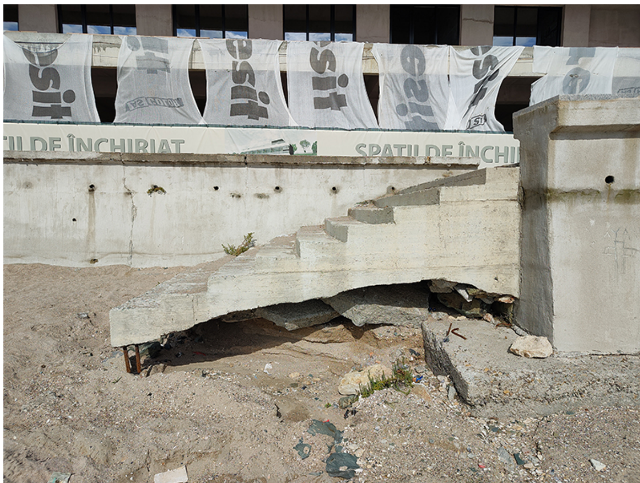
Plaje afectate de inundații

Plajele din sudul litoralului au fost grav afectate de ploile din ultima vreme. Torenții au distrus atât zonele de nisip, dar și căile de acces spre plajă.