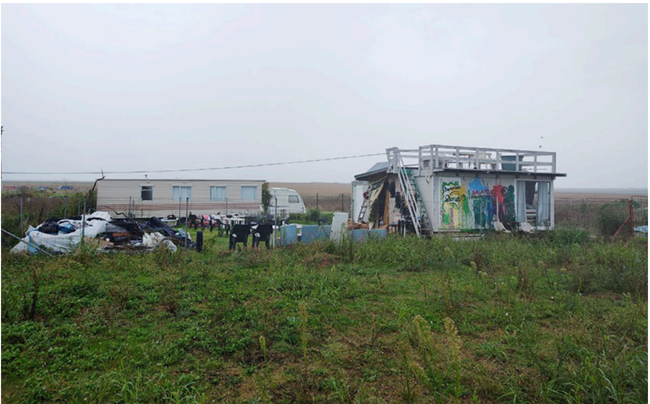
Baraca Dana Marijuana