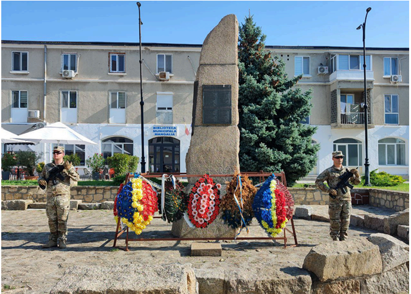
Ziua imnului național