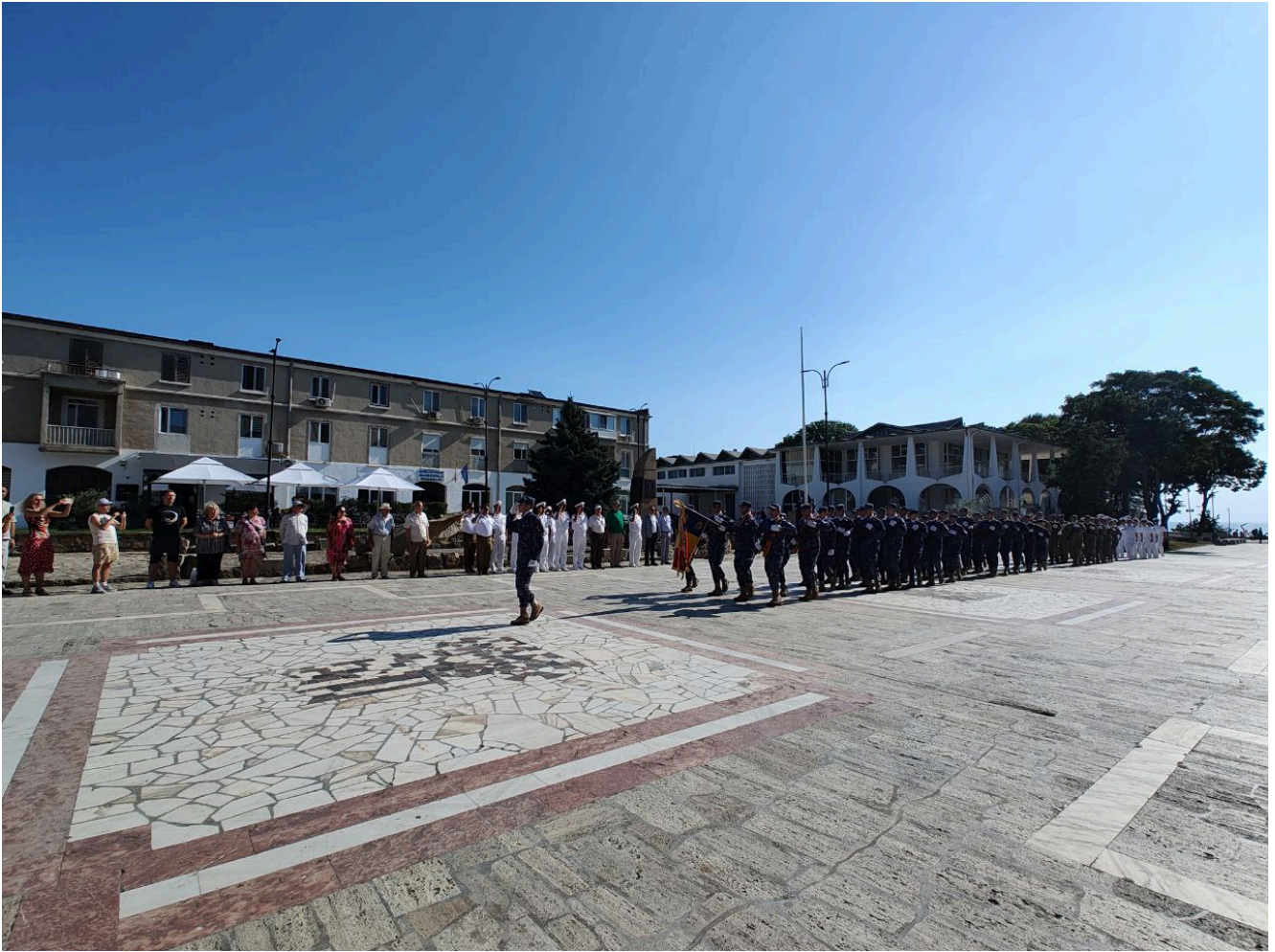
Ziua imnului național