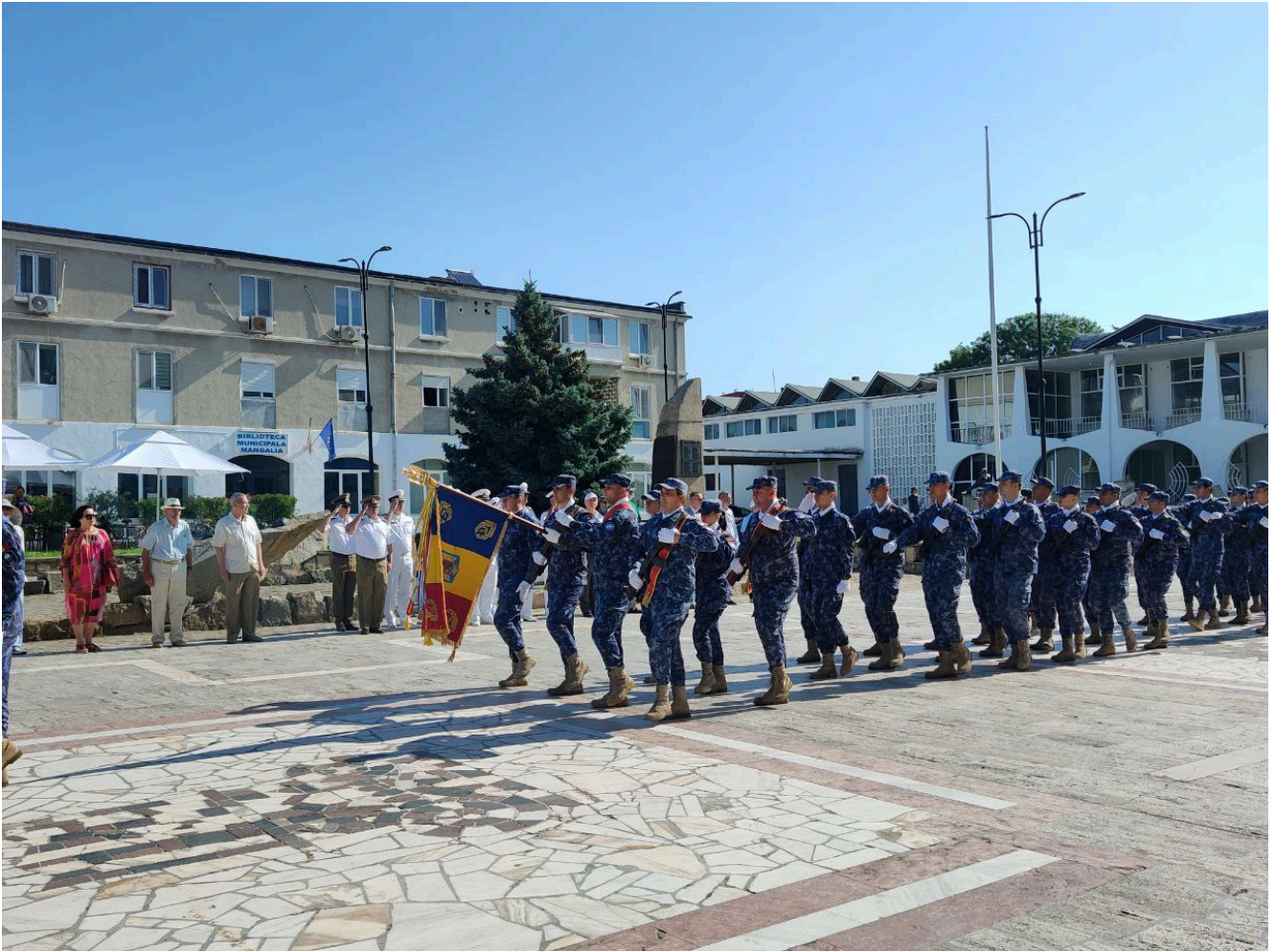
Ziua imnului național