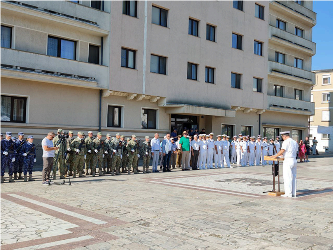
Ziua imnului național