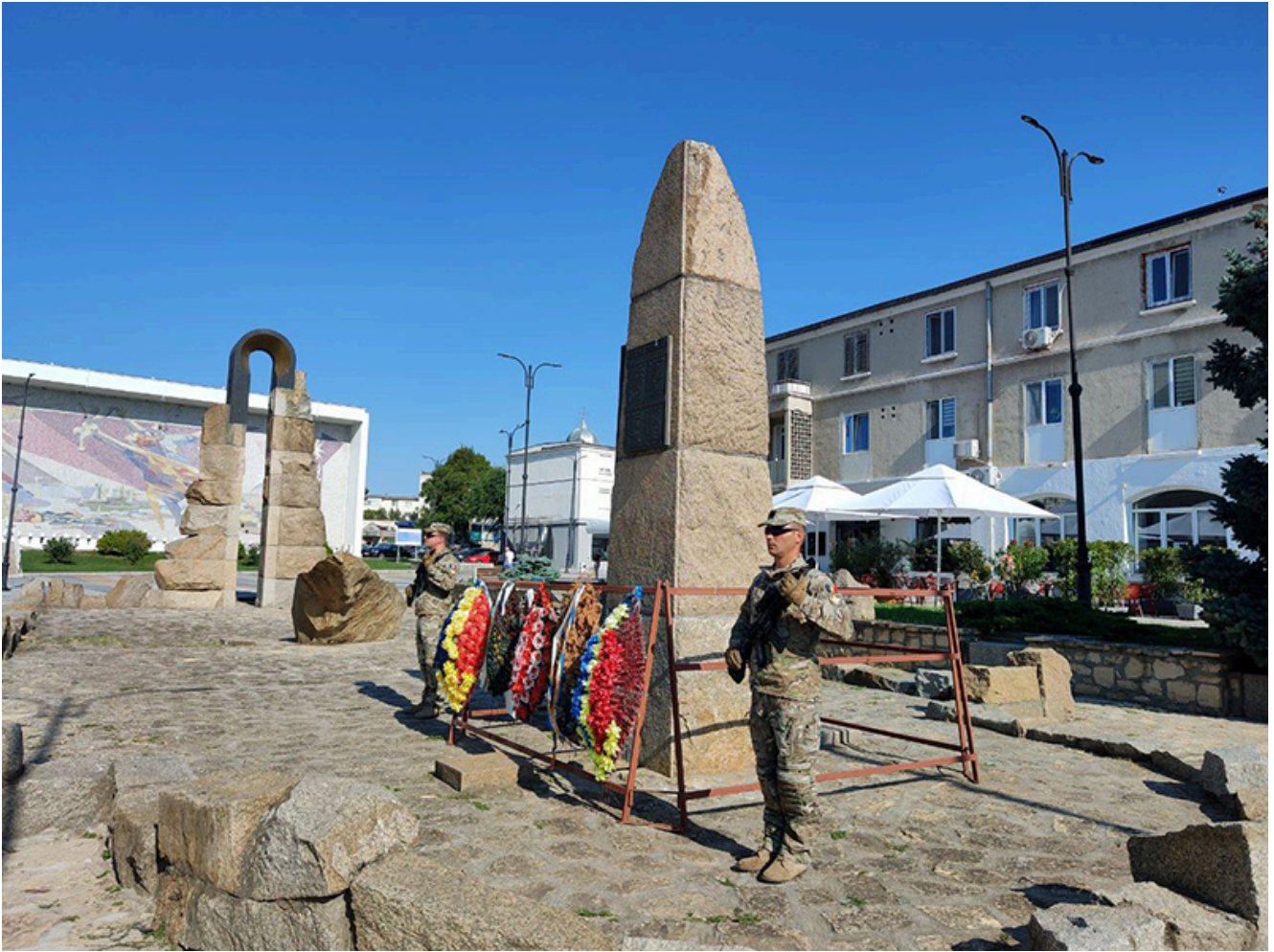
Ziua imnului național