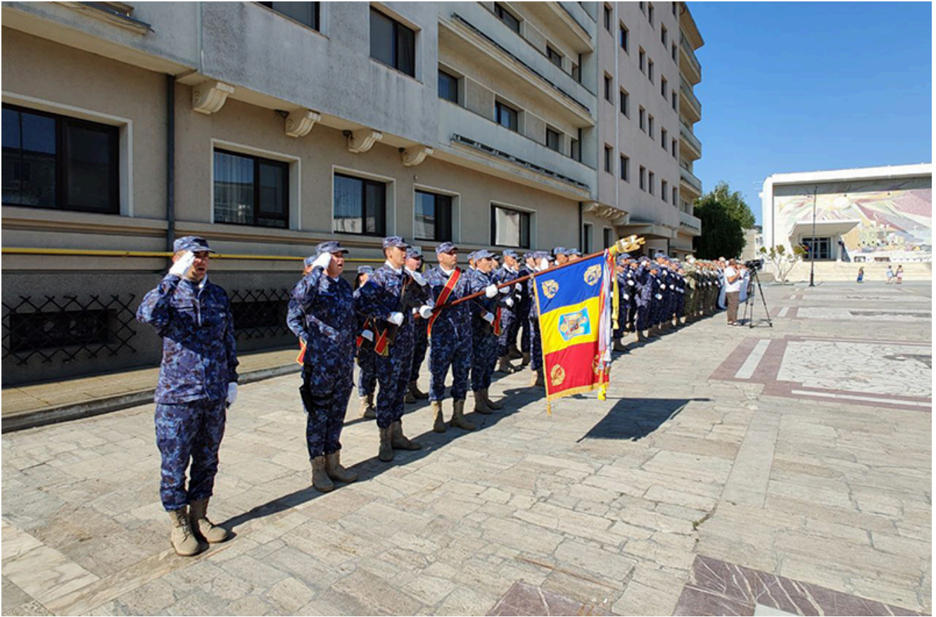
Ziua imnului național