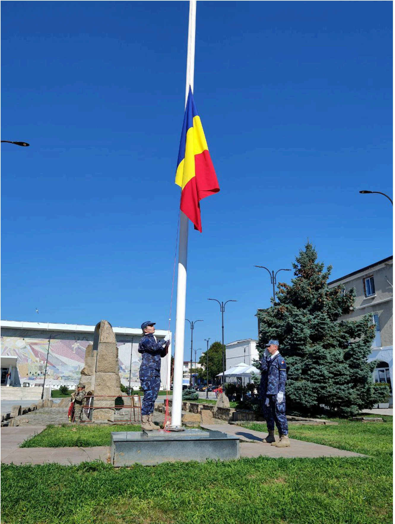
Ziua imnului național