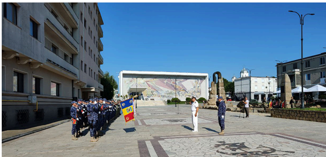
Ziua imnului național