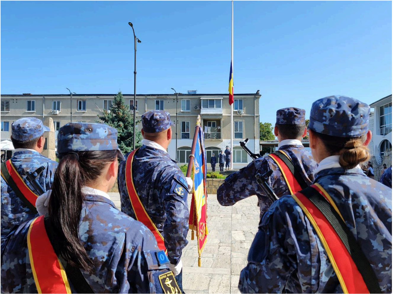
Ziua imnului național