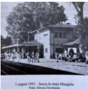
1 august 1995 - Scena la stația Mangalia