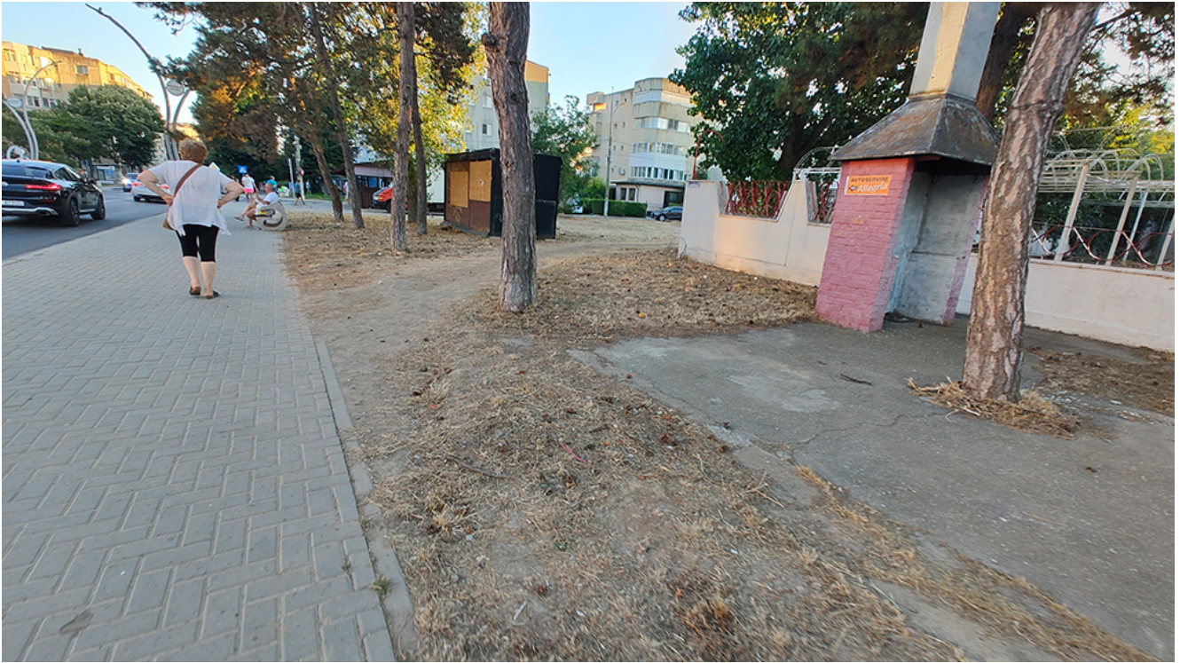
DEZASTRU în Parcul Diana și zona din jurul acestuia