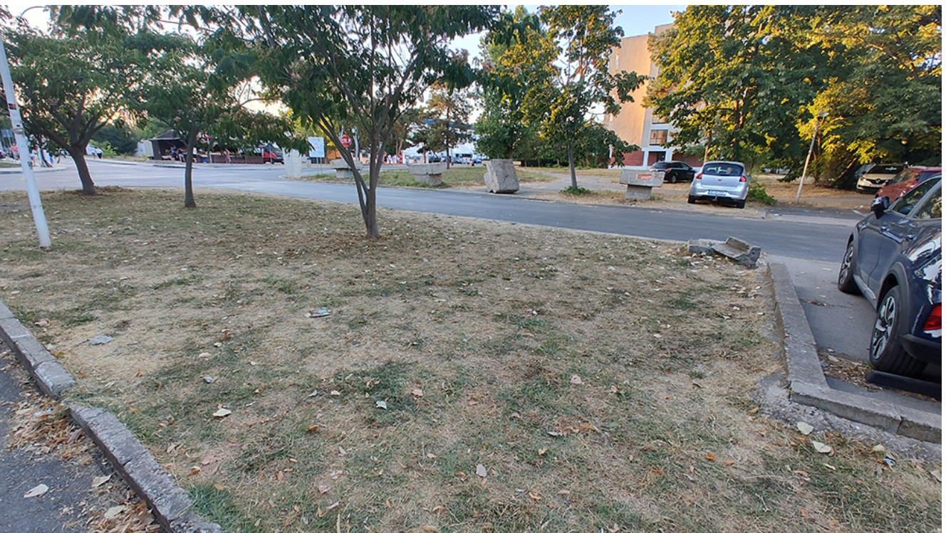
DEZASTRU în Parcul Diana și zona din jurul acestuia