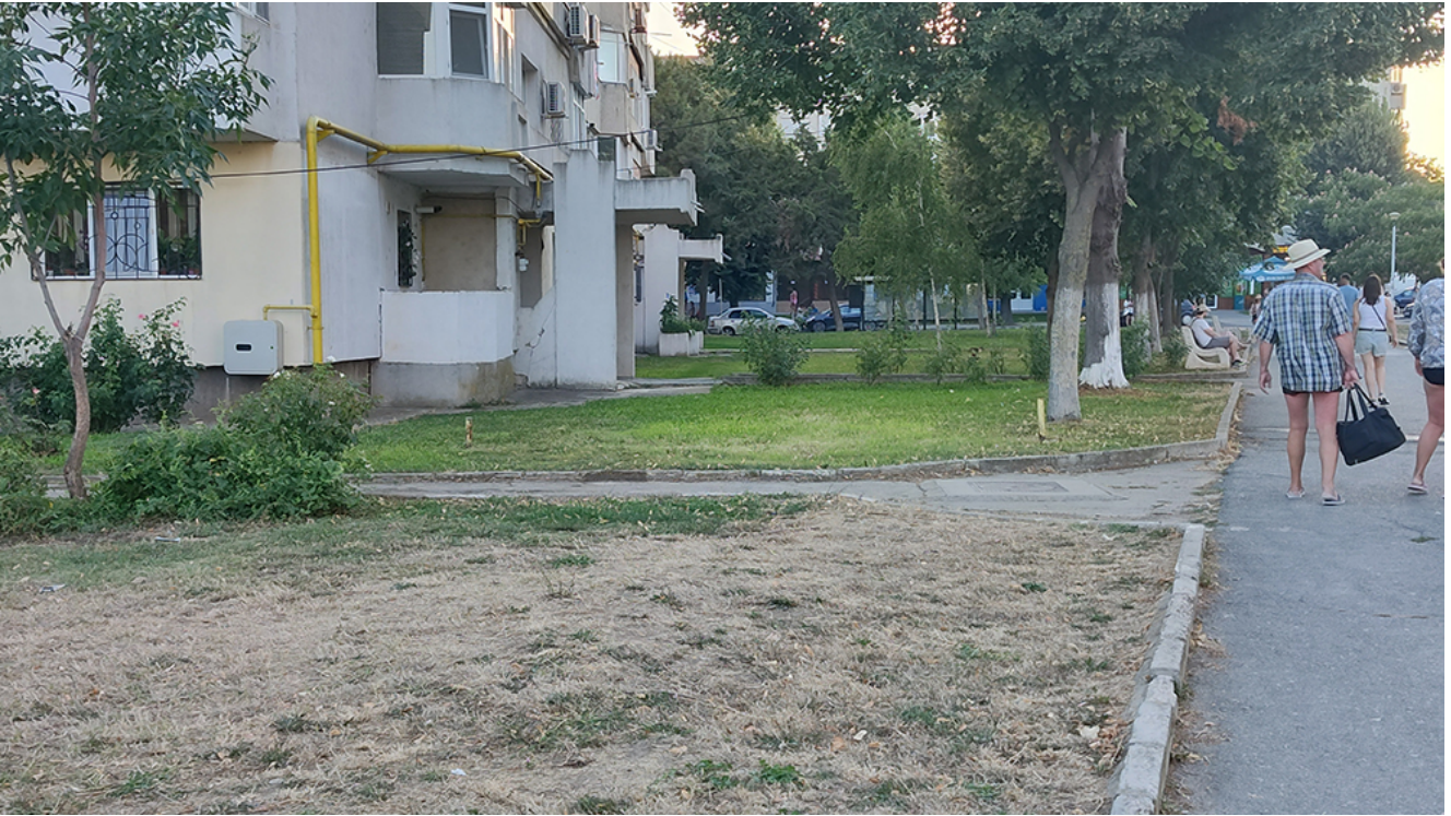
DEZASTRU în Parcul Diana și zona din jurul acestuia