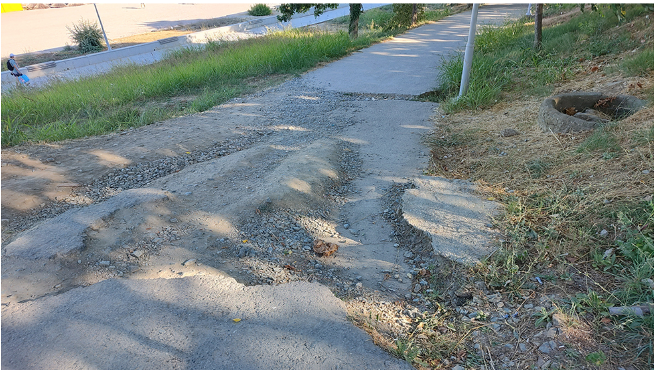
DEZASTRU în Parcul Diana și zona din jurul acestuia