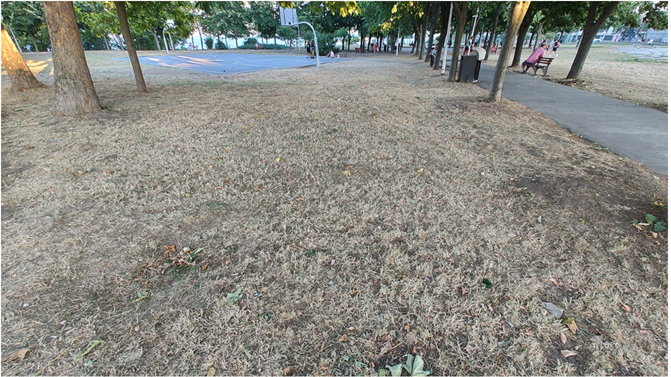
DEZASTRU în Parcul Diana și zona din jurul acestuia