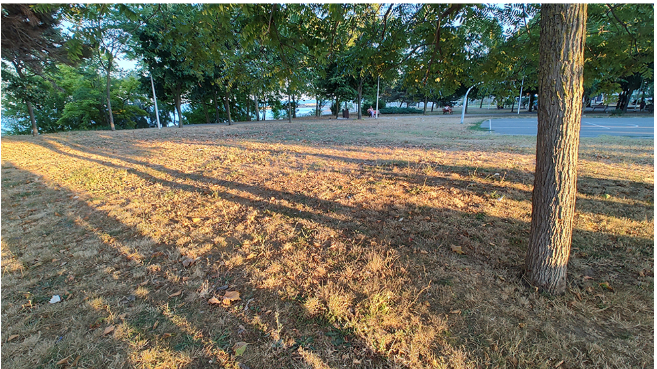
DEZASTRU în Parcul Diana și zona din jurul acestuia