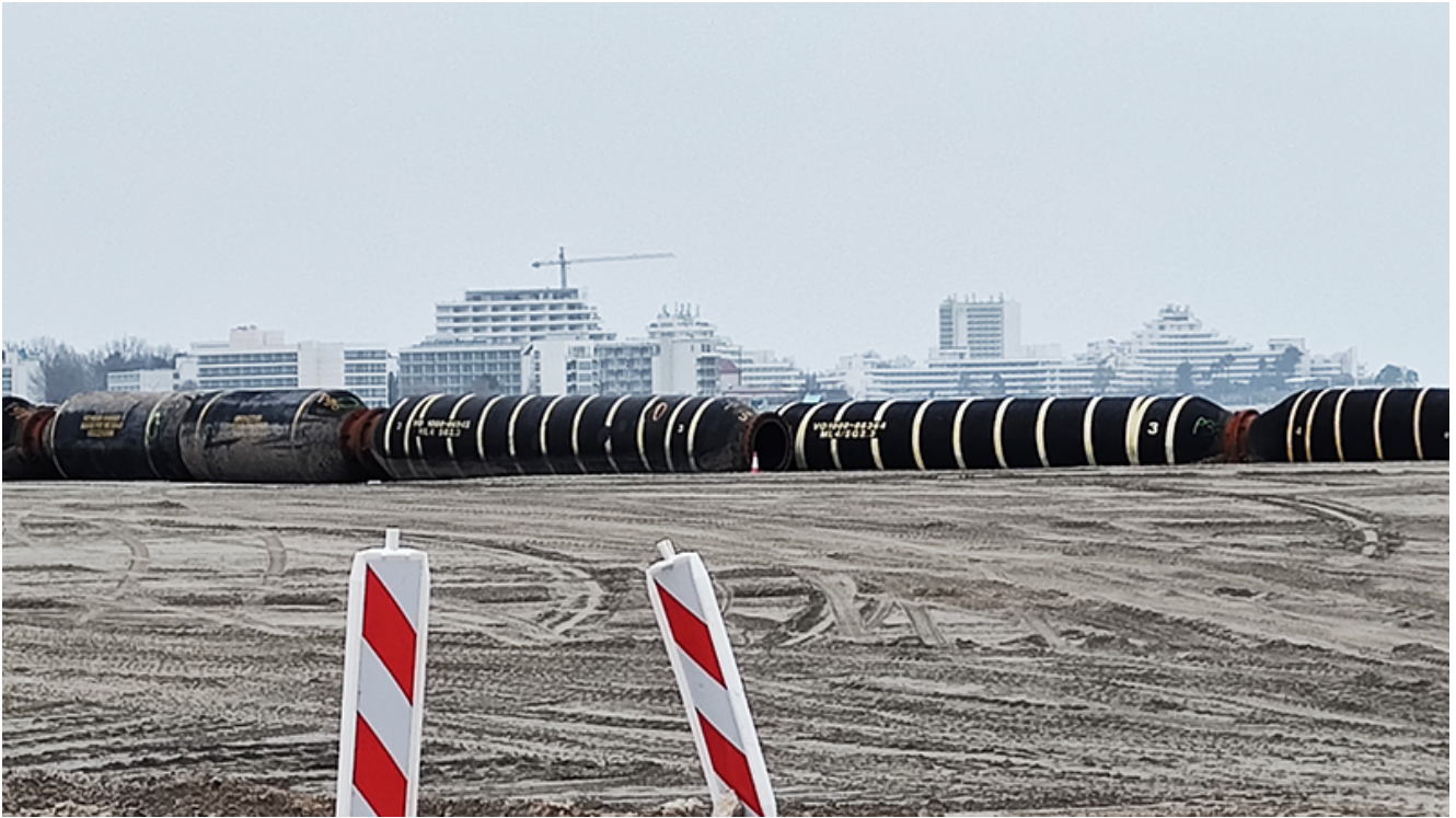
Plaja lărgită de la Venus