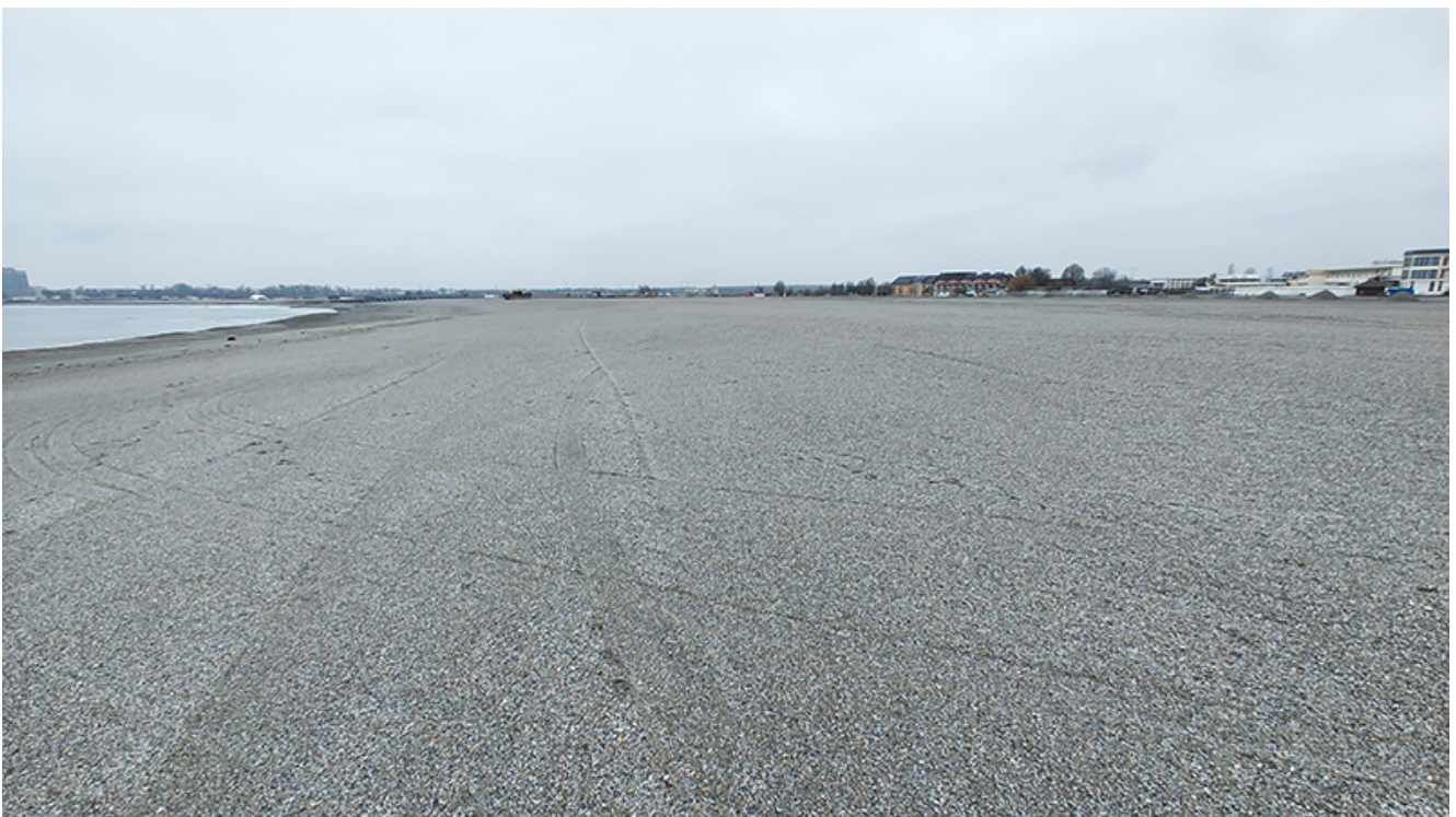
Plaja lărgită de la Venus