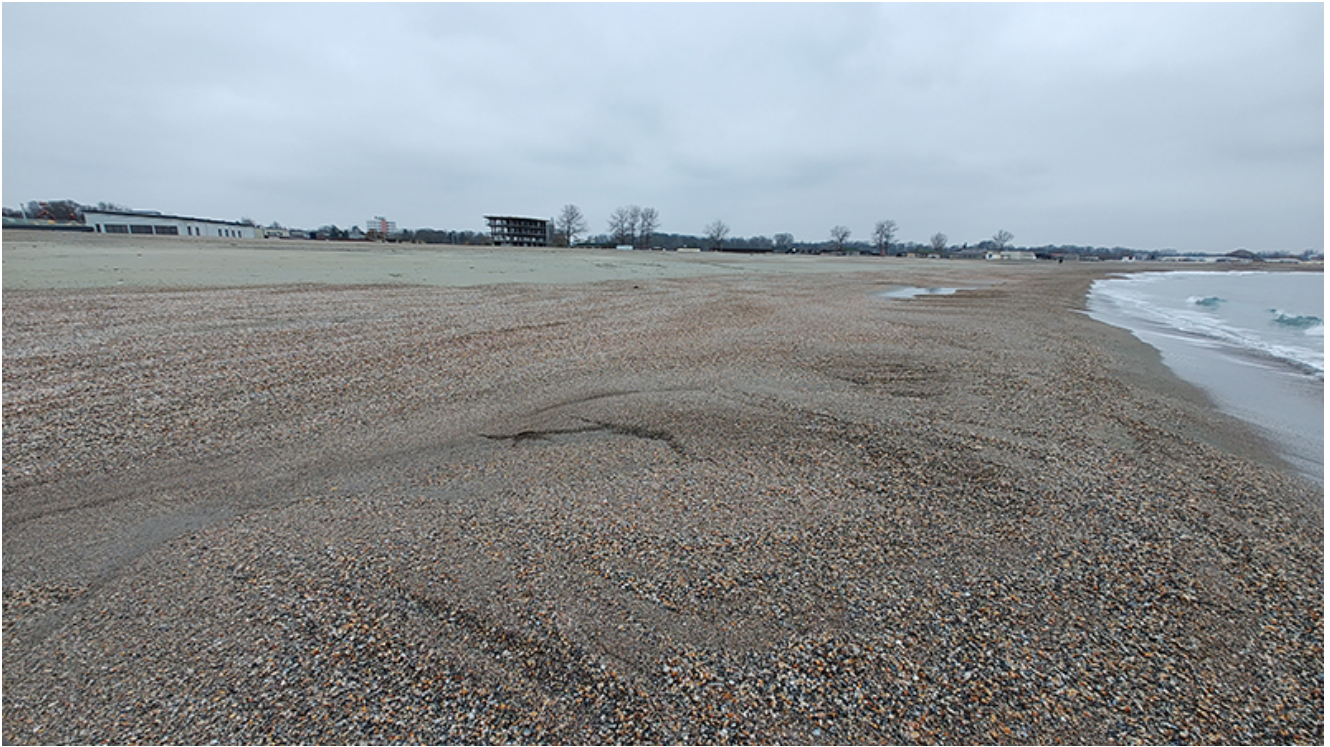
Plaja lărgită de la Venus