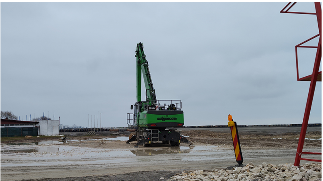
Plaja lărgită de la Venus