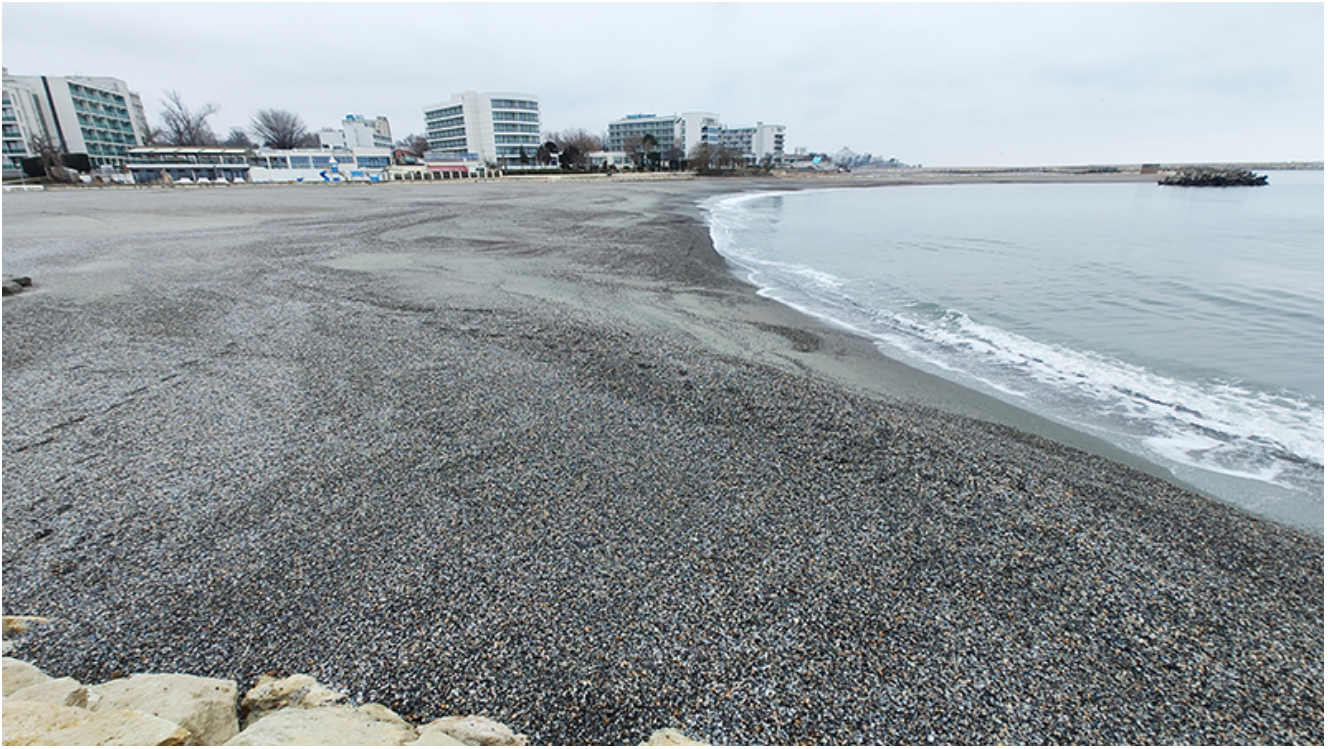
Plaja lărgită de la Venus