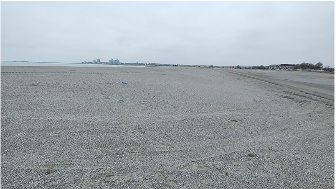
Plaja lărgită de la Venus