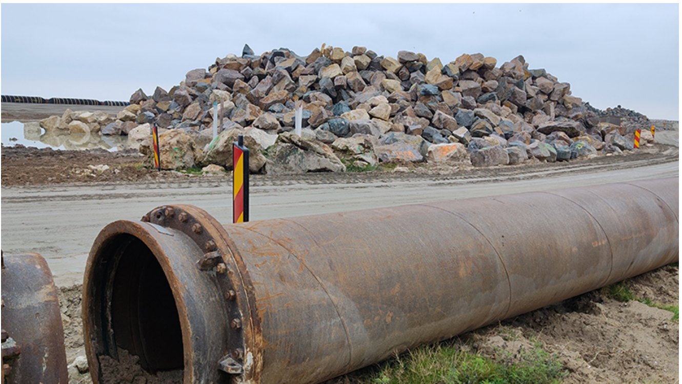
Plaja lărgită de la Venus

La Jupiter procesul de înnisipare s-a terminat, constructorul urmând să repare ceea ce s-a distrus în urma furtunilor din ultimele zile.