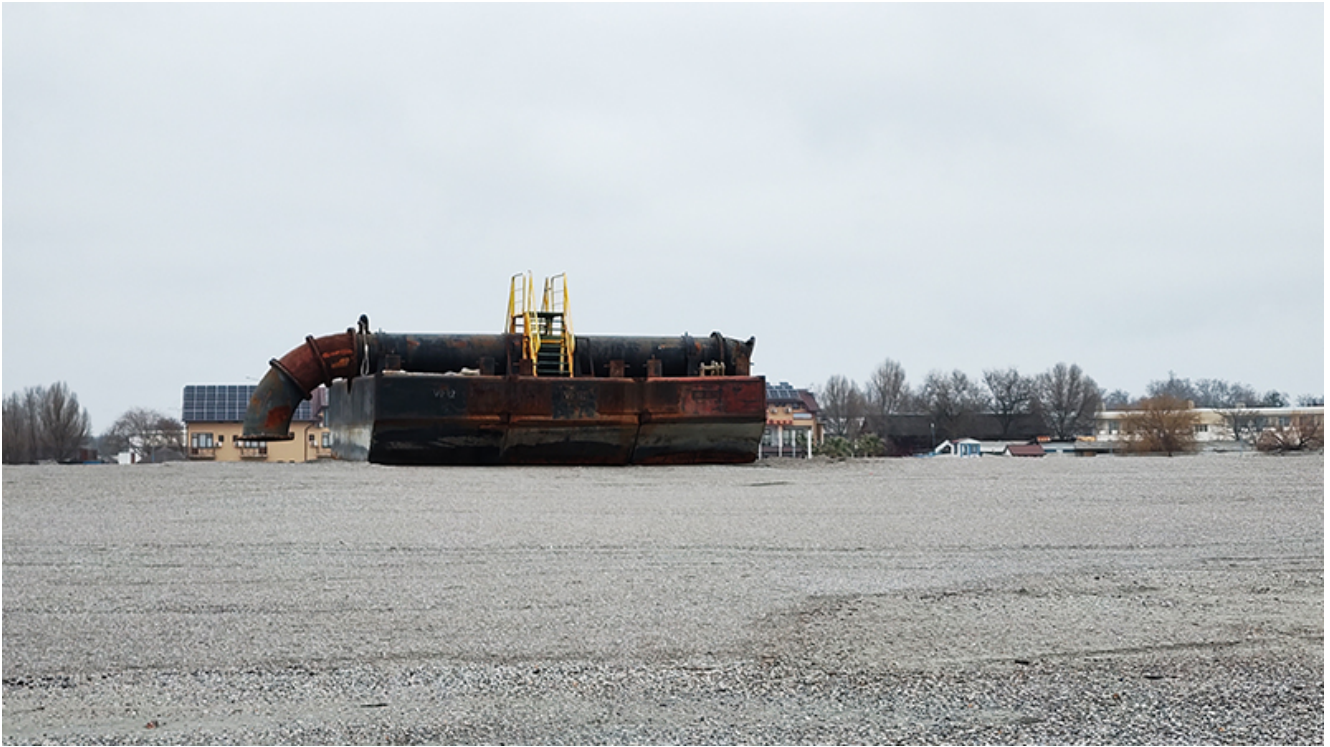
Plaja lărgită de la Venus