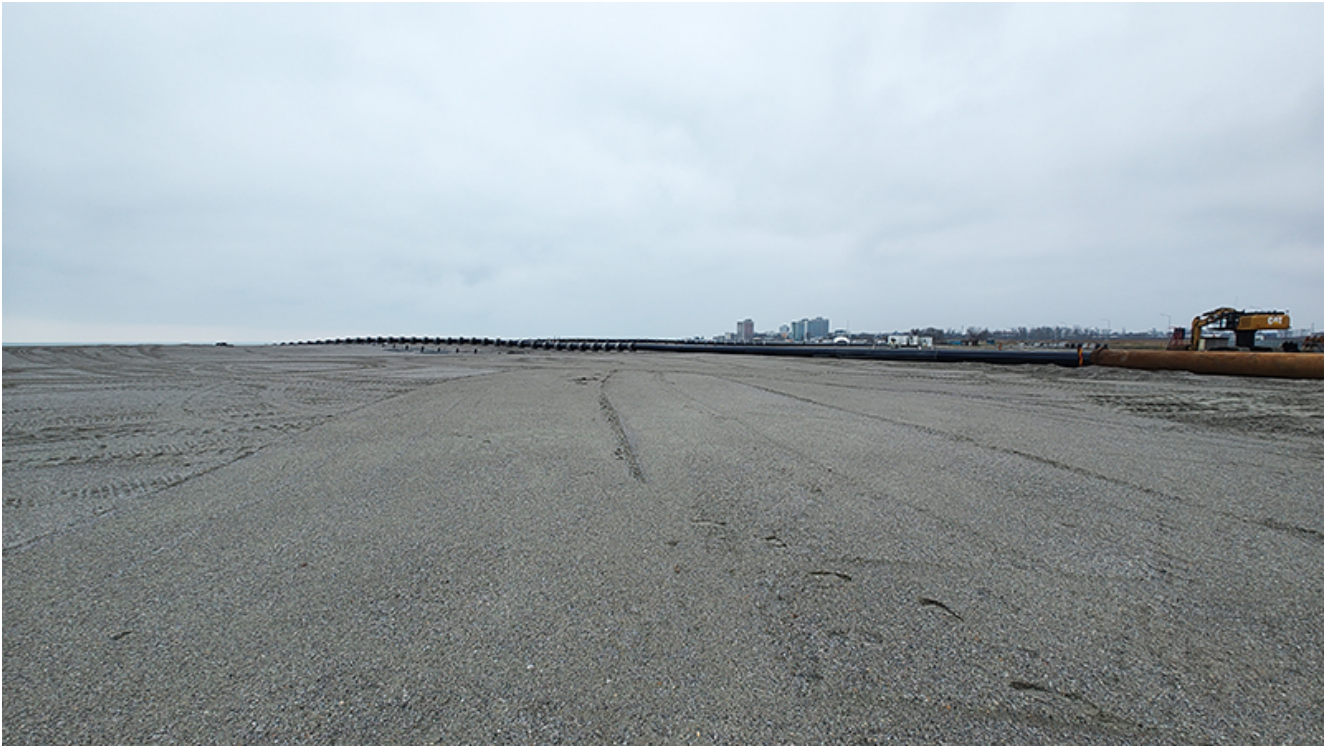
Plaja lărgită de la Venus