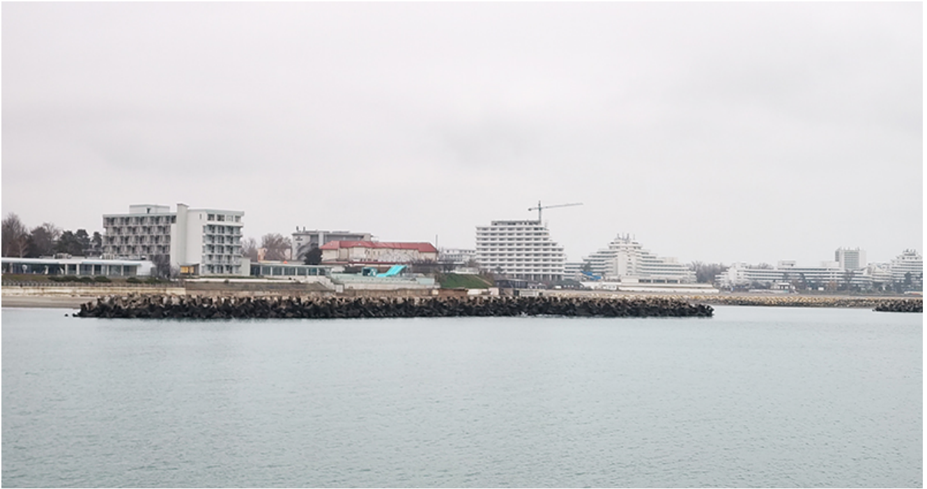
Plaja lărgită de la Venus