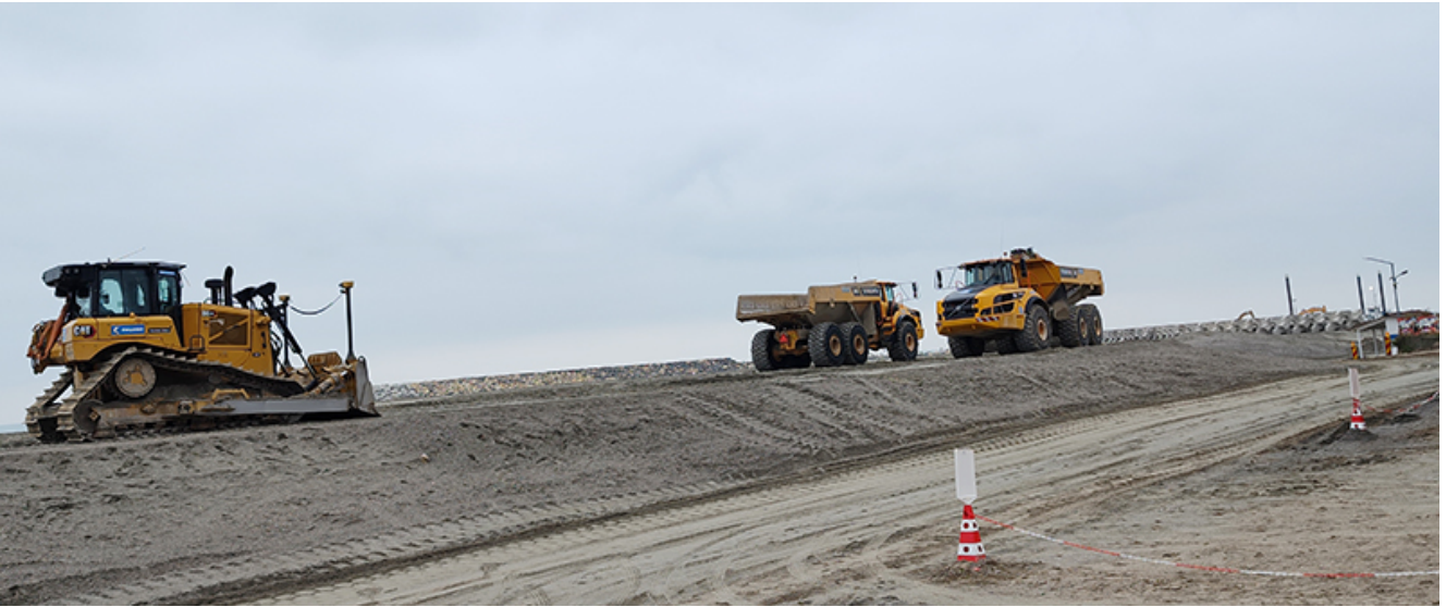
Plaja lărgită de la Venus