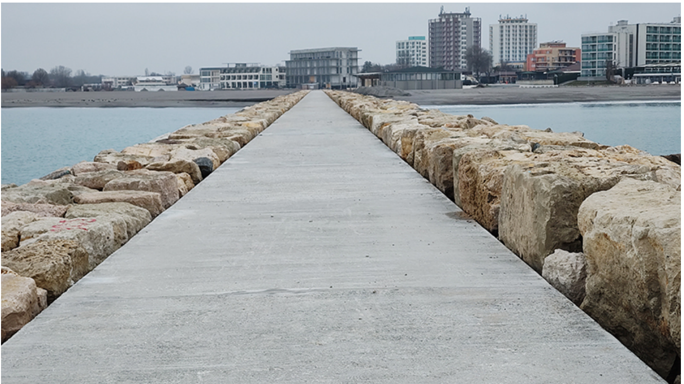
Plaja lărgită de la Venus