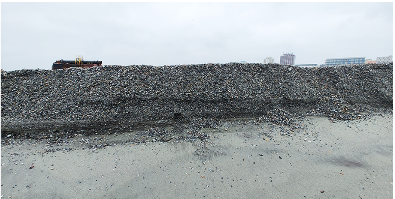
Plaja lărgită de la Venus