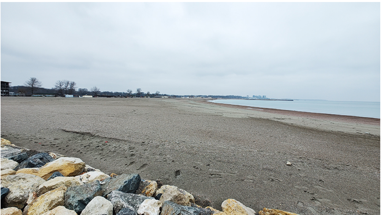
Plaja lărgită de la Venus