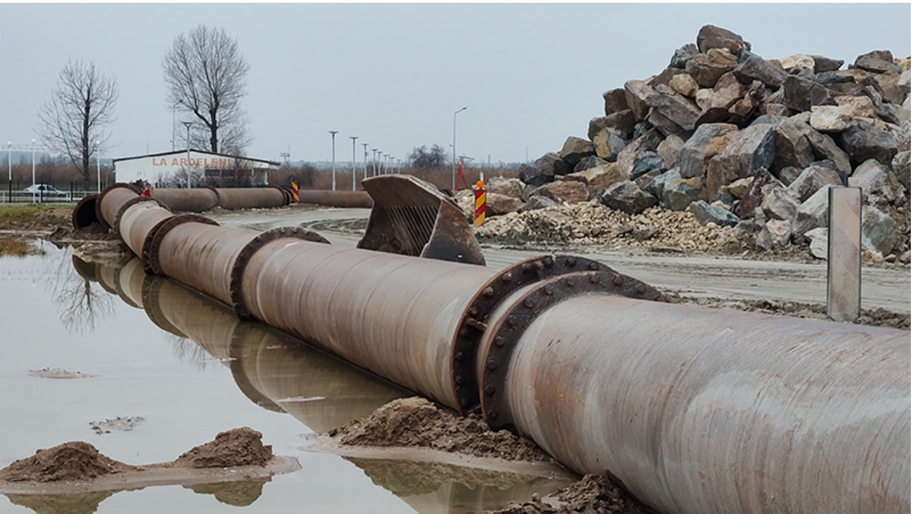
Plaja lărgită de la Venus