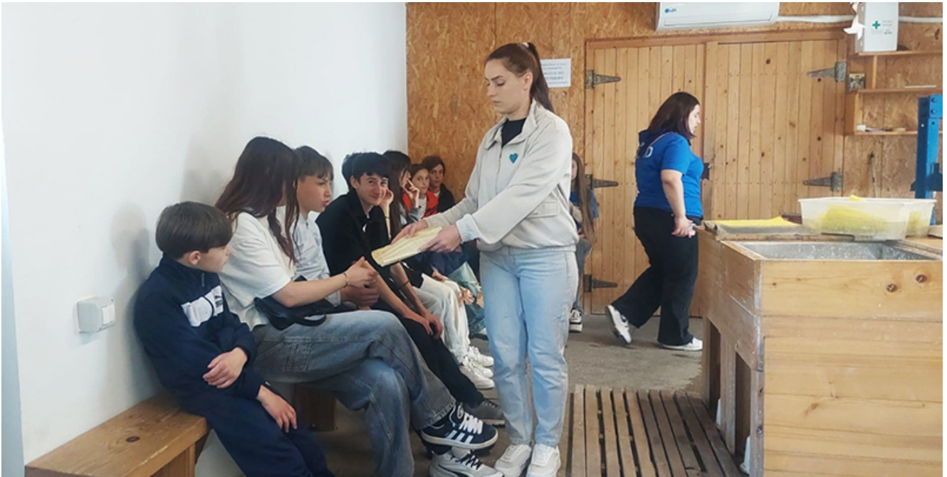
80 de elevi ai Școlii gimnaziale nr. 1 Contraamiral Petrică Stoica din Pecineaga au vizitat Moara de hârtie