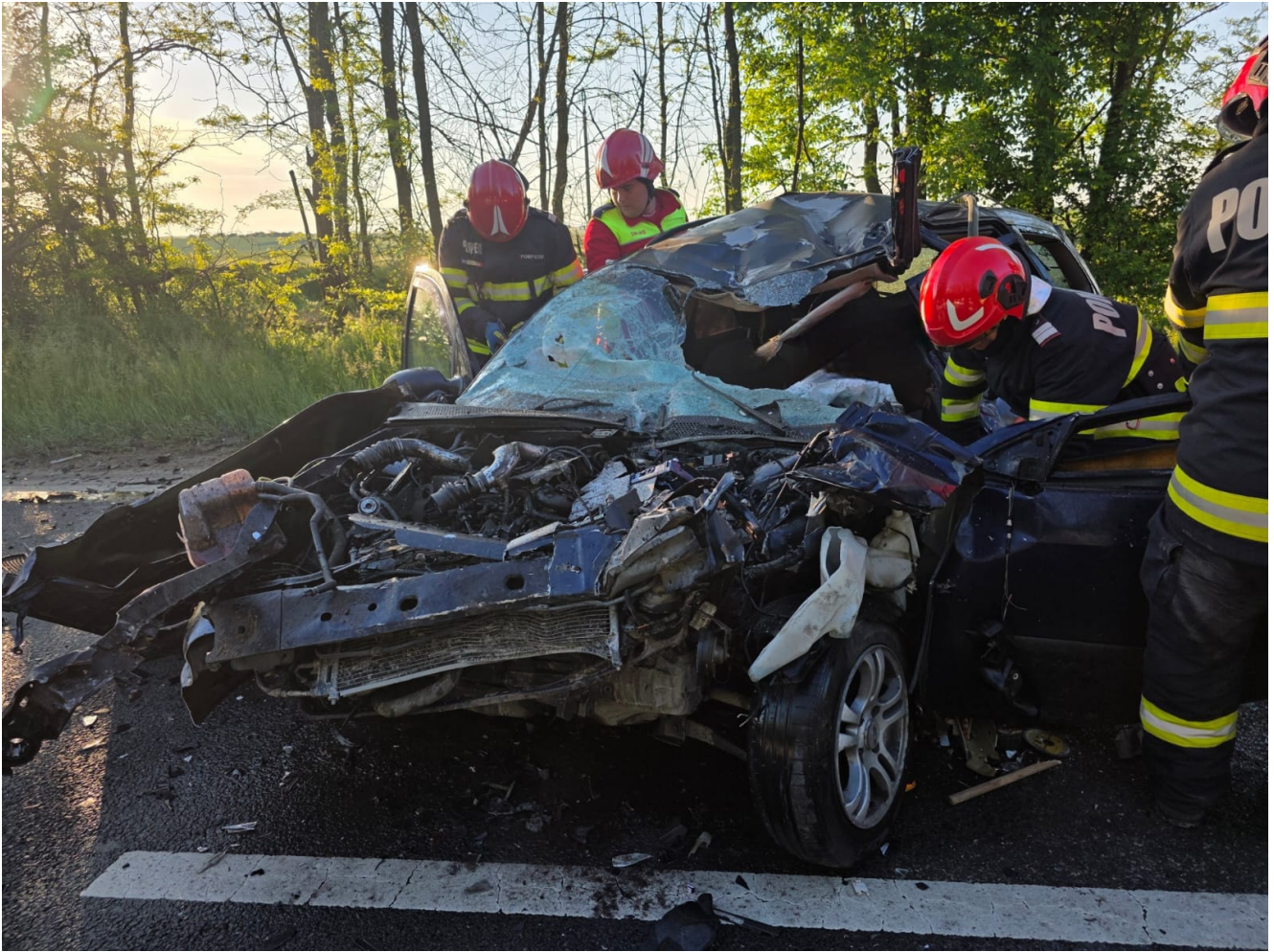
Accident rutier MORTAL între Tuzla și Costinești