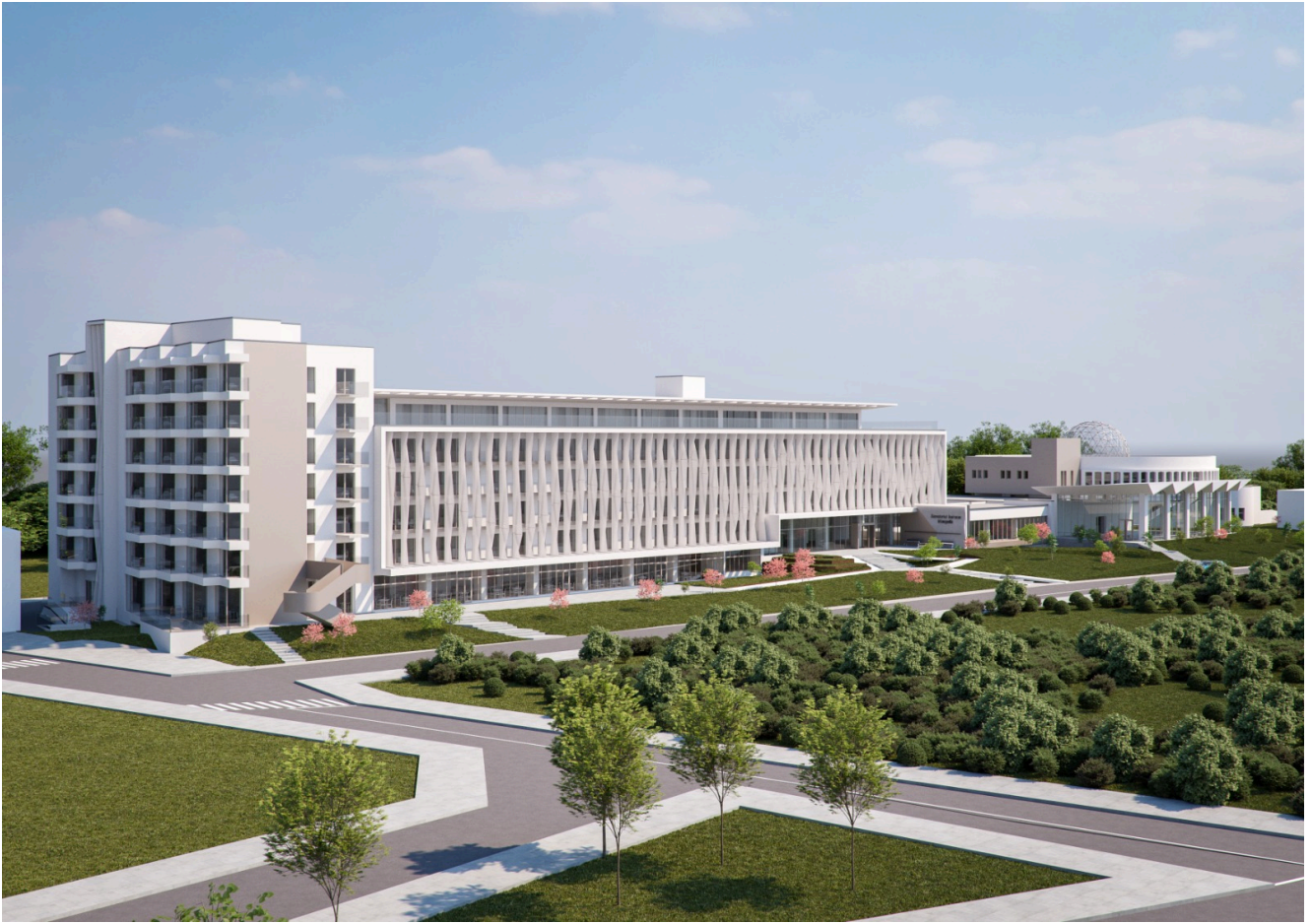
Sanatoriul Balnear și de Recuperare Mangalia