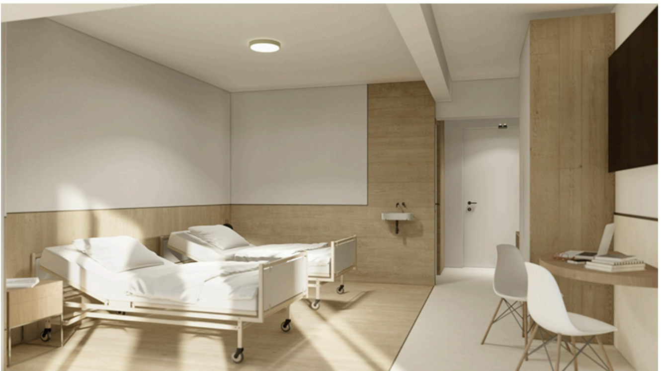
Sanatoriul Balnear și de Recuperare Mangalia