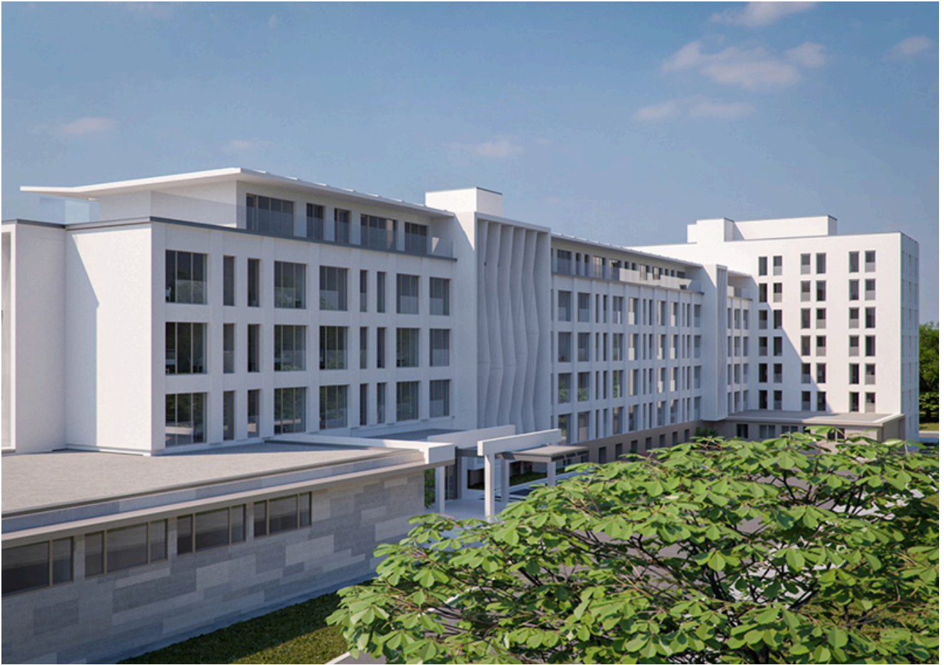
Sanatoriul Balnear și de Recuperare Mangalia