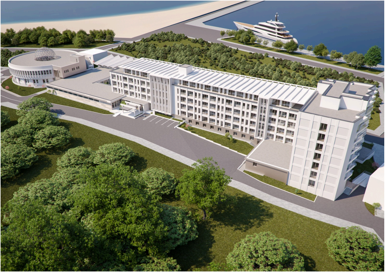
Sanatoriul Balnear și de Recuperare Mangalia