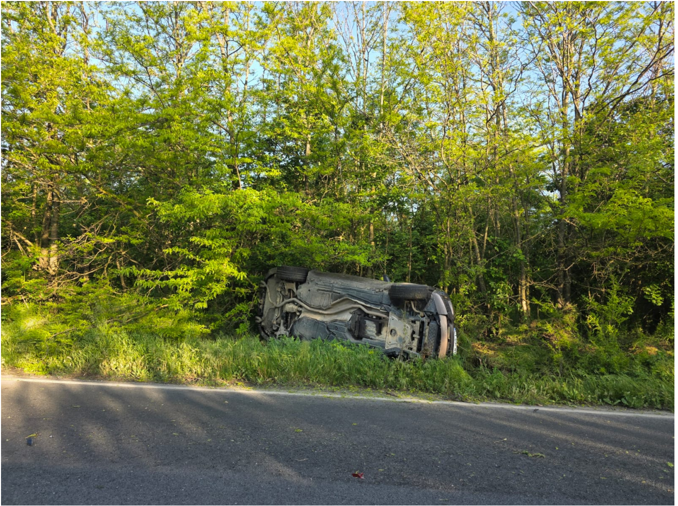
Accident rutier MORTAL între Tuzla și Costinești