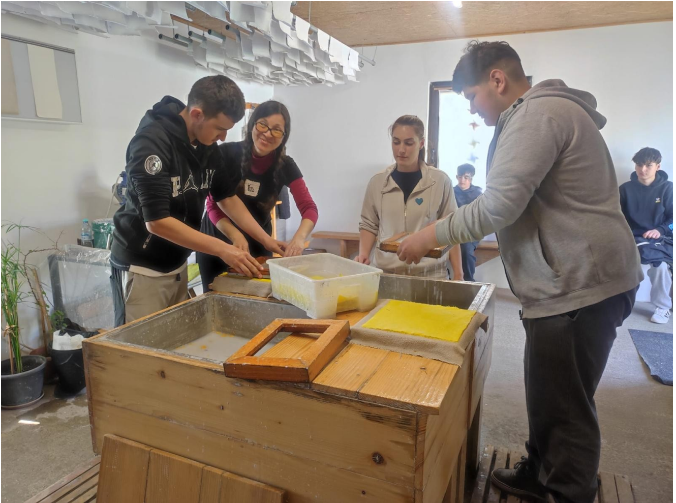
80 de elevi ai Școlii gimnaziale nr. 1 Contraamiral Petrică Stoica din Pecineaga au vizitat Moara de hârtie