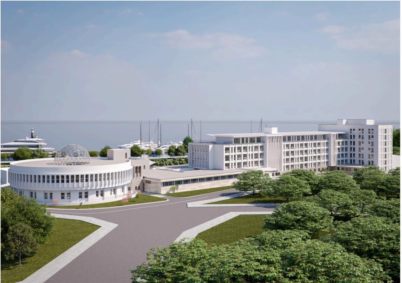
Sanatoriul Balnear și de Recuperare Mangalia