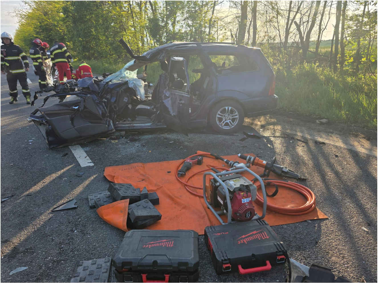
Accident rutier MORTAL între Tuzla și Costinești