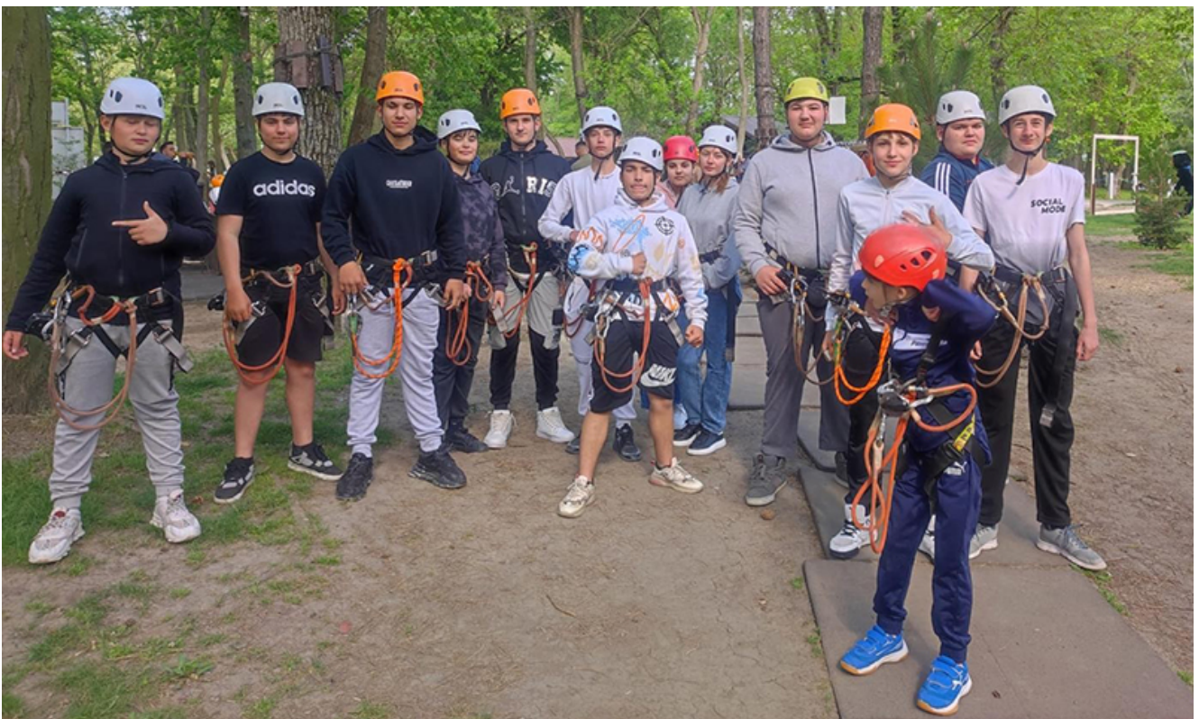
80 de elevi ai Școlii gimnaziale nr. 1 Contraamiral Petrică Stoica din Pecineaga au vizitat Moara de hârtie