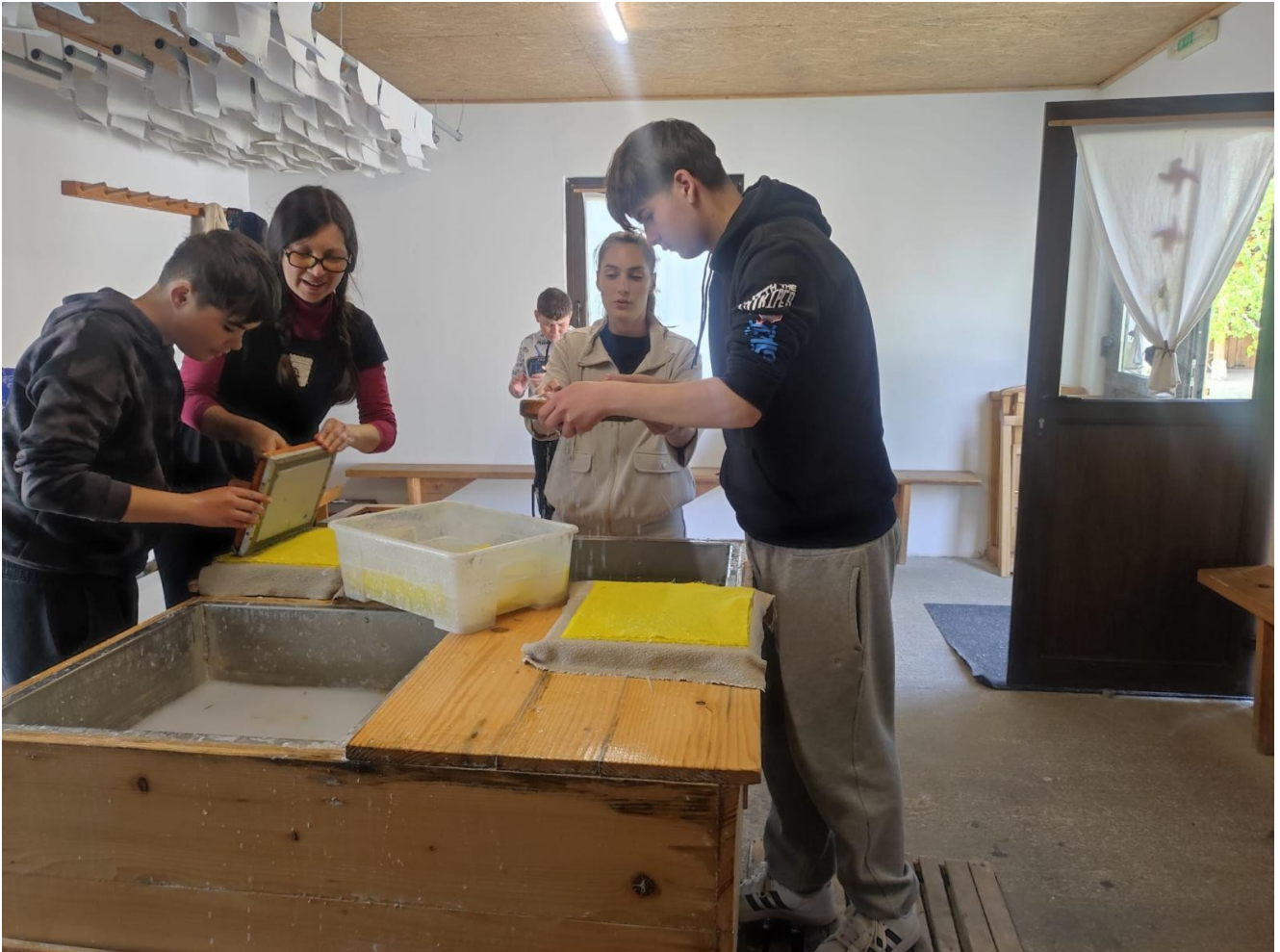
80 de elevi ai Școlii gimnaziale nr. 1 Contraamiral Petrică Stoica din Pecineaga au vizitat Moara de hârtie