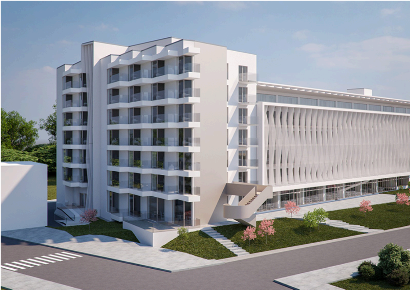
Sanatoriul Balnear și de Recuperare Mangalia