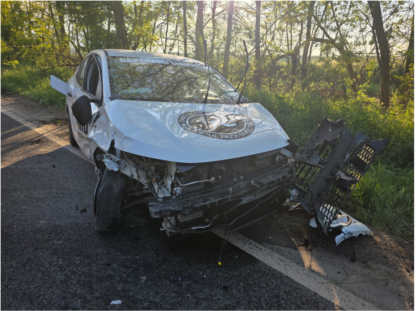
Accident rutier MORTAL între Tuzla și Costinești