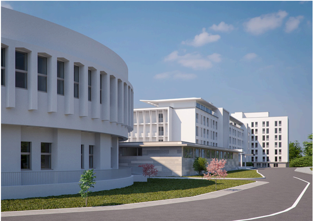
Sanatoriul Balnear și de Recuperare Mangalia

Mulțumim colegilor și tuturor celor care pun suflet în acest proiect”, transmit reprezentanții Sanatoriului Balnear și de Recuperare Mangalia.