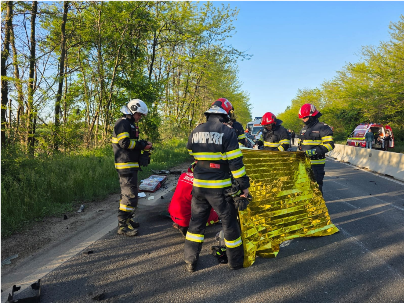
Accident rutier MORTAL între Tuzla și Costinești

Nicușor Dan este noul președinte al României: 53,6% la 46,6% față de George Simion