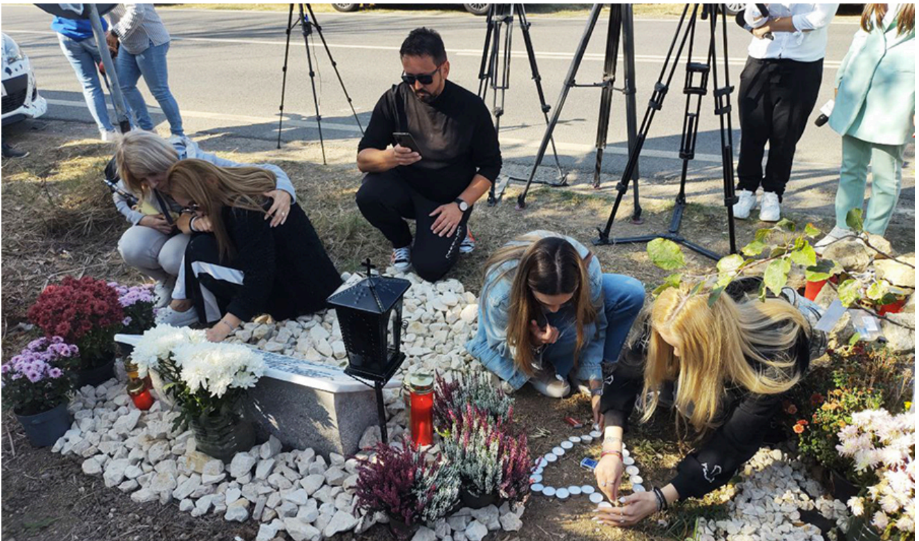
Placă comemorativă Sebi – 2 Mai