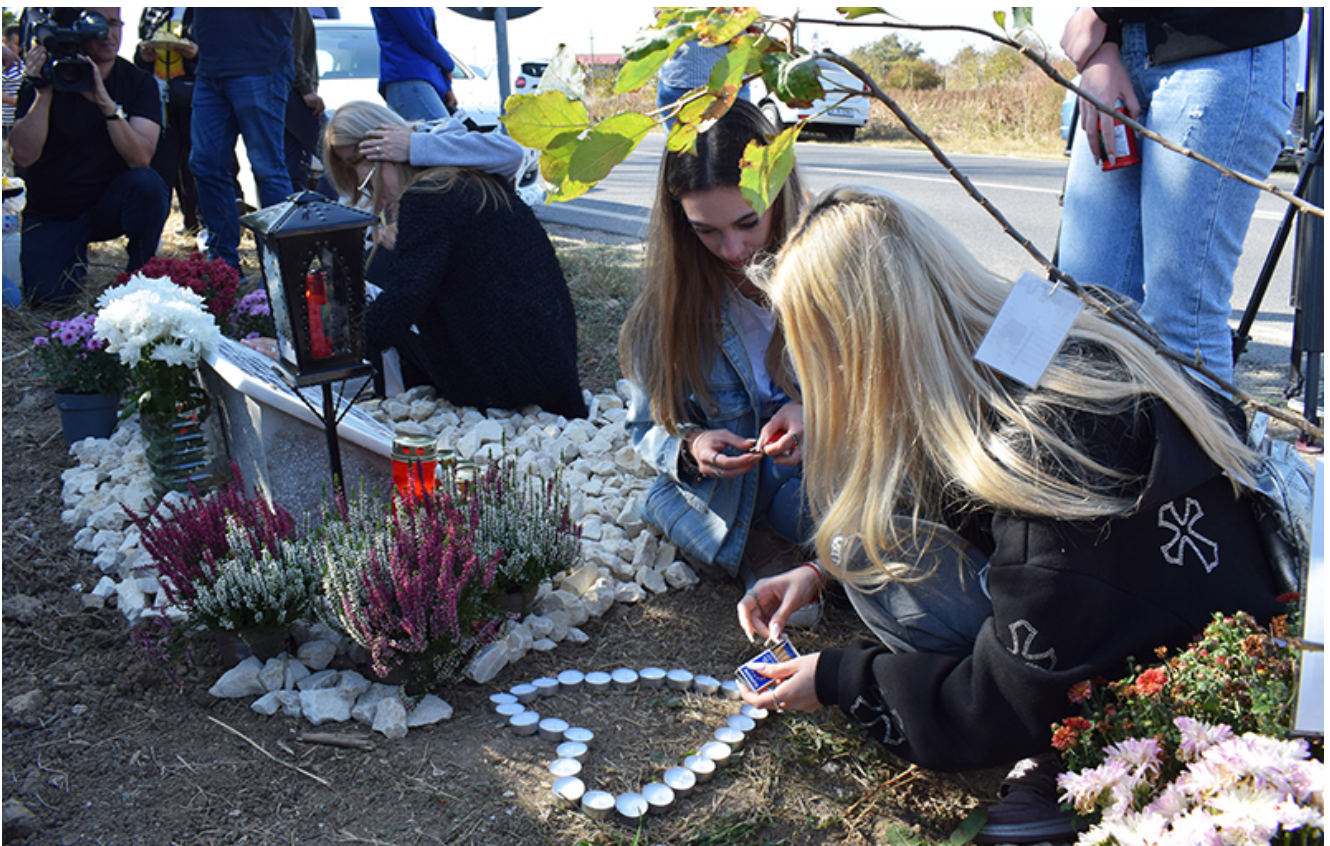
Placă comemorativă Sebi – 2 Mai