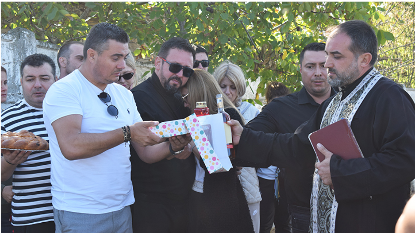
Placă comemorativă Sebi – 2 Mai