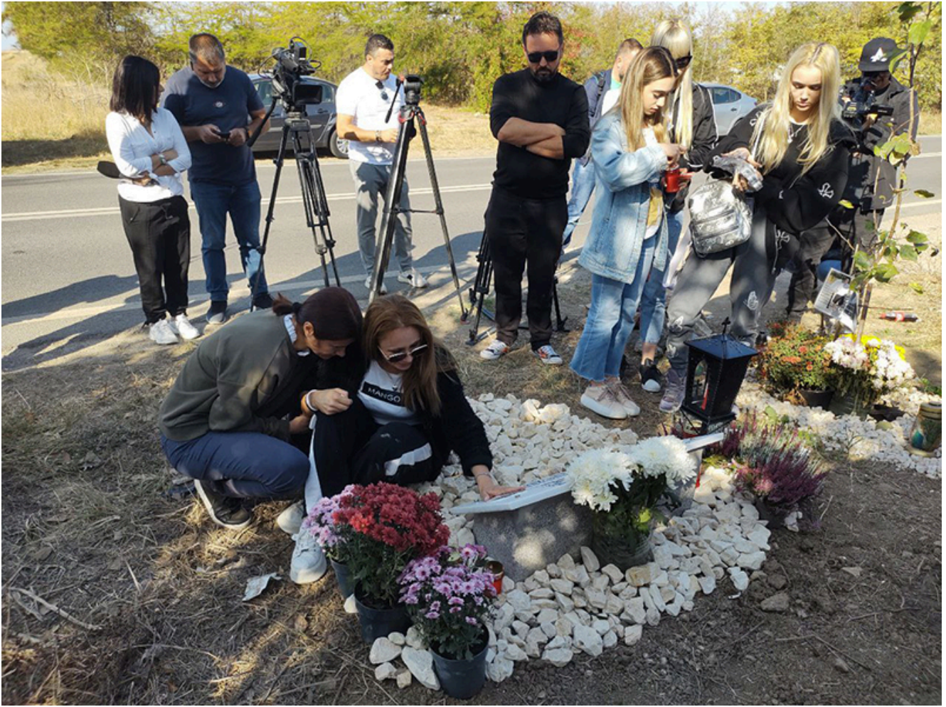
Placă comemorativă Sebi – 2 Mai