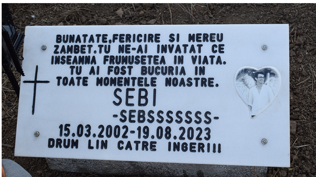
Placă comemorativă Sebi – 2 Mai

https://editiadesud.ro/wp-content/uploads/2023/10/video_2023-10-07_11-43-16.mp4